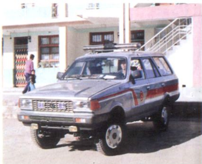
全省公路建设先进单位奖品车 (1991年2月)