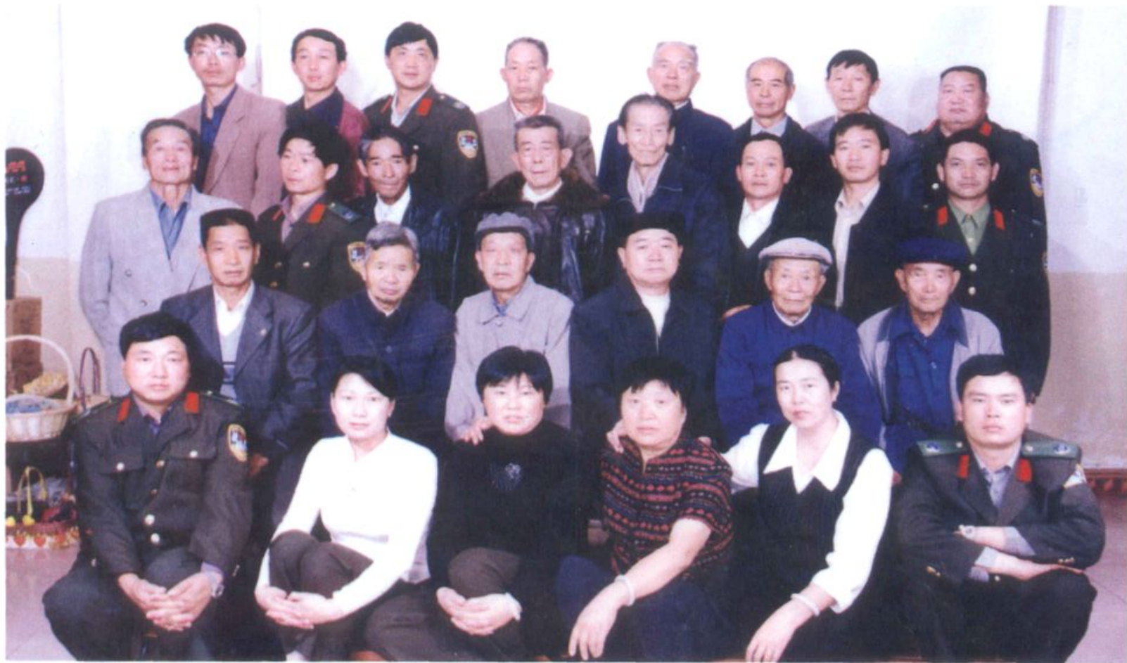
祥云县交通局局(所)全体职工留影