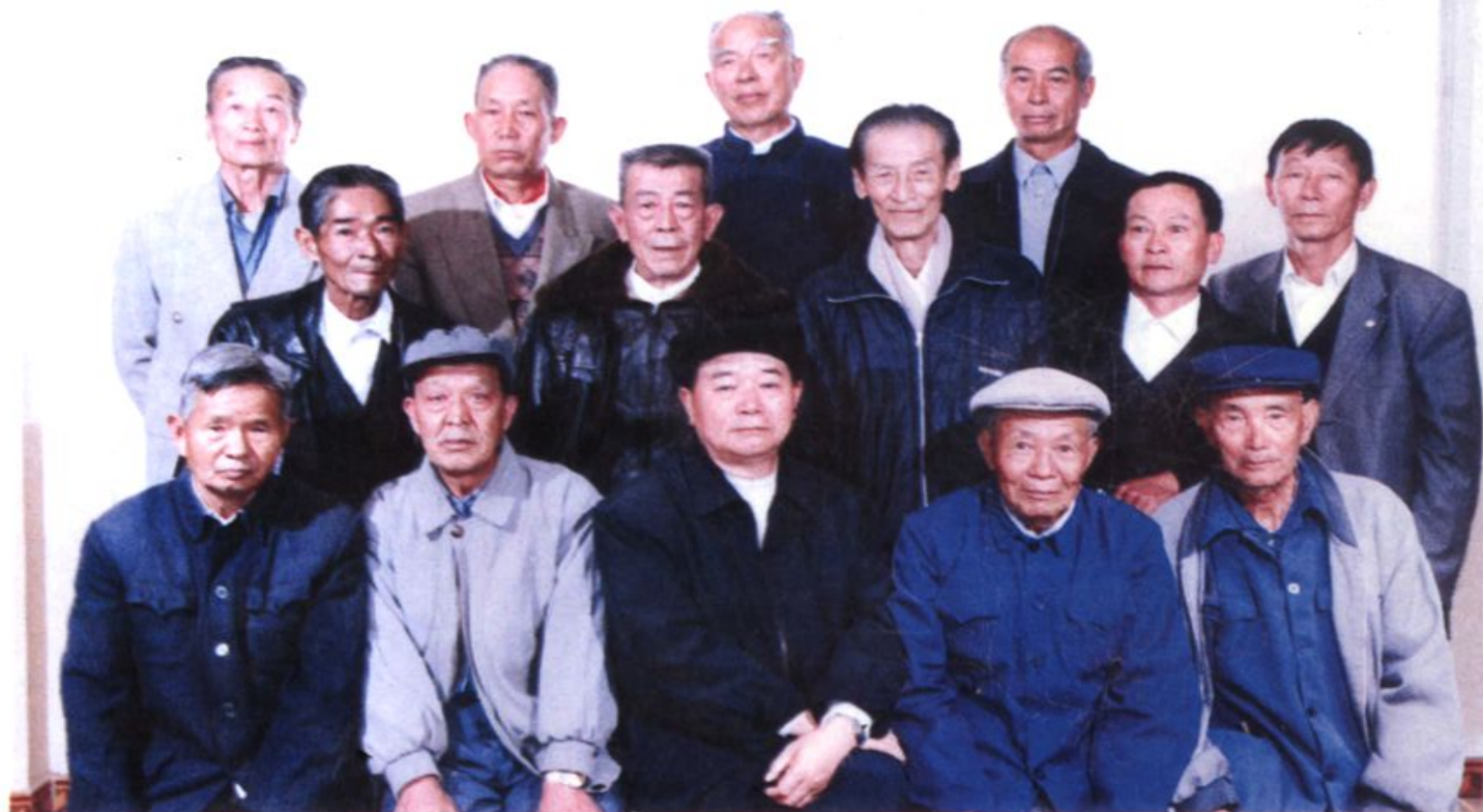
祥云县交通局离退休全体人员留影