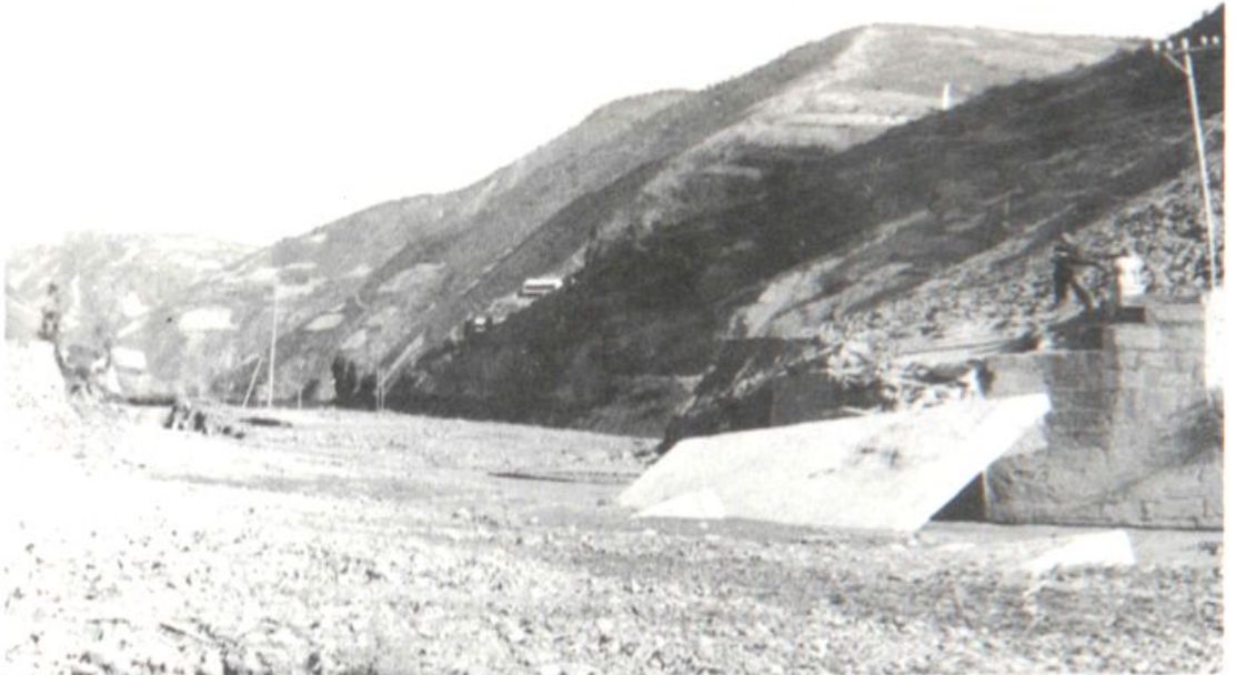
鹿鸣公路(1986年10月)大洪灾,玉龙老桥被毁