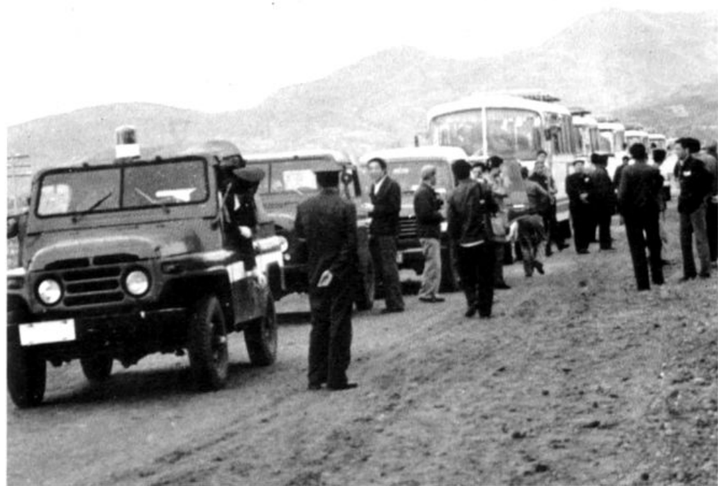
会议人员在板皇路参观时介绍工作