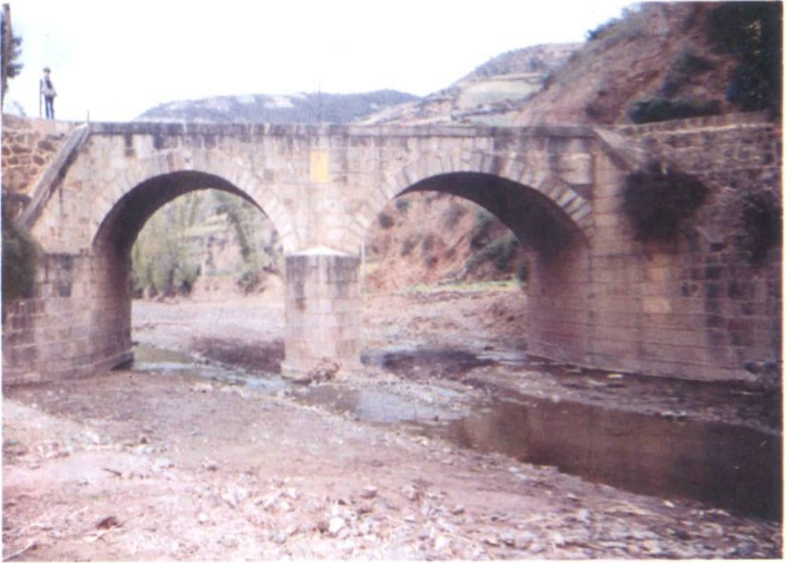
鹿鸣村前双孔桥(建于1967年4月)