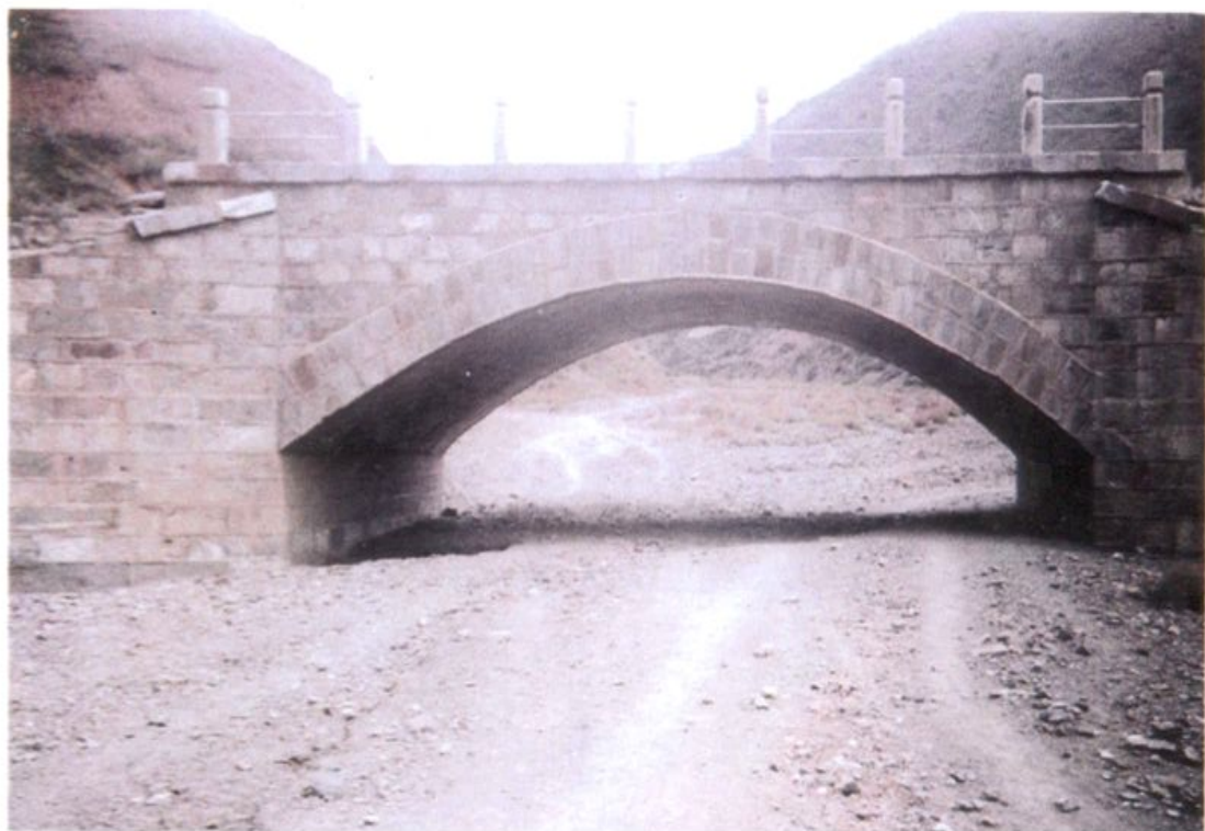
鹿鸣大坡脚干河箐桥(1986年7月竣工)