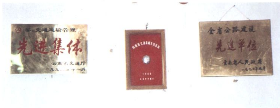
省政府奖小车及奖牌