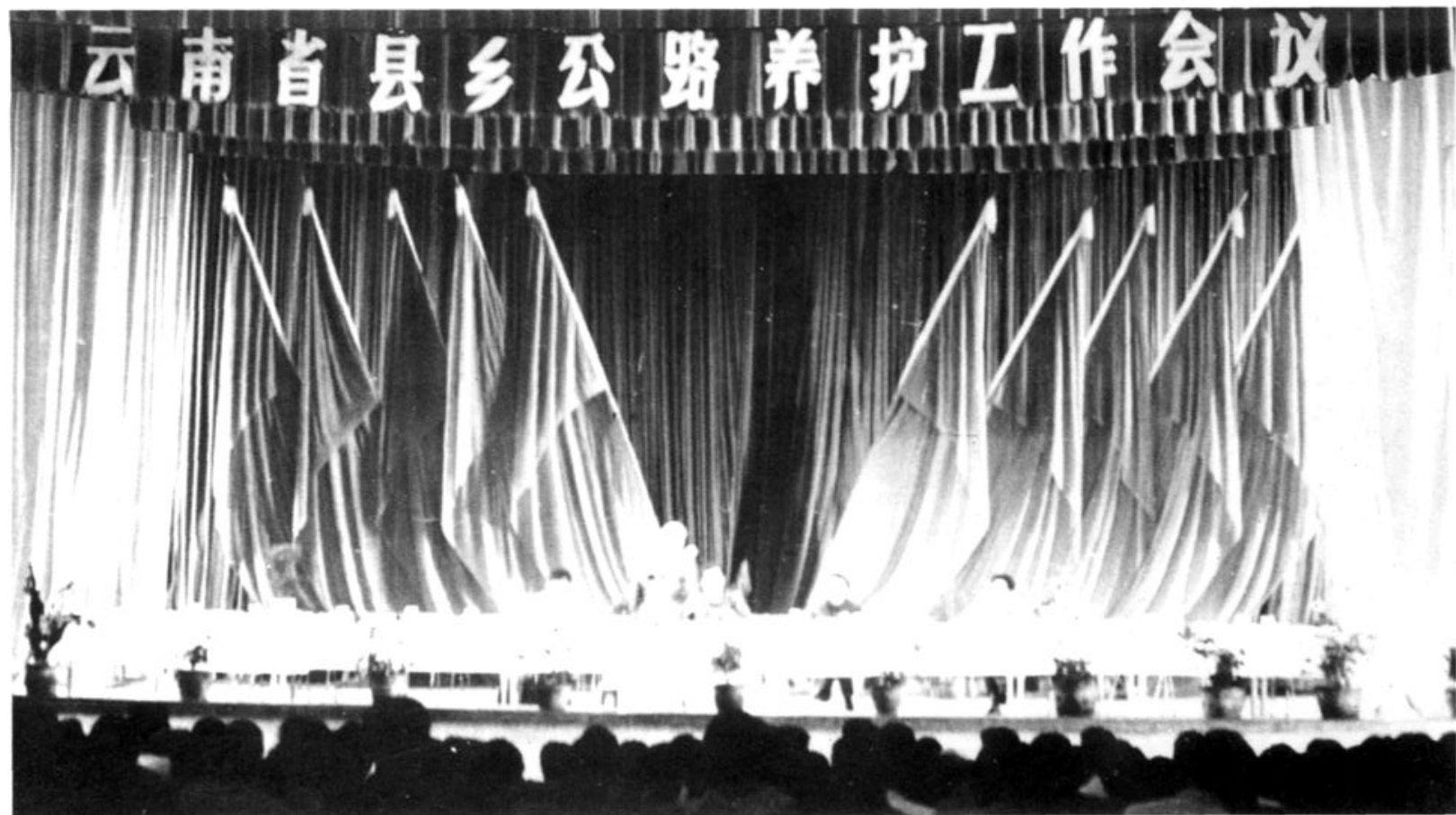
云南省县乡公路养护工作会议