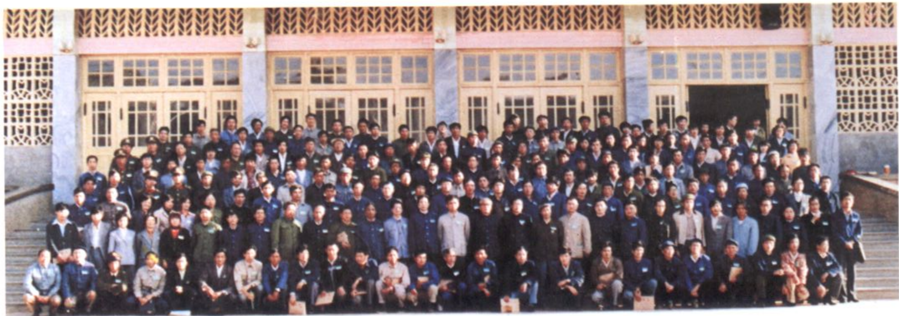
全省公路工作会议参会人员留影