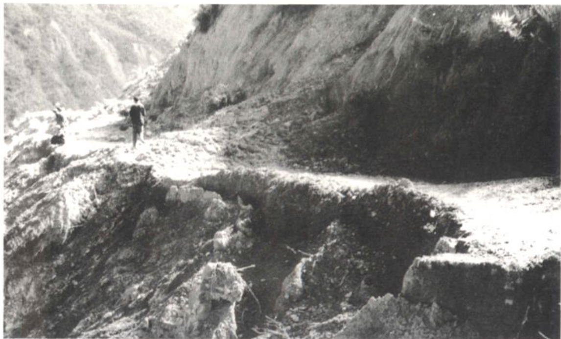
鹿鸣公路沿鹿鸣河岸 K12 附近路基冲毁下塌成锯齿形、最窄处路基 3.0M,路基边缘至河床底高 4.5M(1986 年 10 月)