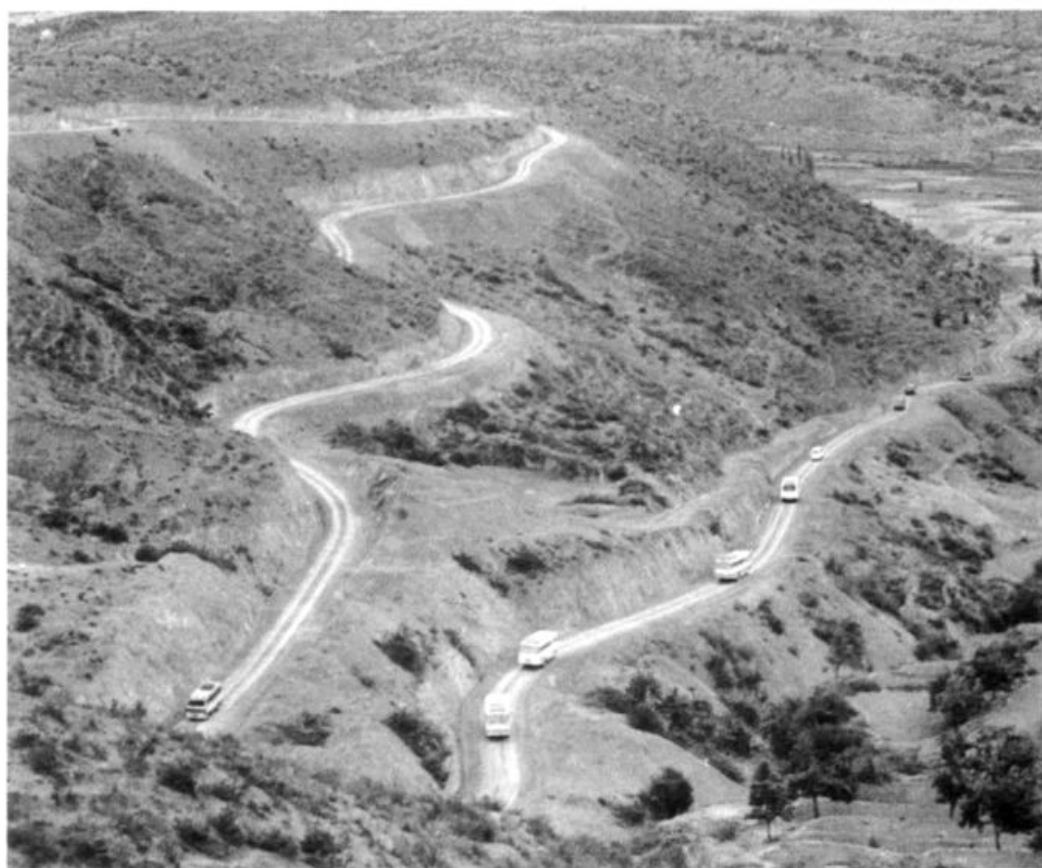
参观禾庄路龙头坡