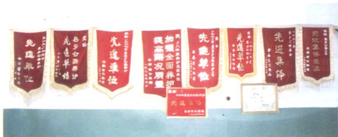
连续十年被省公路局评为先进县奖旗(1985~1994年)