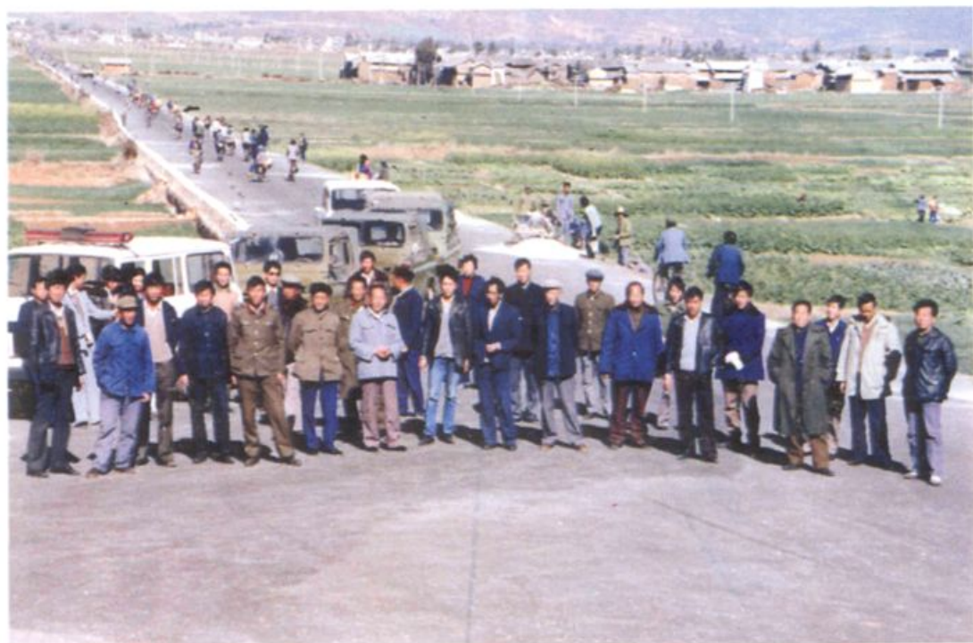
县领导及有关人员参加验收原八里路油路时留影