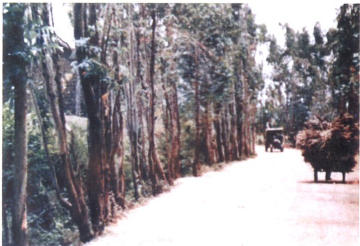
中国道路运输集锦(1993 年),绿树成荫的祥云县乡公路