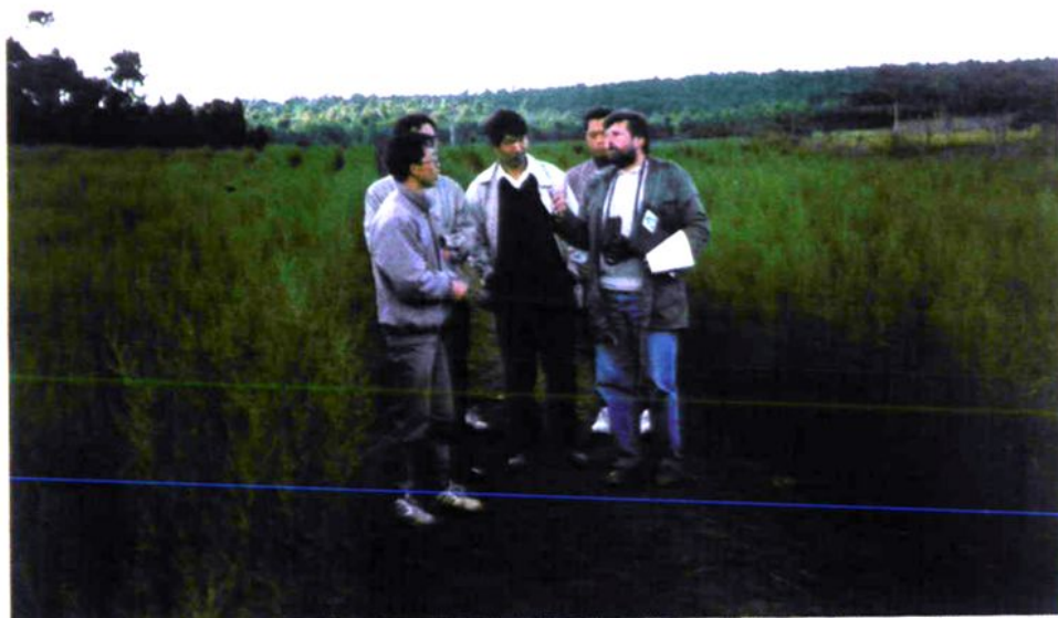
德国专家实地查看德援项目造林用苗