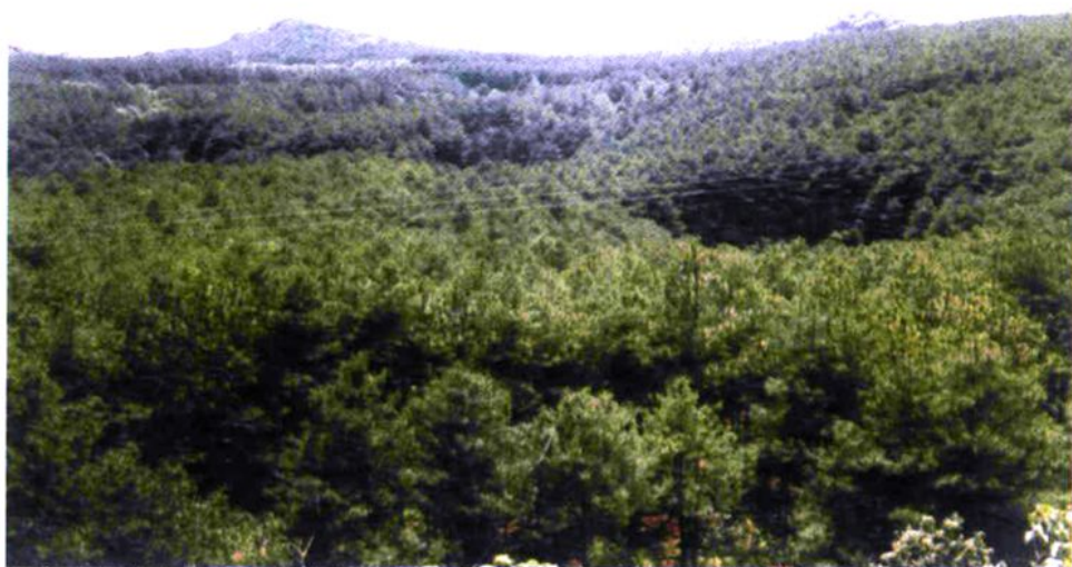
海寨林场人工林一角