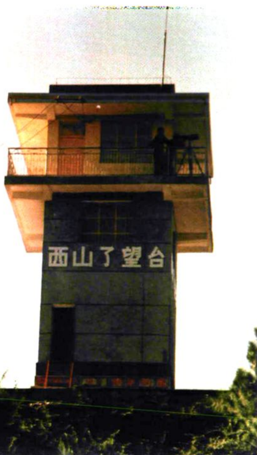
森林防火了望观察台