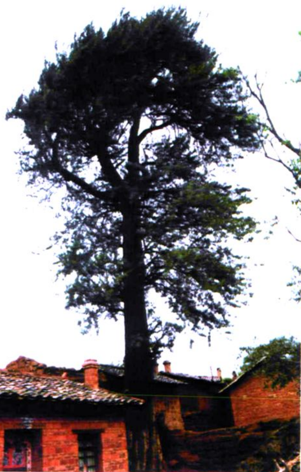
古树 — 银杏