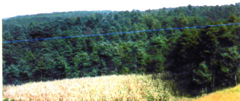
海寨林场人工林一角