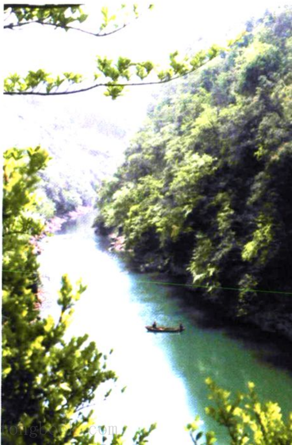
牛栏江岸山青水秀