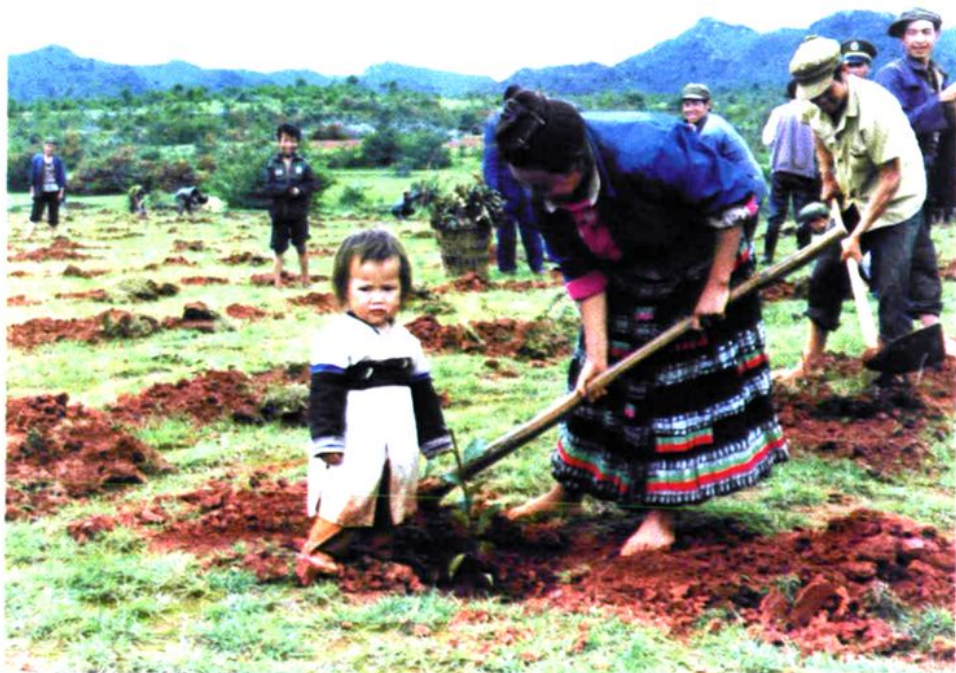
母子同植希望树 —— 群众性植树造林现场一角