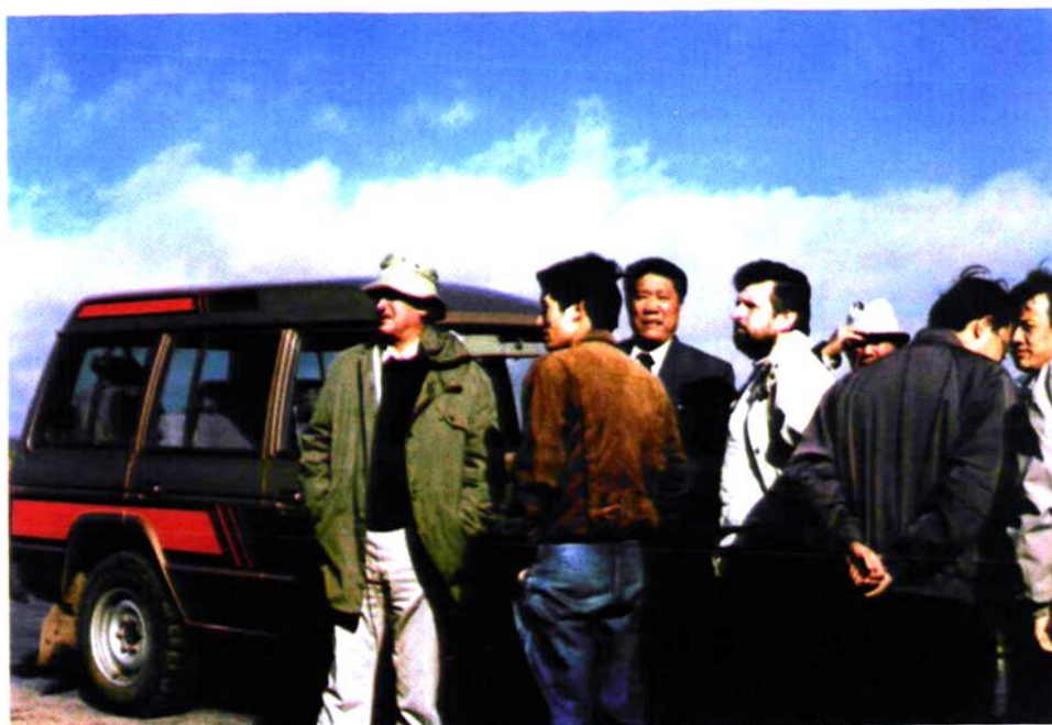
德国专家莅临我市考察德援造林项目