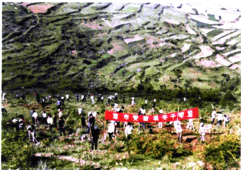
植树造林现场一角