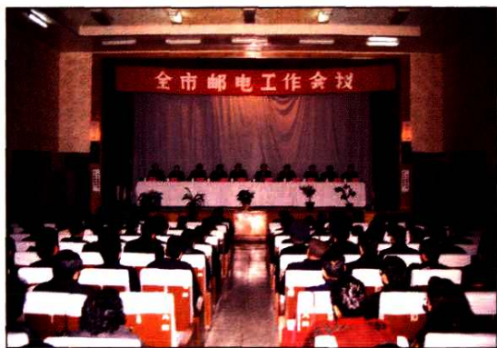
1991年3月10日至12日全市邮电工作会议，传达贯彻全国、全省邮电工作会议精神，确定威海邮电“八五”发展目标