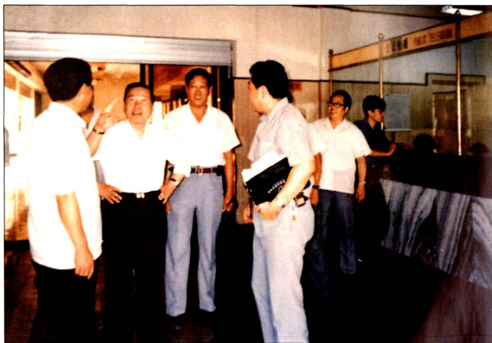
1991年9月6日邮电部部长杨泰芳（左二）视察威海邮电大楼营业厅