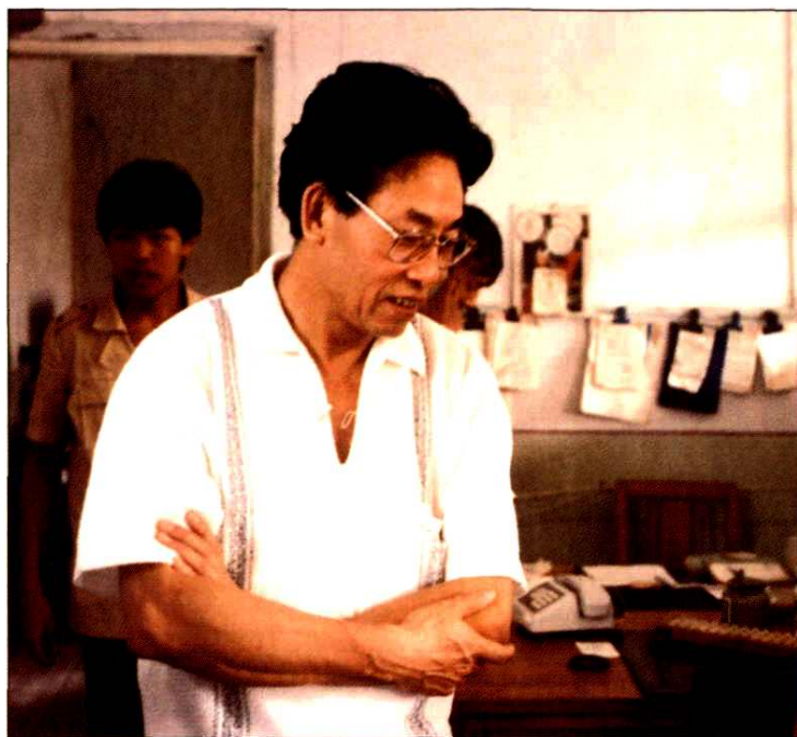
1991年9月7日邮电部副部长刘平源视察威海市邮电局邮政工作现场