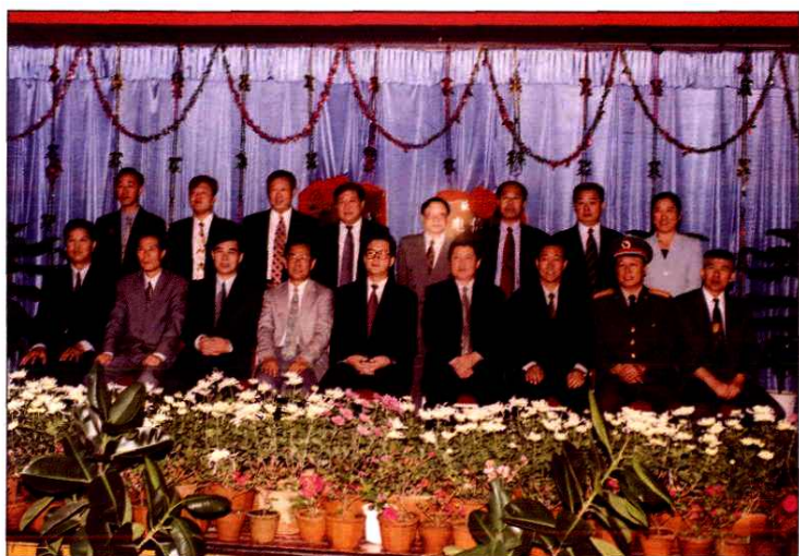
1998年10月18日威海邮政、电信分营时原威海市邮电局领导班子与省局、威海市莅临分营大会领导合影