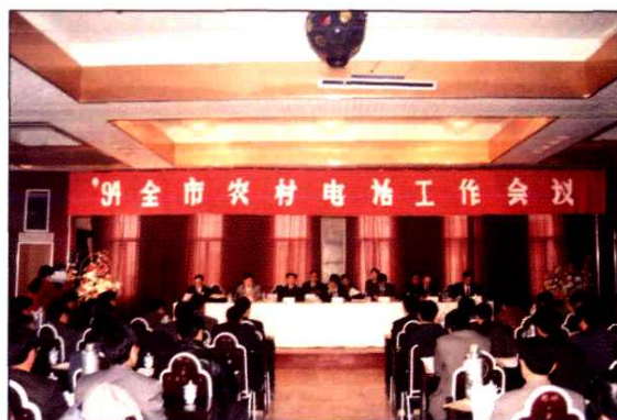
1994年3月11日至12日全市农村电话工作会议