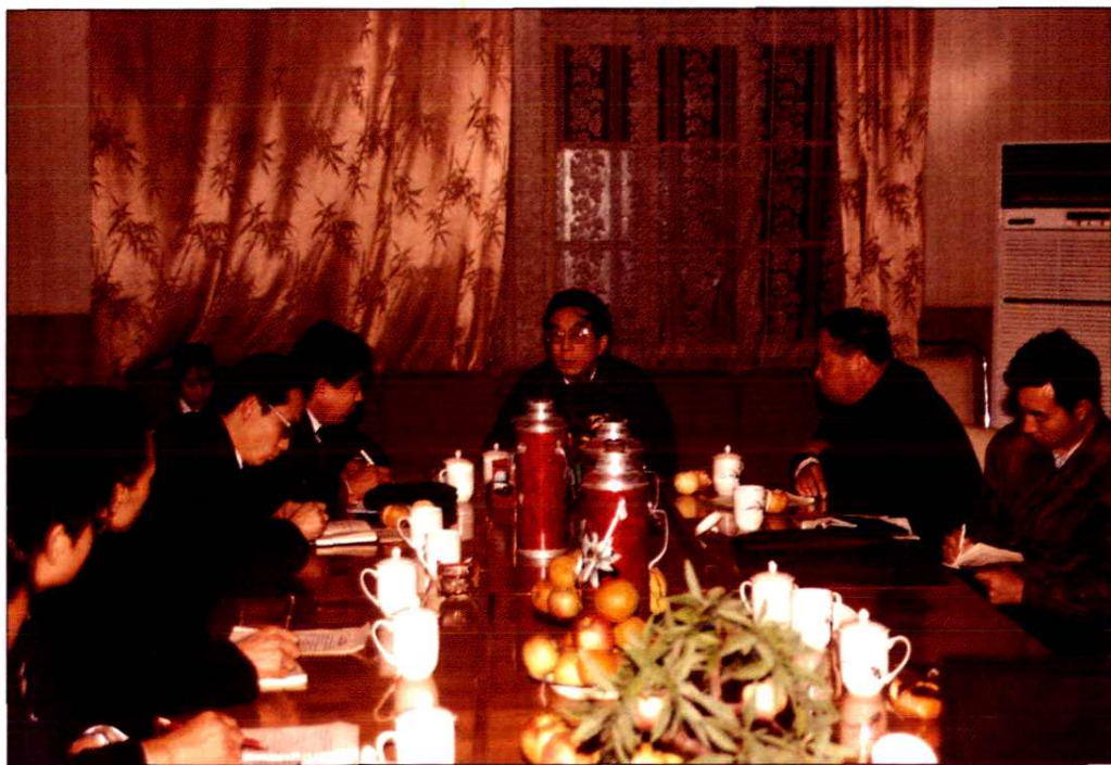
1990年12月2日邮电部副部长朱高峰（右三）在山东省邮电管理局局长郑万升（右二）陪同下视察威海市邮电局