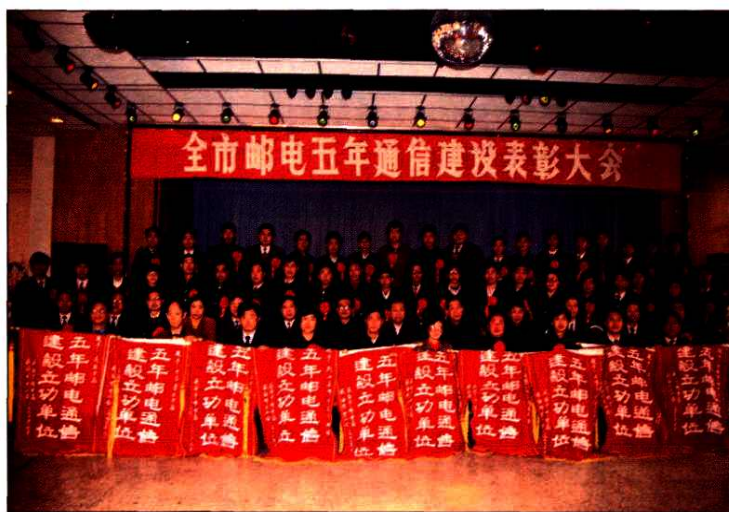
1993年1月8日全市邮电五年通信建设表彰大会