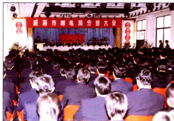
1998年10月18日威海市邮电局分营大会