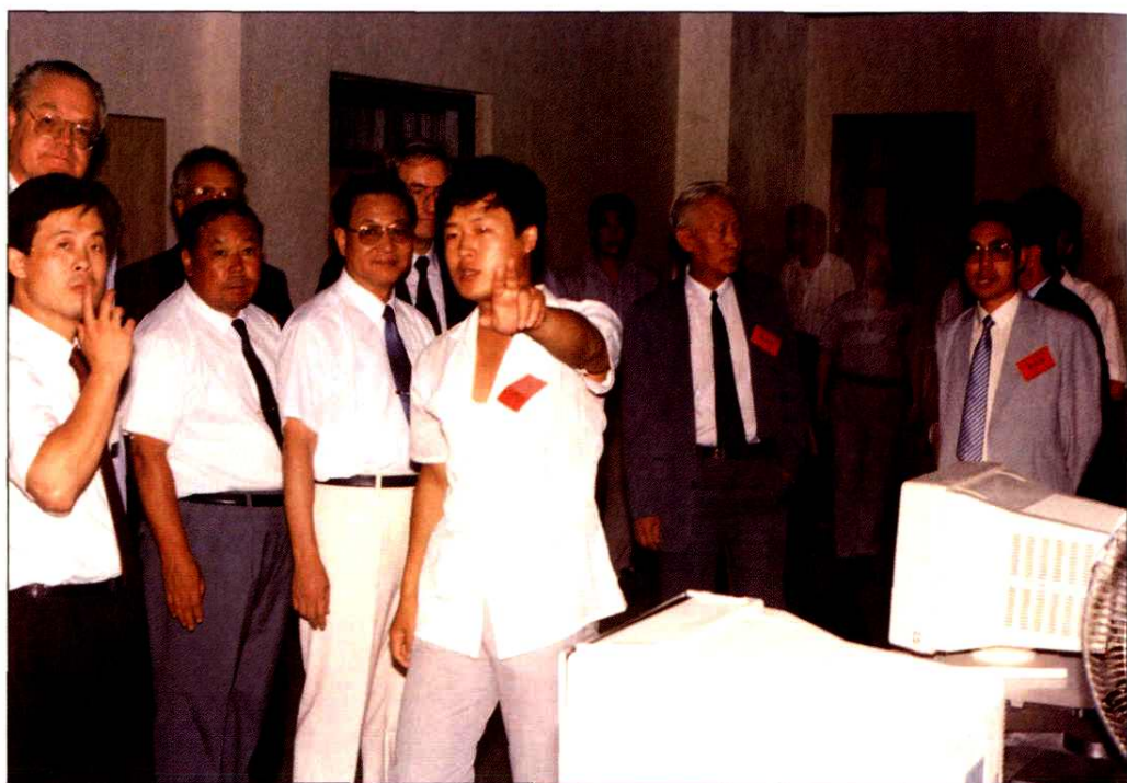
1993年7月26日中共山东省委书记赵志浩(前左三)在山东省邮电管理局局长郑万升(前左二)陪同下视察威海市邮电局程控机房