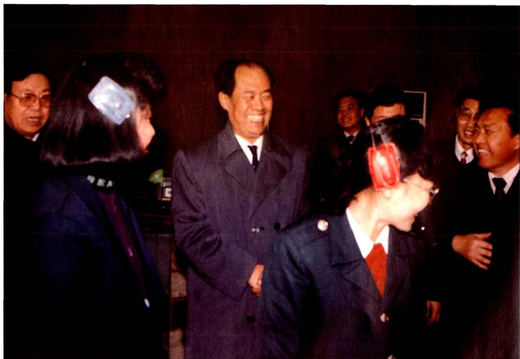
1991年春节中共威海市委书记李文全(中)看望威海市邮电局节日值班职工