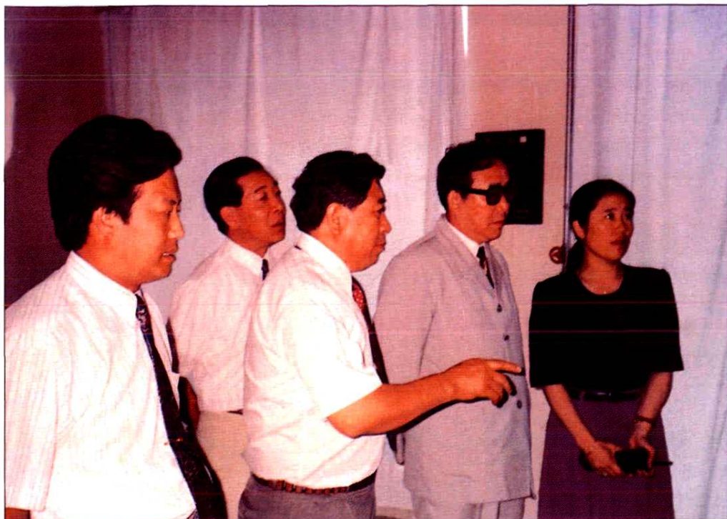
1993年7月25日邮电部部长吴基传（右二）视察威海邮电大楼程控机房