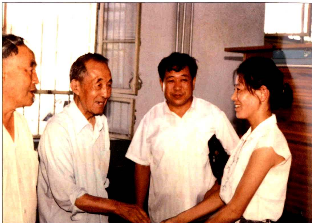
1990年8月11日中顾委委员、邮电部原部长文敏生（左二）视察威海市邮电局