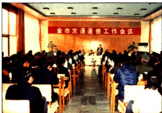
1988年12月13日至15日全市交通通信工作会议。会议讨论通过了《威海市发展邮电通信事业的若干规定》