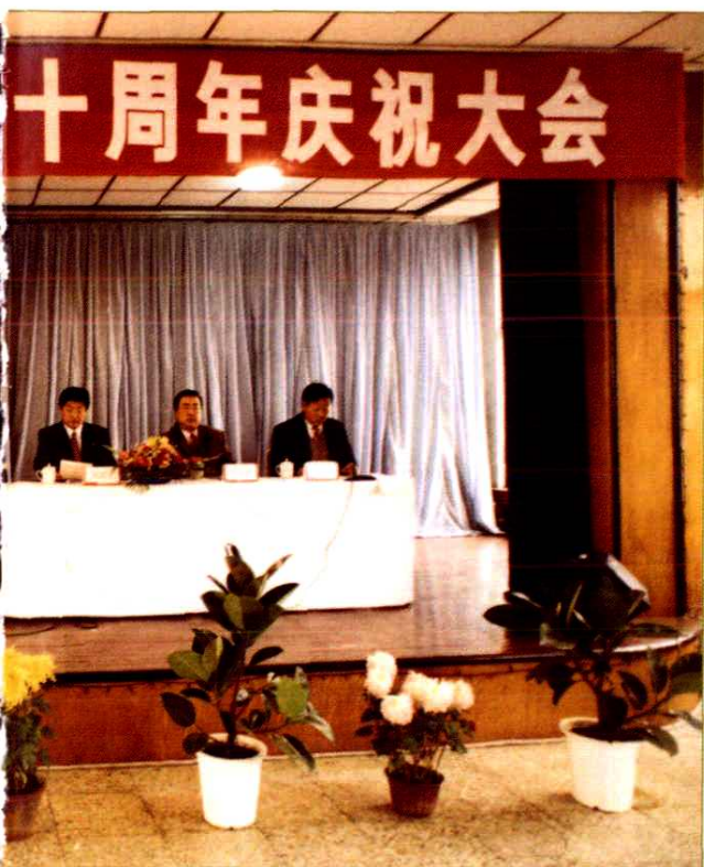
1997年11月28日地级威海市邮电局成立十周年庆祝大会