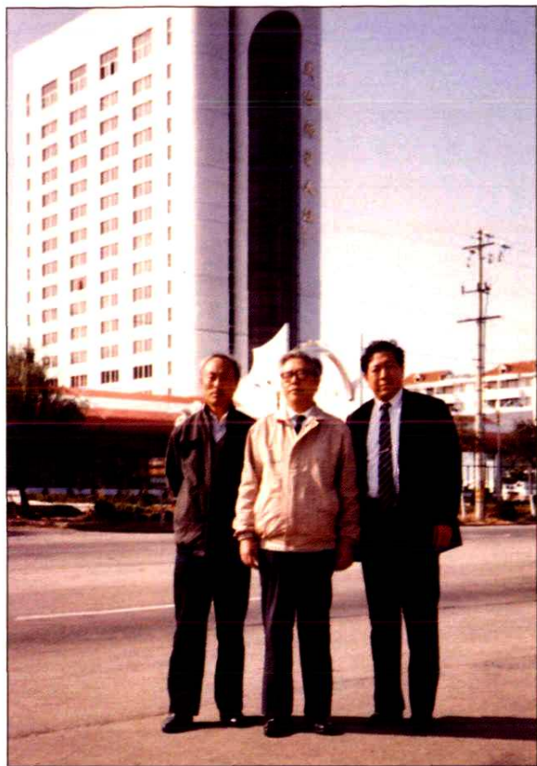
1991年10月26日邮电部副部长宋直元（中）在山东省邮电管理局副局长胡立成（左）陪同下视察威海邮电大楼后与威海市邮电局局长刘玉泉在大楼前合影