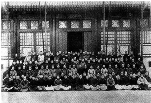
◎1903年京师大学堂师生欢送出国留学同学合影

师范馆开设的课程，是在普通学科的基础上增加教育门类的课程，从一年级到四年级学习的教育类课程门目如下——伦理：中国名人言行、外国名人言行、历代学案、本朝圣训（以周知实践为主）、修身之次序方法；经学：主要是经学家家法；教育学：主要包括教育宗旨、教育之原理、学校管理法、教育实习；习字：学习楷书、行书、篆书、草书以及教授习字之次序方法；作文：作纪事文，作论理文，学章奏、传记、辞赋、诗歌，文体流别；算学：加减乘除、分数、比例、开方，账簿用法、算表成式、几何面积、比例，代数、方程、立体几何，级数、对数、教授算学及几何之次序方法；中外史学：本国史典章制度，外国上世史、中世史，外国近世史，史学教授次序方法；中外舆地：全球大势，本国各境，外国各境，地文地质学，仿绘地图，地理教授次序方法；博物：动植物之形状及构造，生理学，矿物学；物理：力学，声学，热学，电气，磁气，物理教授次序方法；化学：考质，求数，无机化学，有机化学；外国文：音义，句法，文法；图画：就实物模型授毛笔画，就实物模型、贴谱手本授毛笔画，用器画大要，图画教授次序方法；体操：器具操，兵式，体操教授次序方法。 ②