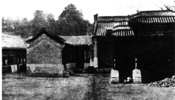
◎清末京师大学堂校舍

馆在北京景山东马神庙（旧称四公主府）正式开学。京师大学堂师范馆的创立，使中国的师范教育从初级师范、中等师范到高等师范形成了完整的体系。12月17日，成为后来的北京（北平）师范大学