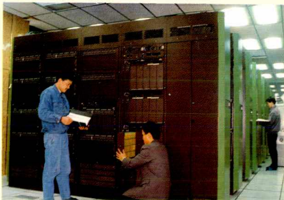
程控机房工作人员正在进行维护工作