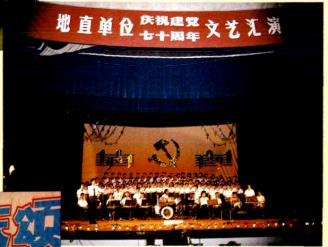
邮电职工参加地直单位举办的纪念建党七十周年文艺汇演“百人大合唱”