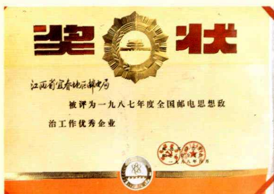
全国邮电思想政治工作优秀企业