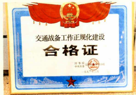
交通战备工作正规化建设合格证