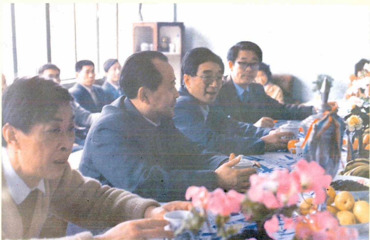
1989年4月7日,邮电部副部长朱高峰(右二)、省局党组书记刘兆存(右三)与地委秘书长余达瑞(左一)、地区行署副专员曹凤玺(右一)听取宜春邮电发展规划汇报