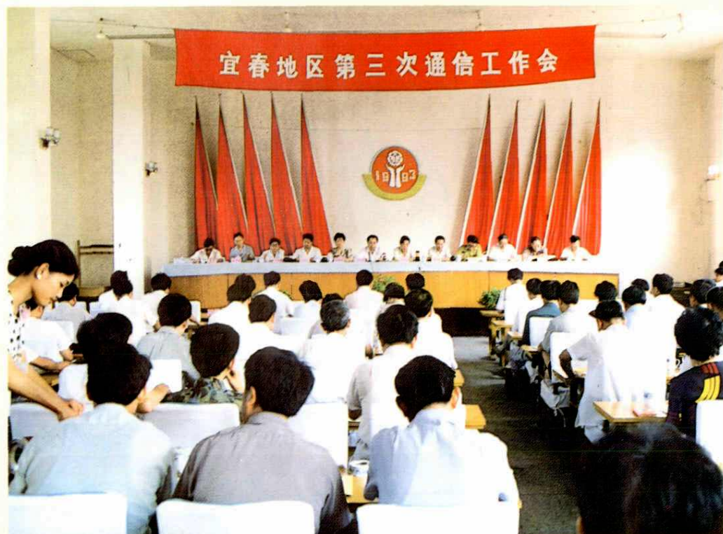
1993年宜春地区行署召开全区第三次通信工作会议