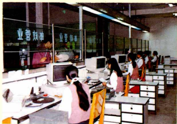
邮政营业窗口实现电子化