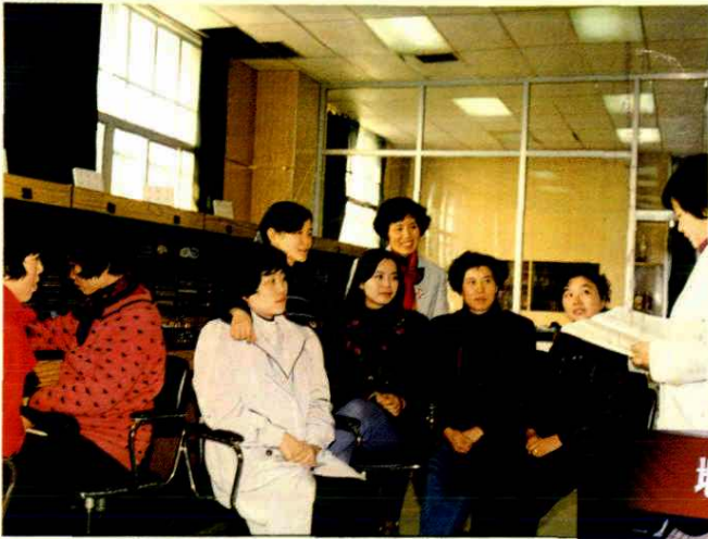
思想政治工作教育新途径，长途话务班开展“班前五分钟”教育。