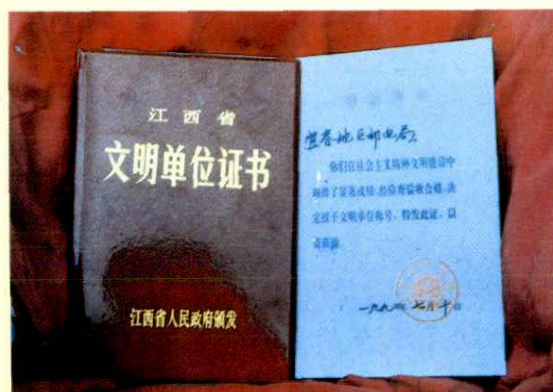
江西省文明单位证书