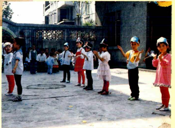
幼儿园小朋友欢庆“六一”儿童节