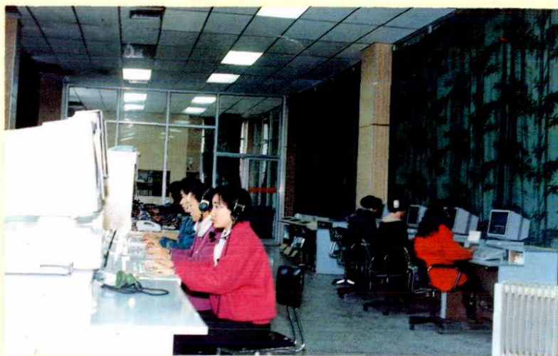
续电话 长途台工作人员接