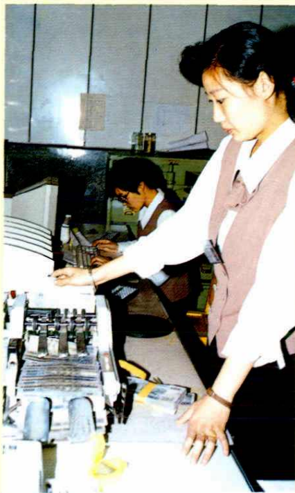
邮政储蓄应用微机管理