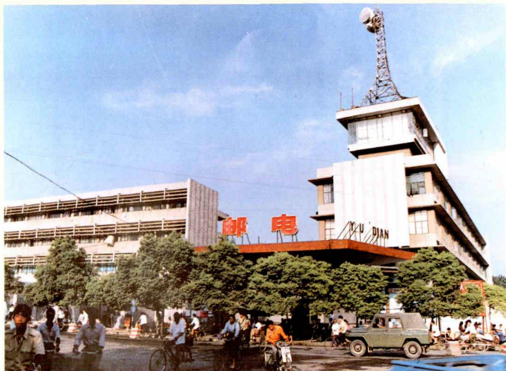
宜春地区邮电局邮电综合大楼