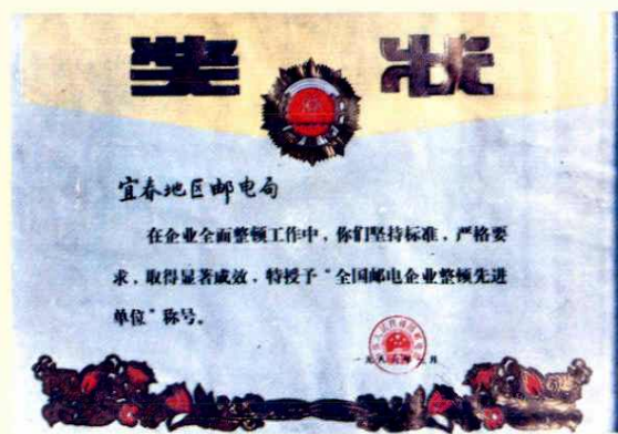
全国邮电企业整顿先进单位