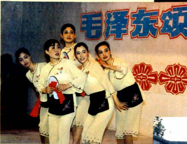
纪念毛泽东同志诞辰一百周年文艺晚会《十送红军》