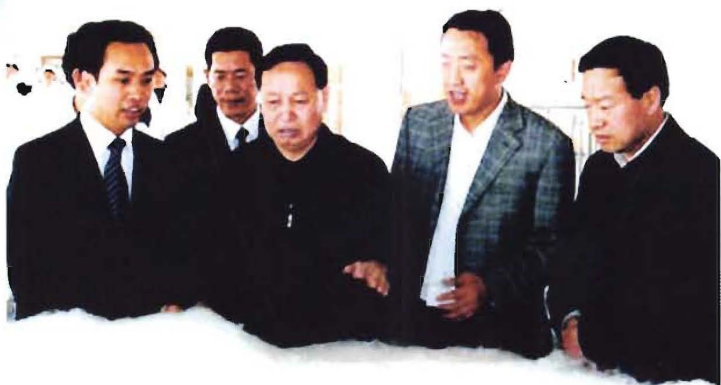
2004年3月，湖北省省长罗清泉（左三）来英山县视察