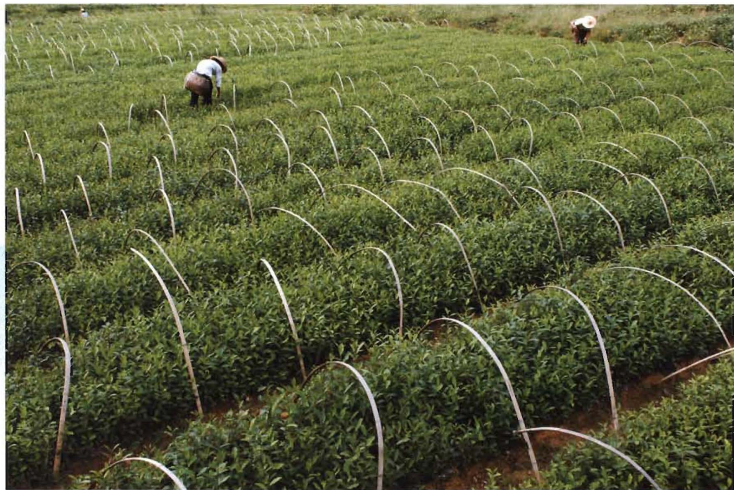
无性系茶叶繁苗基地