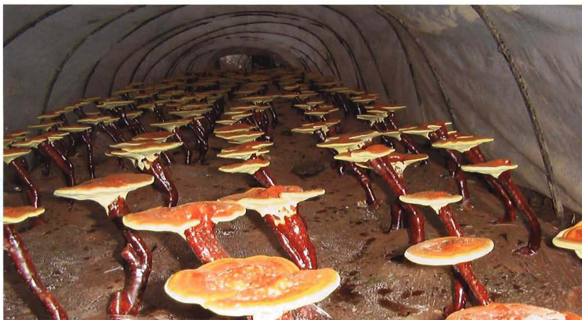
杨柳湾镇王家界村人工繁育灵芝基地