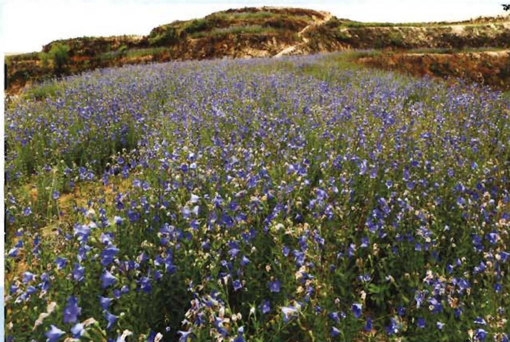
英山县雷家店镇天花坪 桔梗种植基地