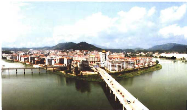
县城南毕昇大桥1996年9月 动工，1998年10月竣工通车