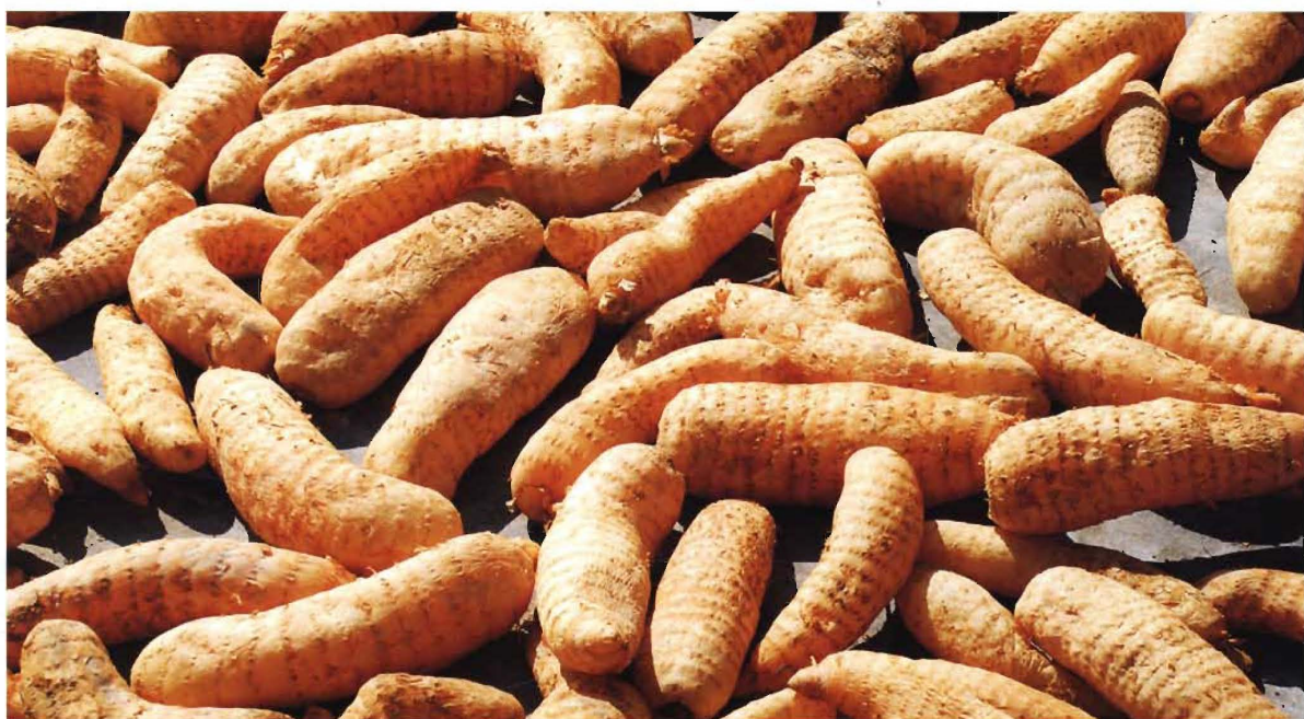
由野生变家生的天麻