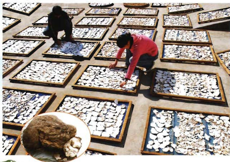
经过加工的茯苓片