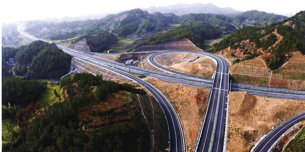
武英高速公路英山段出口处