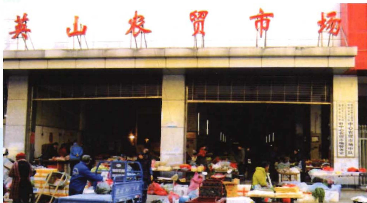
英山县温泉镇农贸市场