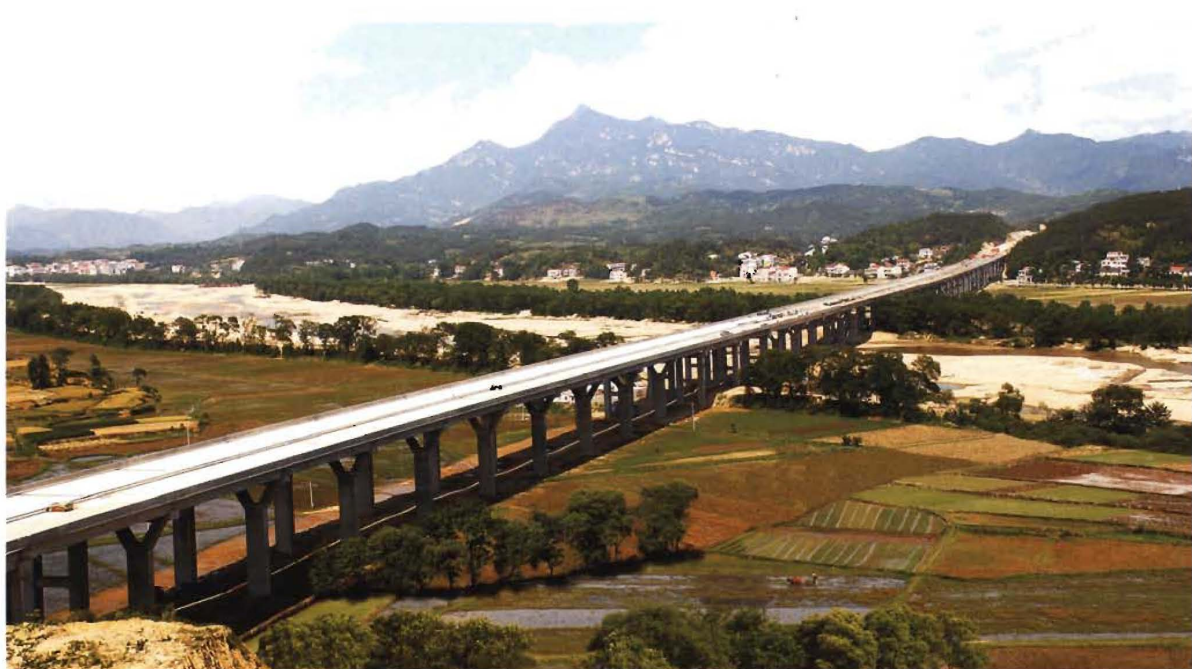
武英高速公路英山段杨柳湾高架桥