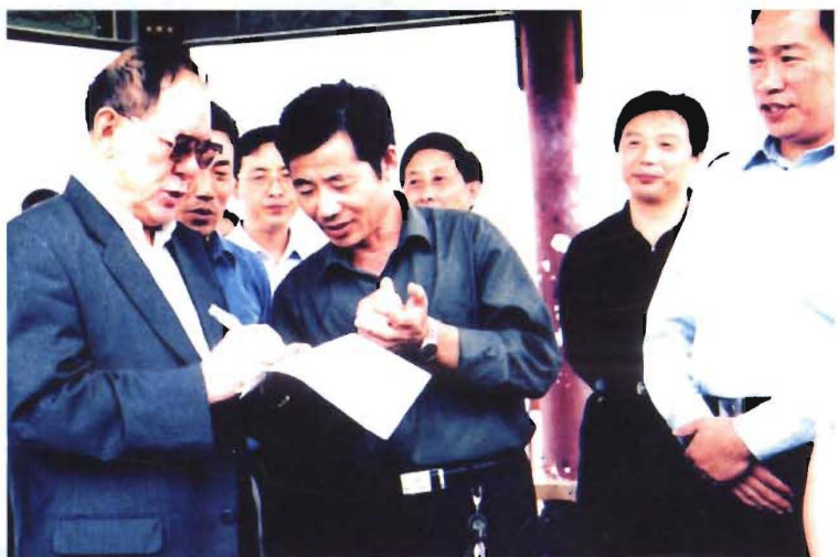
2000年10月，国务委员、国家科委主任宋健（左一）视察乌云山茶叶公园