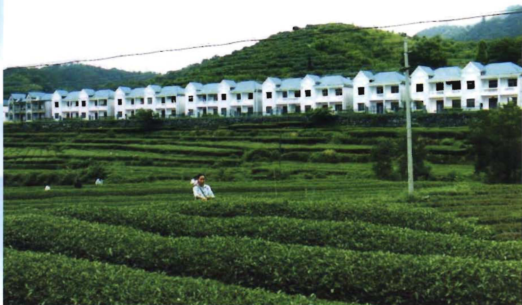
东冲河村高效生态茶叶基地