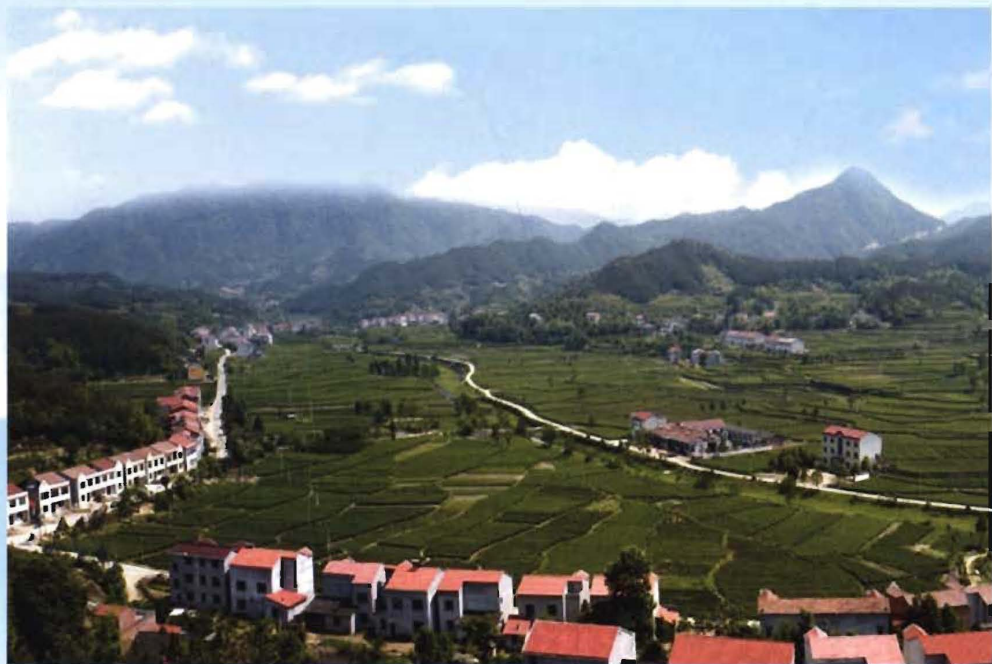
杨柳湾镇河南畎村茶叶基地