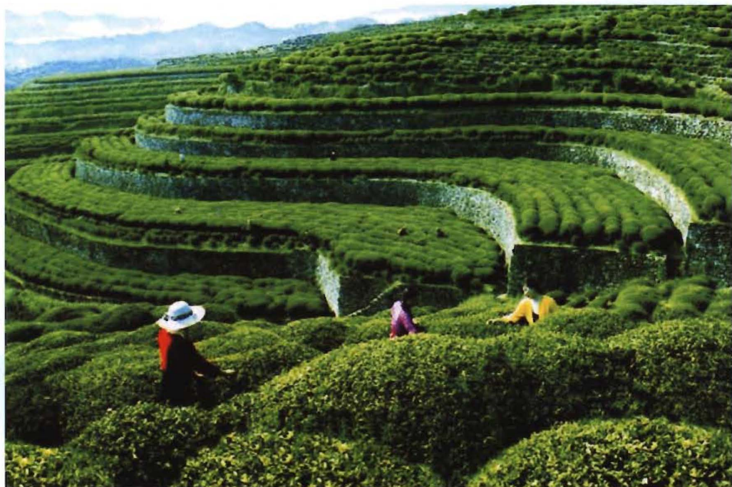
英山县长冲万亩茶园