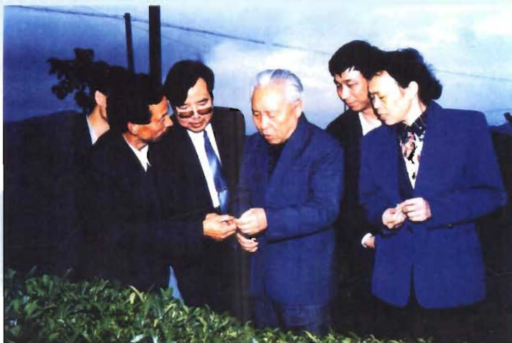
1998年5月，全国政协副主席杨汝岱（中）视察乌云山茶叶公园，省政协副主席丁凤英、县委书记熊承家、县长聂利军陪同