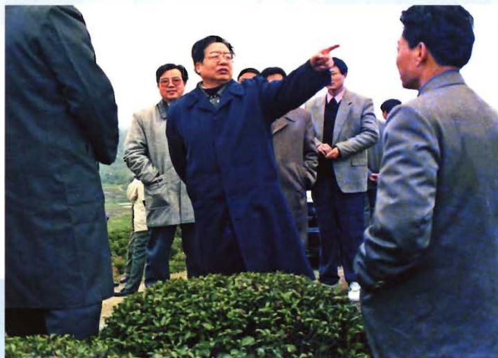
1996年12月18日，湖北省省长蒋祝平（中）视察英山长冲茶场