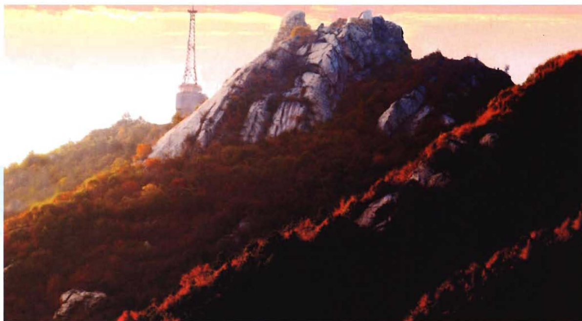
英山羊角尖电视差转站