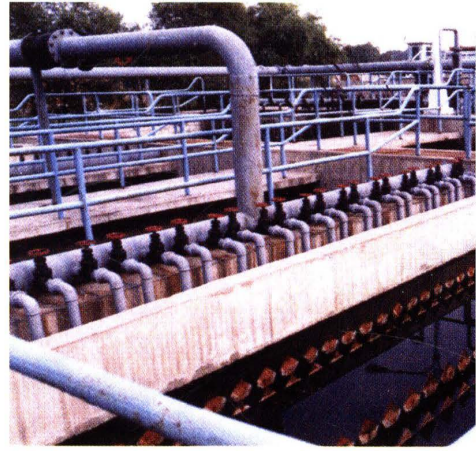
北郊污水净化厂初沉池