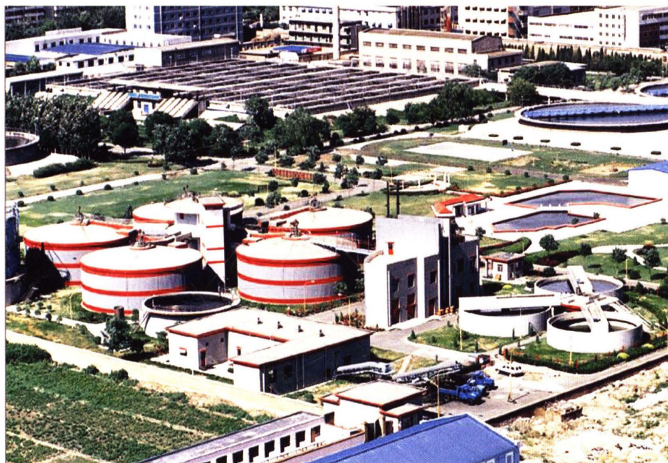
杨家堡污水净化厂全景