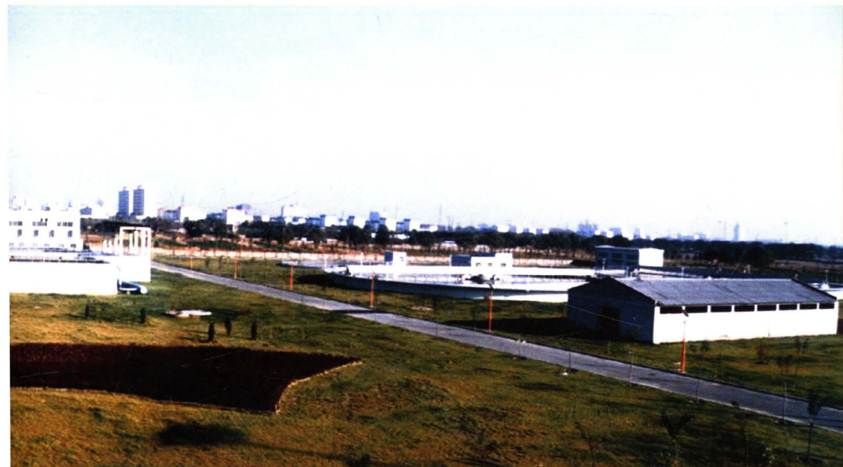
河西北中部污水净化厂全景