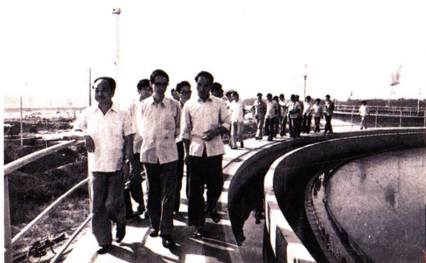
1987年国家城乡建设部部长 叶如棠视察杨家堡污水净化厂