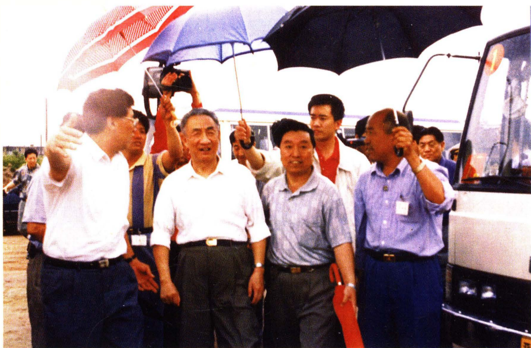
1996年国务院副总理邹家华视察迎泽西大街工程