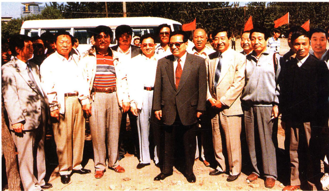
1997年全国人大常委会委员长乔石视察一桥两路工程