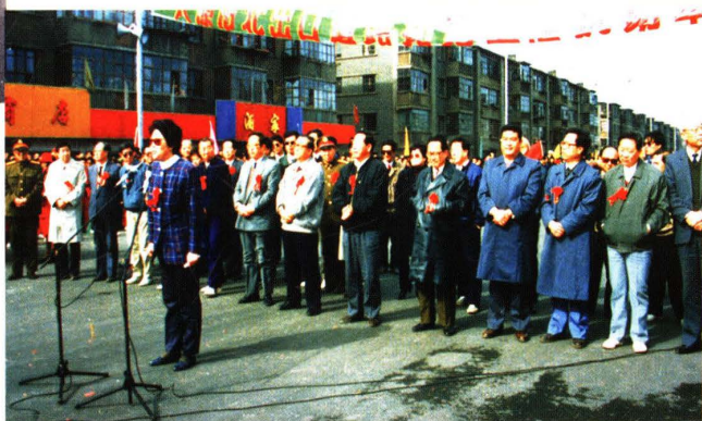
1993年省长胡富国等省市领导参加 南北出口拓宽改造工程通车仪式