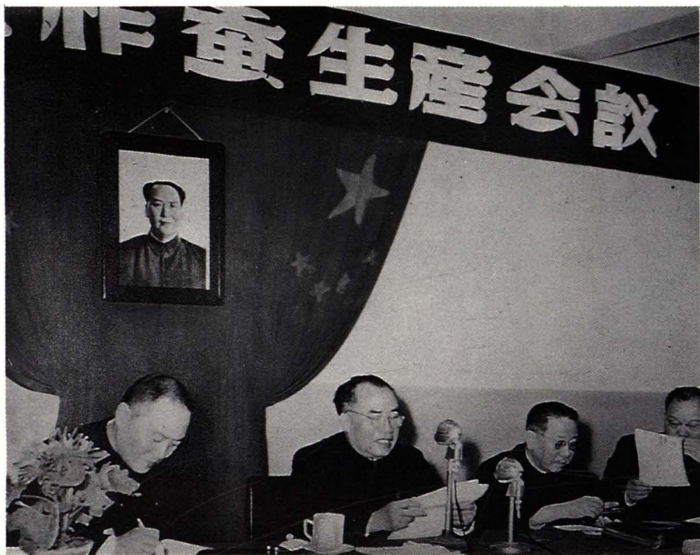
朱德委員長1955年1月在全國桑、柞蚕生產會議上講話