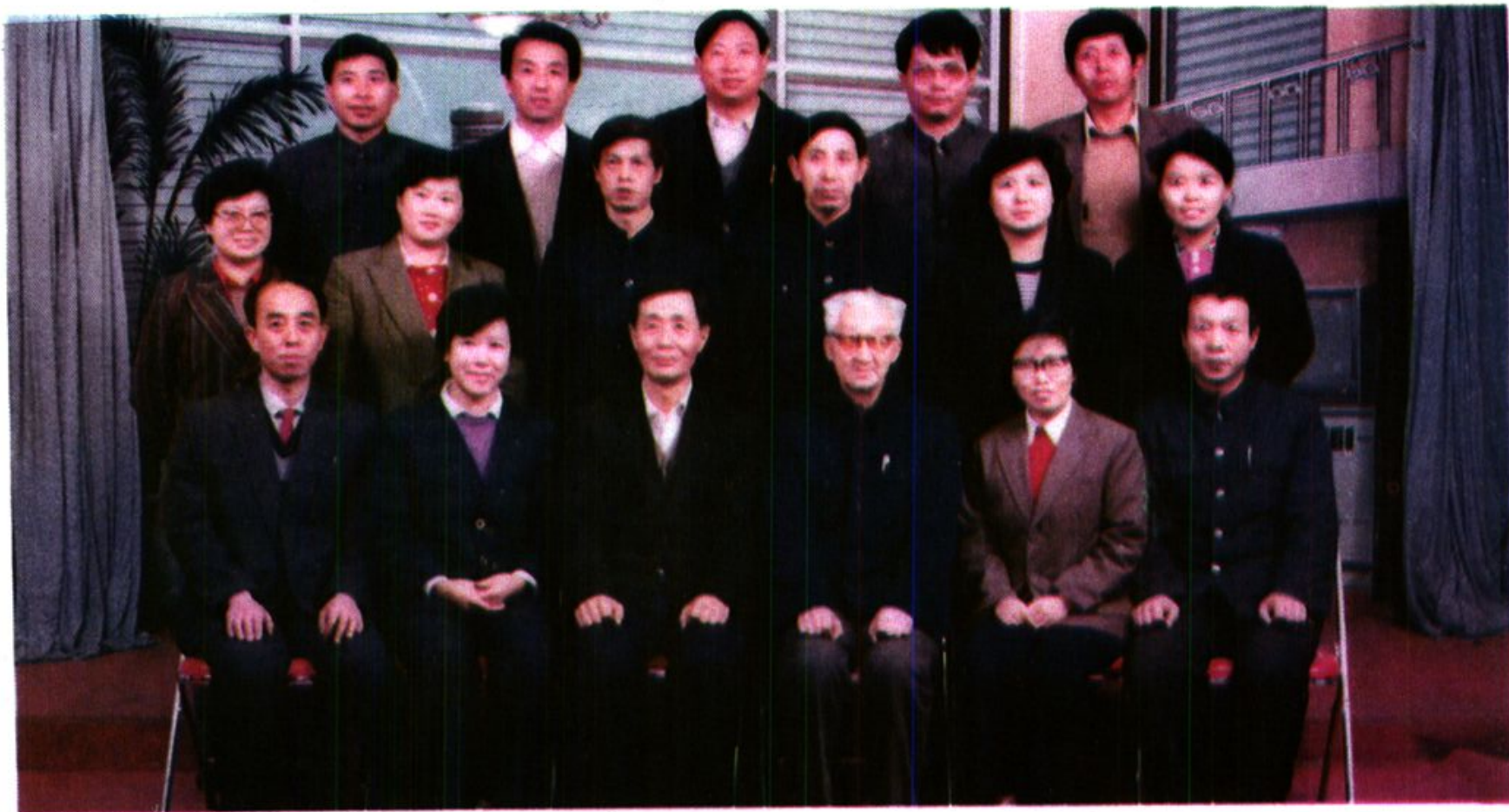
中共张家口市委财经贸易工作委员会全体工作人员合影（1990年10月30日）