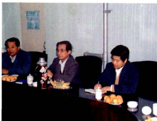
宋法棠同志来院调查研究,听取工作 汇报。(1991年11月)