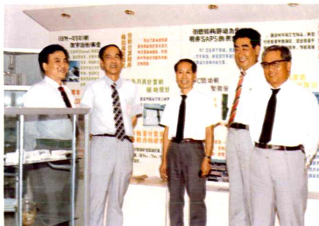
1990年，院领导同志在一起。