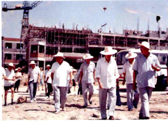
离退休干部参观建设中的饲料酵母厂。(1993年8月)