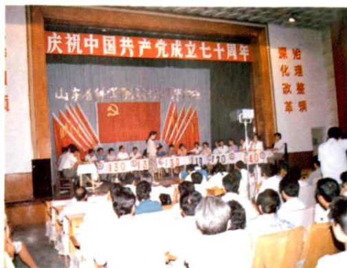
1991年7月，举办党的“三基”知识竞赛。