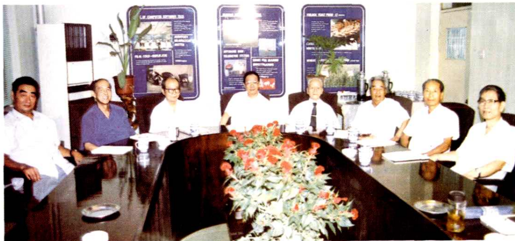
历届院主要领导在一起。(1994年9月)