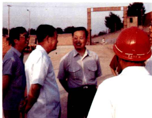
陈建国同志到院高新技术产业工地检 查工程进展情况。(1993年6月)