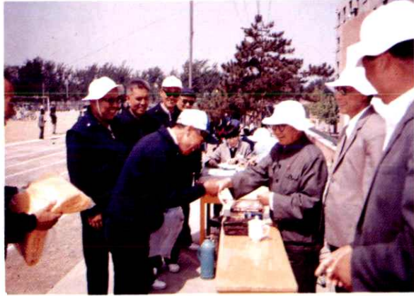
离退休干部在第二届运动会领奖台上。(1989年10月)