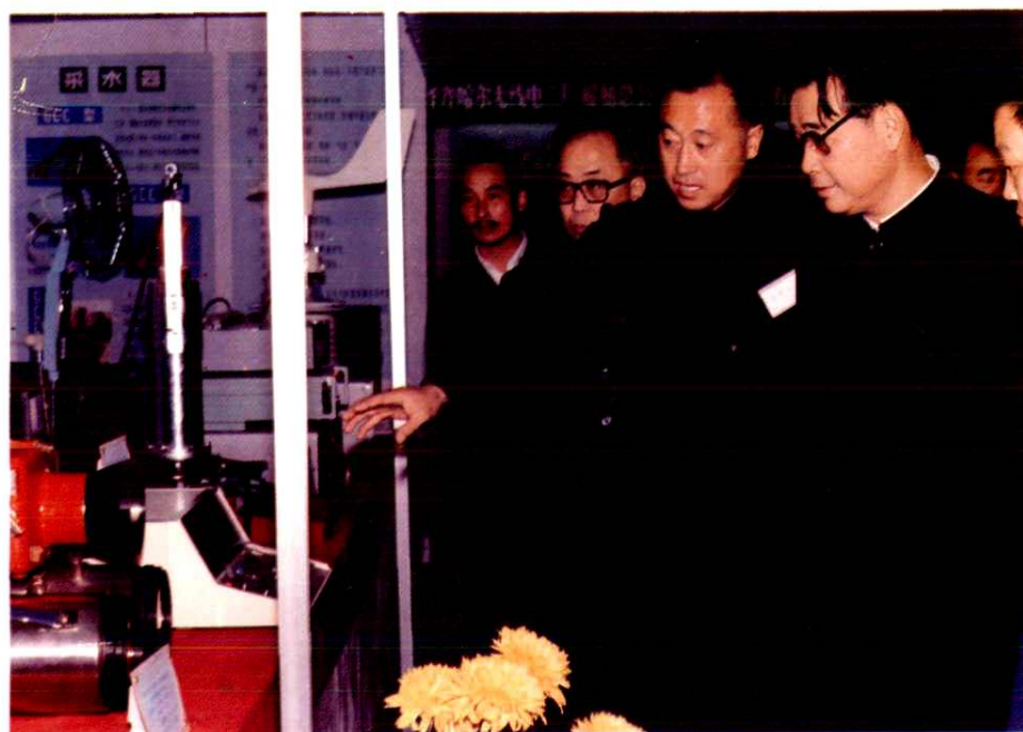
在“全国江河湖海仪器交易会”上,李鹏同志参观山东省科学院海洋仪器仪表所展品。(1984年)