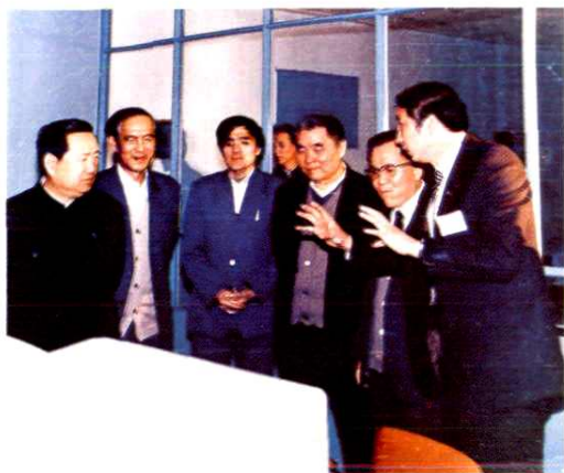
姜春云同志来院视察工作时,听取科研人员的汇报。(1988年4月)