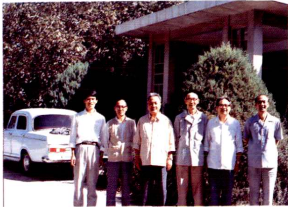
山东省科学院部分高评委成员合影。(1990年9月)