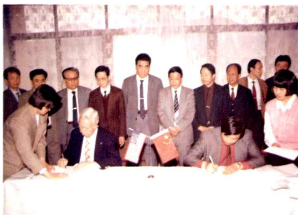
山东省科学院与美国新纳克斯公司签定建立合资公司的协议。(1992年3月)