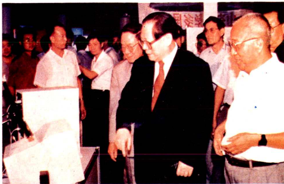
江泽民同志在“中国火炬计划成果暨高新技术展交会”上观看山东省科学院大中计算机公司研制的多媒体屏幕演示。(1993年8月)