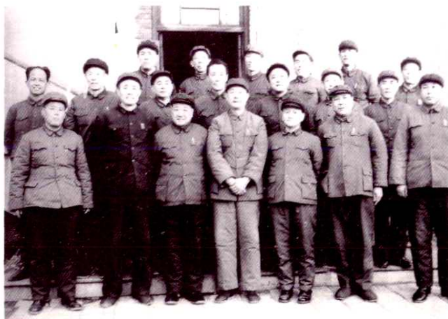
1979年，院领导和部分机关干部在一起。