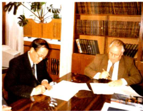
朱关兴同志访问乌克兰敖德萨理工学院。(1992年9月)