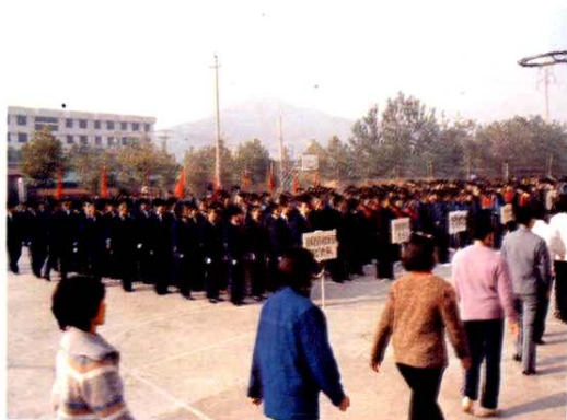
1989年5月，举行第二届田径运动会。