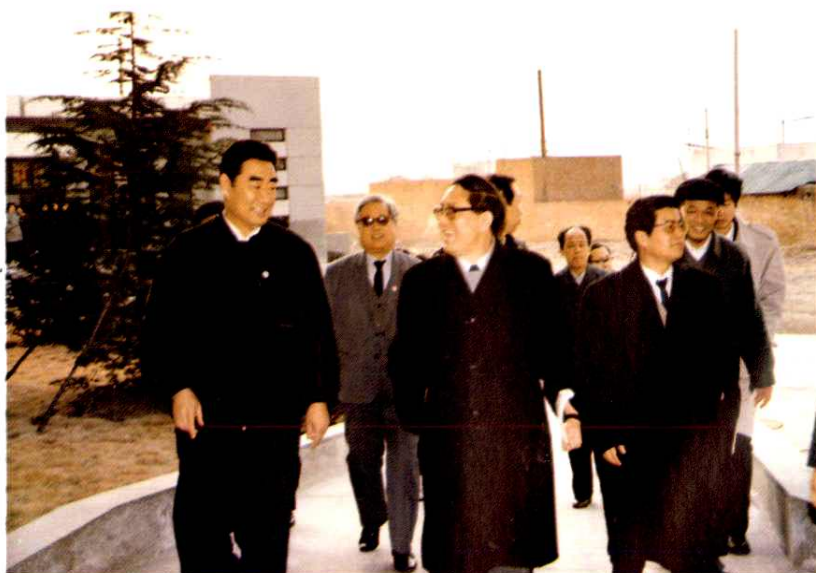
宋健同志来院视察工作。(1991年3月)