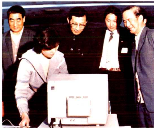
陆懋曾同志观看院科技人员的计算机技术演示。(1988年4月)