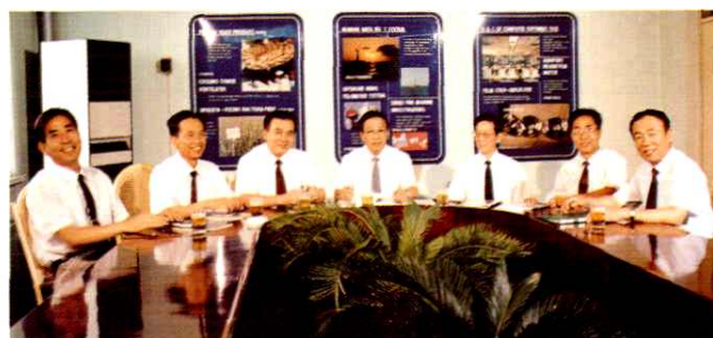
1993年，院领导同志在一起。