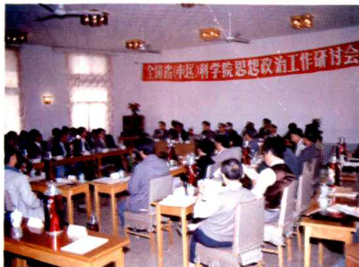
1990年5月，“全国省(市、区)科学院思想政治工作研讨会”在山东省科学院召开。