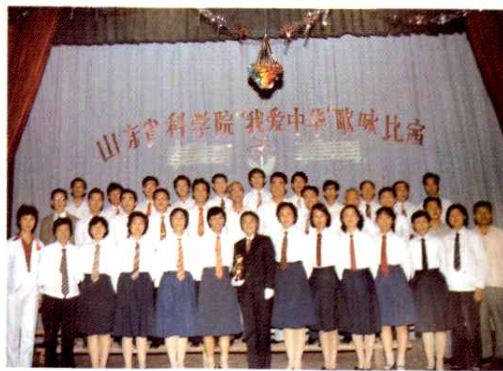
1986年10月，举办“爱我中华”歌咏比赛。