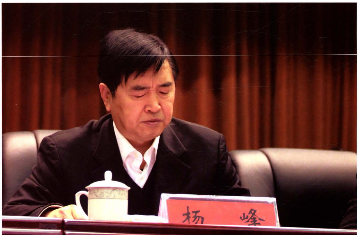
2016年2月17日，主席团常务主席、市人大常委会副主任杨峰在市十四届人大五次会议上