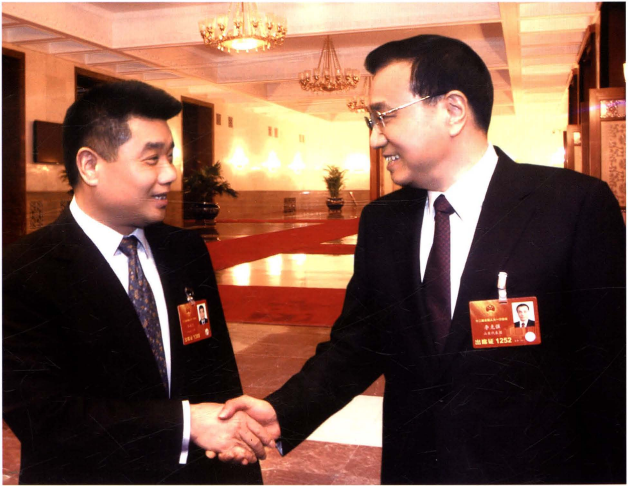
2013年3月9日，中共中央政治局常委、国务院总理李克强与参加十二届全国人大一次会议的河南黄河集团董事长乔秋生亲切交谈