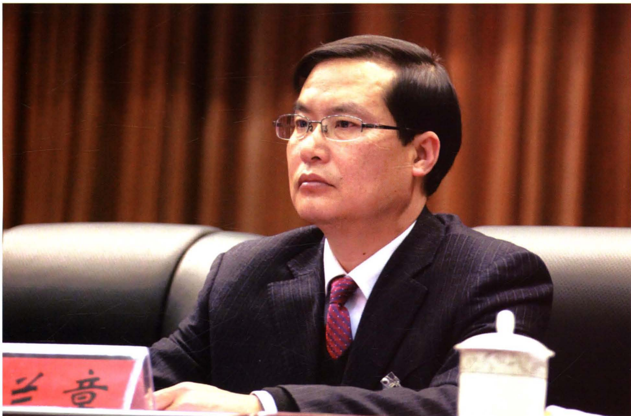
2016年2月17日，主席团常务主席、市人大常委会副主任袁兰章在市十四届人大五次会议上