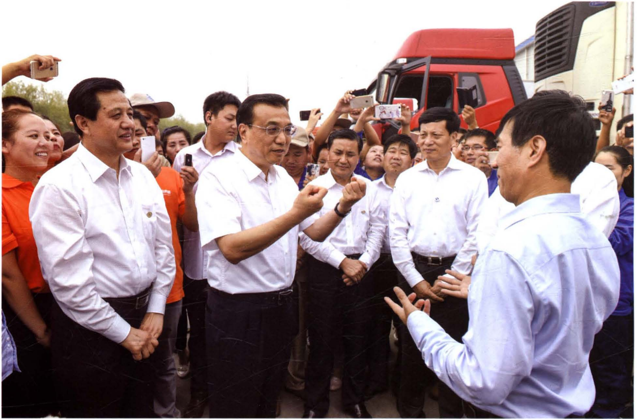
2015年9月24日，国务院总理李克强视察河南众品食业股份有限公司