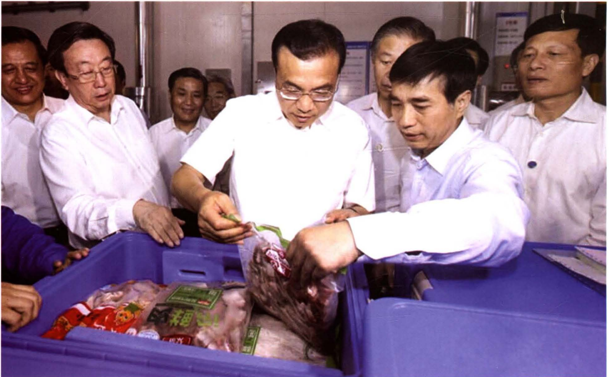
2015年9月24日李克强总理到河南鲜易控股公司考察