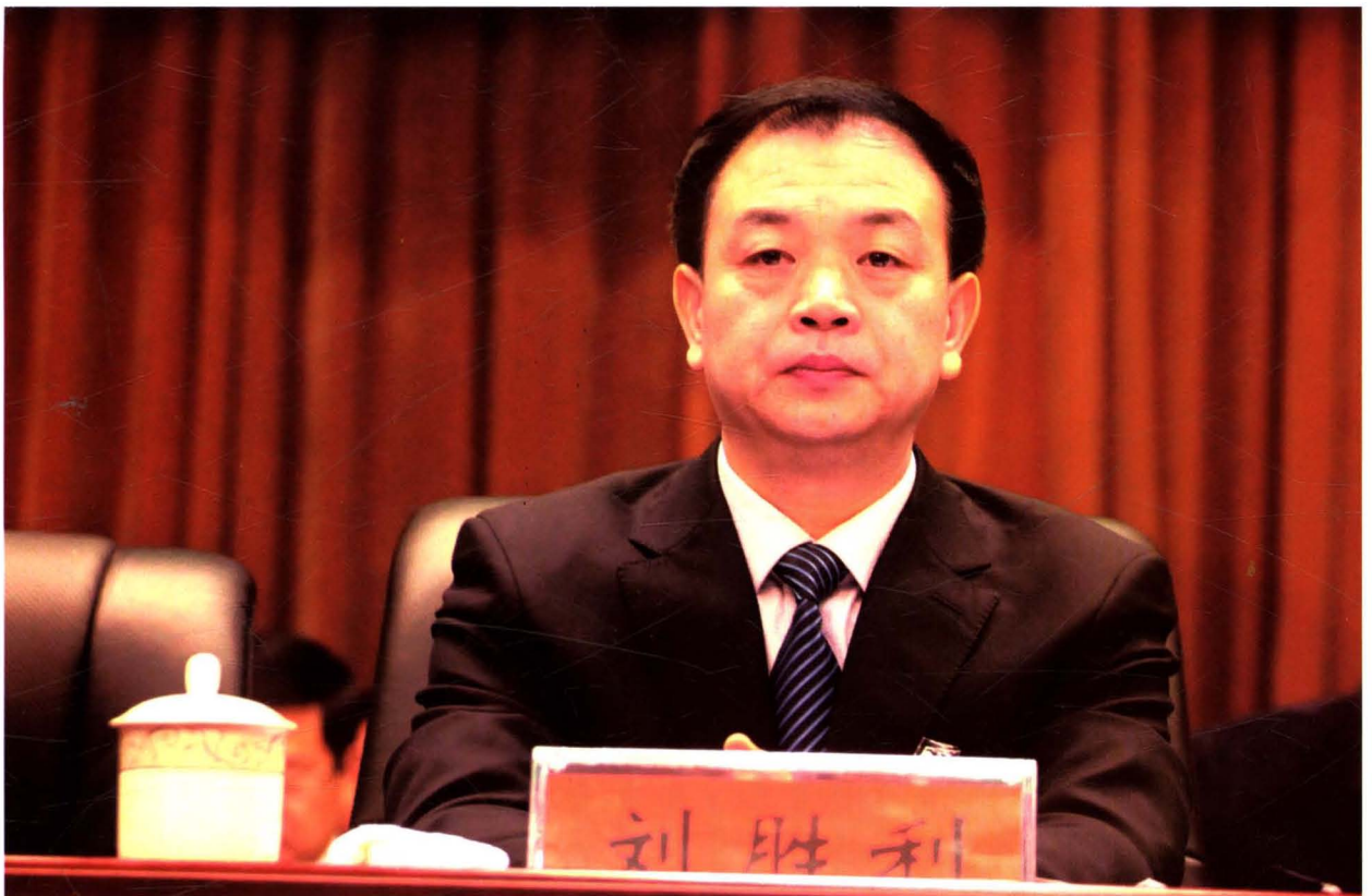
2016年2月17日，主席团常务主席、市委书记刘胜利在市十四届人大五次会议上