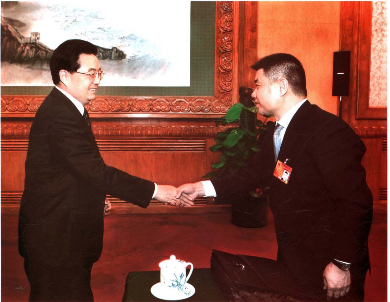
2010年3月10日，中共中央总书记、国家主席、中央军委主席胡锦涛，亲切接见出席第十一届全国人大三次会议的黄河集团董事长乔秋生