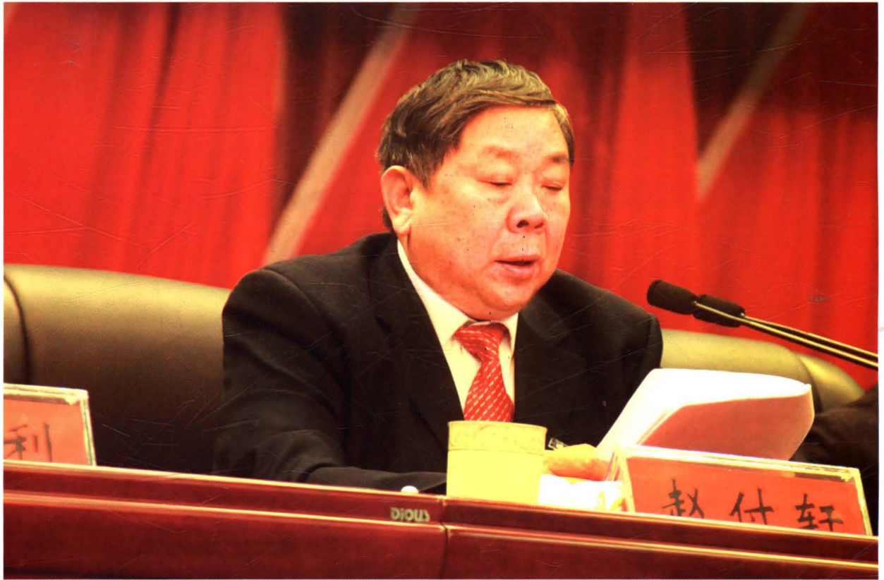
2016年2月17日，主席团常务主席、市人大主任赵付轩在市十四届人大五次会议上主持第一次全体会议