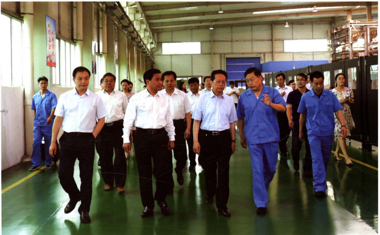
2016年6月15日，全国人大常委会副委员长、民建中央主席陈昌智视察森源电气