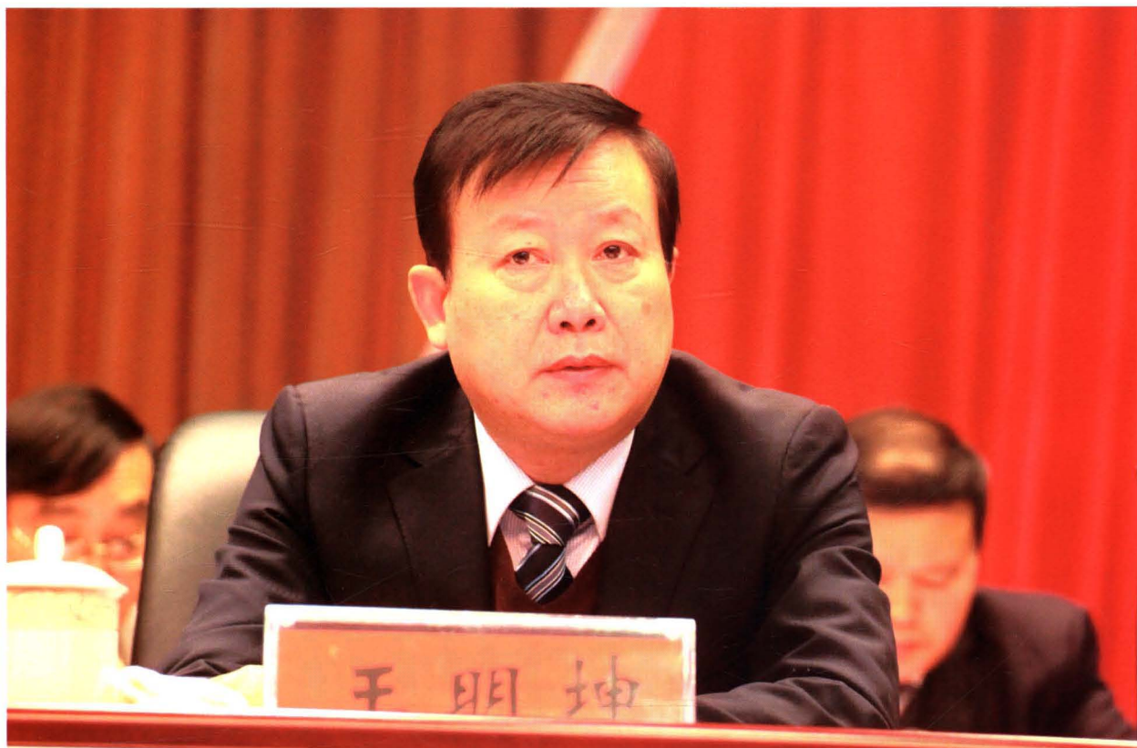
2016年2月17日，主席团常务主席、市委副书记王明坤在市十四届人大五次会议上