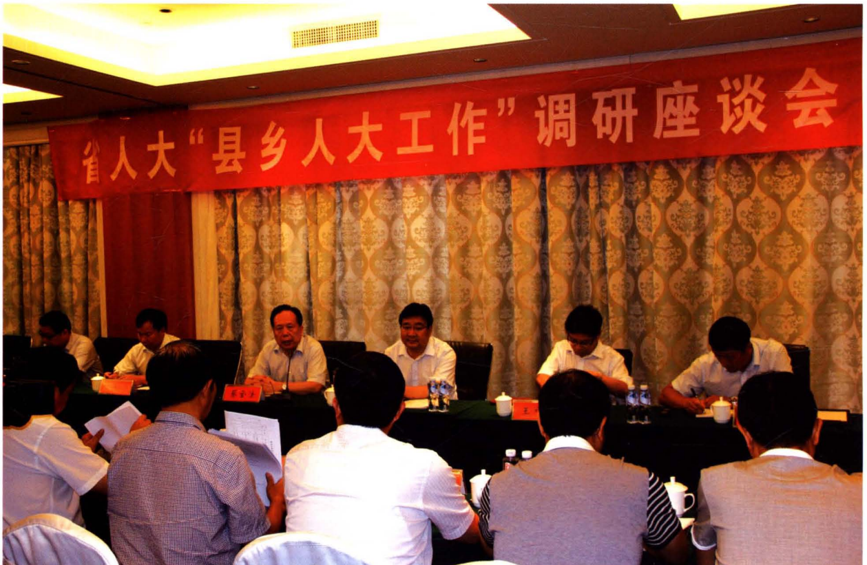
2015年8月3日，省人大在我市召开县乡人大工作调研座谈会