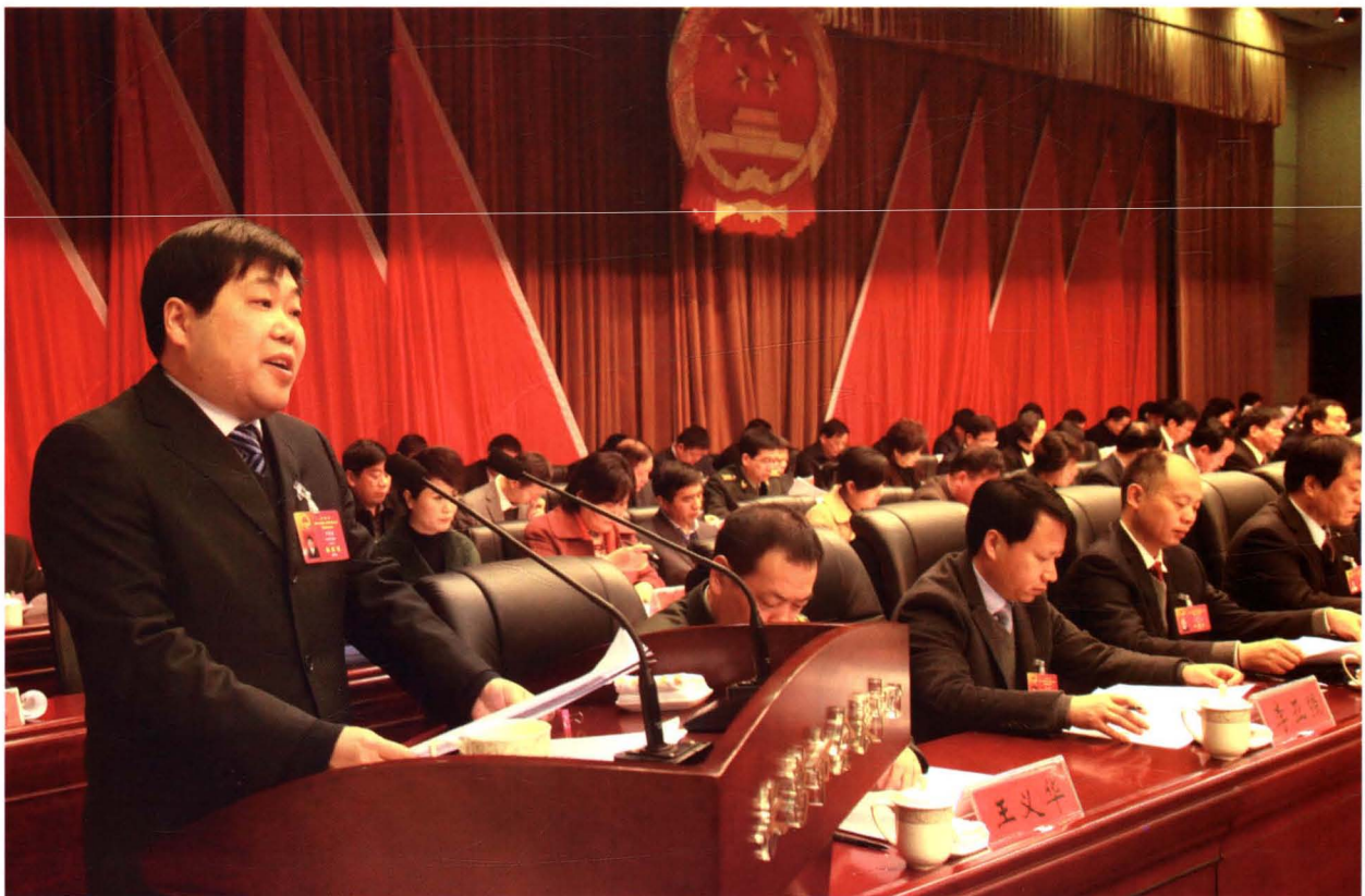
2016年2月17日，市长尹俊营在市十四届人大五次会议上作政府工作报告