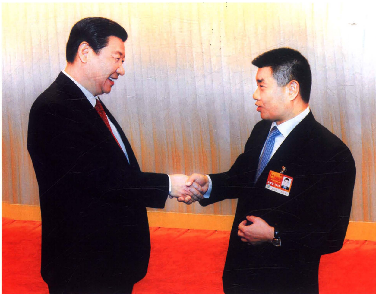
2011年3月7日，中共中央政治局常委、中央书记处书记、国家副主席、军委副主席习近平，与出席第十一届全国人大四次会议的全国人大代表乔秋生亲切交谈