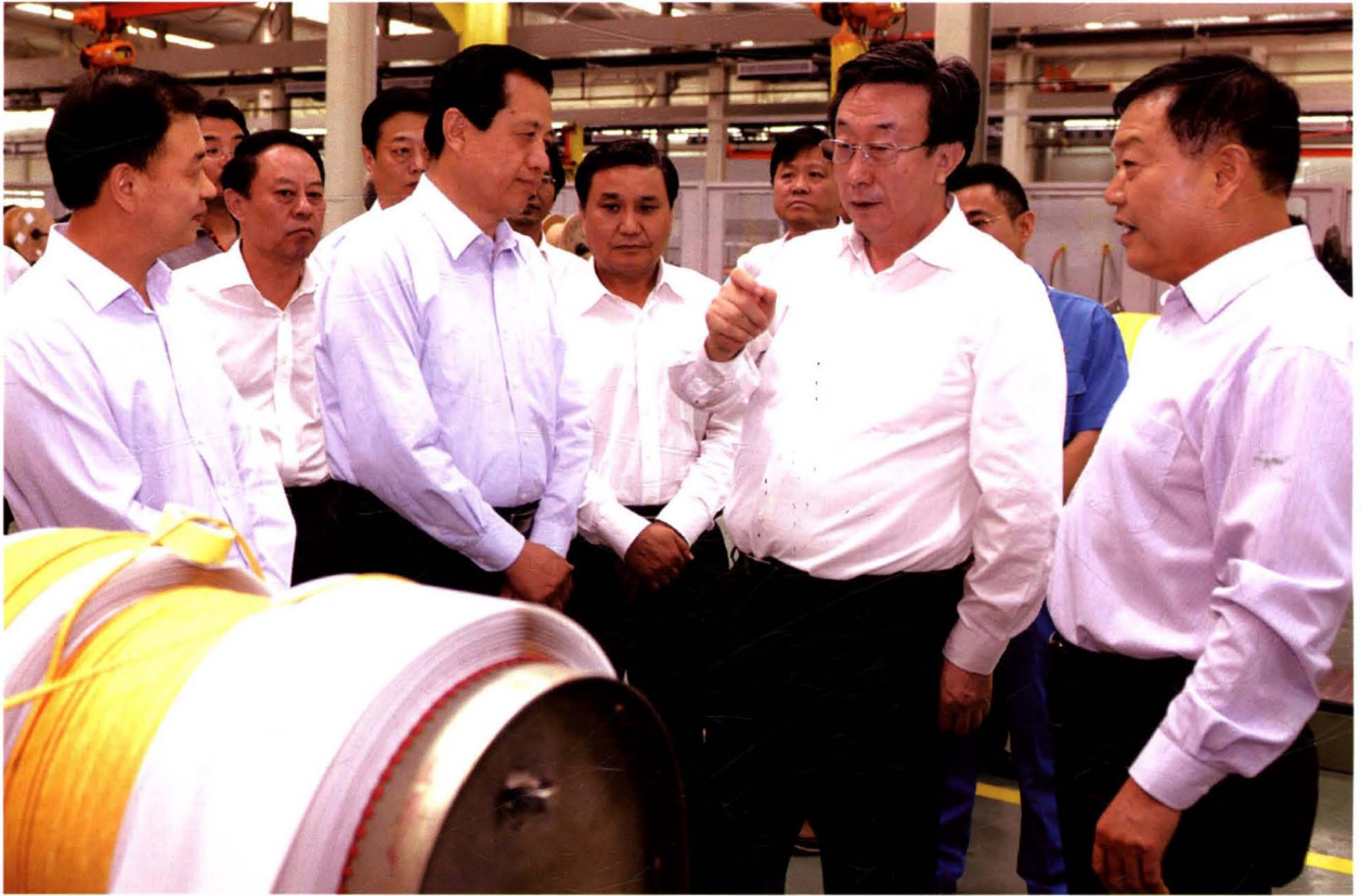
2015年9月15日，省委书记郭庚茂视察森源电器