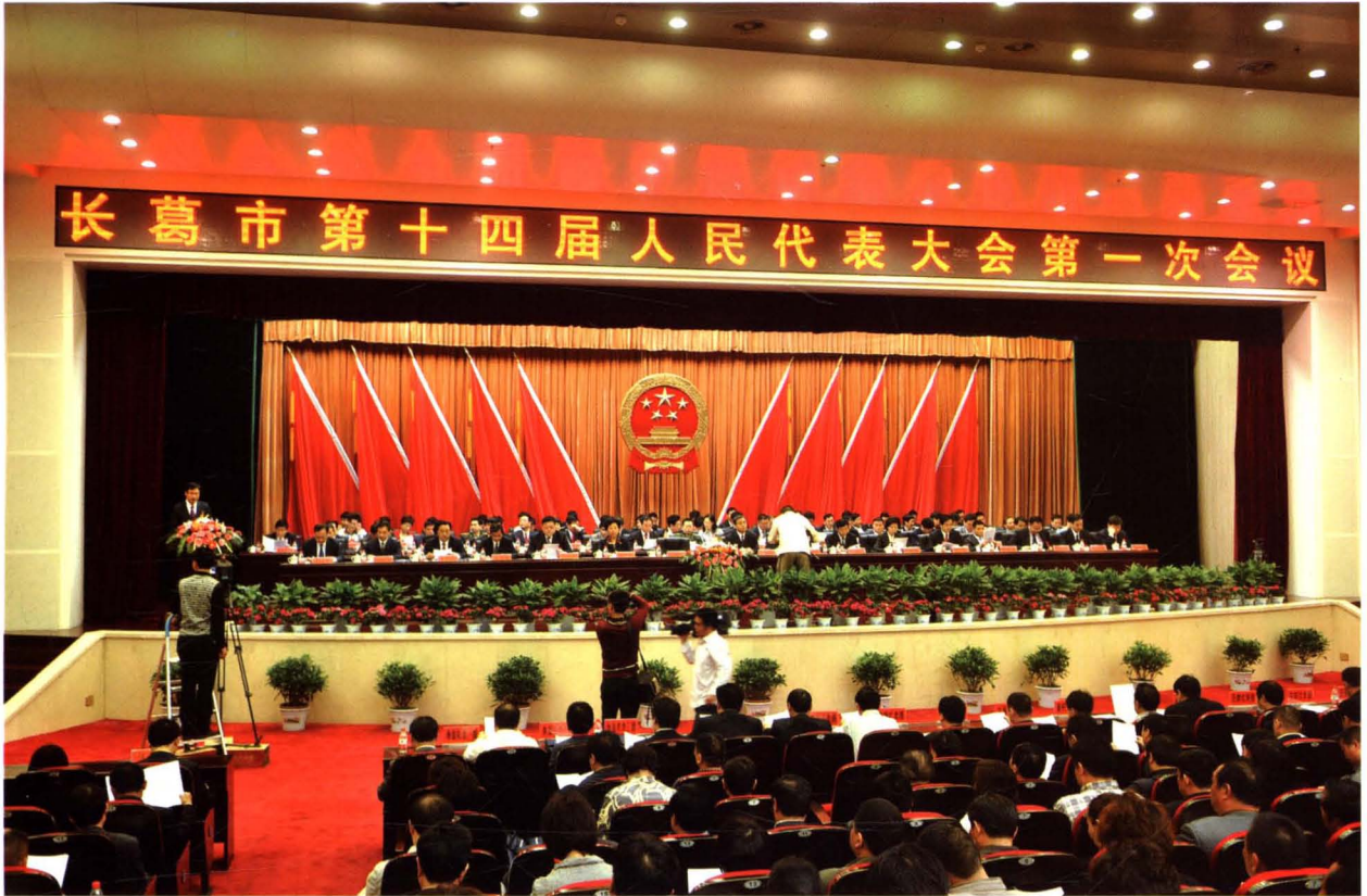
2012年4月27日，市十四届人大一次会议会场