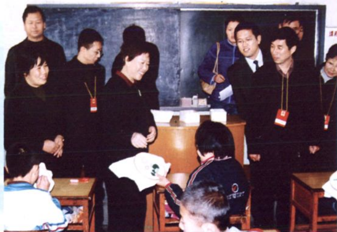
2004年11月4日,市政协委员看望银川市育智学校残疾儿童