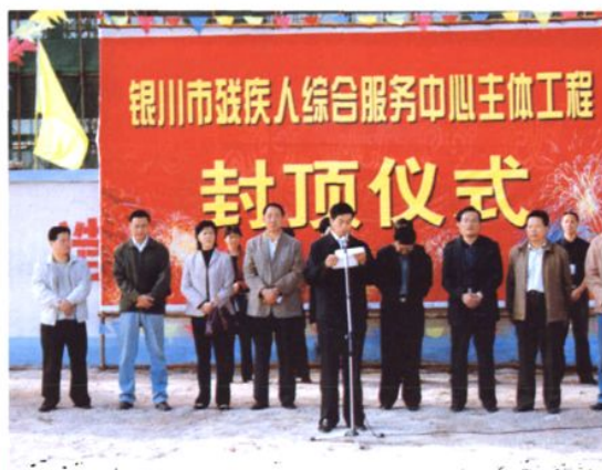
2005年9月28日，银川市残疾人综合服务中心主体工程封顶仪式