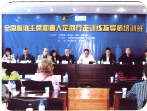
2007年9月25日,全国盲协主席和盲人定向行走训练指导师培训班在银川市残疾人综合服务中心举办