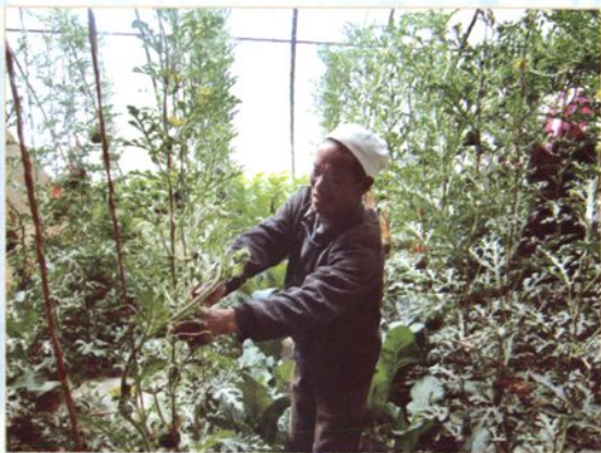
扶持农村贫困残疾人发展种植业