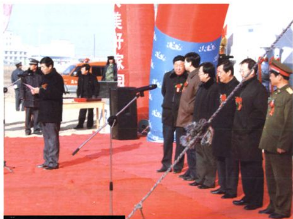
2007年1月6日，银川市残疾人综合服务中心落成典礼现场