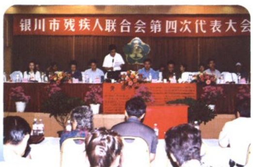
2003年2月19日,银川市残联第四次代表大会召开