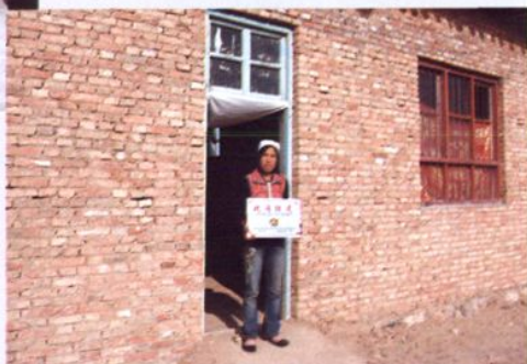
残疾人危房改造工程