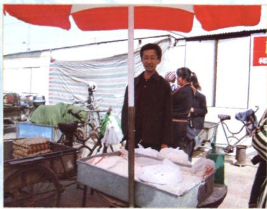
扶持残疾人自主创业