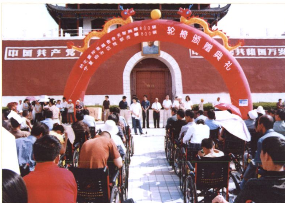
2004年8月,南门广场轮椅捐赠仪式现场