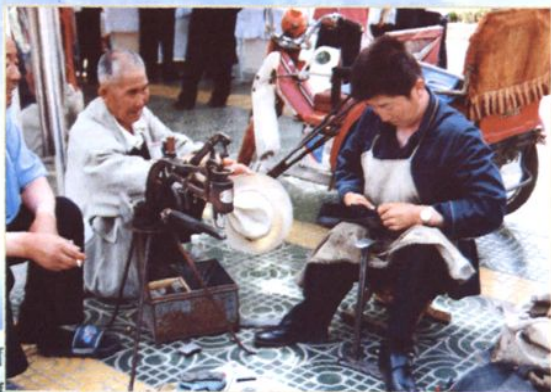
积极争取城管摊位,扶持残疾人个体就业