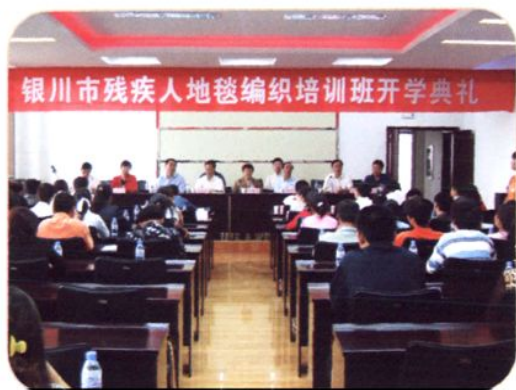
2007年6月6日,银川市残疾人地毯编织培训班开学典礼