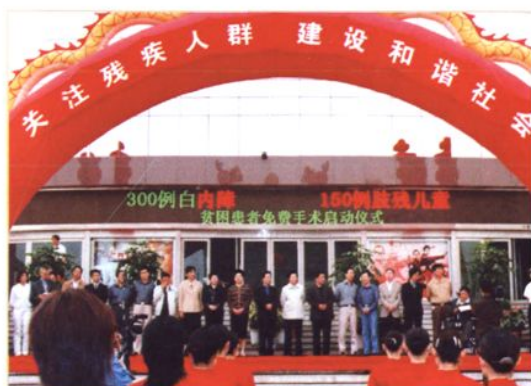
2005年5月15日,贫困白内障患者免费复明手术启动仪式