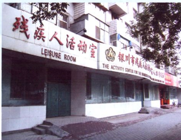
民族南街 113 号原残联办公地点（1993 年）