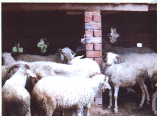
扶持农村贫困残疾人发展养殖业