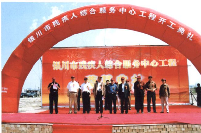
2005年5月26日，银川市残疾人综合服务中心工程开工典礼