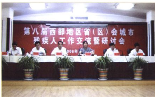
2006年8月,成功举办第八届西部地区省(区)会城市残疾人工作交流暨研讨会