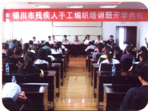
2007年7月4日,银川市残疾人手工编织培训班开学典礼