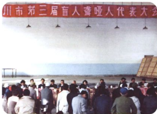
1987年10月28日,银川市第三届盲人聋哑人代表大会召开