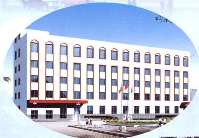
金凤区宁安大街 369 号银川市残疾人综合服务中心大楼正（正背面 2007 年）