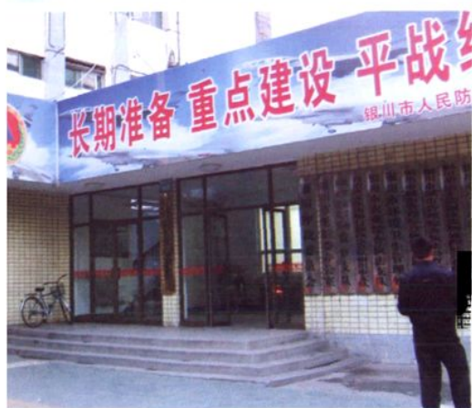
解放东街 108 号原残联办公地点（1999 年）