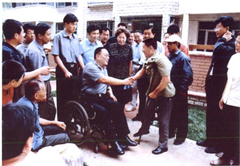
2002年7月30日，中国残联邓朴方主席（中）在自治区党委常委、组织部长陈希明，自治区党委常委、银川市委书记王正伟，自治区残联理事长曾庆民，银川市市长郝林海陪同下视察银川市残疾人工作