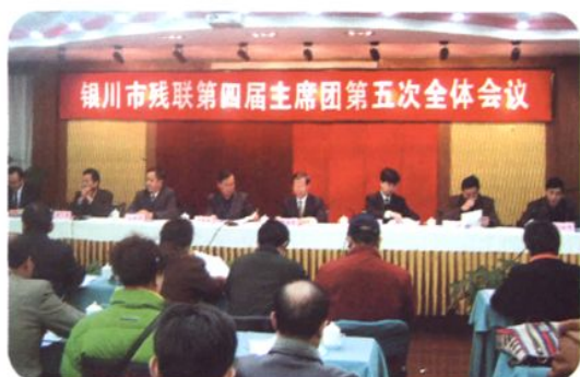
2007年3月9日,银川市残联第四届主席团第五次会议召开