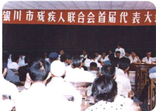
1990年7月19日,银川市残疾人联合会首届代表大会召开