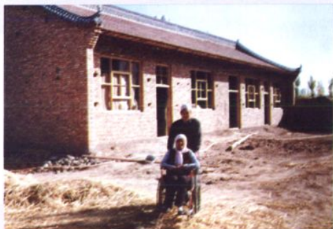
残疾人在市残联危房改造工程中受益