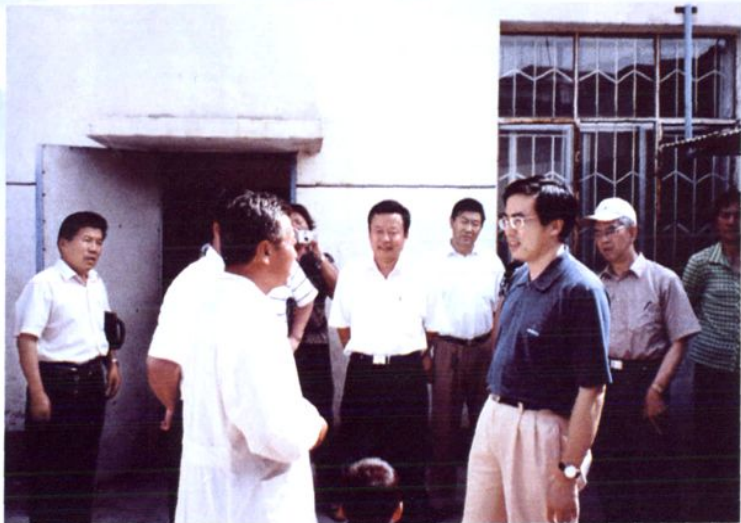
2005年7月13日，中残联副理事长程凯考察贺兰县残疾人工作