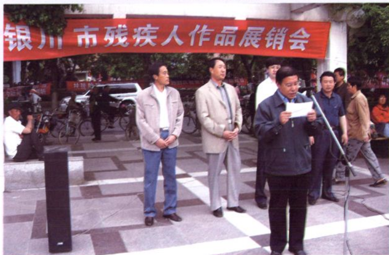
2007年5月20日,在宁园举办银川市残疾人作品展销会