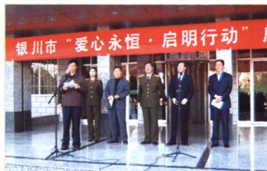
2007年4月18日,银川市“爱心永恒、启明行动”启动仪式