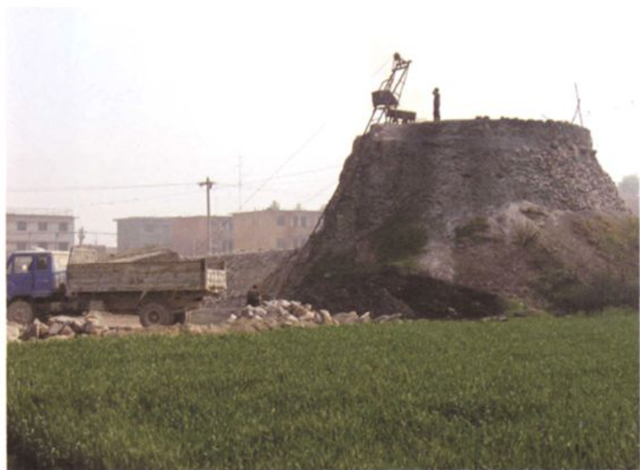
大刘庄村办白灰厂