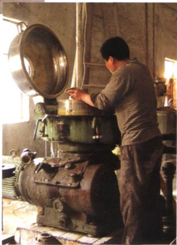
大刘庄村淀粉厂车间