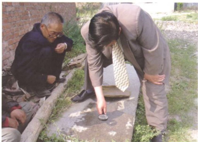
编纂人员在考察历史碑文