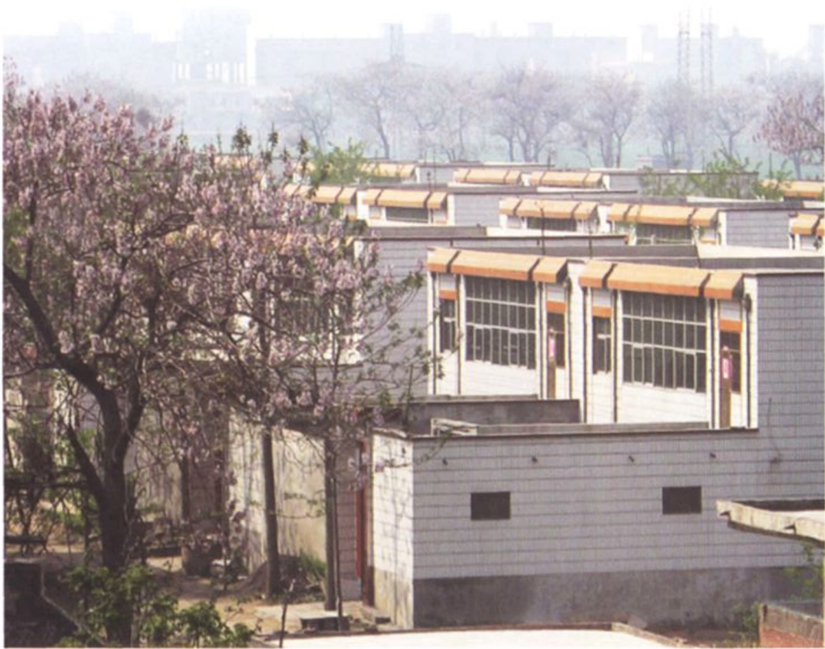
大刘庄新村建设一角