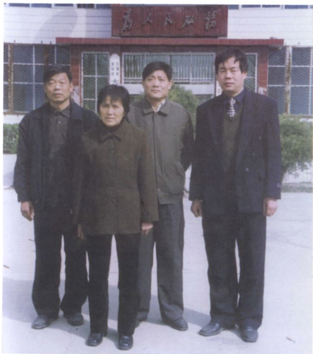
村党总支、村委会主要干部合影 (2004. 3)