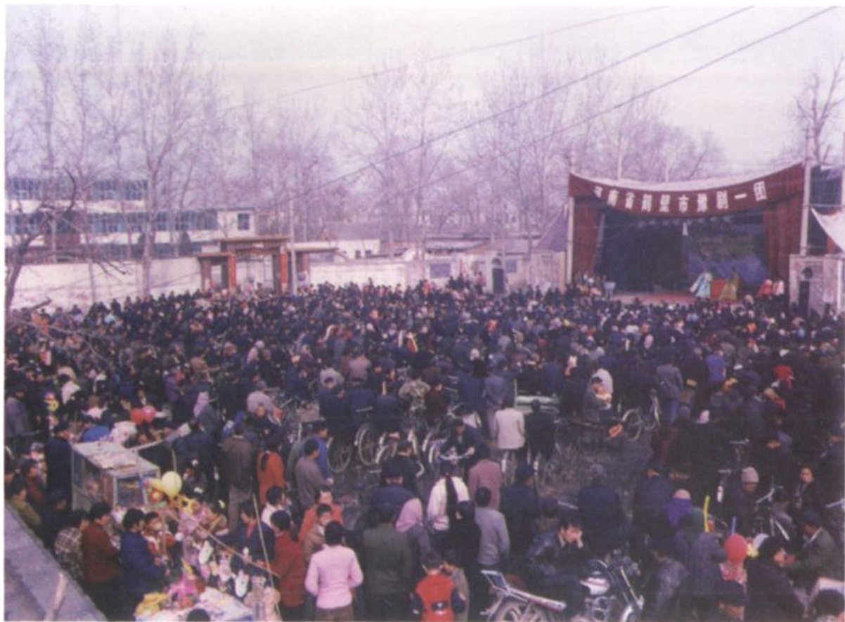
农历正月十六日古庙会村里请来豫剧团