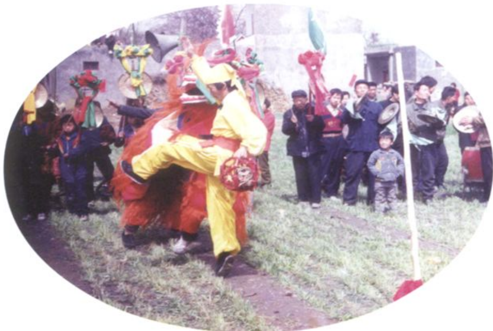
村民在表演狮子舞