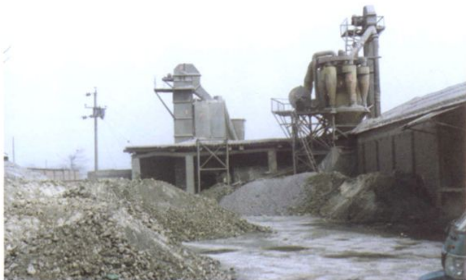
民营企业禹鑫联合水泥厂