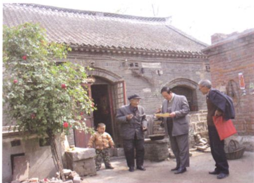
编纂人员采访老村民