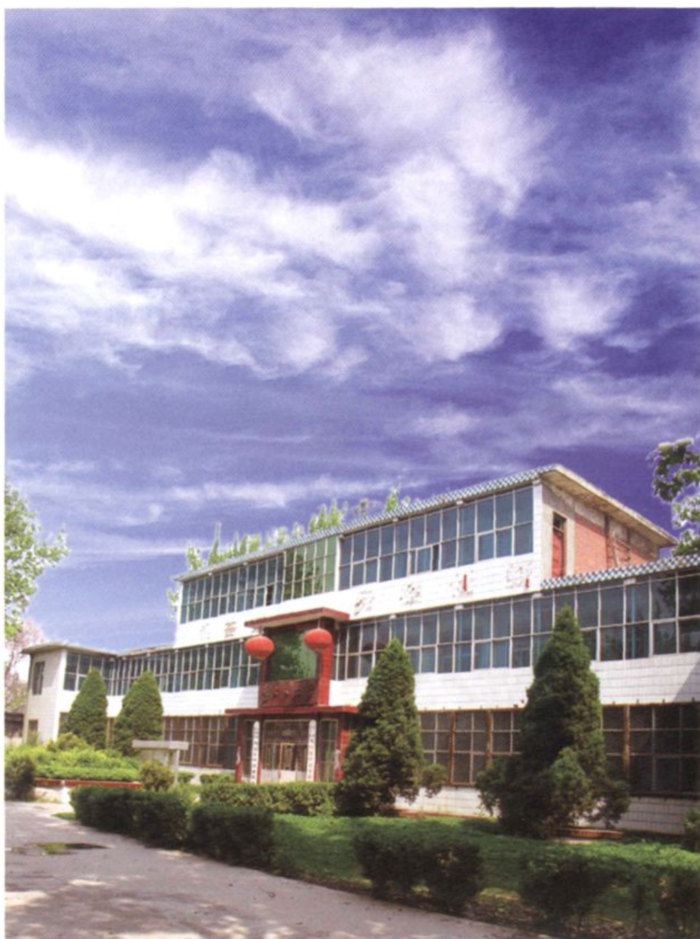
大刘庄村民委员会办公楼