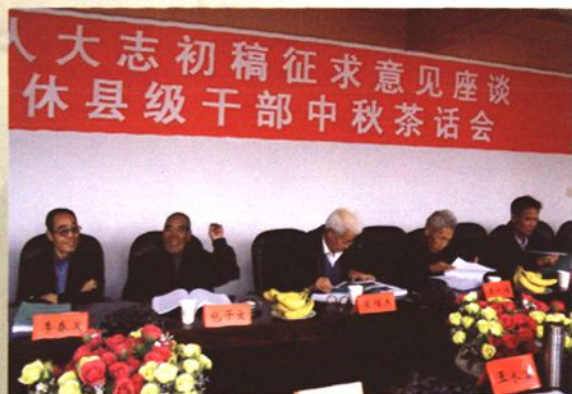
县人大志编写座谈会