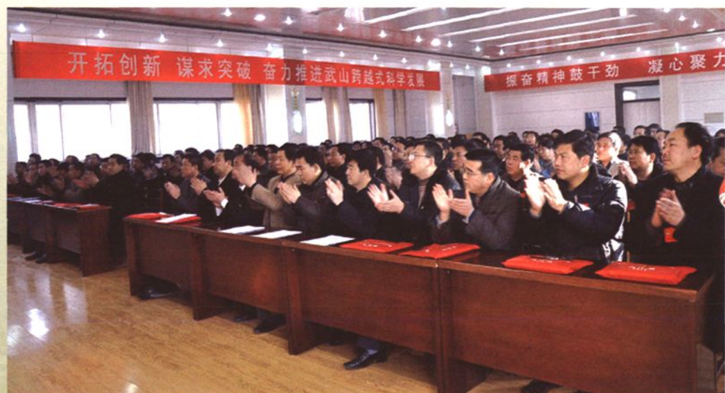
县人民代表大会场景