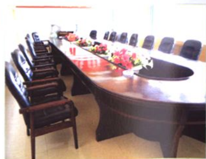
武山县人大常委会会议室