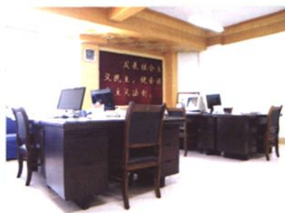
武山县人大常委会办公室