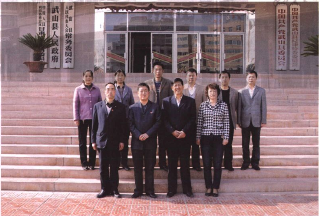
《武山县人民代表大会志》编辑人员合影