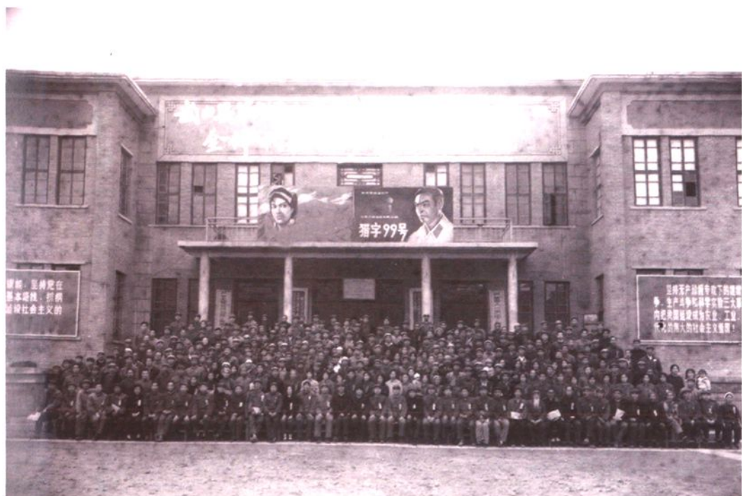
武山县第七届人民代表大会第一次会议代表合影