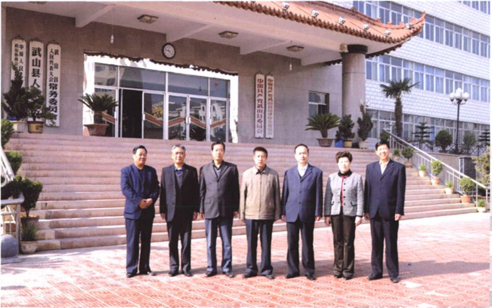
《武山县人民代表大会志》编委会成员合影