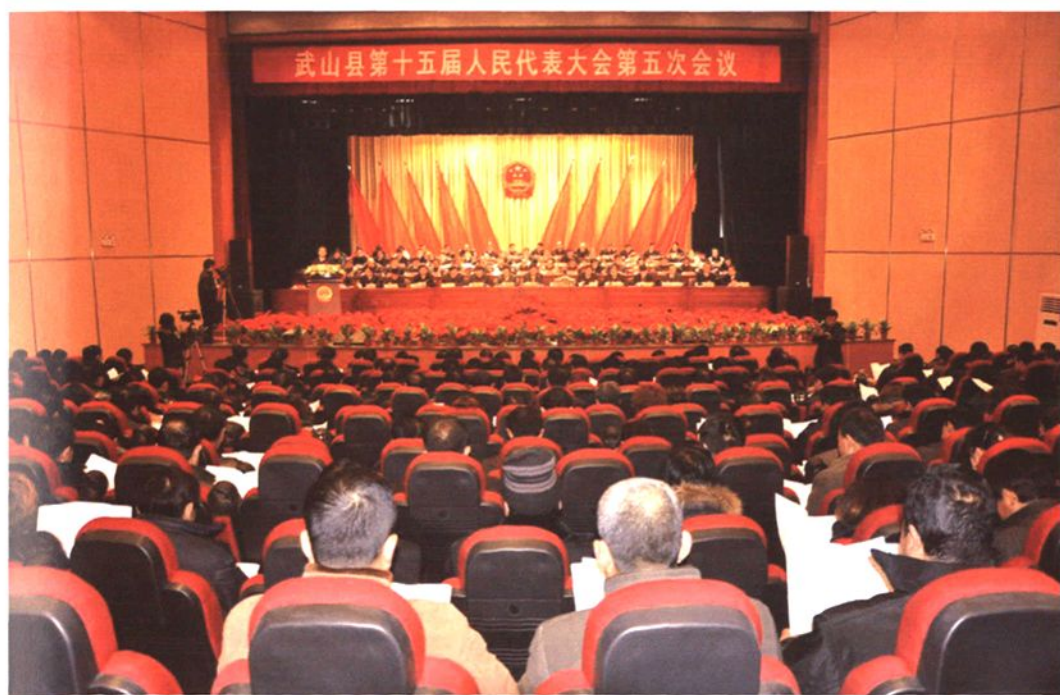
武山县第十五届人民代表大会第五次会议场景