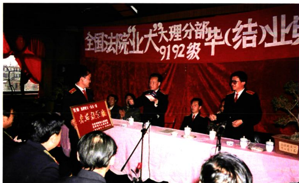
(结)业典礼。 全国法院“业大”大理分部九一、九二级毕