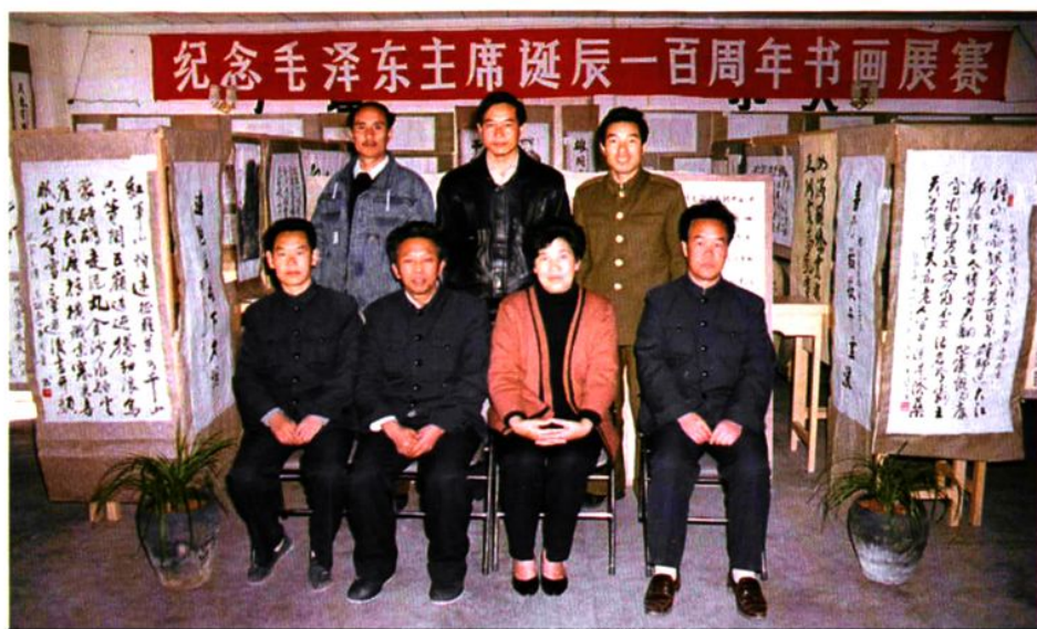
(1993. 12. 26 日留影)