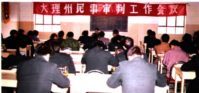
全州民事审判工作会议。