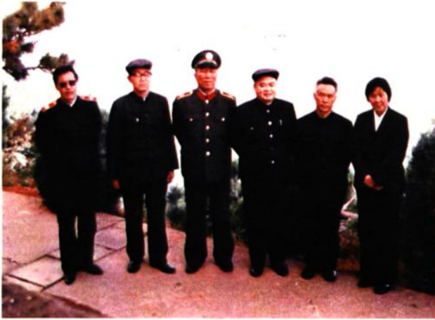
1986年11月最高法院林准副院长（右三）到大理视察法院工作