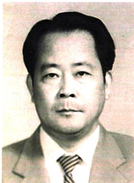
云南省高级人民法院院长邱创教（原任大理州中级人民法院副院长）