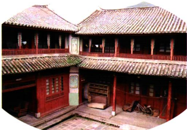
◇大理州中级人民法院旧址