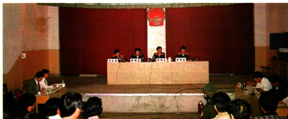
大理州中级人民法院经济审判庭开庭 审案件。(1995.10)