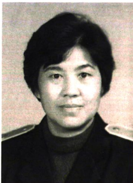
院长：许文英（一九八六年九月—一九九二年八月）现任云南省高级人民法院副院长