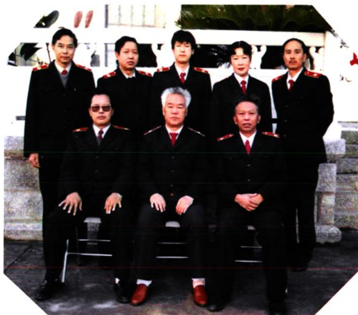
本院志编纂委员会部分成员及工作人员合影