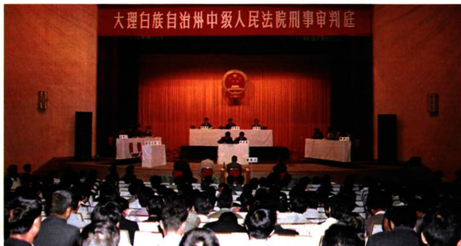
大理州中级人民法院刑事审判庭开庭 审案(1996.9)