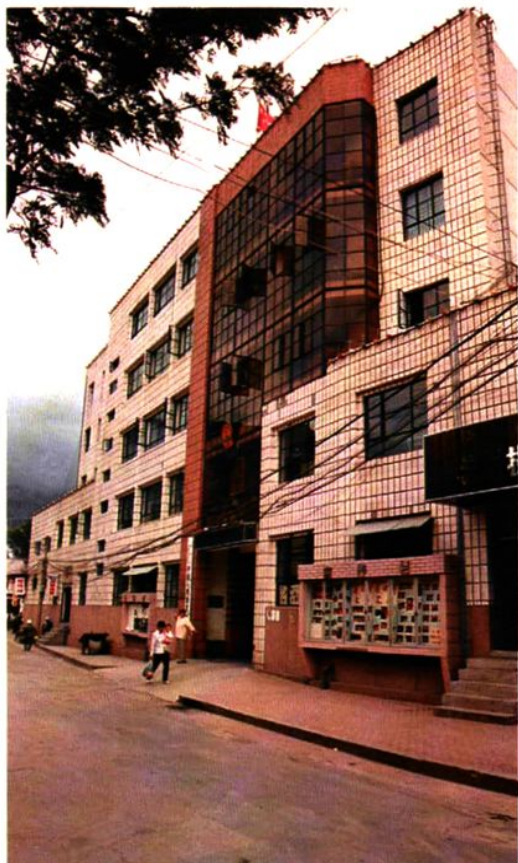
大理州中级人民法院审判庭综合楼 (1991年9月落成)