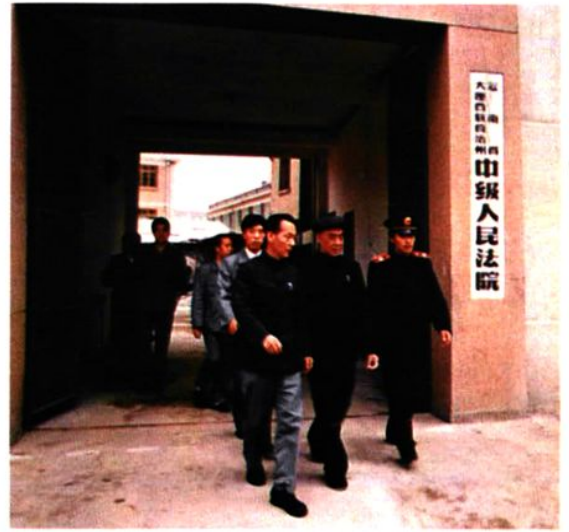
最高法院曾汉斌副院长（中）到我院视察工作（1986年）