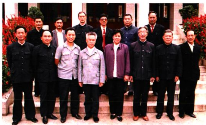
中级法院及全州十二个县、市法院院长留影 1992年9月