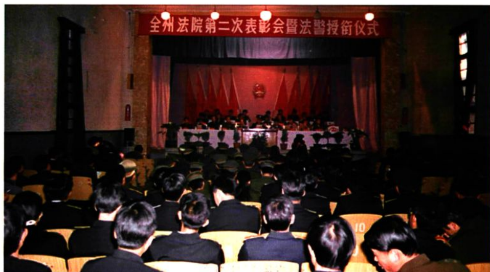
一九九六年三月四日全州法院第二次表彰会暨法警授衔仪式在大理市召开。