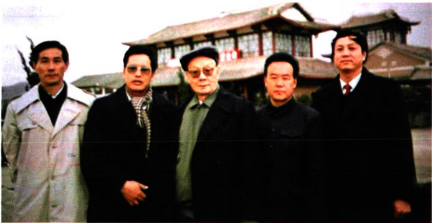
大理视察法院工作（一九九二年二月） 最高法院王怀安副院长（左三）到