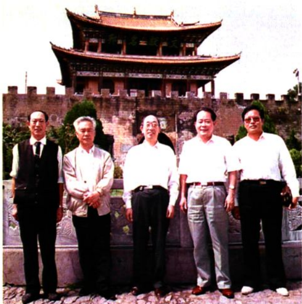
1995年9月,最高法院唐德华副院长到大理视察。左起:大理市人民法院院长焦子军、大理州法院院长黄兴荣、最高法院副院长唐德华、云南省高级人民法院院长邱创教、大理州法院副院长李文全。