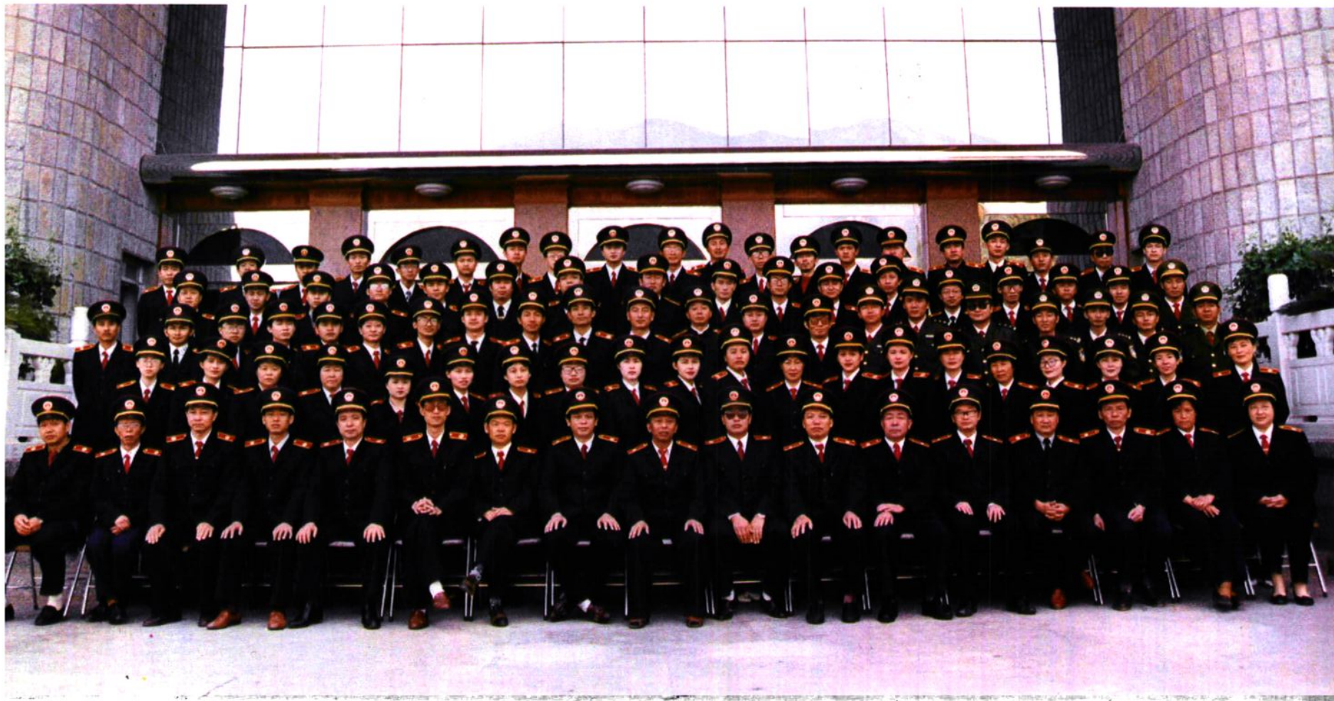
大理白族自治州中级人民法院全体干警合影(1997年5月)