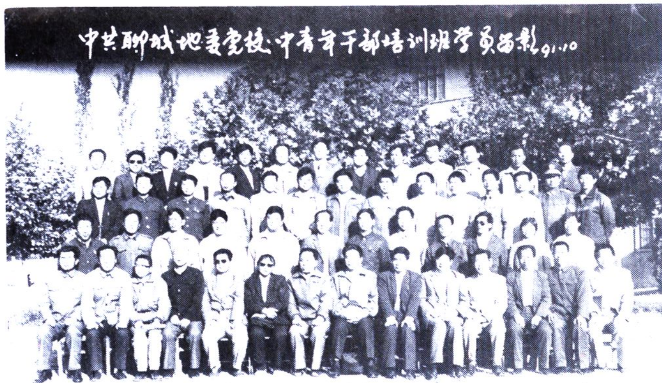
全区第一期中青年干部培训班合影