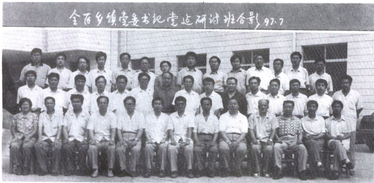
乡镇党委书记党建研讨班合影