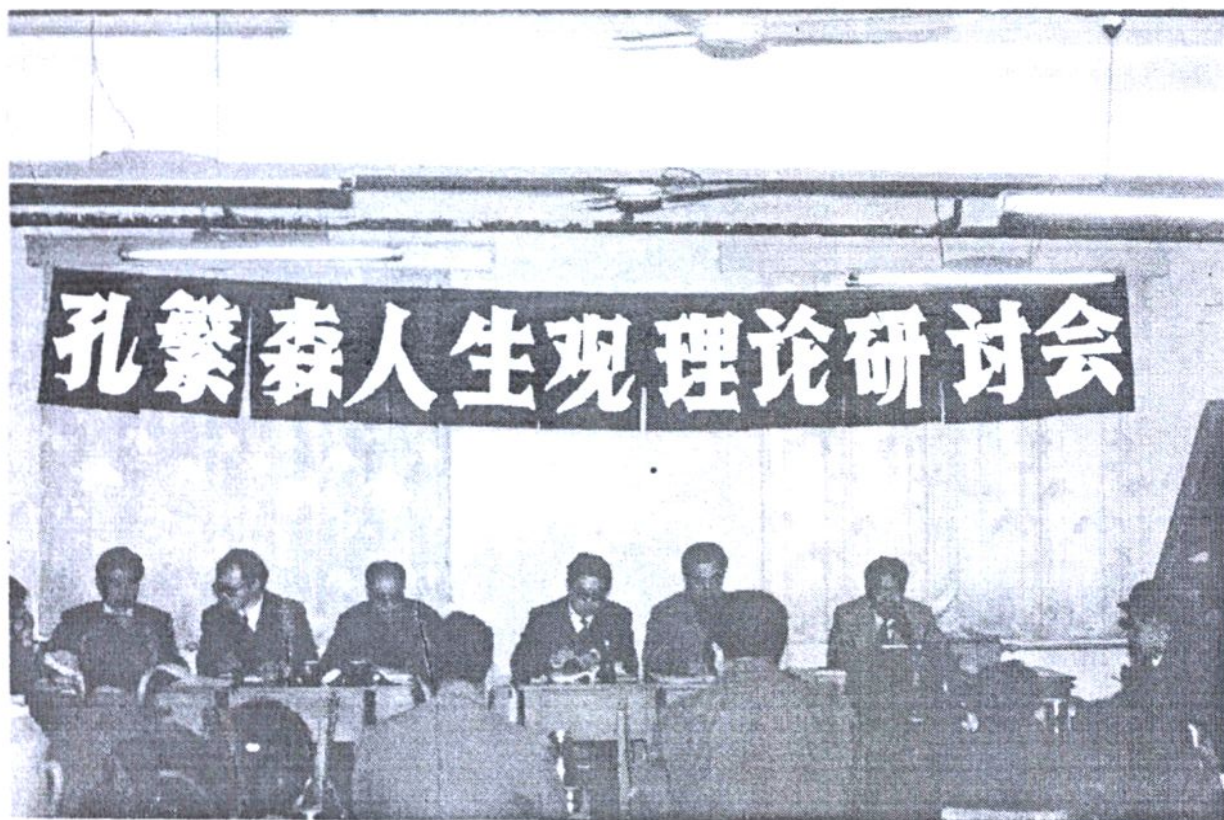
96年4月9日,党校理论研讨会会场