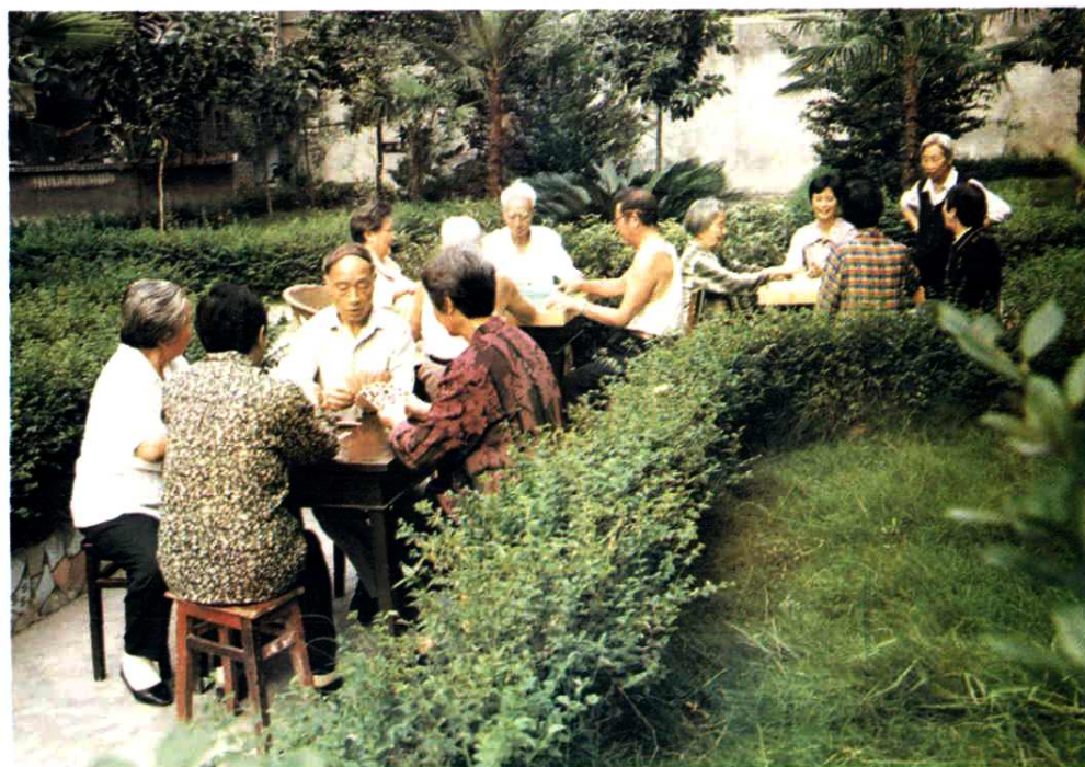
退休教职工老有所乐