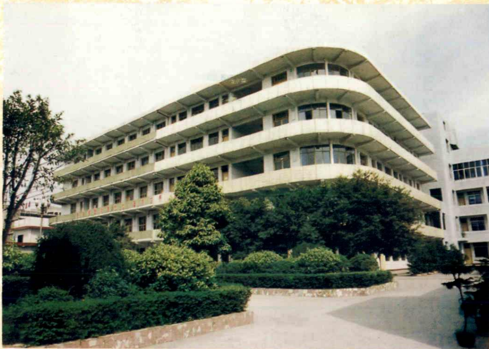
教 学 大 楼