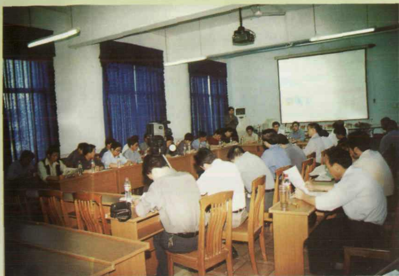
市县领导率团来校进行 “普九”验收