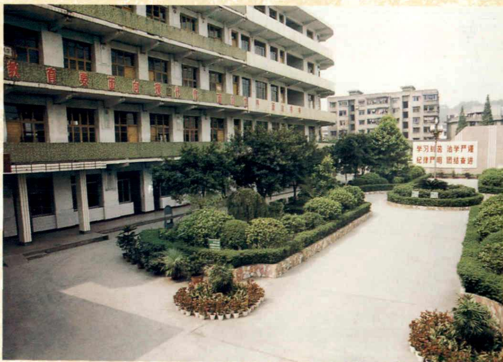
优 美 的 校 园