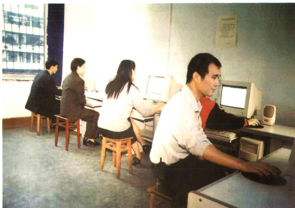
利用多媒体进行教学——教师正在备课