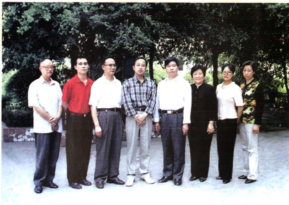
《校志》编写小组人员合影