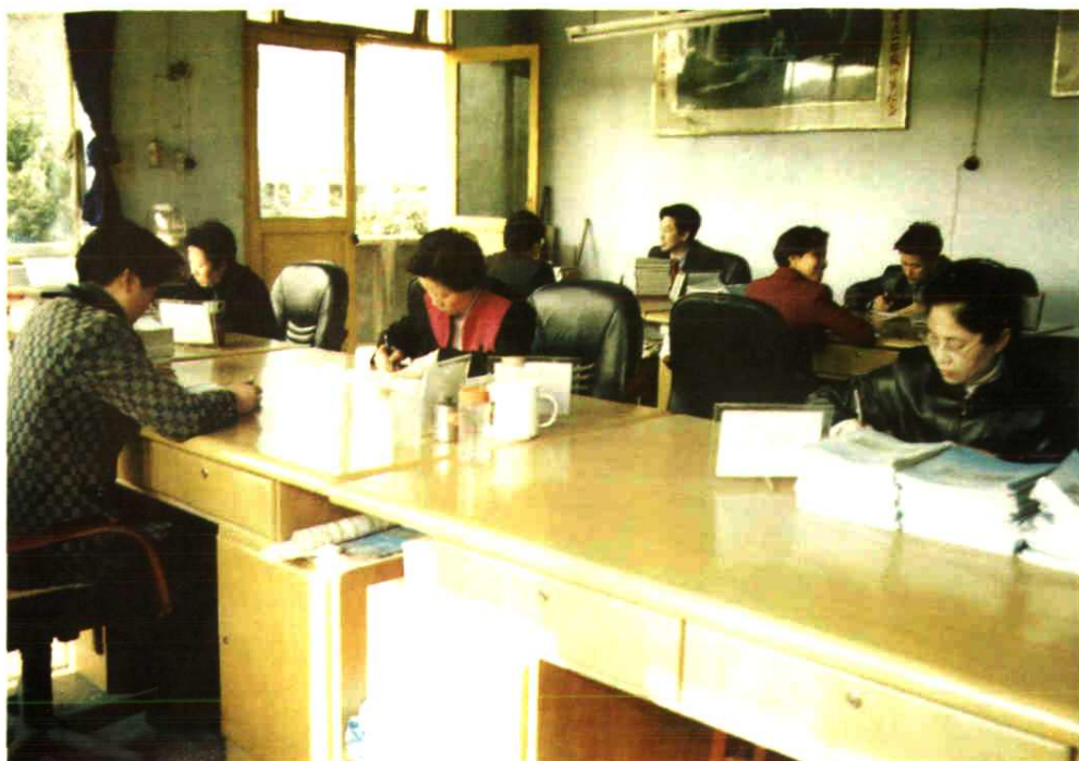
教师在办公室办公