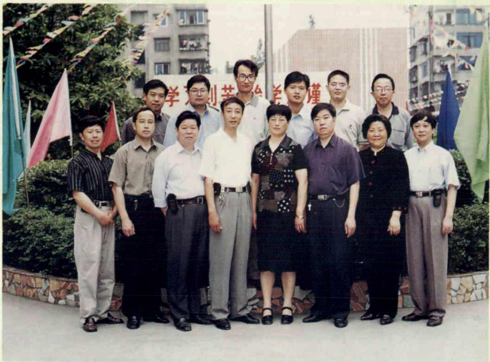
浙江省杭州临安市教委及锦城二中领导来校参观指导