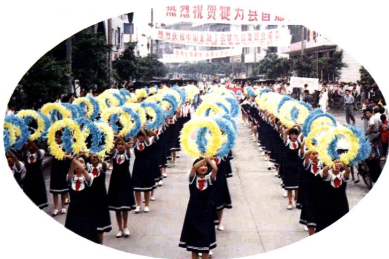
▲ 艺术教育绽放奇葩 ▼