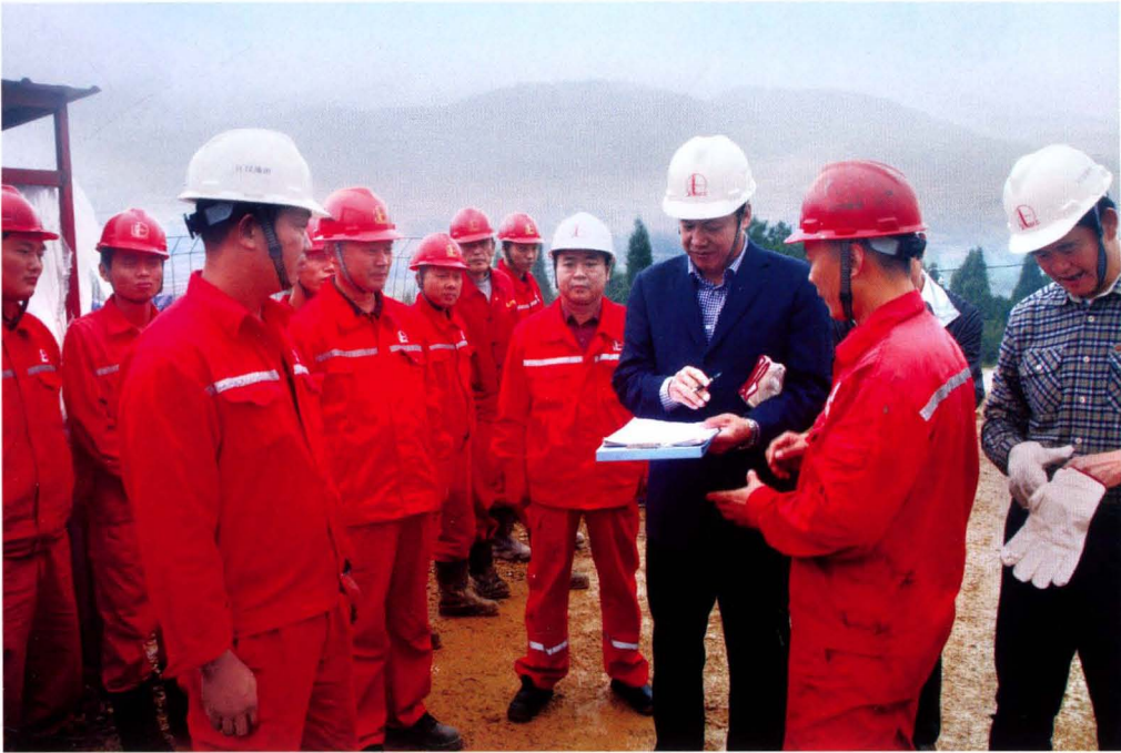
2013年10月17日，国土资源部专家组到焦页8号平台调研考察