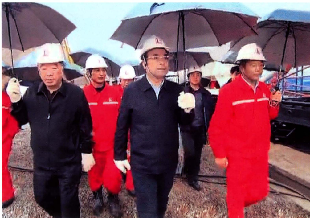
2014年3月28日，中共中央政治局委员、重庆市委书记孙政才（左四）到焦页30号平台、焦页10号平台视察工作，重庆市委副书记、市长黄奇帆（左一），江汉石油工程有限公司总经理杨国圣（右一）陪同