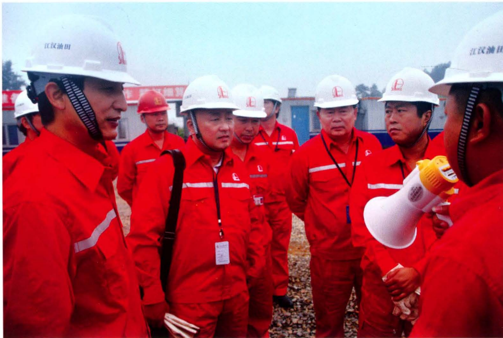
2013年6月26日，中国石油化工集团公司石油工程首席专家及高级研讨班专家组到焦页7号平台参观调研