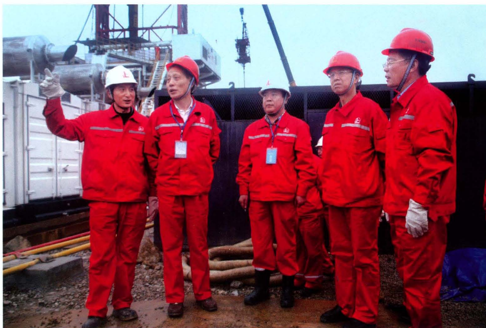
2013年11月12日，国家能源局副局长张玉清（右二）到焦页10号平台考察指导工作，中国石油化工集团公司党组成员、中国石油化工股份有限公司高级副总裁王志刚（右一）、江汉石油管理局局长、江汉油田分公司总经理孙健（左二）等陪同