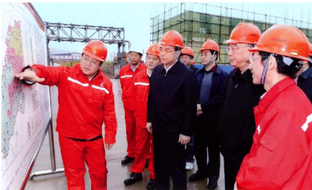
2014年3月29日，中共中央政治局委员、重庆市委书记孙政才（左四）到涪陵工区视察工作，重庆市委副书记、市长黄奇帆（右二），江汉石油管理局局长、江汉油田分公司总经理孙健（左三）陪同