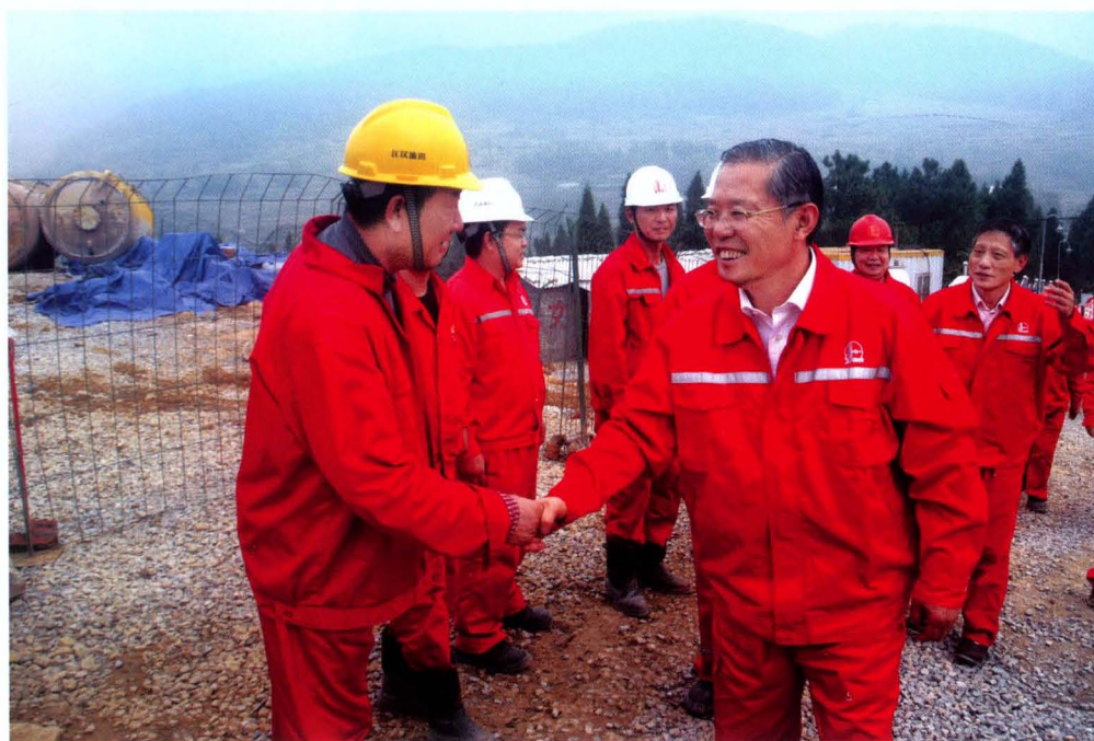
2013年10月23日，中国石油化工集团公司党组成员、中国石油化工股份有限公司高级副总裁王志刚（前右一）到焦页8号平台、焦页9号平台考察指导工作