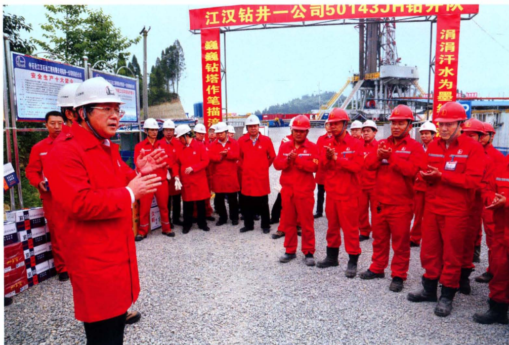
2015年5月12日，中国石油化工集团公司党组成员、副总经理，中石化石油工程技术服务有限公司董事长焦方正（前左一）到涪陵工区调研指导工作，并看望慰问江汉钻井一公司会战将士