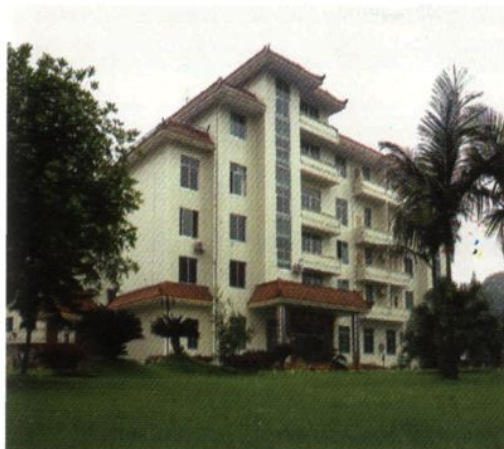
县地税局综合大楼。