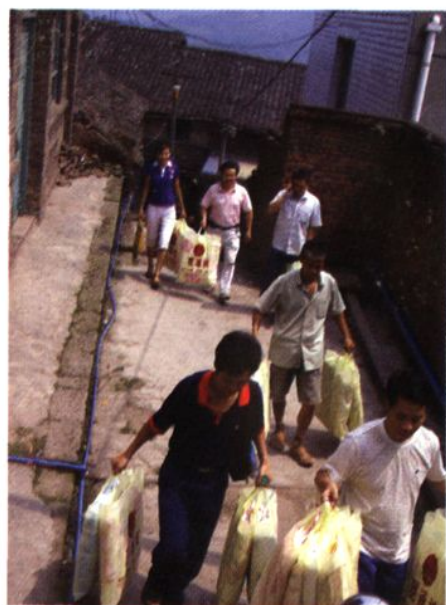
县局党总支慰问贫困老党员和五保户。