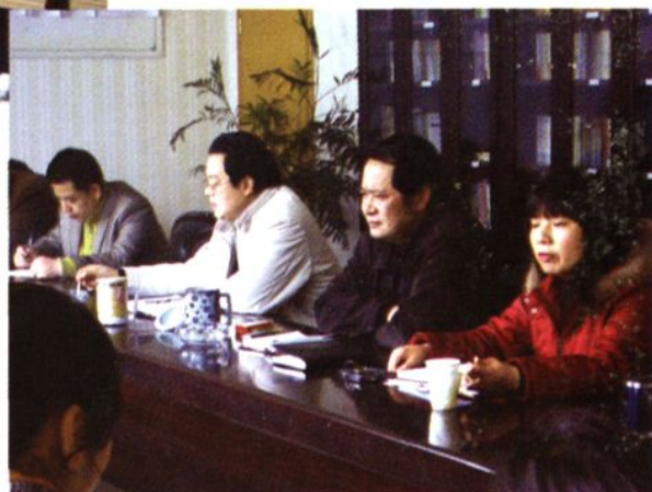
◆市地税局领导听取县地税局党风廉政建设工作汇报。