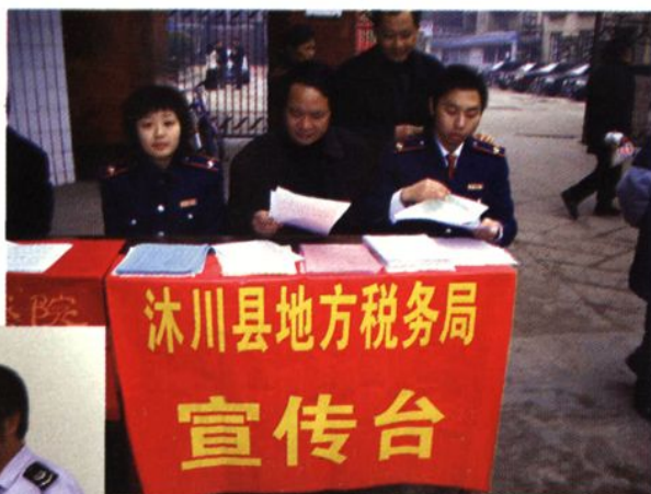
局领导深入征管第一线。