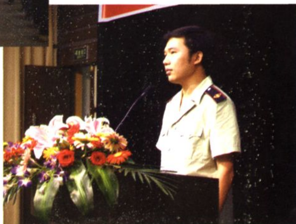
◆ 县地税局举办“我与地税同发展”演讲比赛。