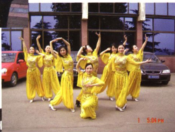
◆ 县地税局舞蹈参加市局“庆祝建国58周年暨党的十七大召开”。