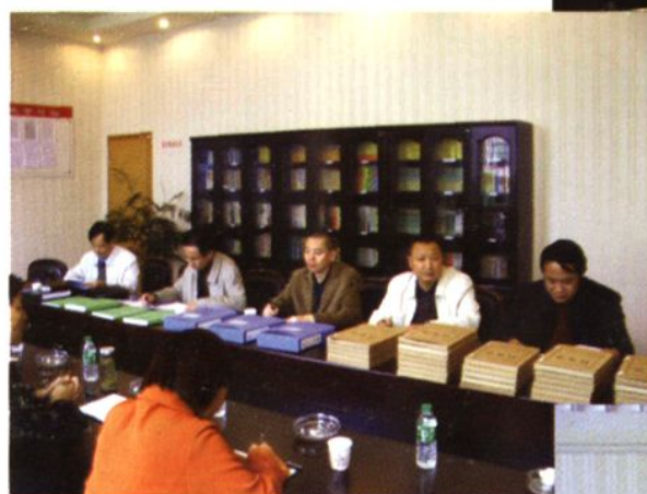
◆全市地税系统创建学习型经验交流会在沐川地税局召开。