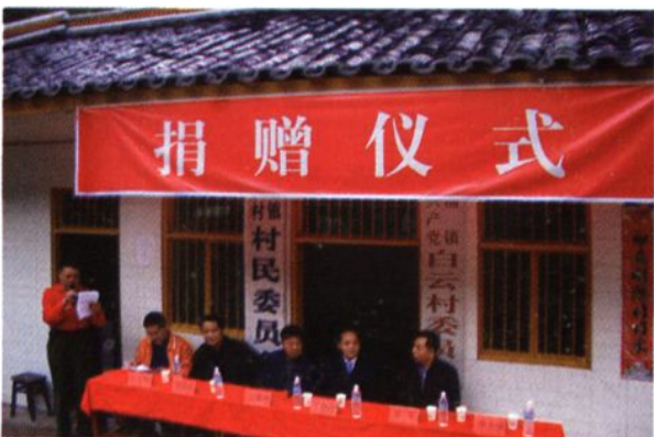
县局干部职工为大楠镇白云村“三项建设”捐款。