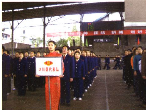
◆ 县地税局组队参加市地税系统首届运动会。