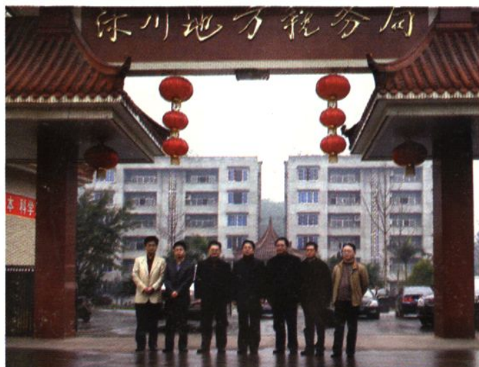
◆省、市、县地税局长在沐川地税局合影。