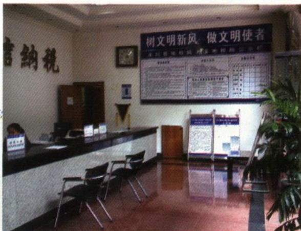
县地税局办税大厅。