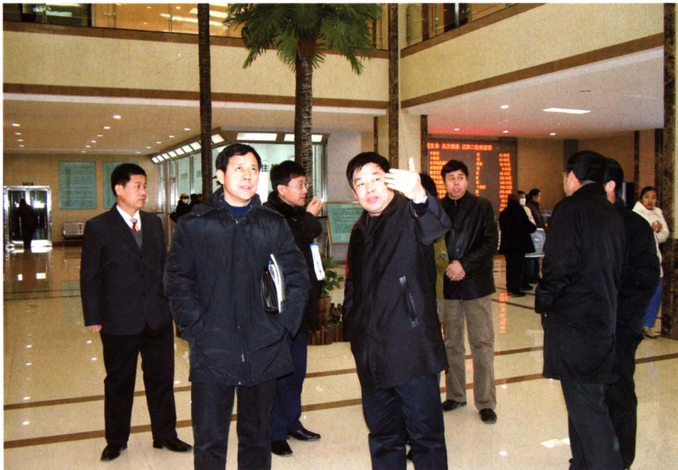
辽宁省卫生厅领导来院检查指导工作