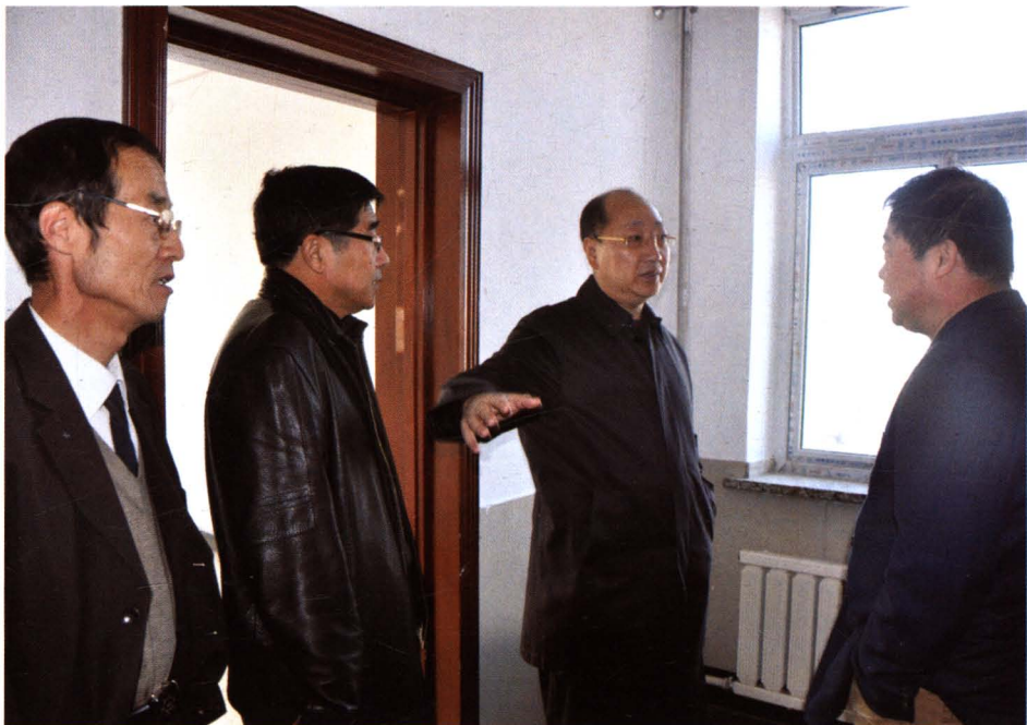
市卫生局随锡君局长到二院 H1N1 病房指导工作