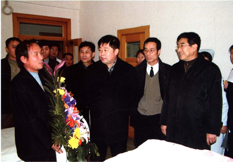
院领导亲切看望农合住院患者