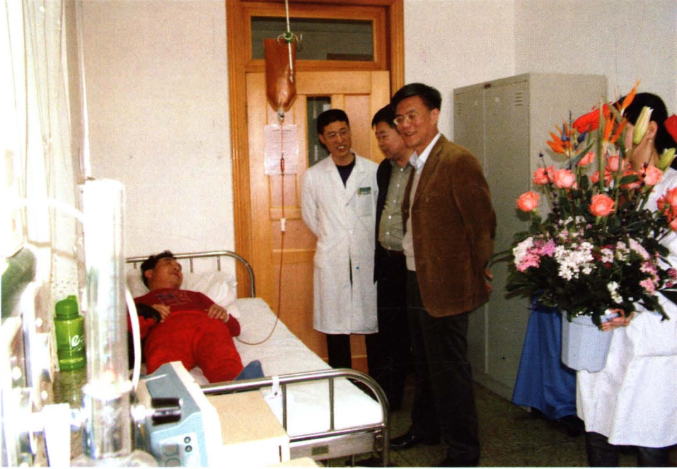
市委副书记杨立宪来院视察工作