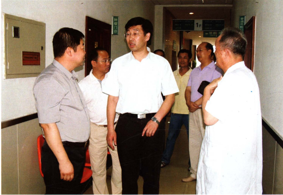
副市长吴军来院视察工作