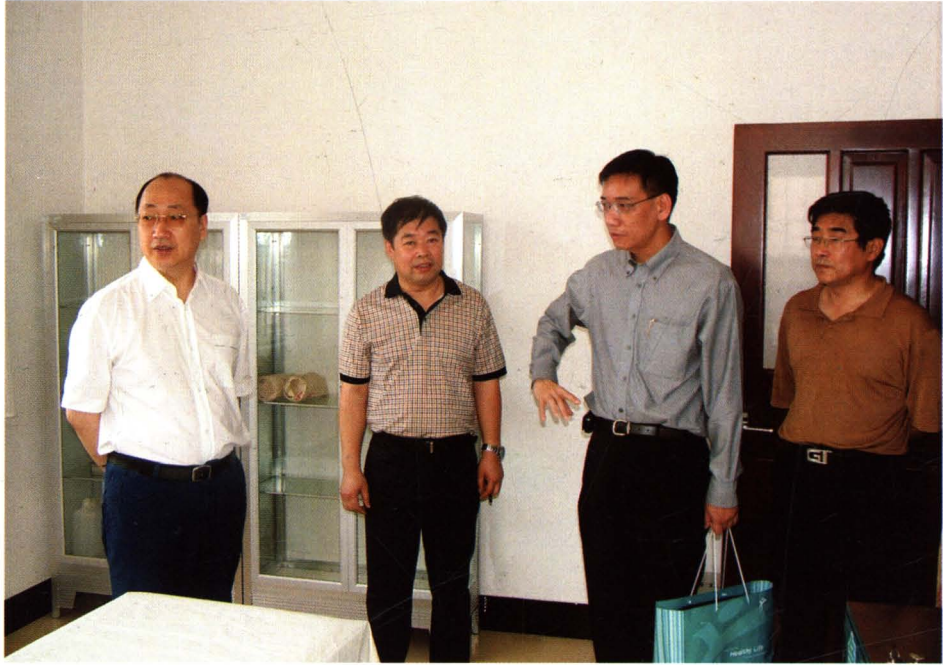
市卫生局随锡君局长陪同新加坡医疗组织来院考察