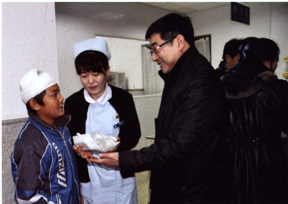
大年三十院党委书记到病房看望住院的藏族小患者