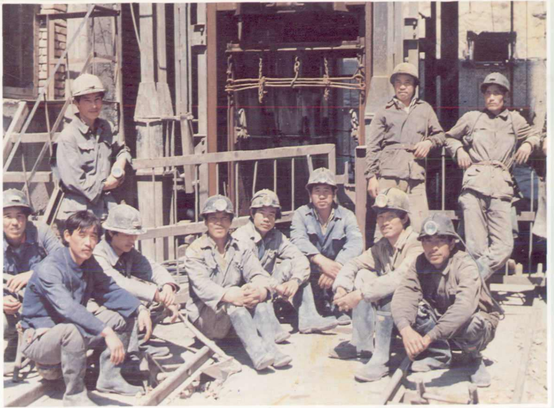
煤炭第一工程处山西大同工区的建井工人