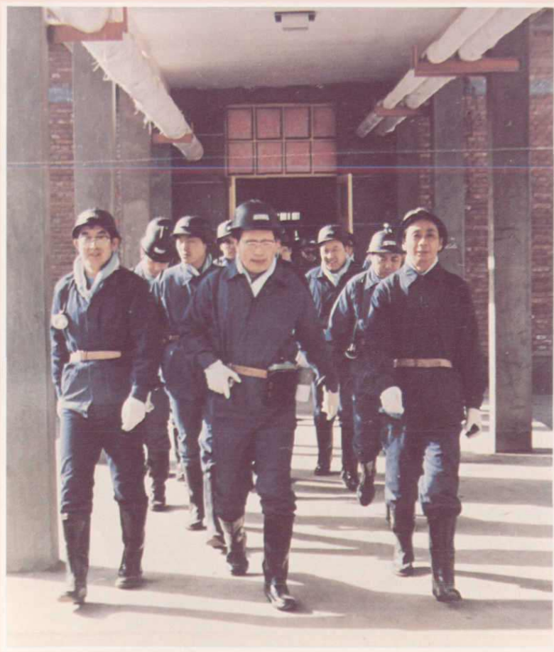
1990年元月,甘肃省省长贾志杰来靖远矿务局视察工作,并深入魏家地煤矿井下了解生产情况,慰问看望生产工人。图为准备下井前的情景。