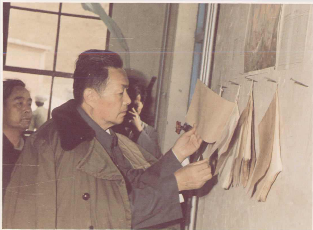
1985年10月3日，原煤炭部副部长许在廉视察矿区。图为在局王家山煤矿机房检查工作记录。