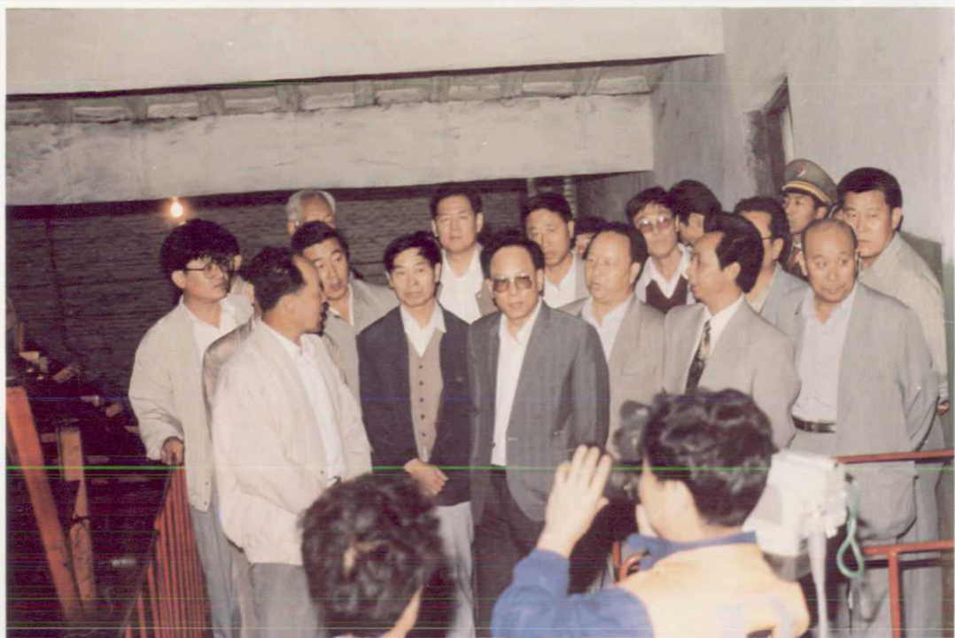
1994年8月,煤炭部部长王森浩视察靖远矿务局。图为在红会一矿主井口了解生产情况。