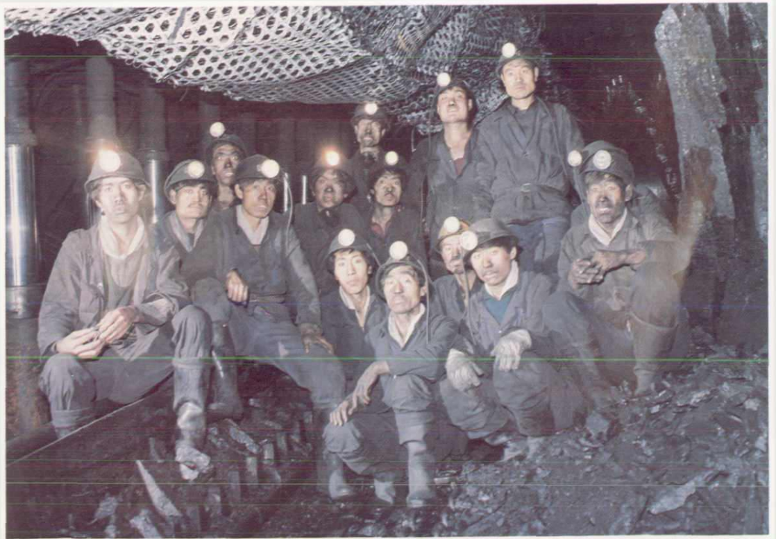
红会一矿综采队的采煤工人