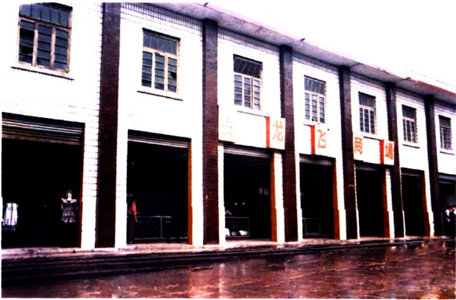
飞龙供销社龙飞商场