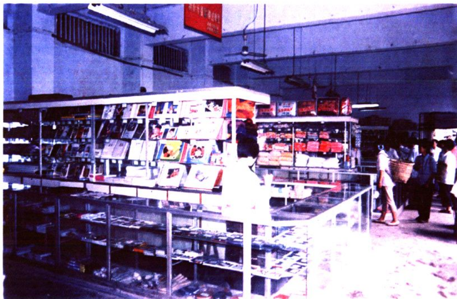
县日杂公司物价计量先进单位商场（二）