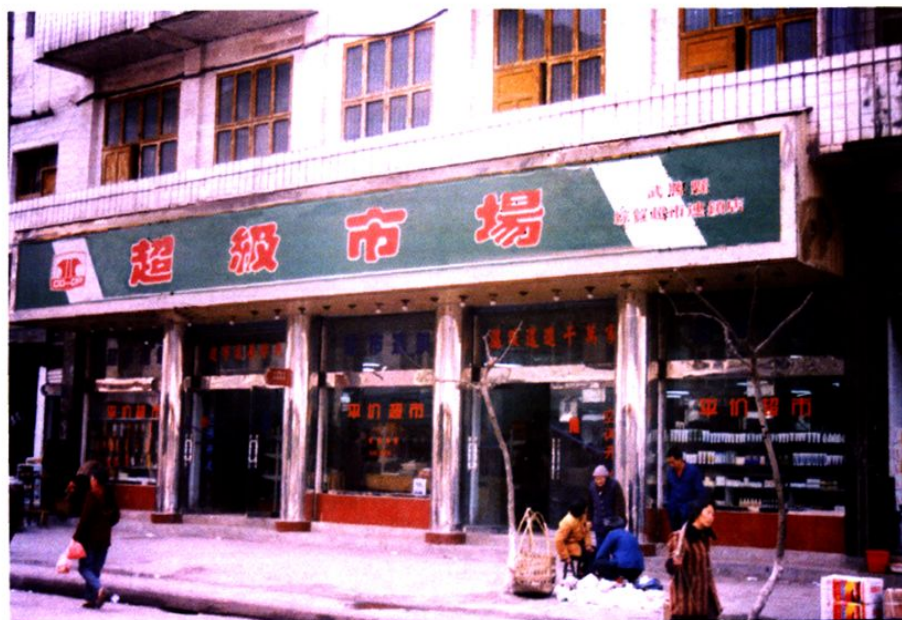
武胜县综贸公司商场（一）