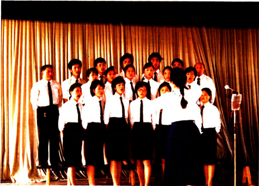
县农资公司参加1989年迎国庆歌咏比赛