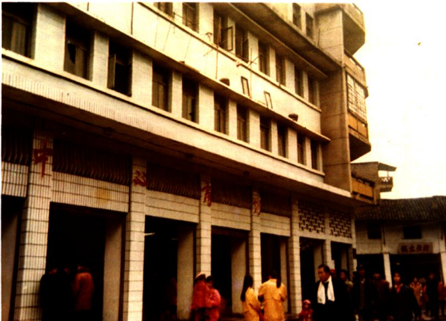
中心供销社中心商场