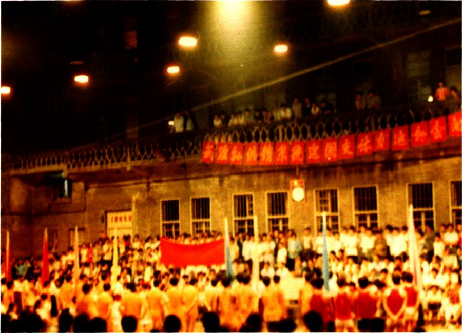
1989年县供销合作社系统迎国庆体育运动会