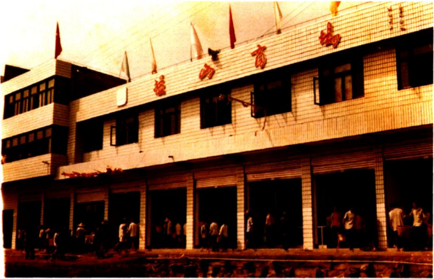
乐善供销社猛山商场