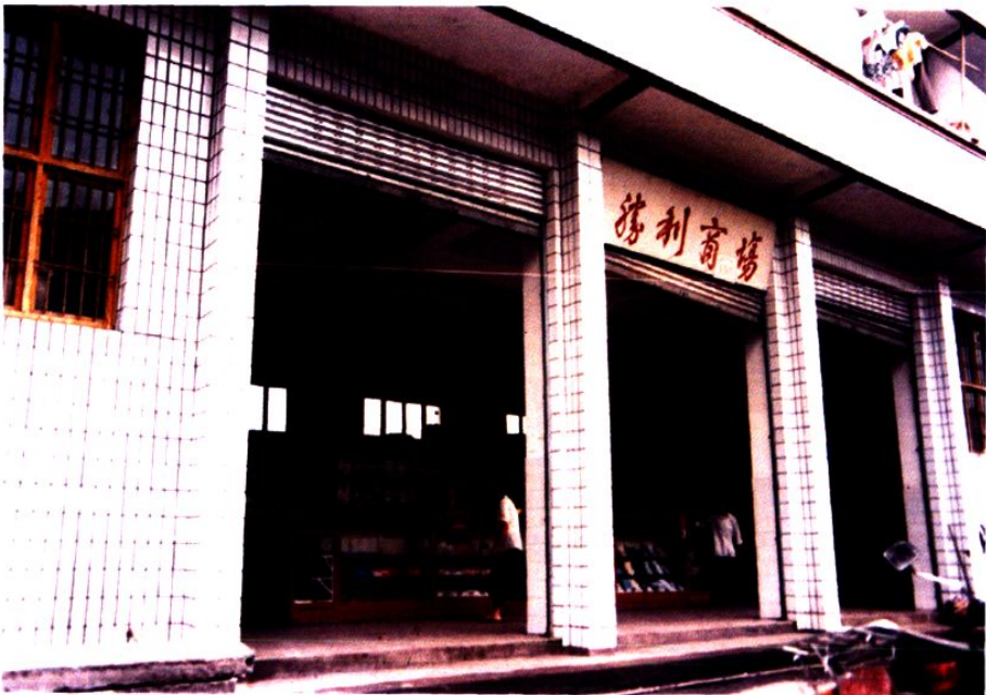
烈面供销社胜利商场