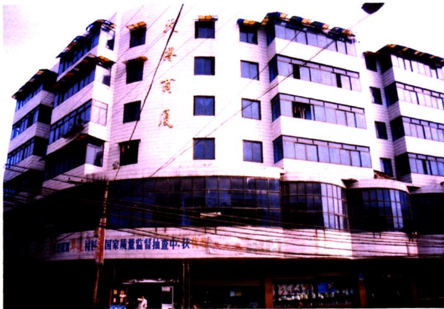
沿口镇供销社《天博商厦》大楼