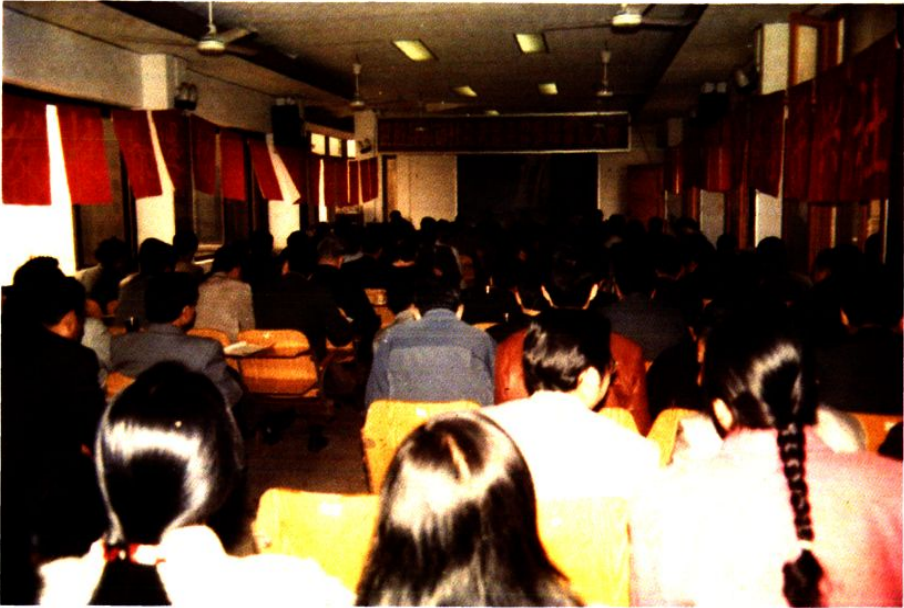
县供销合作社系统1995年工作总结大会现场