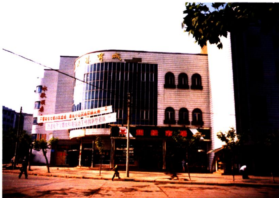
武胜县供销合作社联合社办公大楼