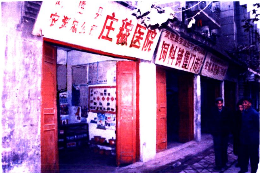
武胜县农资总公司庄稼医院及为农服务门市