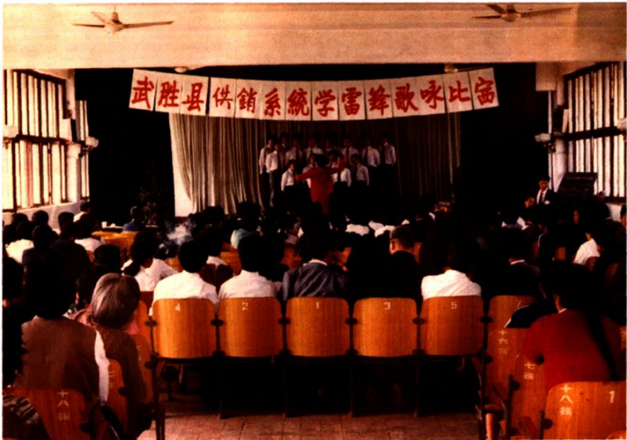
1990年武胜县供销合作社系统学雷锋歌咏比赛