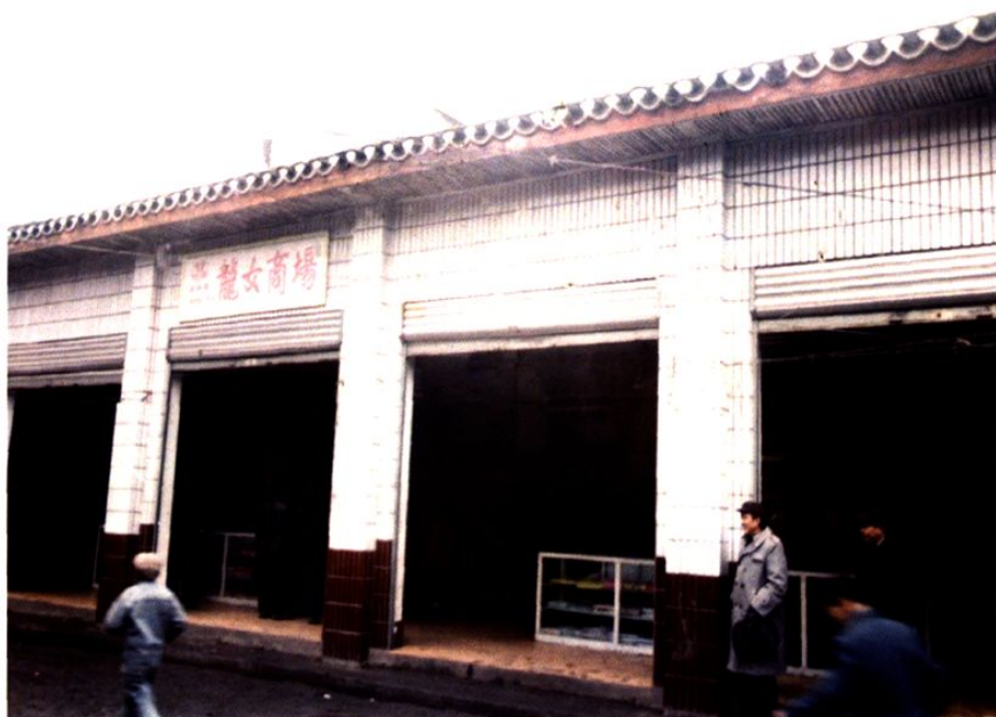
万善供销社龙女商场