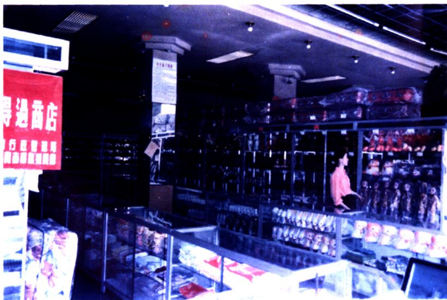
县日用杂品公司信得过商场（一）