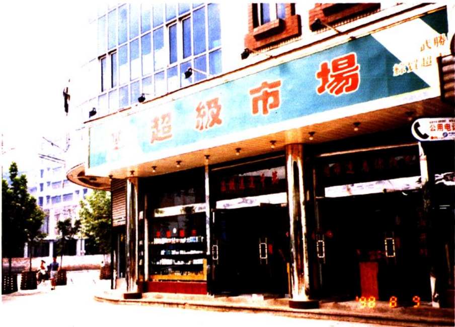
武胜县综贸公司商场（二）