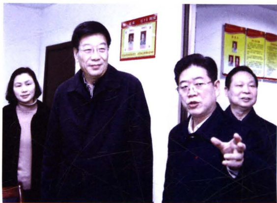
2013年3月1日，省委书记、省人大常委会主任徐守盛（左二）在蒸湘区考察基层网格化工作