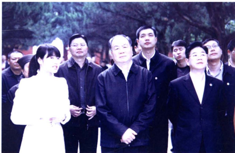
2013年4月11日， 原中共中央政治局委员、 中央政法委员会副书记 王乐泉（前中）视察南岳