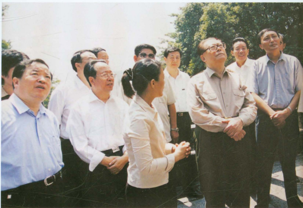
2003年9月，原中共中央总书记、国家主席、中央军委主席江泽民（右三）视察南岳