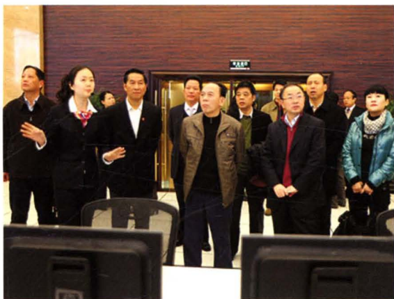
2010年12月，原省委常委、政法委书记吴向东（前中）视察高速公路监控指挥中心