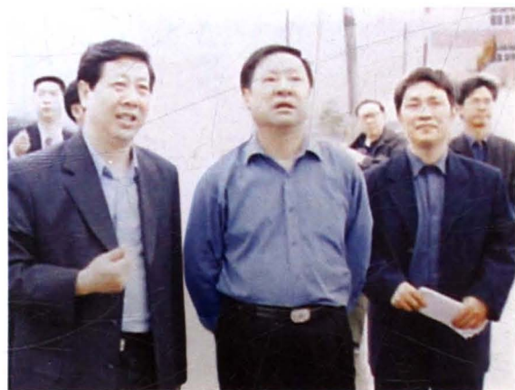
2000年，时任省委副书记、省长储波 （前中）在衡阳县考察