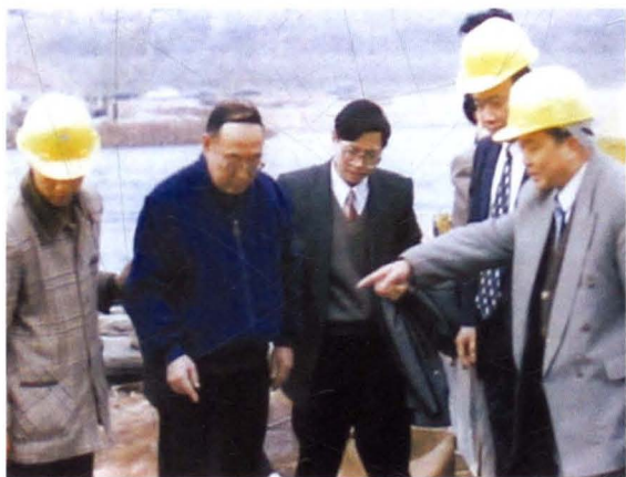
1996年，原省长、时任省政协主席刘正 （左二）莅衡考察