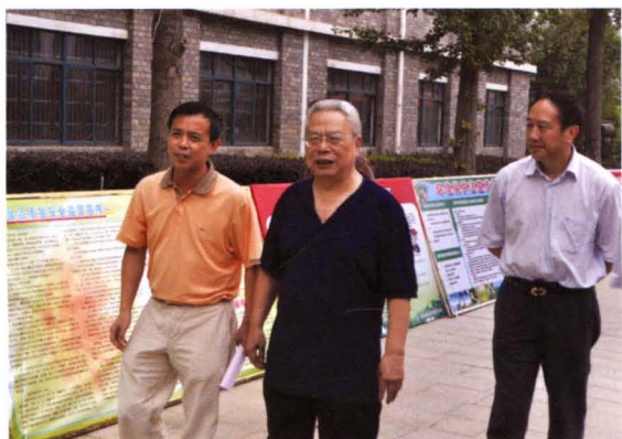
2010年9月，原省委常委、政法委书记朱东阳（中）莅临衡阳市检查普法工作