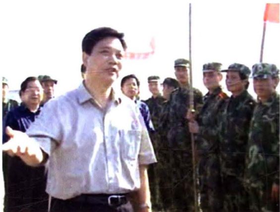
2002年8月，时任省委副书记、省长 张云川（前左）在抗洪抢险一线考察