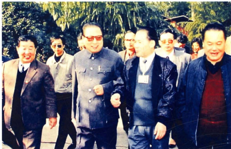
1992年11月，时任中共中央政治局常委、中 央政法委书记兼中央综合 治委主任乔石（前排左 二）来衡视察；左一、书 记熊清泉，省委副 记、省长陈邦柱