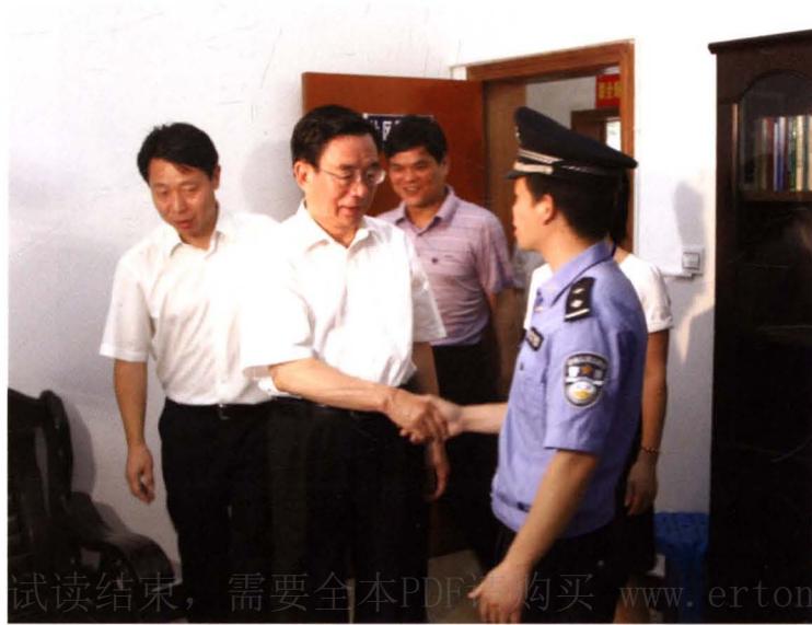
2011年5月8日，时任中共 中央政治局常委、中央纪委 书记贺国强（中）视察联合 新村社区警务室