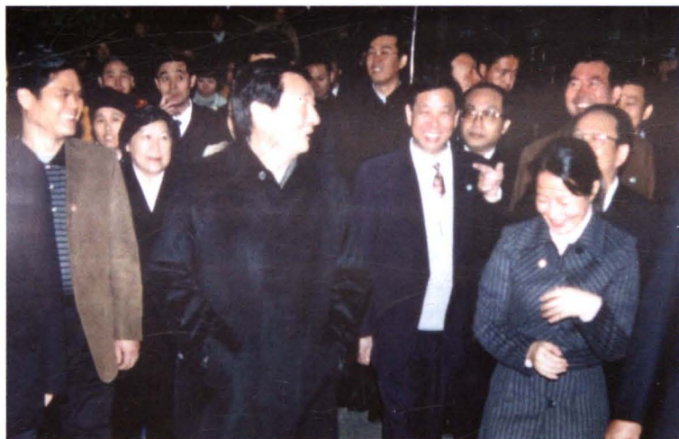
2003年11月， 原中共中央政治局 常委、国务院总理 朱镕基（前中）在 南岳视察