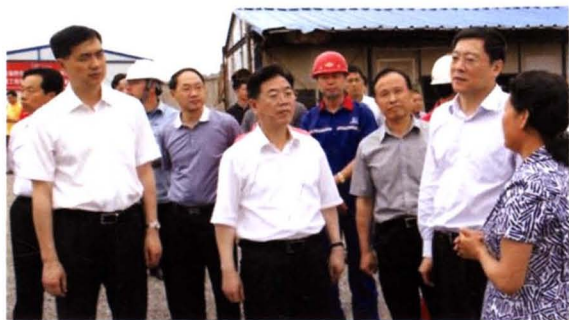
2014年5月26日，省委 副书记、省长杜家毫（右 二）莅衡考察调研