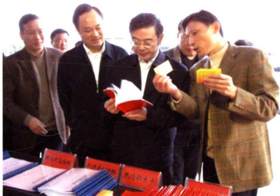
2010年12月，时任省委书记周强（前排右二）莅衡考察群众工作