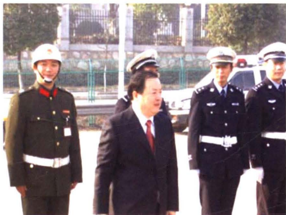
2006年1月，时任省委副书记、省长 周伯华（左二）慰问一线干警