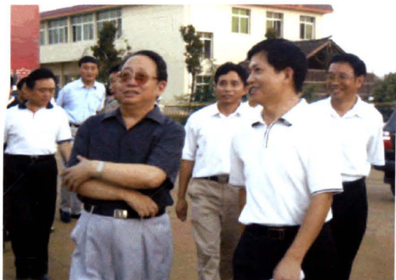
2004年，时任省委书记杨正午（前左）在大浦工业园考察