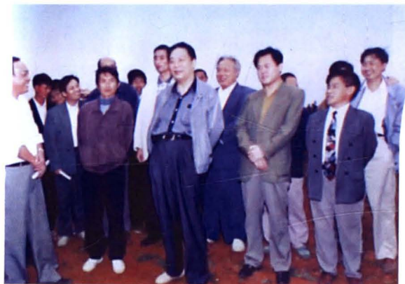
1995年，时任省委书记王茂林（前中）莅临衡阳考察