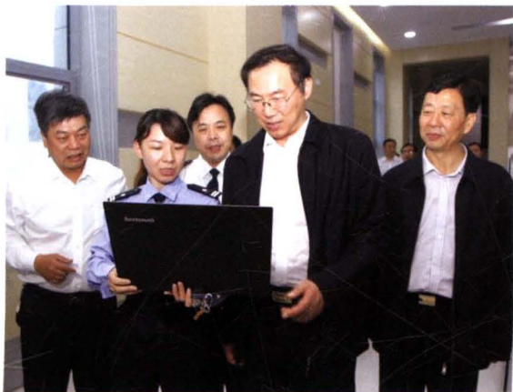
2014年5月19日，省委常委、政法委书记、省公安厅厅长孙建国（右二）在衡阳指导公安工作