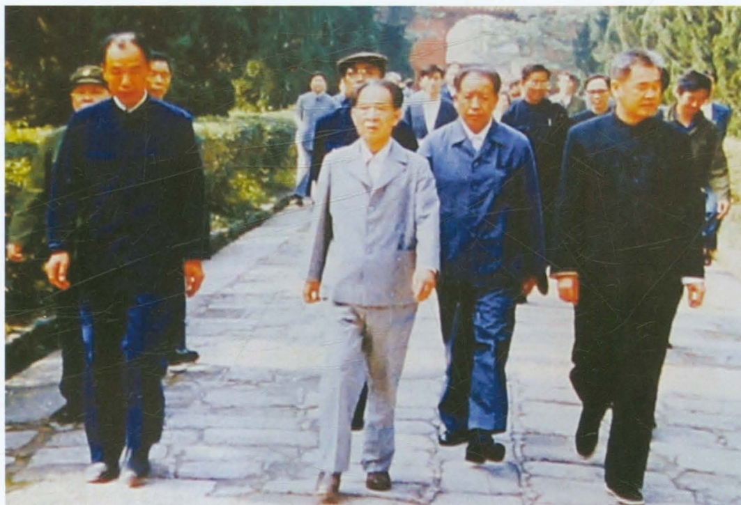
1984年5月，时任中共中央总书记胡耀邦（前中）视察南岳