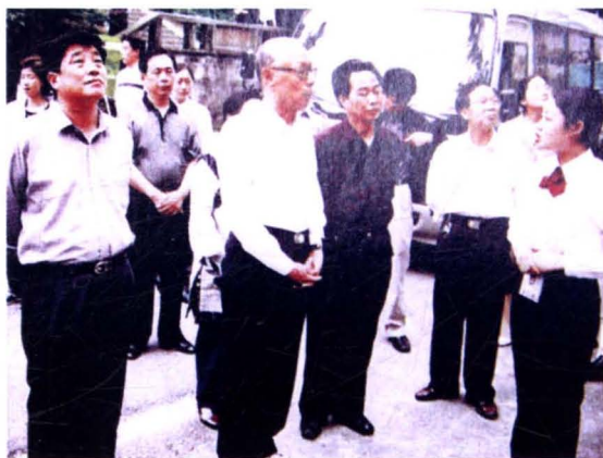
2002年5月，原中共中央 书记处书记、中央政法 委书记任建新（前中） 视察南岳