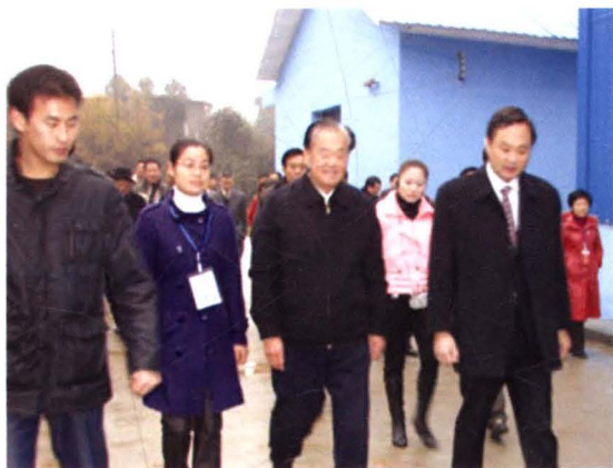
2008年12月，原湖南省 委书记、第九届全国政 协副主席毛致用（前中） 莅衡视察