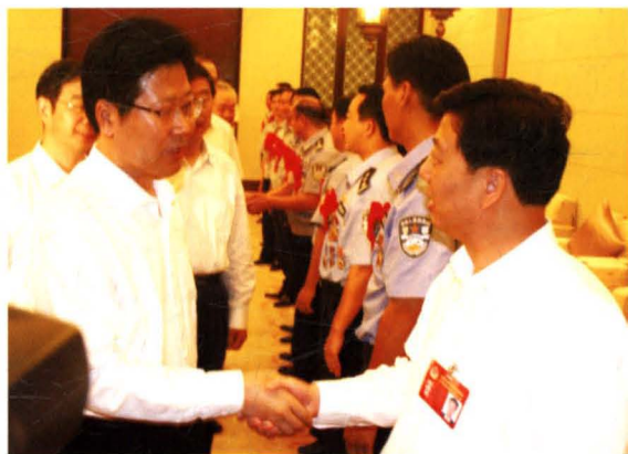
2007年5月，时任省委书记张春贤（前左）等接见政法领导干部和英模代表