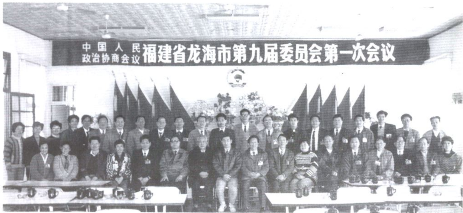
市委领导、历届主席和九届常务委员会合影