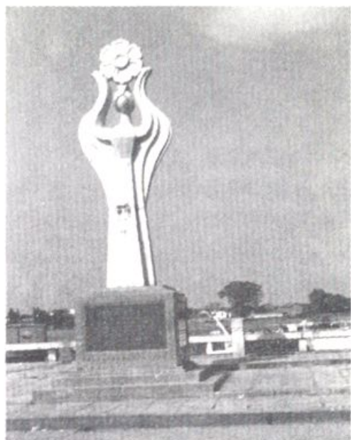
上图：政协倡议 集资重建的锦江 道和碑记