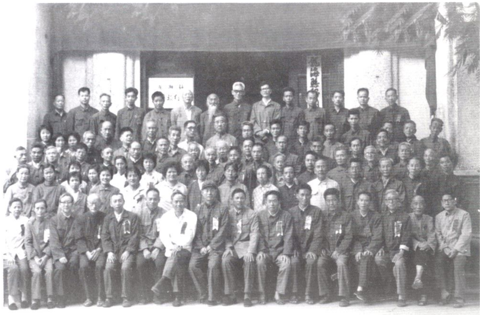
政协龙海县第五届委员会第一次会议合影 1980.10