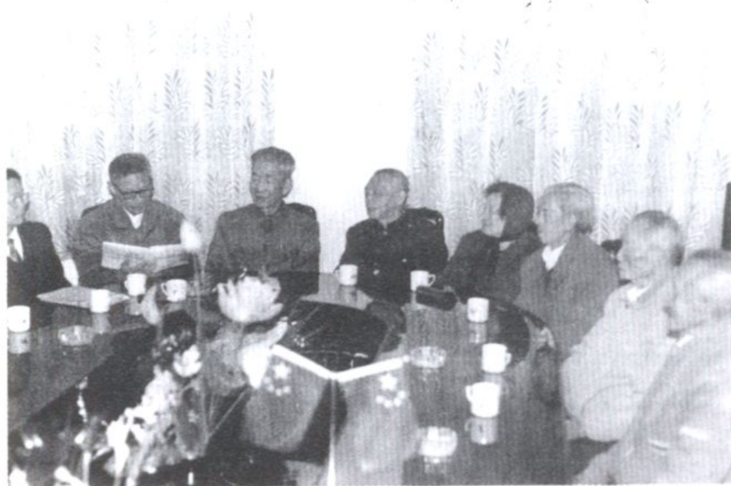
坚持数十年勤学不辍的老委员学习组