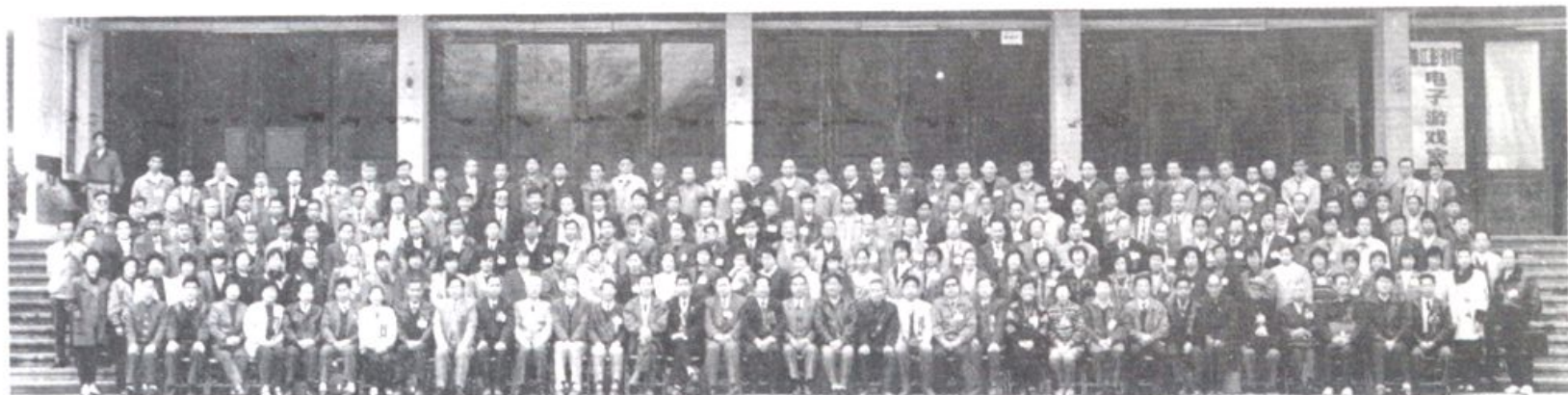
中国人民政治协商会议福建省龙海市第九届委员会第一次会议