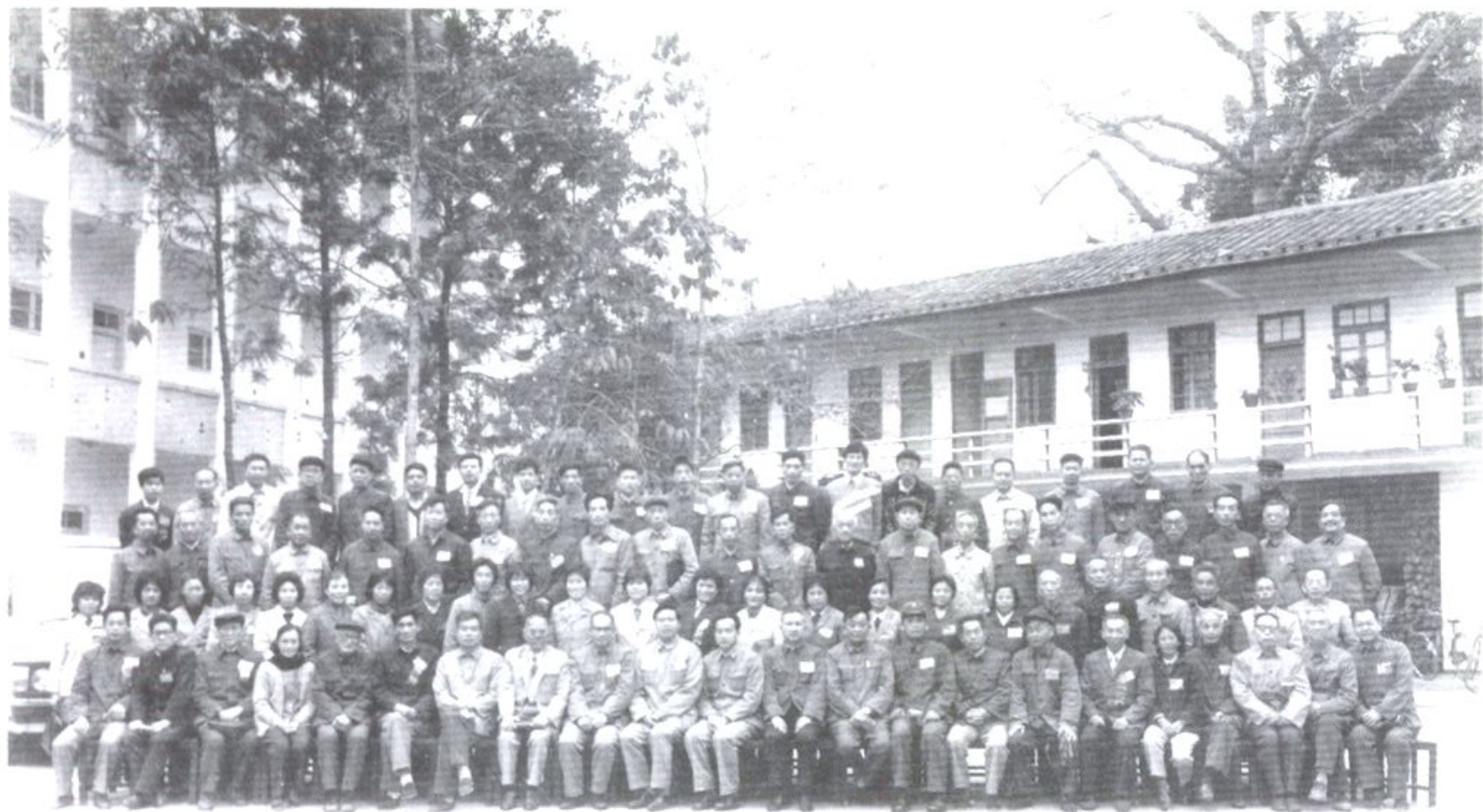
政協龍海縣第六屆委員會第一次會議合影 一九八四年十二月二十一日