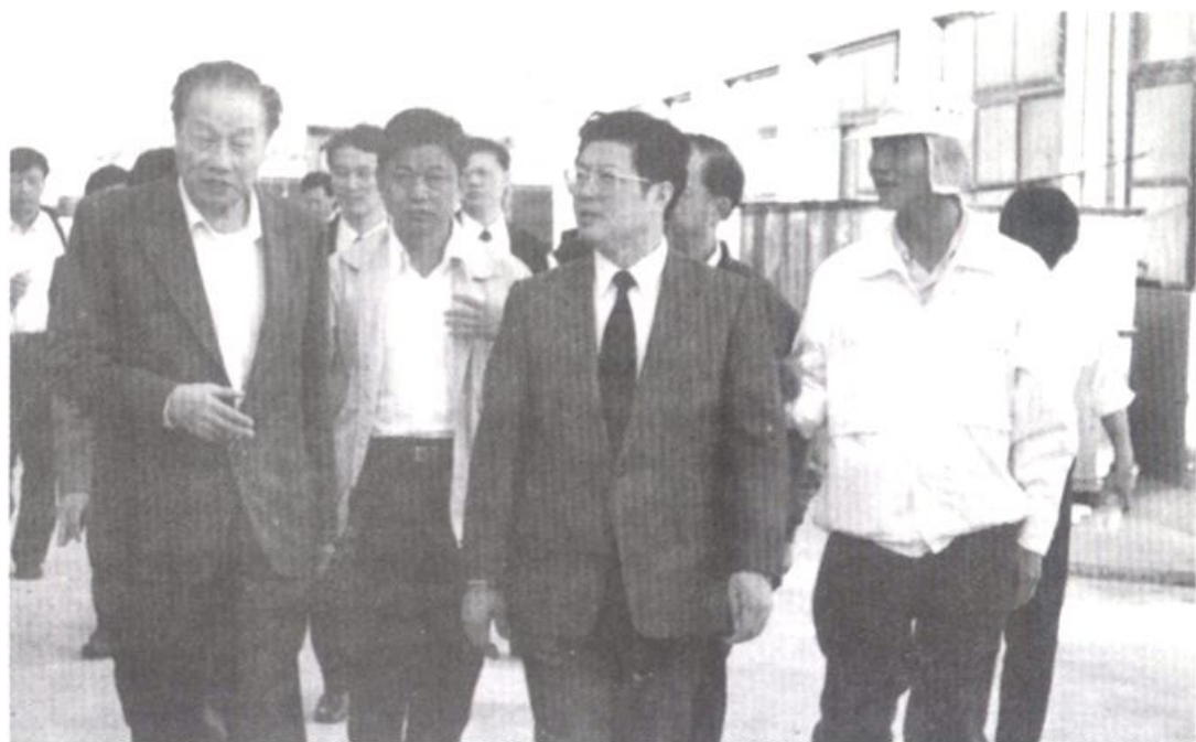
1993年11月，全国政协副主席王兆国（右2） 到龙海视察“三资”企业