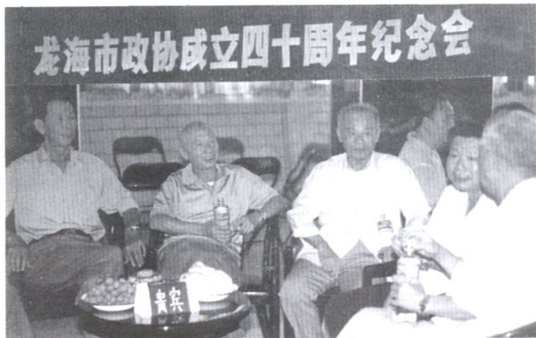
下图:1996年,举行龙海政协成立四十周年纪念活动。历届主席欢聚一堂。