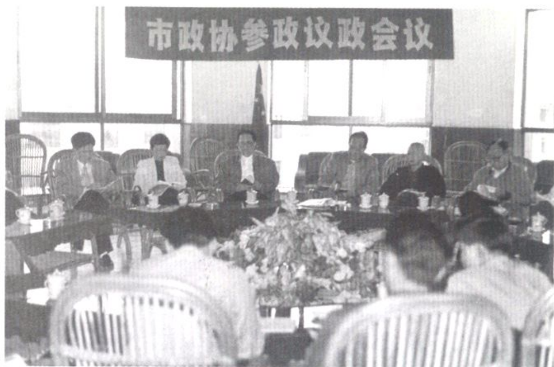
市长康君福出席参政议政会听取意见