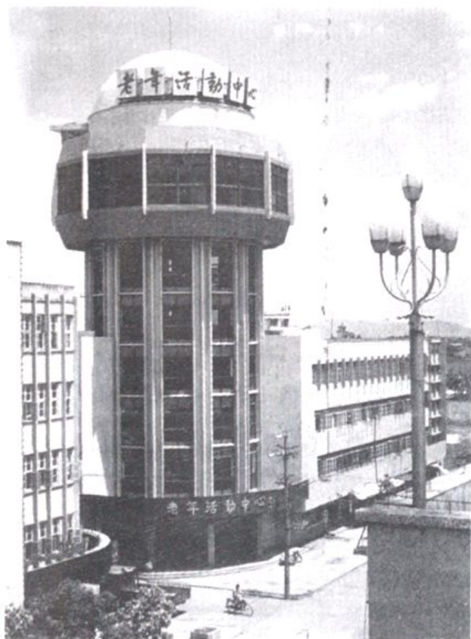
下图：政协牵头 集资兴建的老年 活动中心