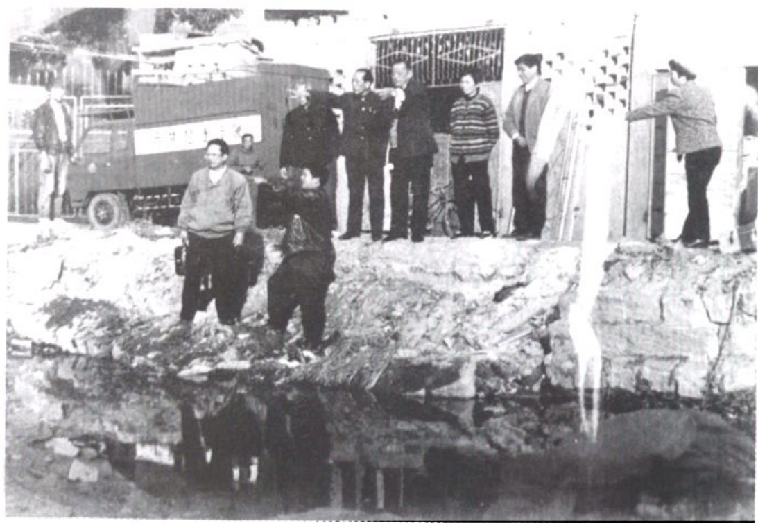
文教卫体委视察治理市区蔡港排污情况