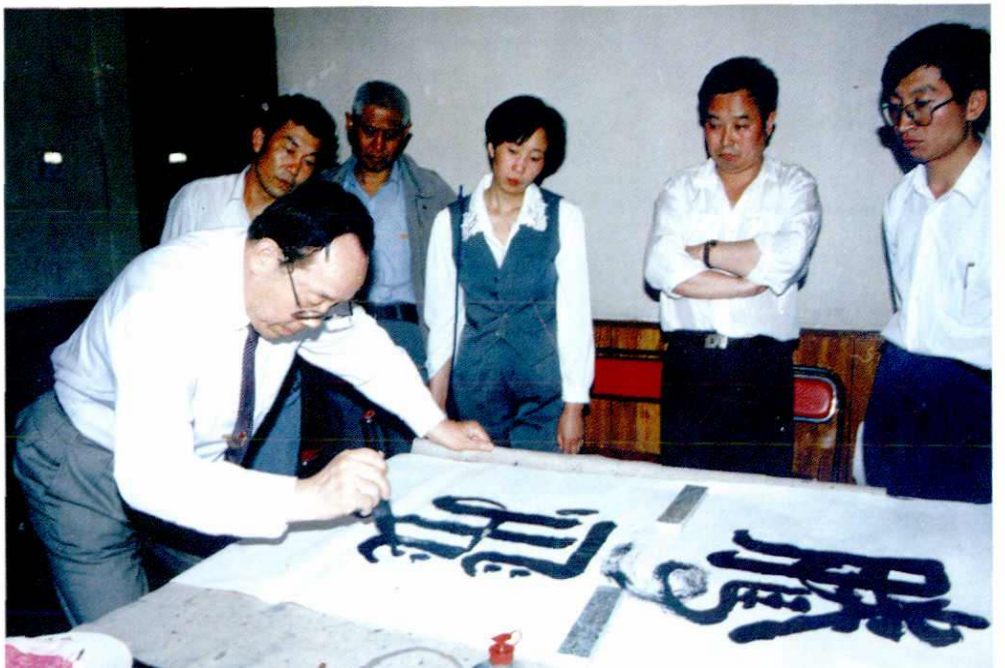
原水电部副部长赵庆夫 (左二) 来局视察工作