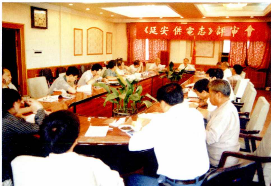
《延安供电志》评审会