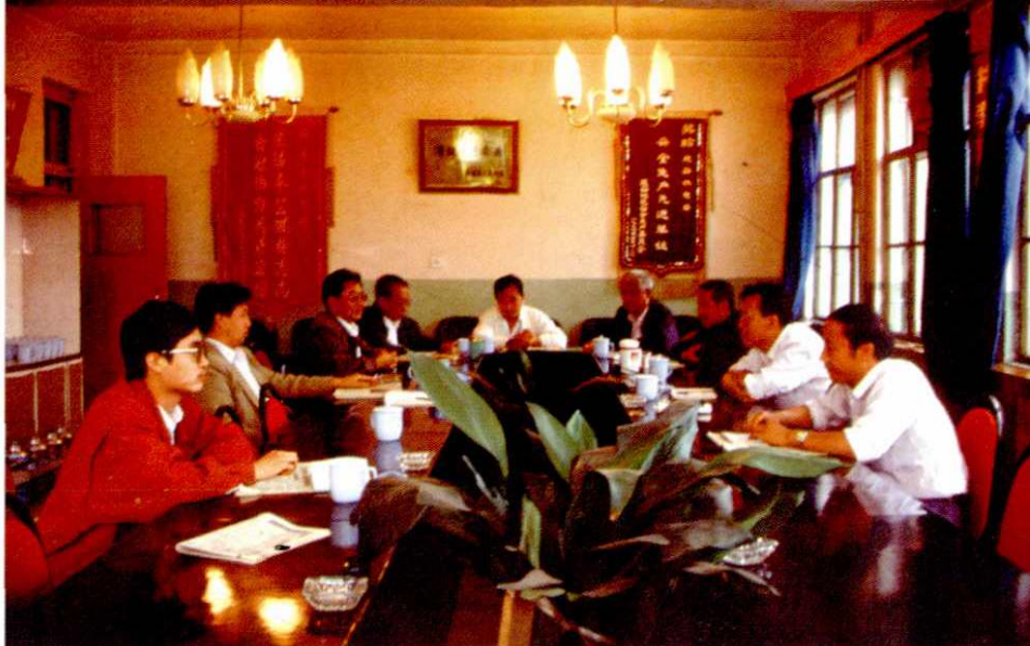
局机关领导在研究工作