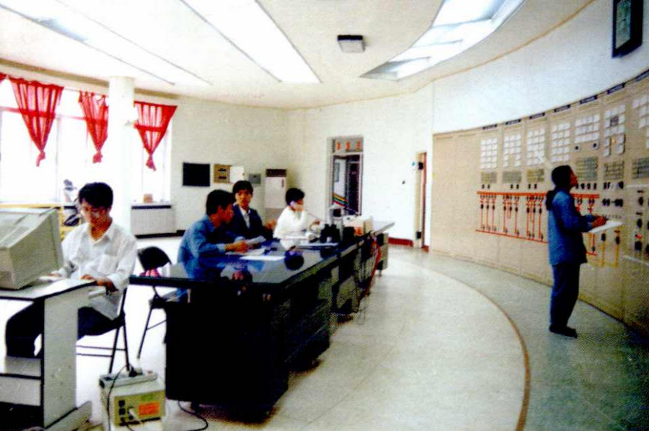
延安330千伏变电站主控室