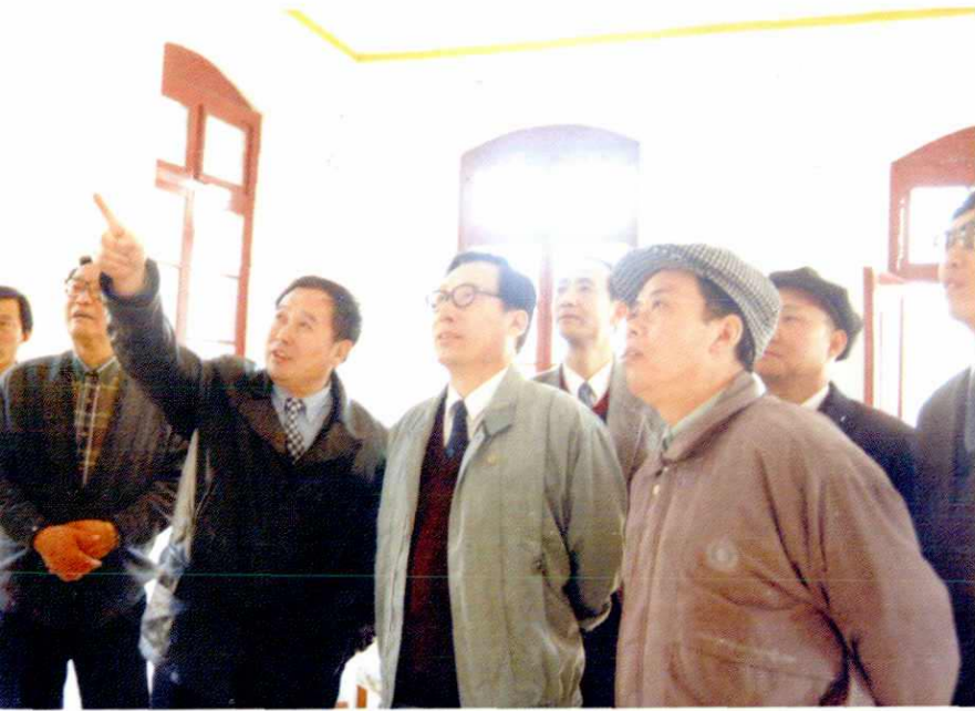
电力部副部长陆延昌 (右二) 来局视察工作