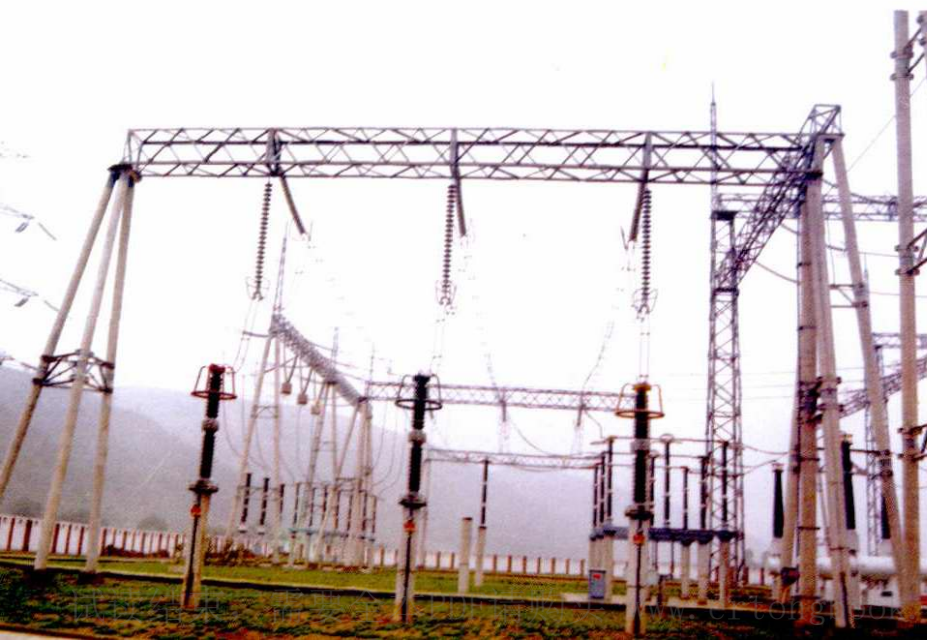
延安330千伏变电站设备区一角