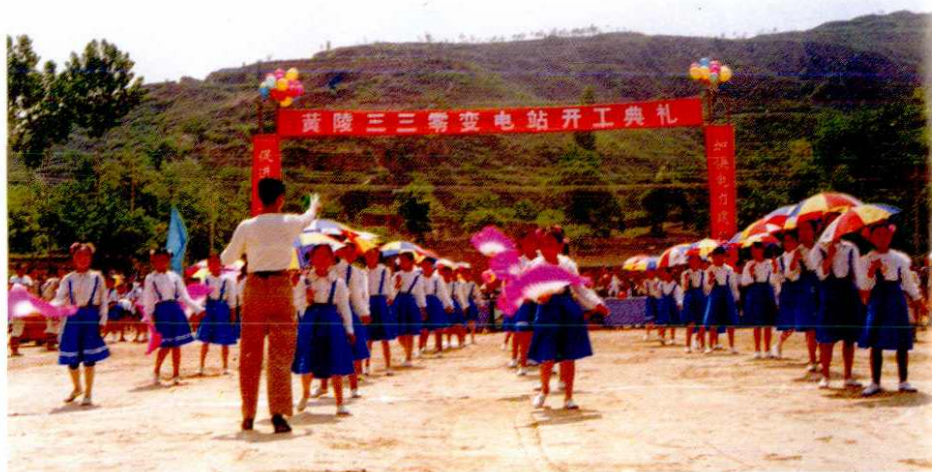
黄陵330千伏变电站开工典礼