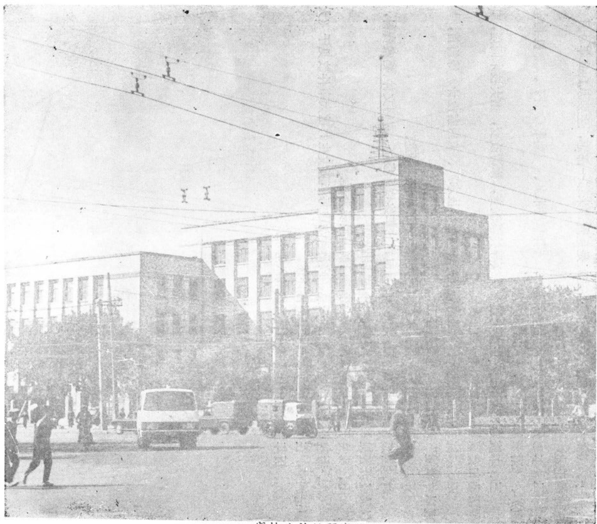
省林业计设研究院