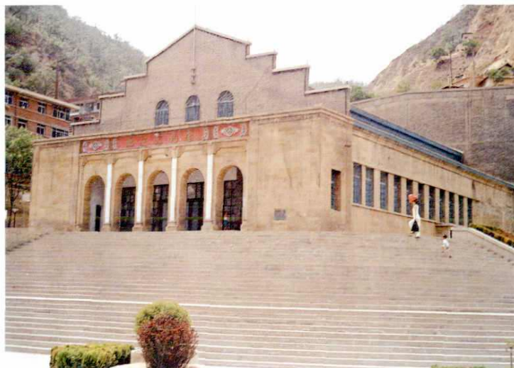
陕甘宁边区大礼堂 (2000年11月)