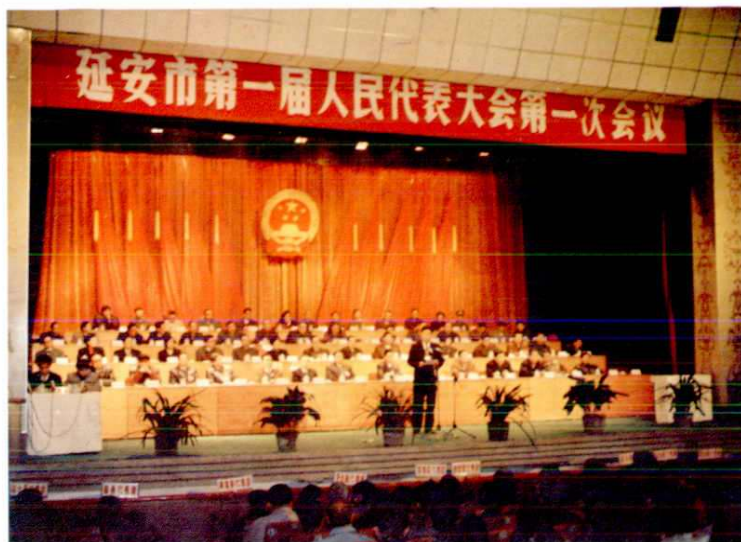
延安市第一届人民代表大会 第一次会议会场 (1997年1月)