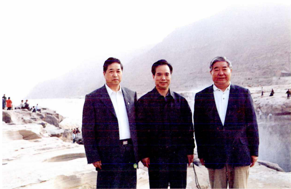
中共陕西省委书记、省人大常委会主任李建国（中）、省长程安东（右一）在延安市人大常委会主任张志清（左一）的陪同下视察黄河壶口（1998年）