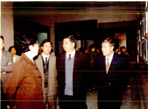
全国人大常委会副委员长陈慕华（左一）在陕西省人大常委会副主任李天文（右一）陪同下来延，由延安市人大常委会主任张志清（右二）陪同参观延安革命纪念馆（1997年9月）