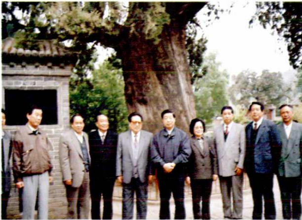
全国人大常委会委员长乔石（左四）与省市领导在黄帝陵参观（1996年）