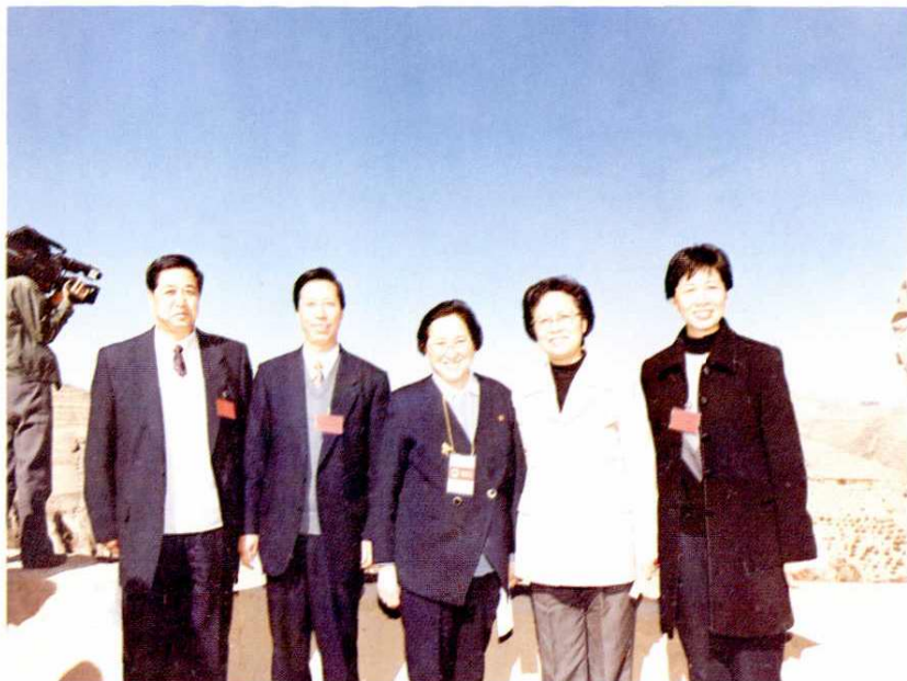
全国人大常委会副委员长何鲁丽（中）在中共陕西省委副书记范肖梅（右二）陪同下来延视察，延安市委书记高宜新（左二）、市人大常委会主任张志清（左一）、市长王侠（右一）陪同视察（1999年9月）