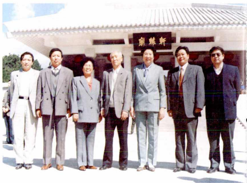
全国人大常委会副委员长陈慕华（右三）在中共延安市委副书记忽培元（右二）、市人大常委会副主任郭慧君（左三）、市人大常委会秘书长樊高林（左二）的陪同下视察黄帝陵工程（1997年9月）