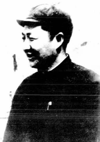
陕甘宁边区第三届参议会代议长习仲勋