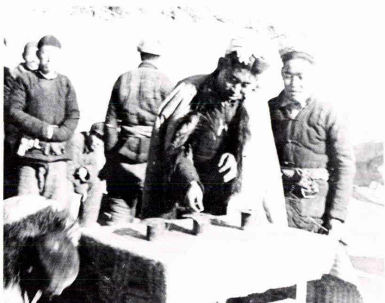
陕甘宁边区群众用投票的方式 进行民主选举 (1938年)