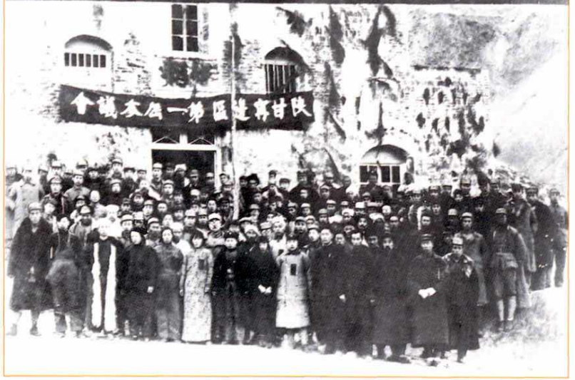
陕甘宁边区第一届参议员合影 (1939年)