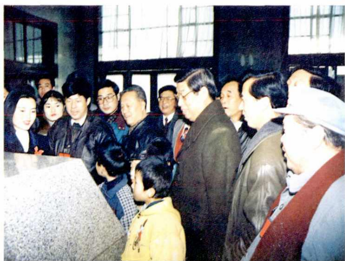
陕西省人大常委会主任张勃兴（右四）参观延安革命纪念馆