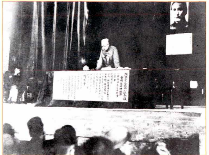
林伯渠在陕甘宁边区第二届参议会 会上作政府工作报告