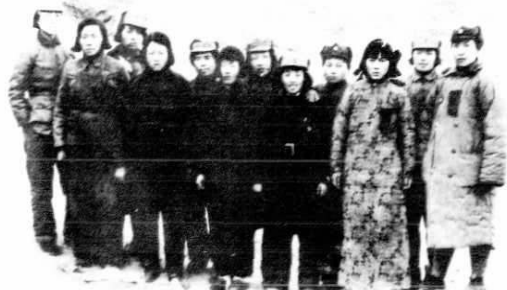
陕甘宁边区女参议员 (1939年)