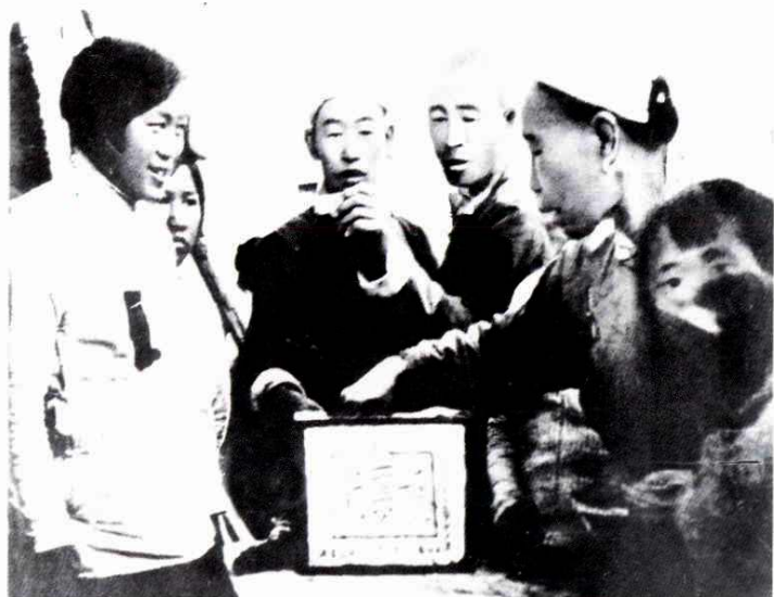
投票选举为自己办事的人