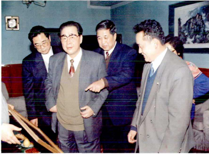
国务院原总理、现全国人大常委会委员长李鹏于1996年春节来延安，与延安人民一起欢度春节。图为中共延安地委原副书记、行署专员张志清（右二），副书记白灏辰（右一）陪同李鹏（左二）参观