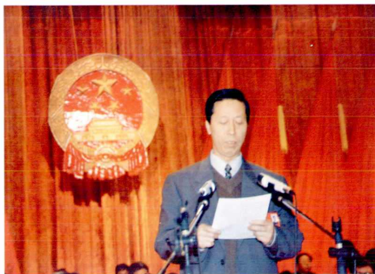
中共延安市委书记高宜 新在大会上讲话 (1997年1月)