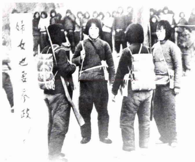
妇女也要参政 (1939年)