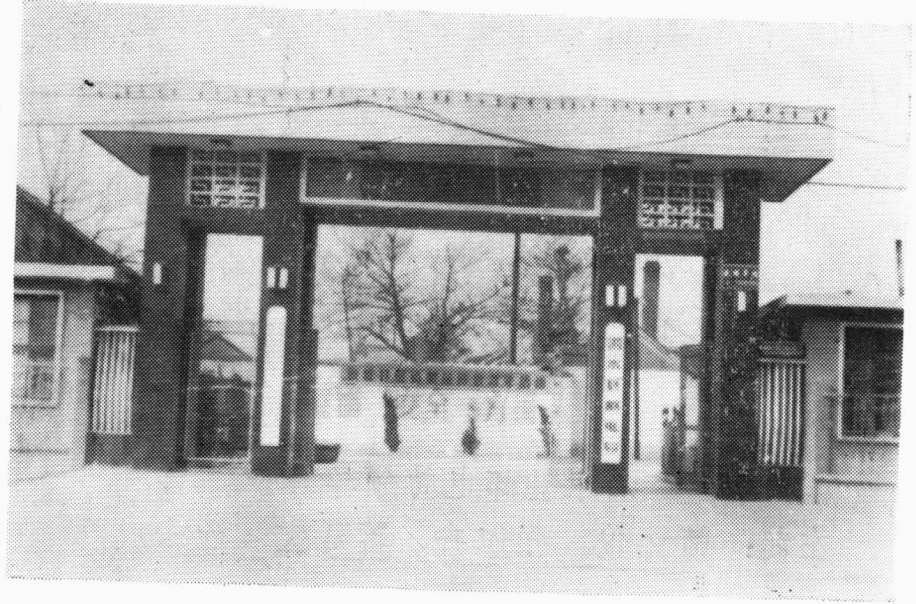
泗水县邮电局大门