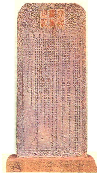
天妃灵应之纪念碑