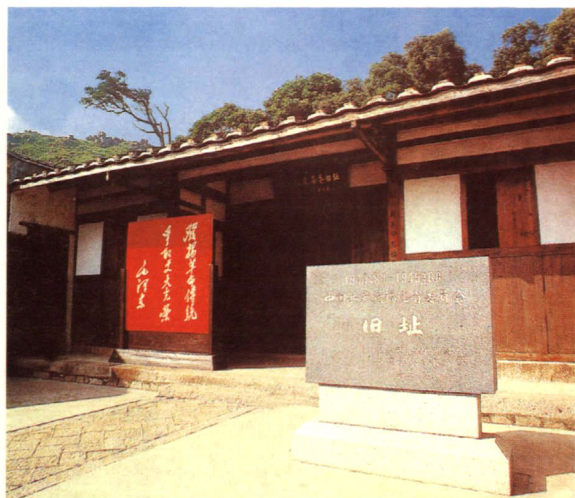
中共福建省委旧址（1944年6月-1945年6月）