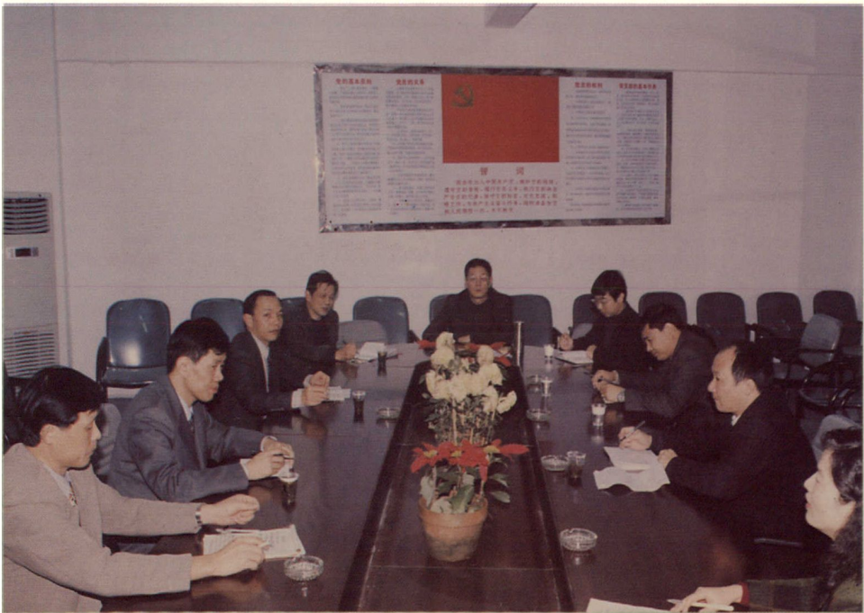
长乐市建委领导班