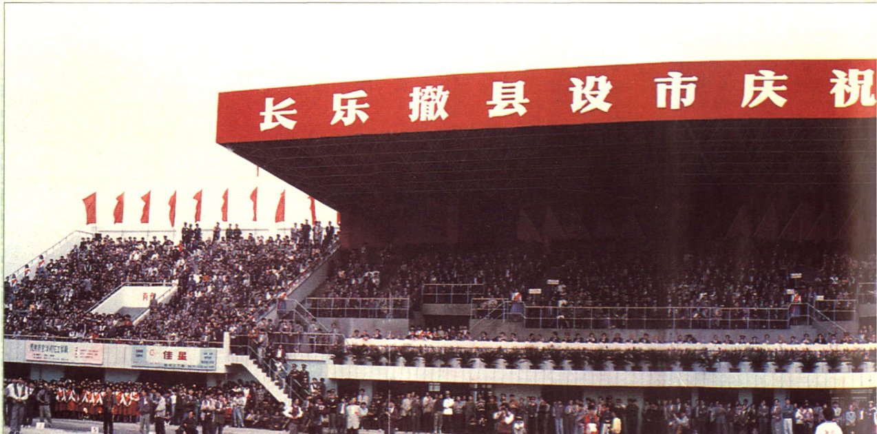
长乐撤县设市庆祝大会主席台（万人体育场）