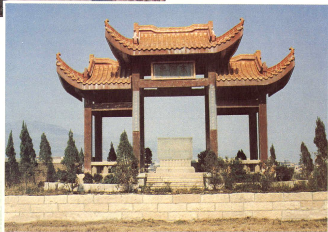
琅尾港歼敌（日本）纪念碑