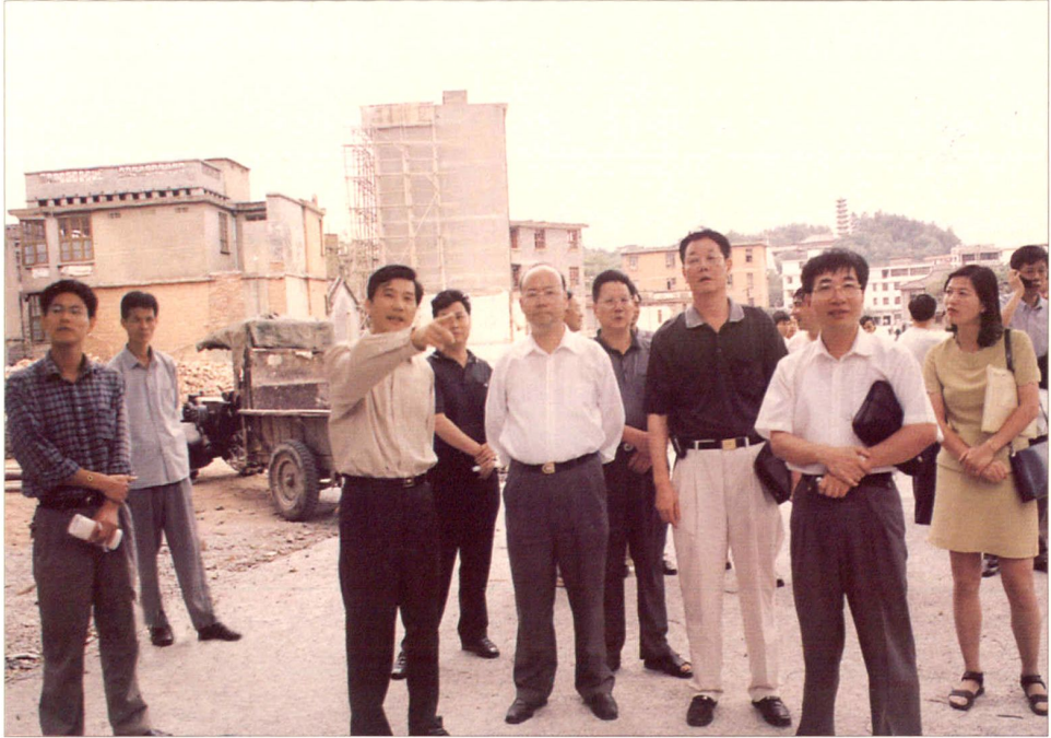
市委、市政府领导视察城建工作