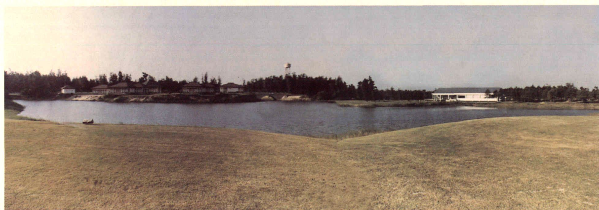
海峡奥林匹克城18洞高尔夫球场