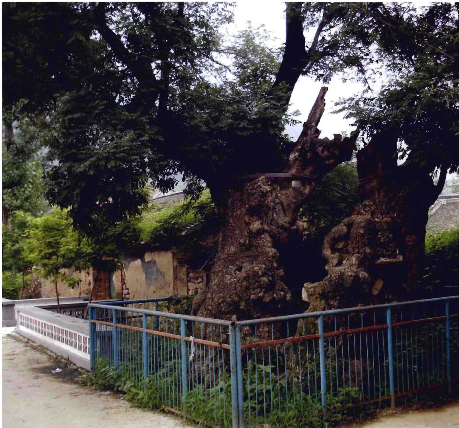
大华山镇瓦官头村五道庙前老槐树