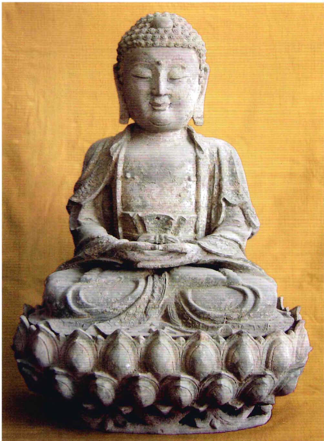
镇罗营镇东寺峪村沐浴庵铜佛像