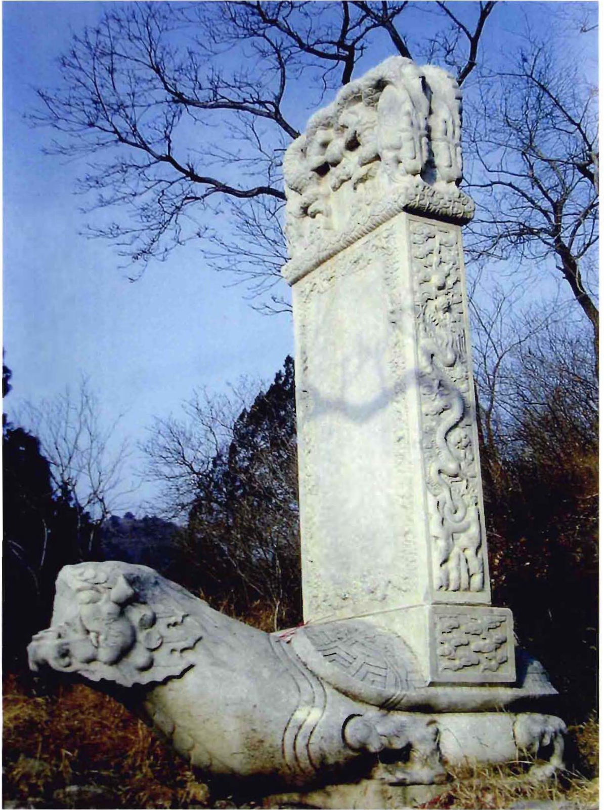
刘家店镇北吉山村丫髻山所存清康熙三子胤祉丫髻山行宫碑，摄于碑亭复建前