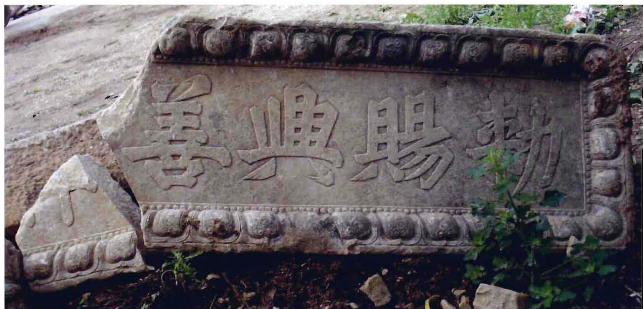
南独乐河镇峨嵋山村兴善寺所存敕赐兴善禅寺匾额