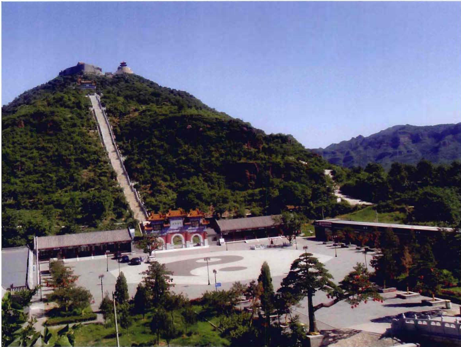
刘家店镇北吉山村丫髻山全景