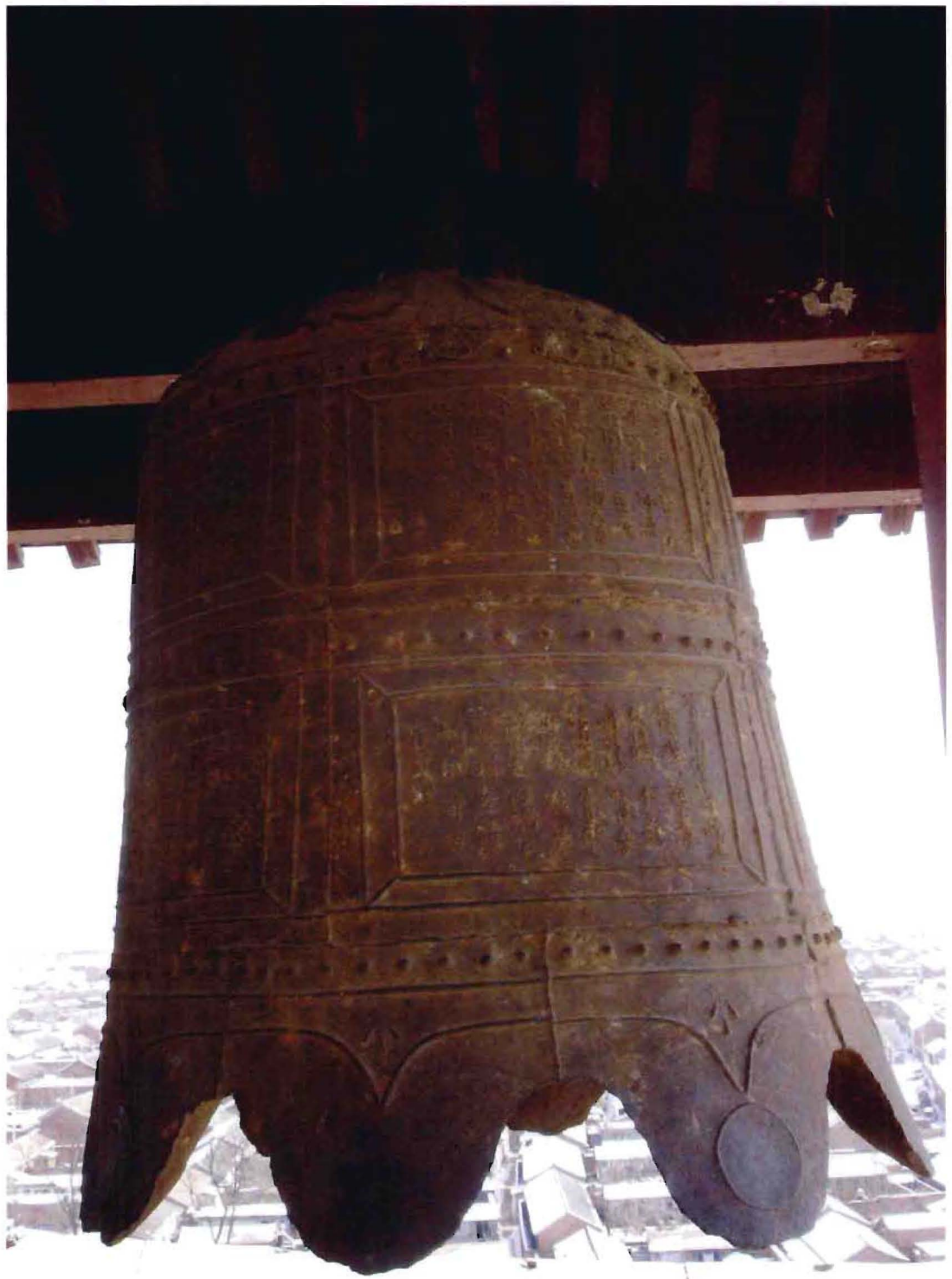
镇罗营镇关上村药王庙铁钟，现悬挂山东庄镇山东庄村轩辕庙钟楼内