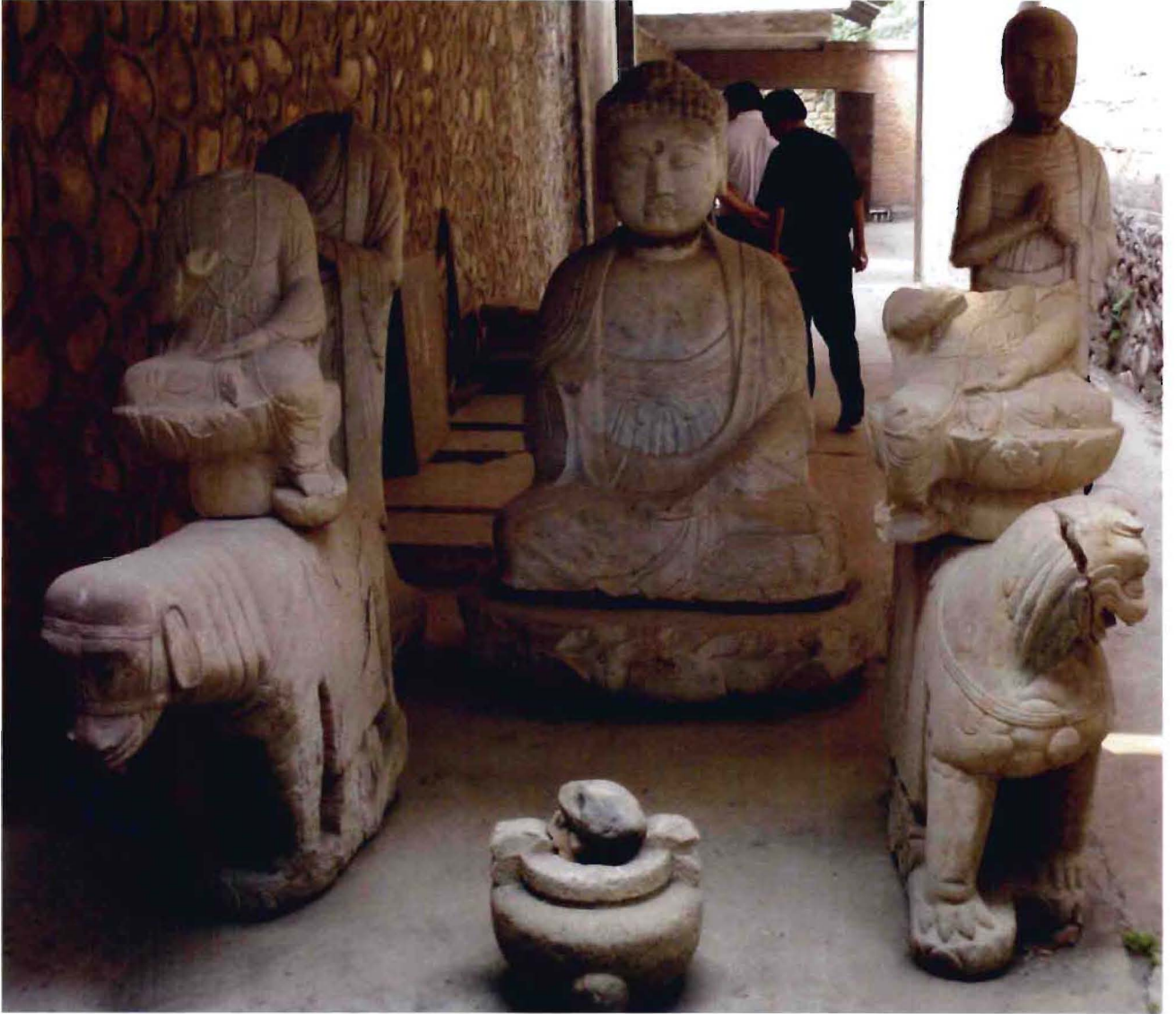
马坊镇石佛寺村石佛寺现存唐代石佛像