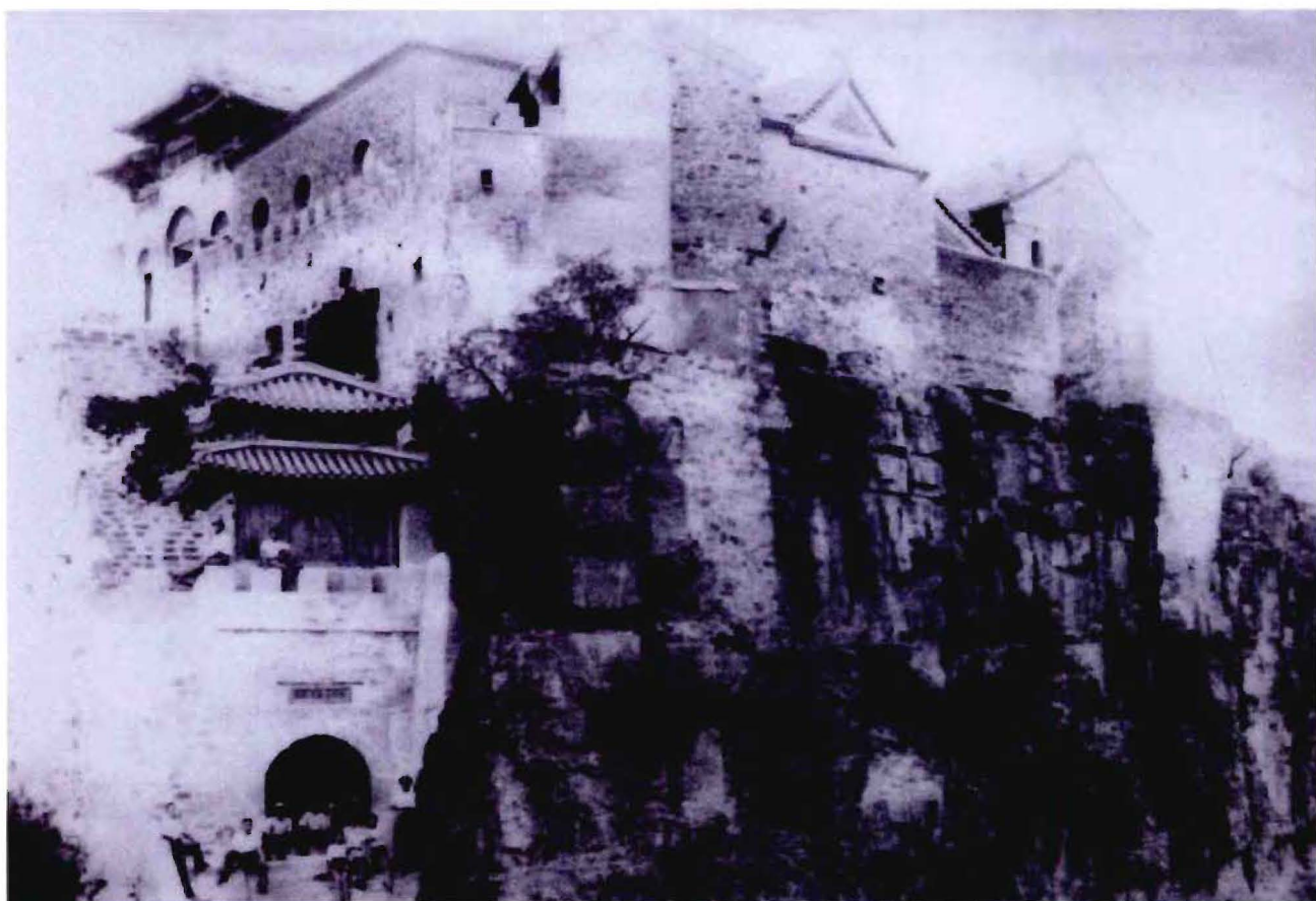
1947年丫髻山西顶旧照