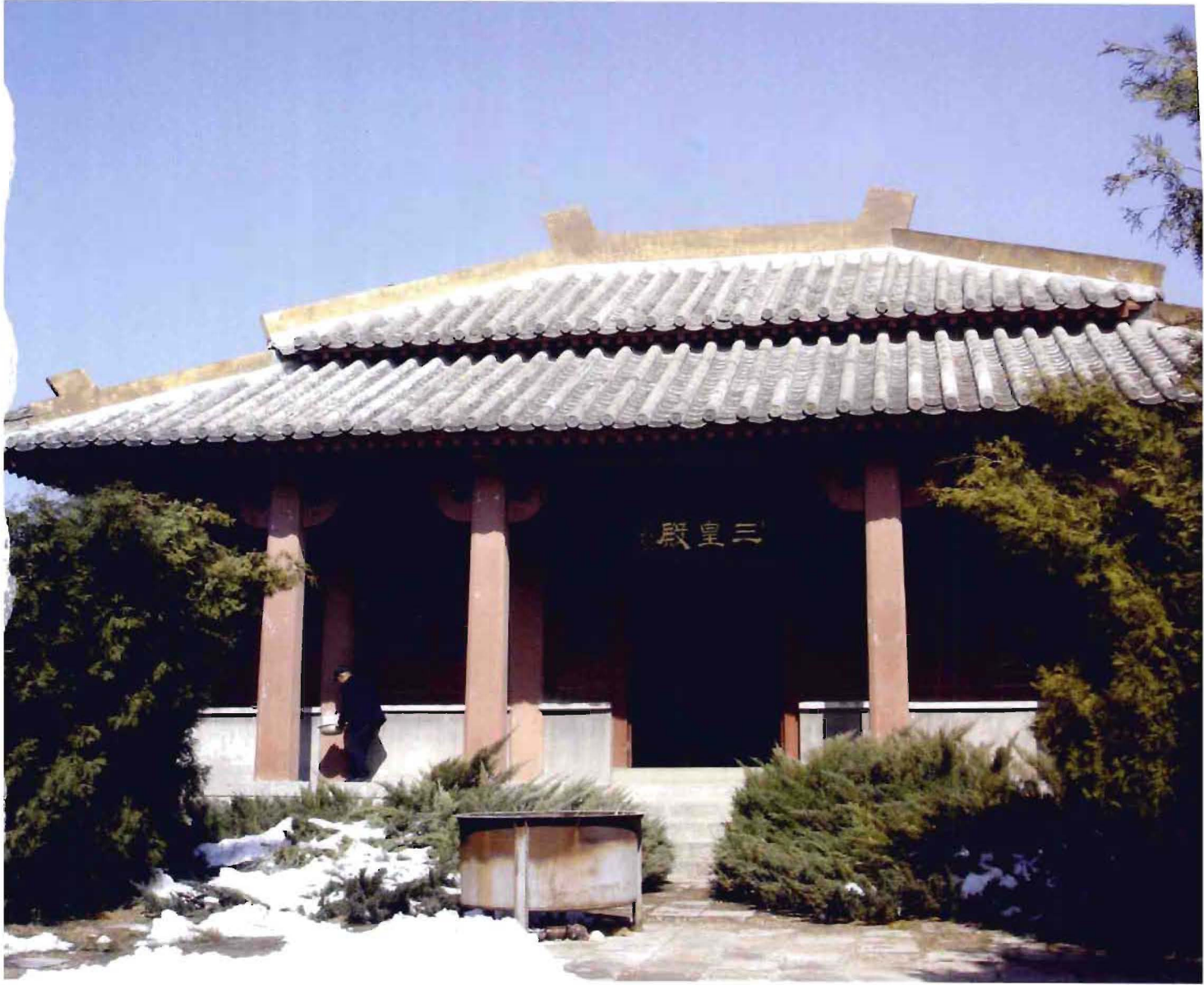
山东庄镇山东庄村轩辕庙大殿