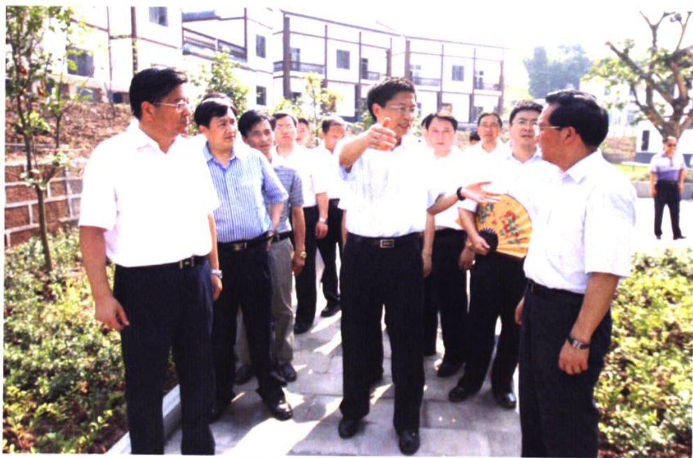
2009年，省委常委、副省长钟勉（中），市委书记、市人大常委会主任王建军（左一）在区委书记、区人大常委会主任蒋英胜（右一）陪同下视察代市镇岳庙农民新村建设