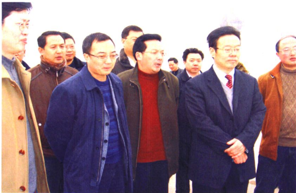
2009年2月3日，市委副书记、市长侯晓春（前右二）、区委书记、区人大常委会主任蒋英胜（前中），区委副书记、区长李永平（前左二）等检查以工代赈现代农业园建设情况