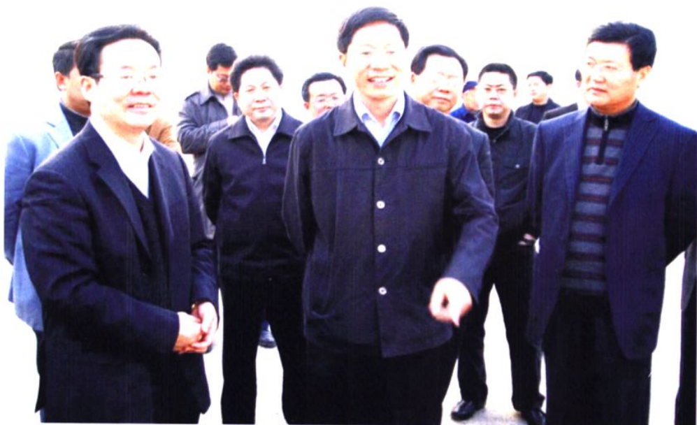
2009年3月9日，省委常委、副省长钟勉（中），市委副书记、市长侯晓春（左一），市委副书记、政法委书记余仪（右一）调研现代农业示范园区建设情况