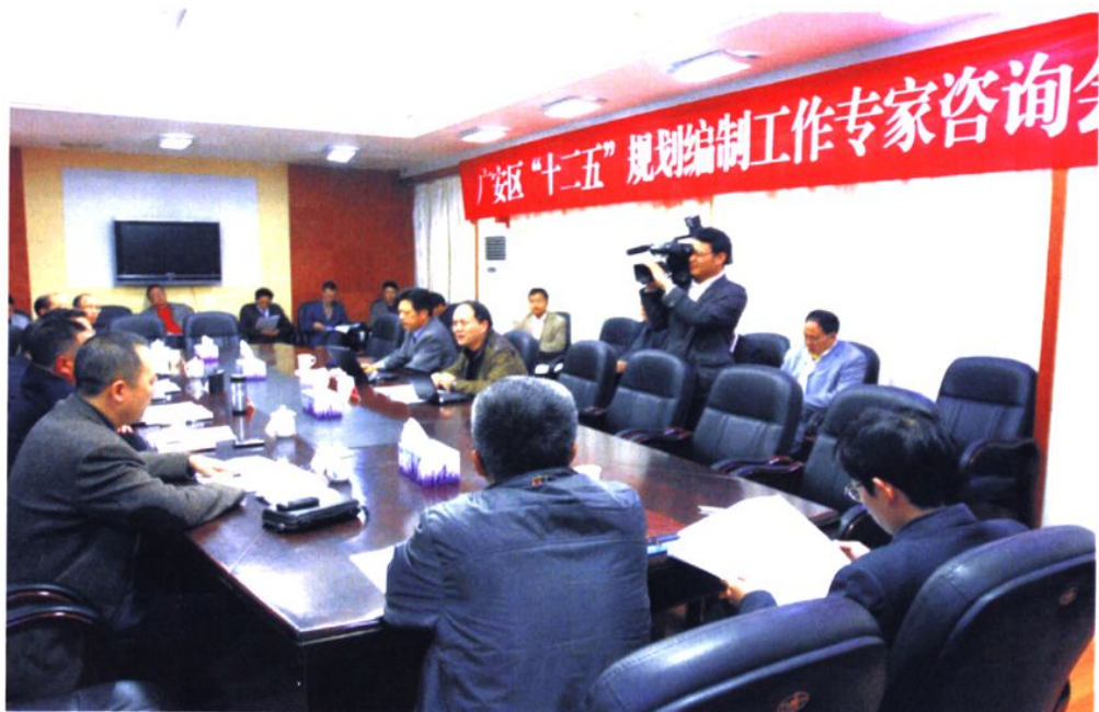
2009年，广安区召开“十二五”规划编制工作专家咨询会