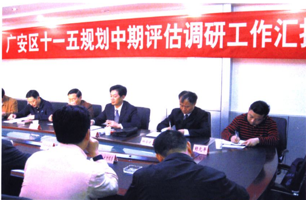
2008年，广安区十一五规划中期评估调研工作汇报会召开