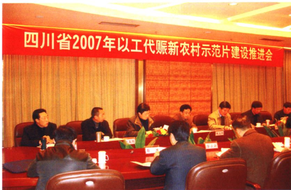
2007年，四川省以工代赈新农村示范片建设推进会在广安区召开