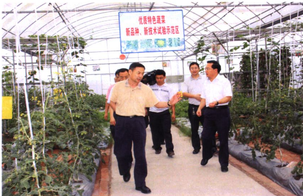
2009年，四川省农业厅厅长任永昌（前左一）在区委书记、人大常委会主任蒋英胜（前右一）陪同下在现代农业园区检查工作