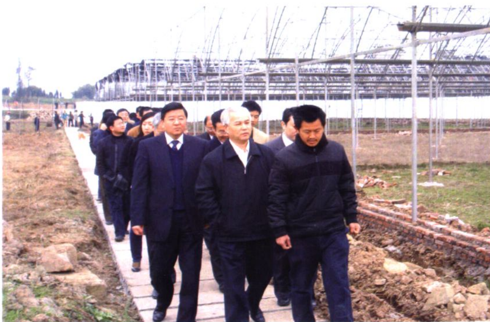
2009年2月19日，省政协主席陶武先（中），市委书记、市人大常委会主任王建军（左一）视察现代农业示范园区大棚蔬菜建设情况