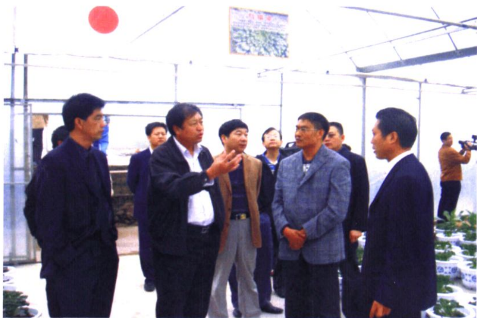
2009年10月14日，国家科技部农村司副司长郭志伟（左二）在市、区领导陪同下视察现代农业园区大棚蔬菜建设情况