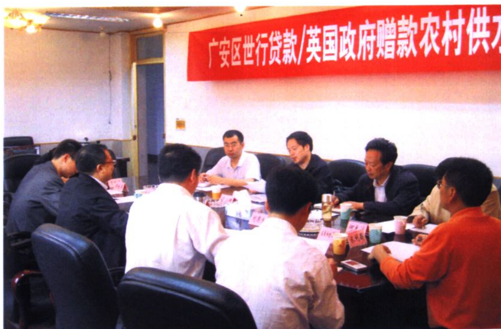
2009，广安区世行贷款农村供水和环境卫生项目汇报会召开