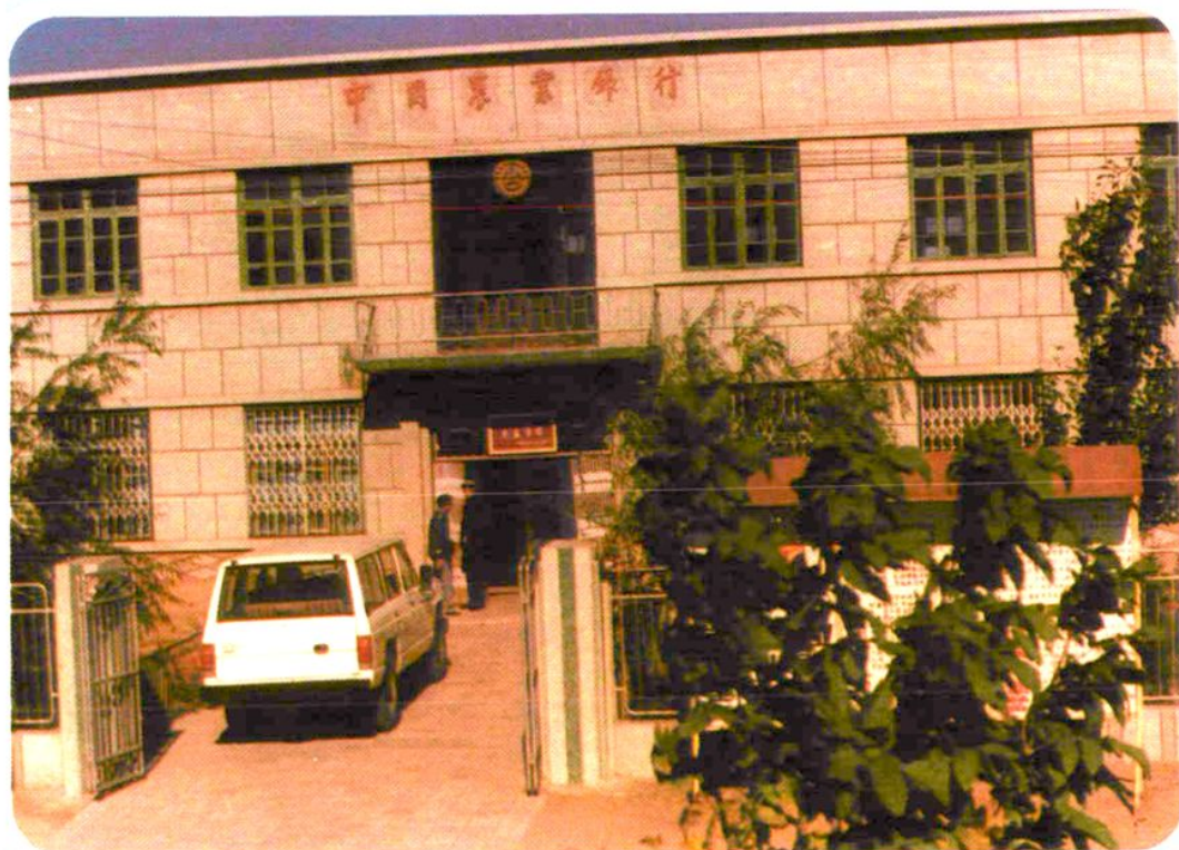
中国农业银行通辽县大林营业所 哲盟首批建立的农村营业所之一建于1951年11月