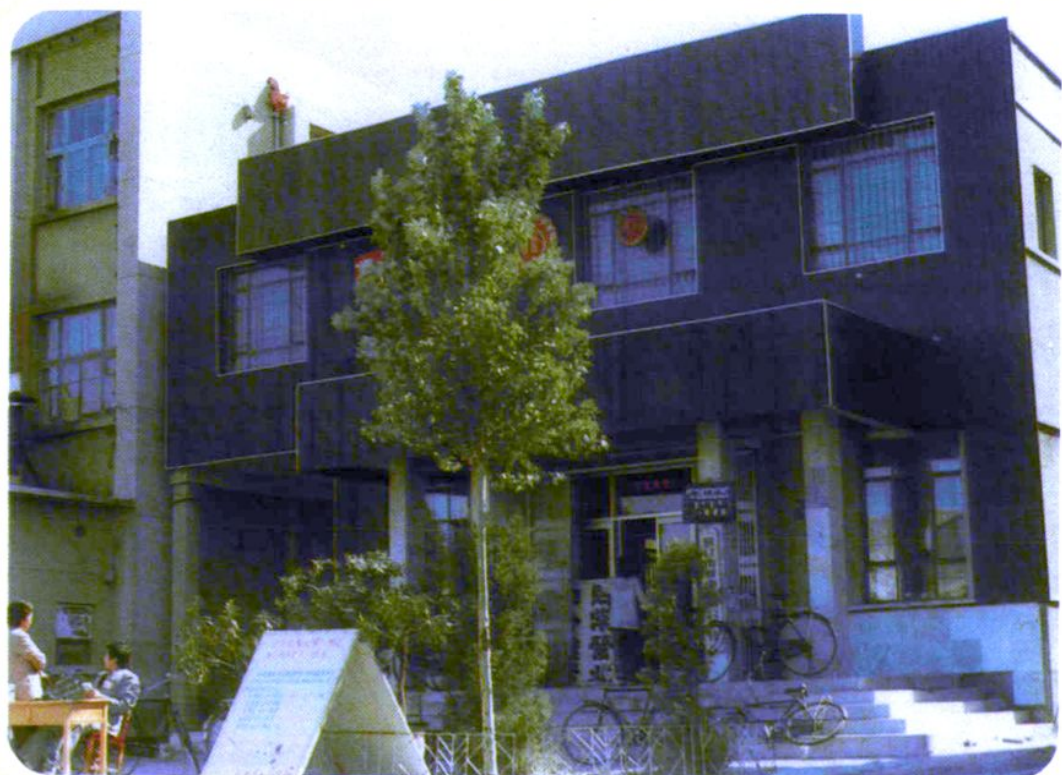
中国工商银行通辽市支行第一储蓄所——哲盟最大的储蓄所