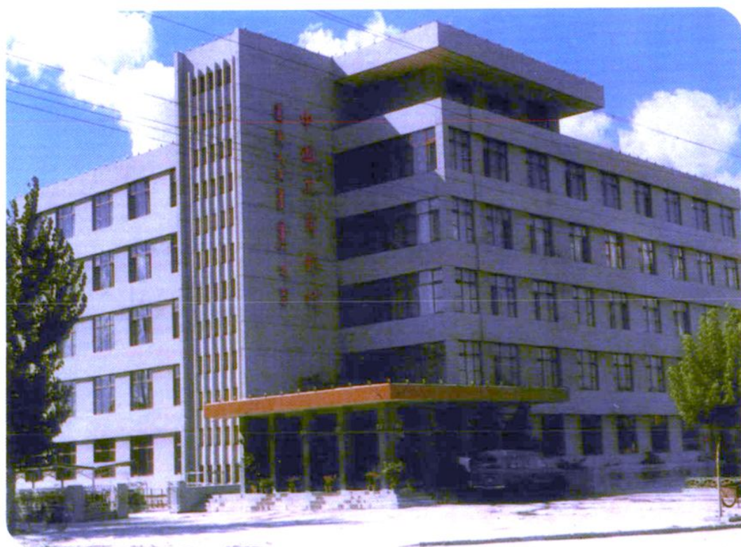
中国工商银行哲盟中心支行位于通辽市建国路北段路西