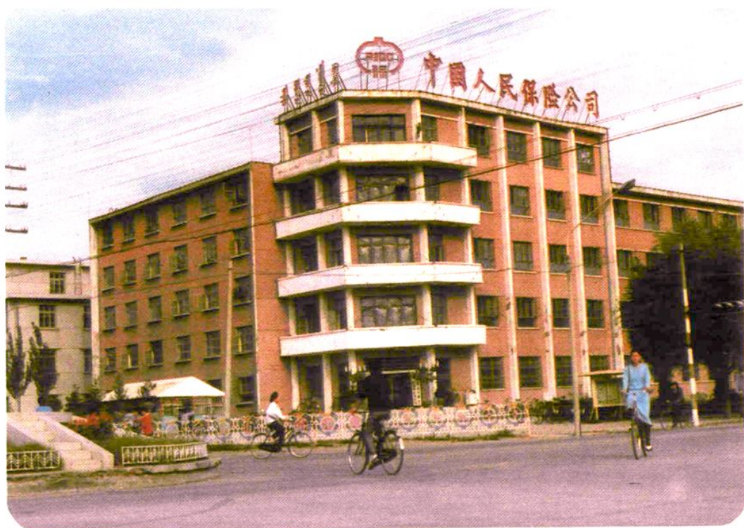
中国人民保险公司哲盟中心支公司位于通辽市建国路南段路西