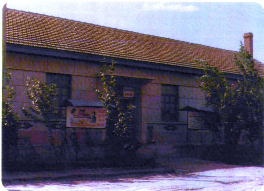
通辽县木里图镇信用合作社 哲盟首批试办之一的海力布台信用合作社并入此信用社