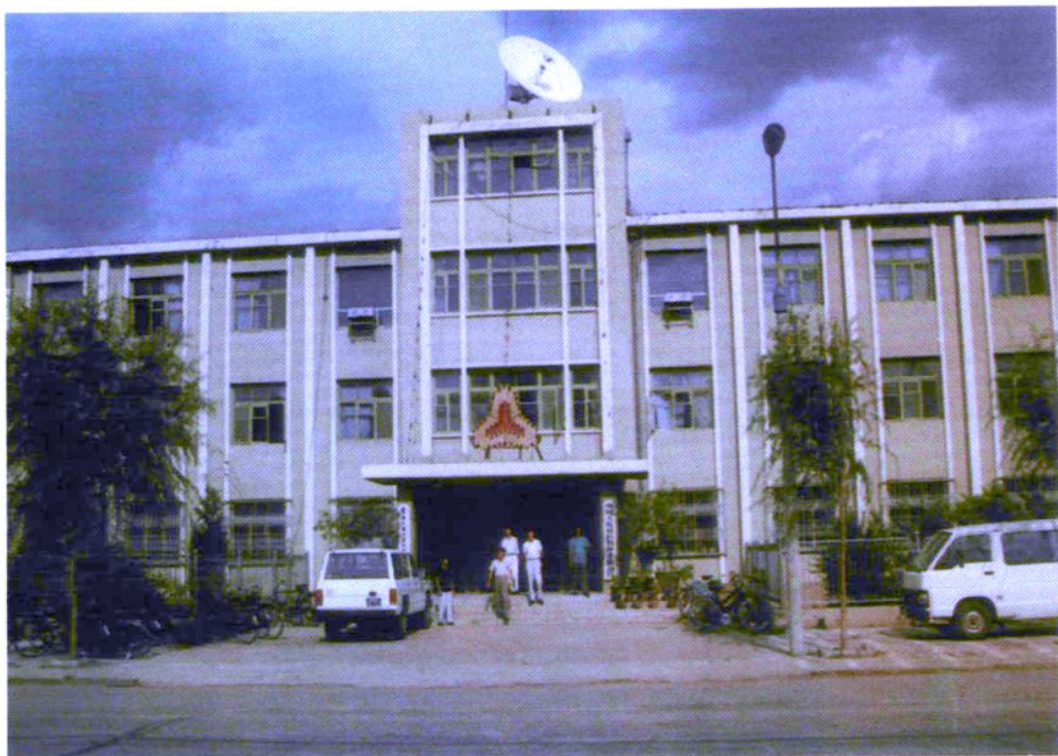
中国人民银行哲盟分行位于通辽市建国路北段路东