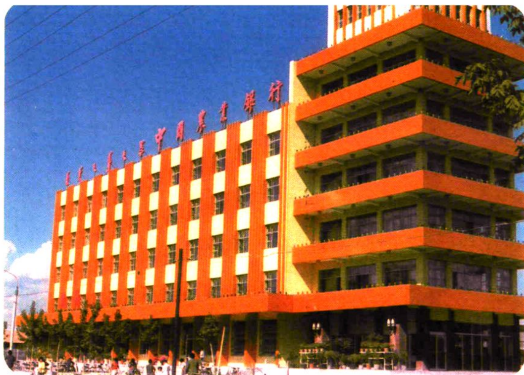
中国农业银行哲盟中心支行位于通辽市建国路中段路东