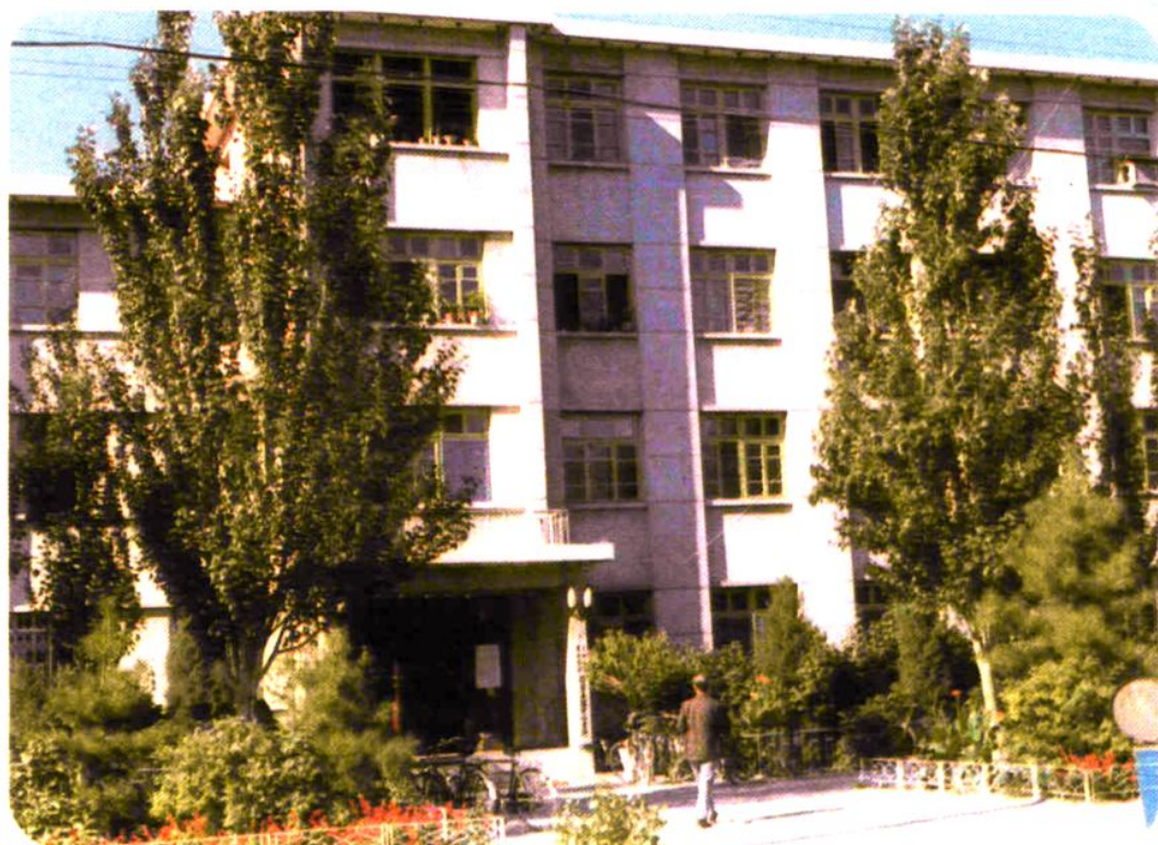
中国人民建设银行哲盟中心支行位于科尔沁大街中段路北