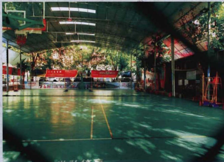
◎ 2015年维修后的多功能运动场