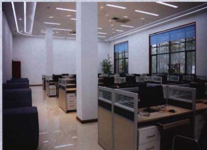
• 2014年建成的图书馆电子阅览室