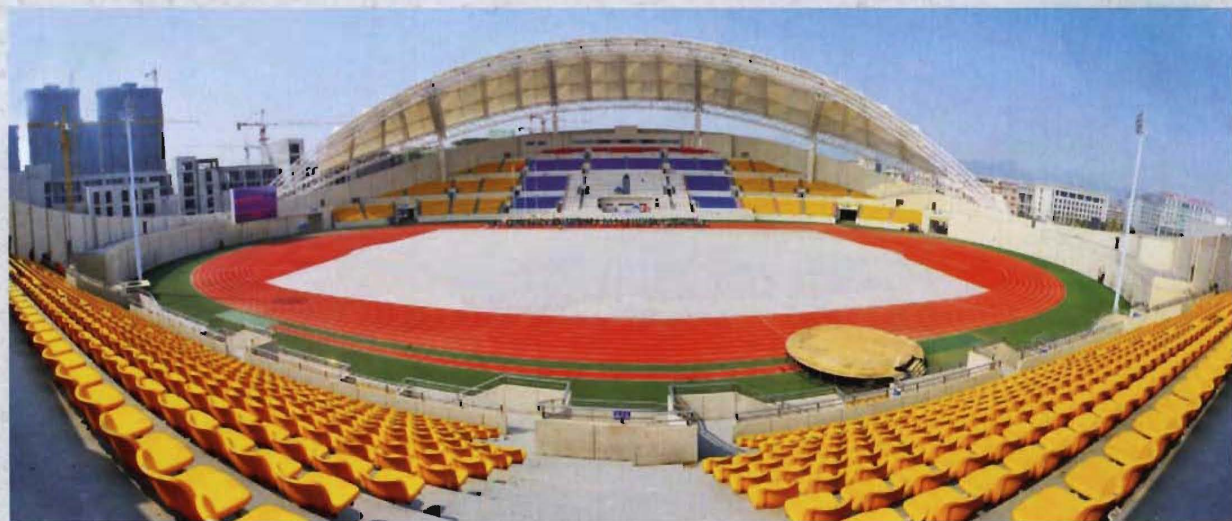
◎ 龙凤体育中心体育场