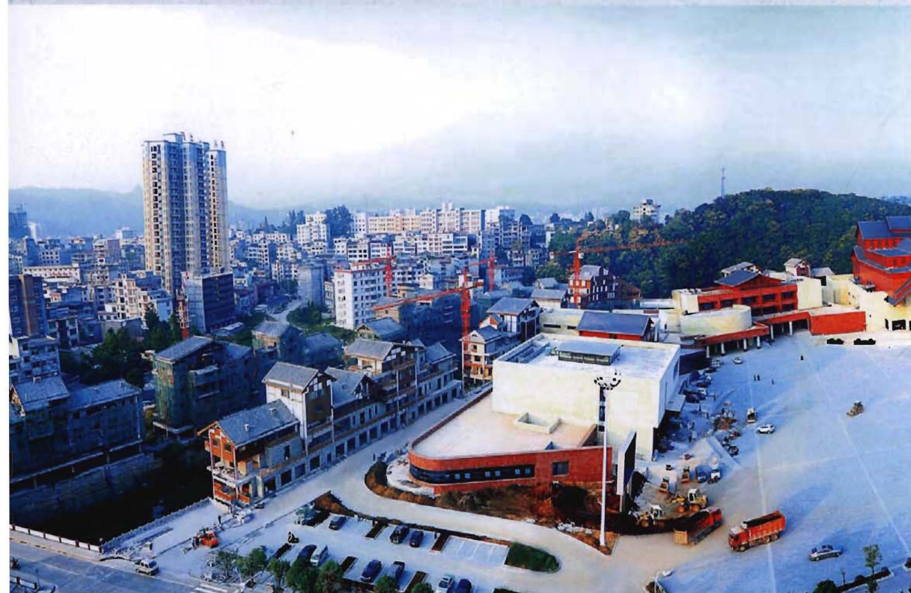
◎ 2014年建成的来凤县龙凤文化中心（含文化馆、图书馆、博物馆、民族剧场）