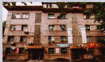
● 1983年建成的来凤县文体局办公楼和宿舍楼（2015年文化执法大队进驻办公）