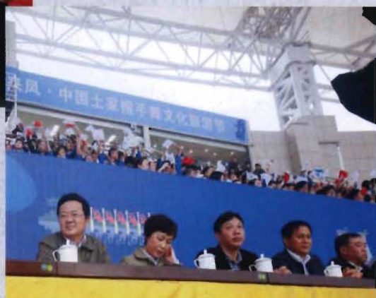
◎ 2014年0月20日，副省长郭生练（左一）、省体育局长胡德春（右二）参加全省第八届少数民族传统体育运动会开幕式