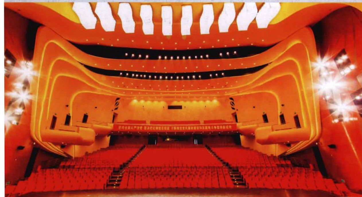
◎ 龙凤文化中心民族剧场