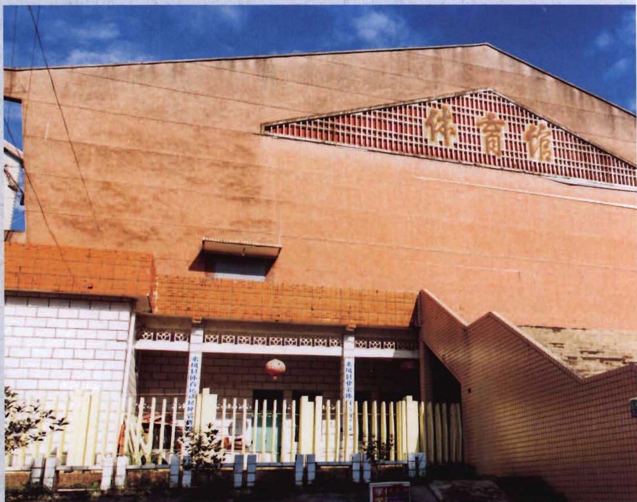
◎ 1977年建成的老体育馆