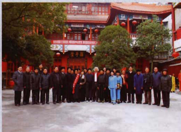
◎ 2012年12月5日，文化部非遗专家和省文化厅领导与我县非遗传承人合影