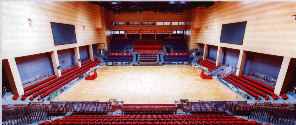
◎ 龙凤体育中心体育馆