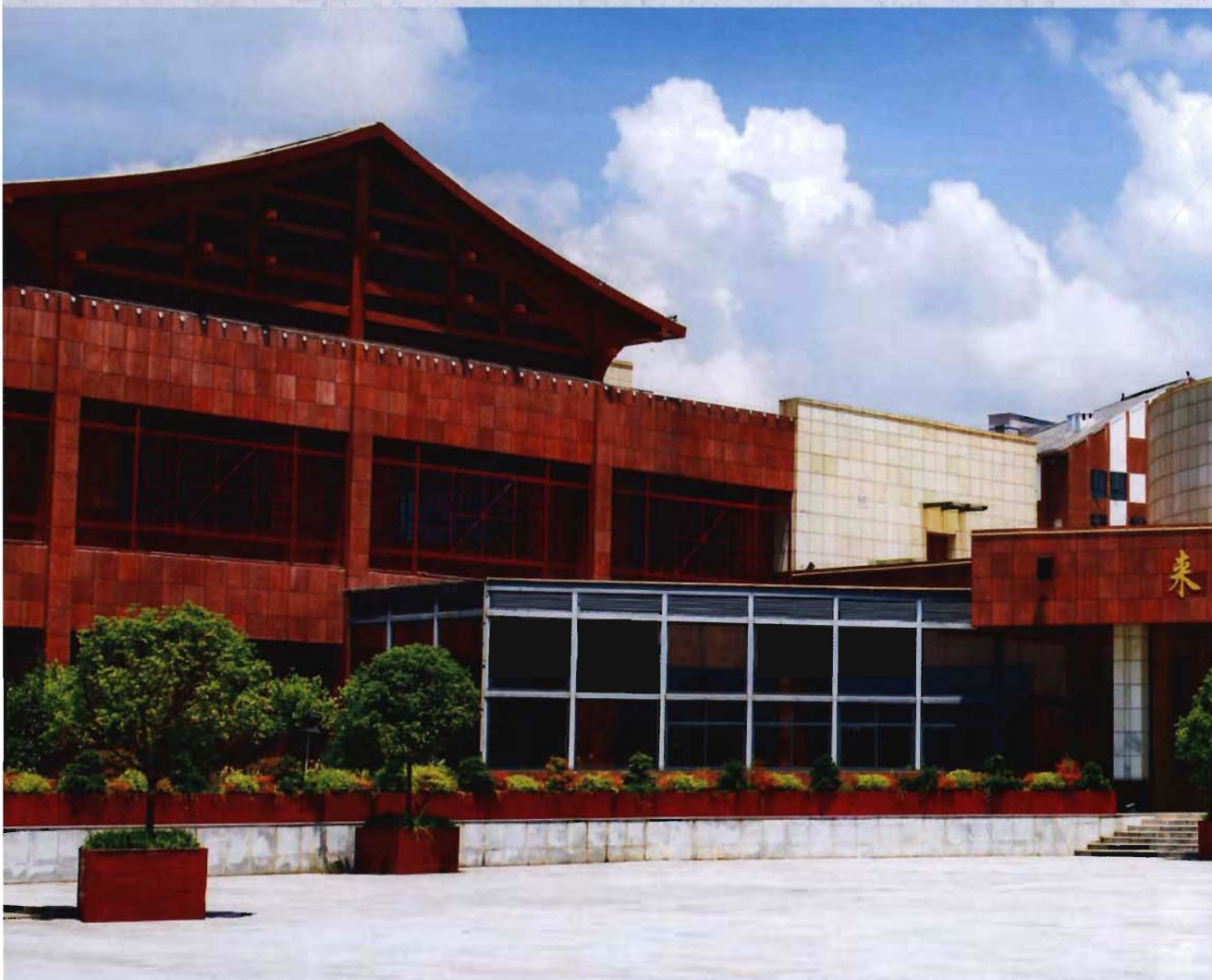
● 2014年建成的来凤县图书馆