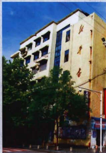
• 1993年建成的新华书店