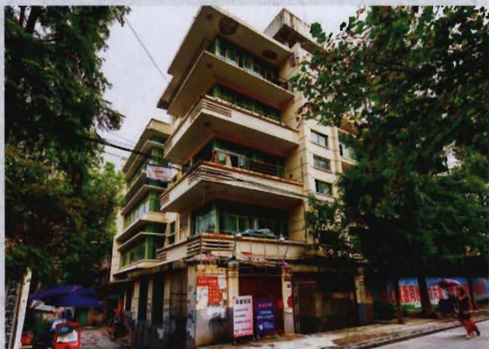
● 1983年建成的来凤县图书馆