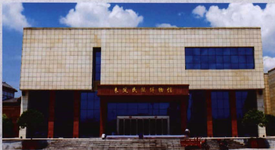
◎ 2014年建成的来凤县民族博物馆