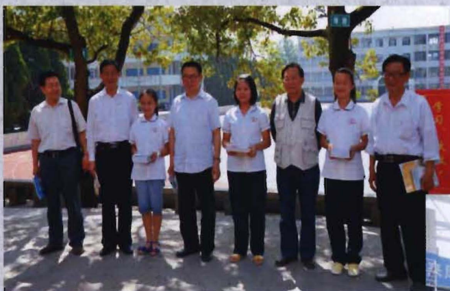
◎ 2013年6月，中华诗词学会常务副会长李文朝将军（左四）检查验收来凤县创建中华诗词之乡工作时留影