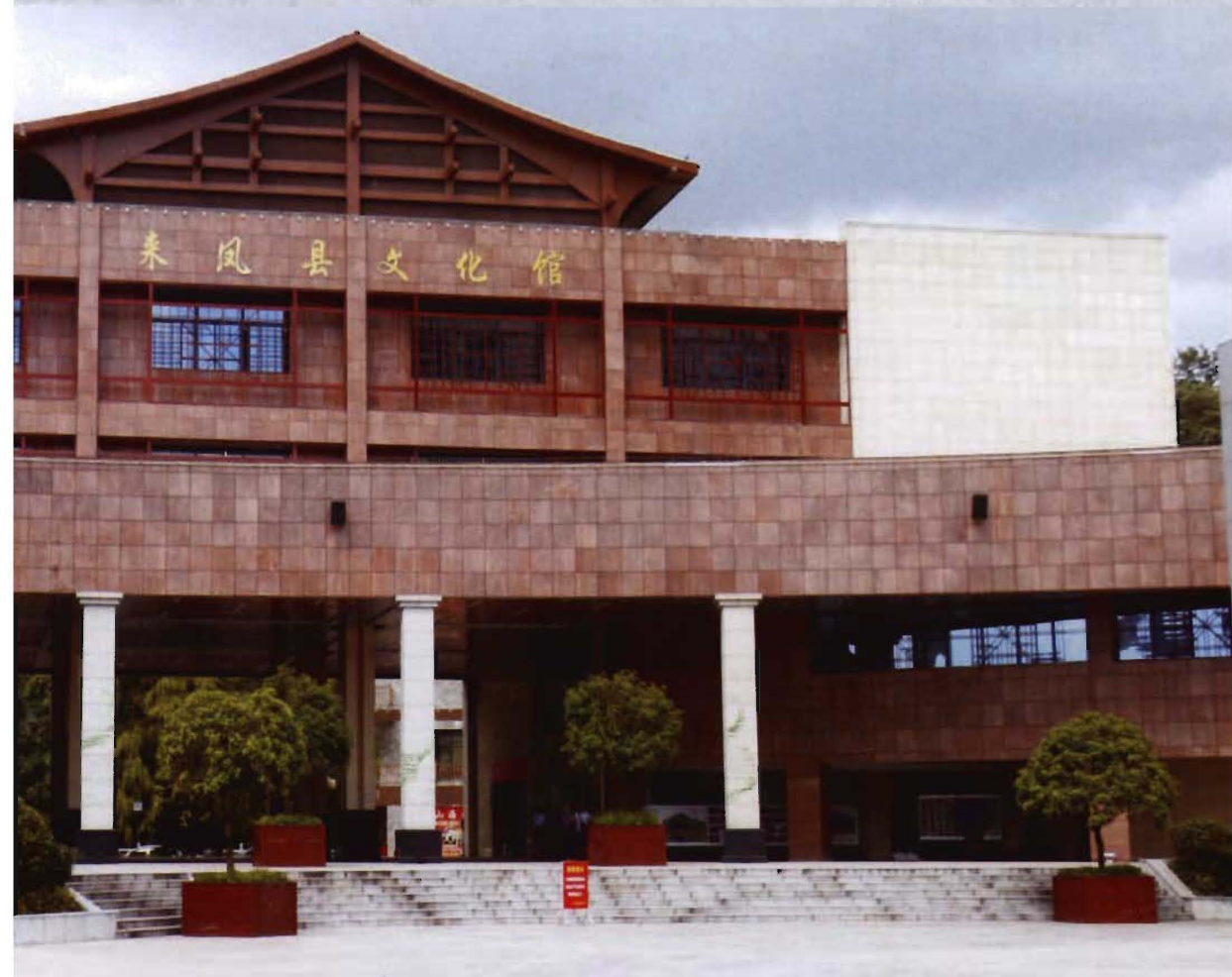
◎ 2014年建成的来凤县文化馆