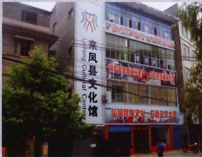
◎ 1982年建成的来凤县文化馆