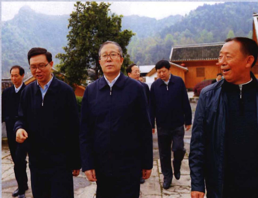
◎ 2013年4月16日，省委书记李鸿忠（前排中）在杨梅古寨考察