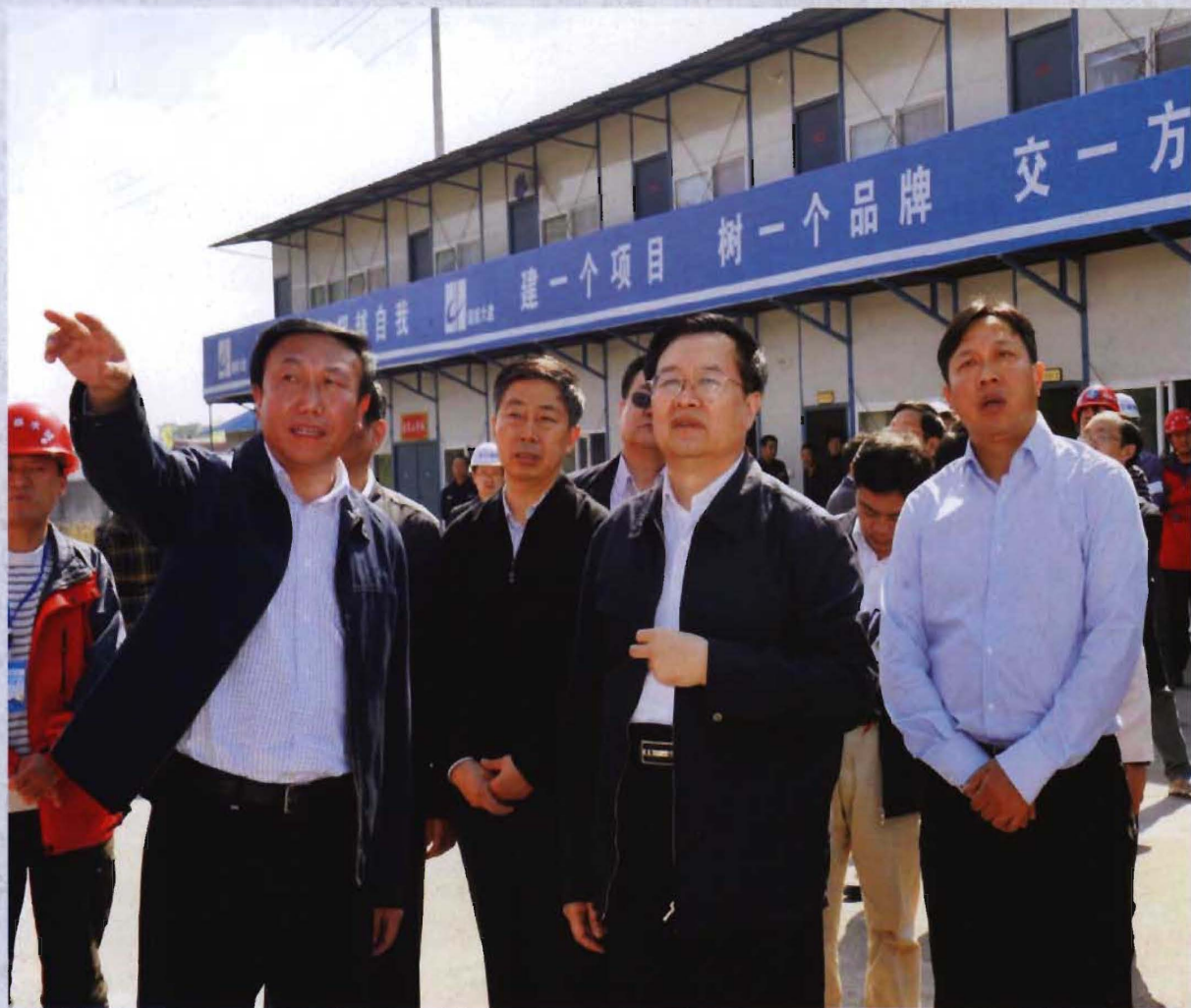
◎ 2012年10月17日，省长王国生（右二）在州委书记肖旭明（左二）、州长杨天然（右一）、县委书记胡泽（左一）的陪同下视察龙凤文化中心建设现场