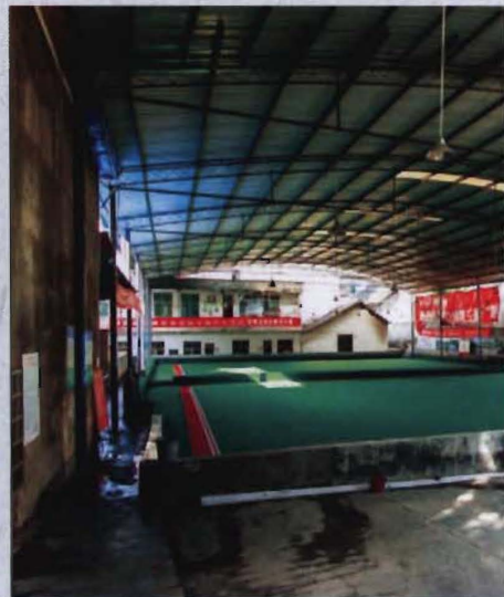
◎ 2015年维修后的老年人门球场