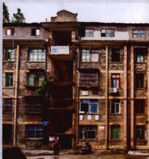
◎ 1983年建成的文化馆宿舍楼