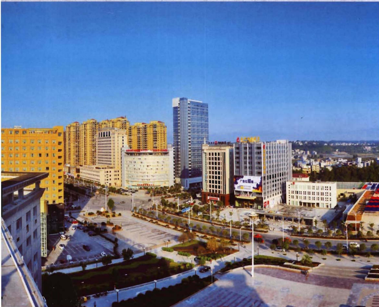
◎ 2014年建成的来凤县龙凤体育中心