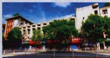
● 1989年建成的来凤县南剧场