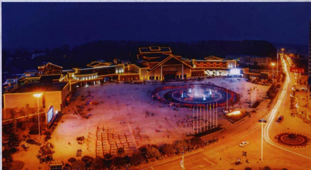
◎ 龙凤文化中心夜景