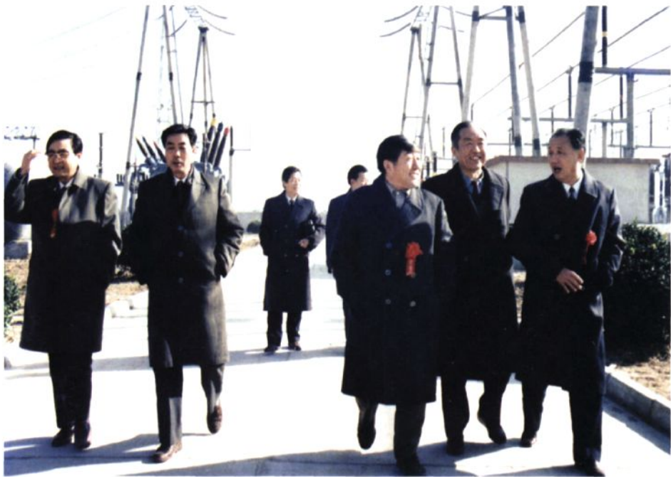
1995年1月6日，220千伏昌邑变电站投运，山东省电力局副局长赵杰臣（左一）、潍坊市副市长房忠昌（右三）、潍坊电业局局长刘绍钧（左二）、党委书记胡兆福（右二）、昌邑市市委书记张敦柏（右一）等领导出席庆典大会