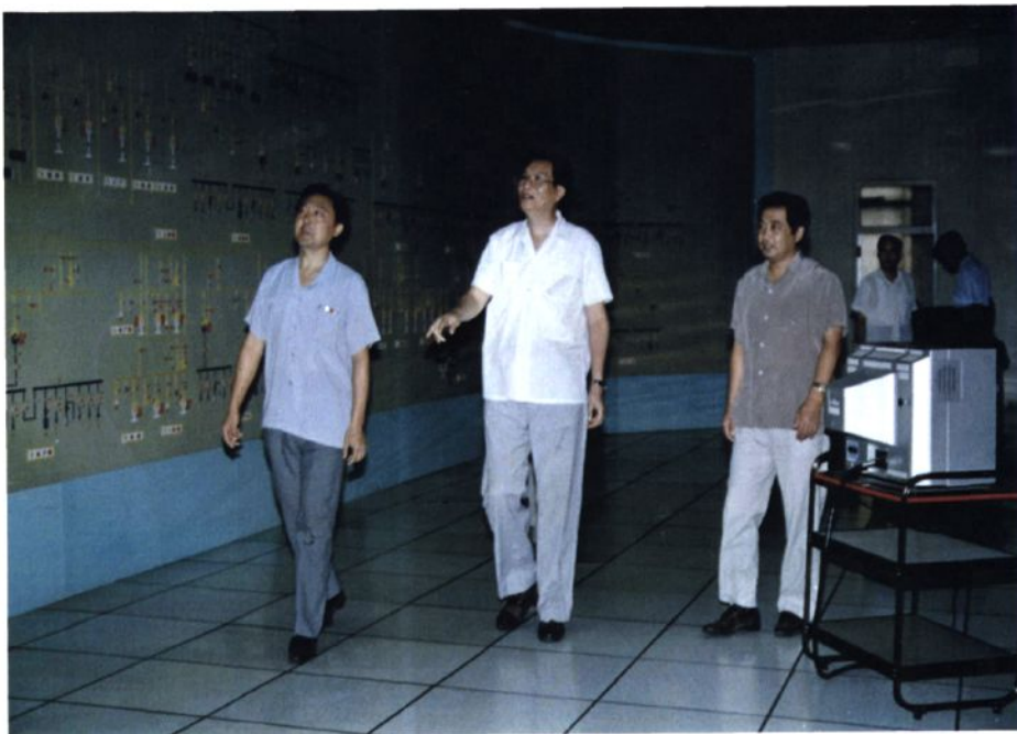
■ 1992年8月26日，山东省副省长马长贵（中）在昌邑县副县长王维盛（右）、公司经理刘坤志（左）陪同下，来公司视察工作