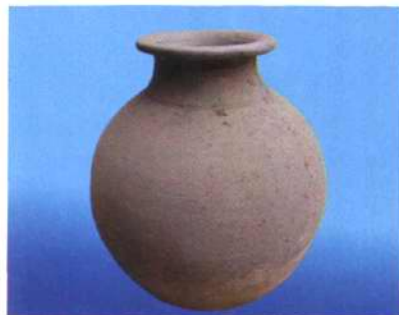
1976年在学校砖厂做砖时出土的汉代陶罐