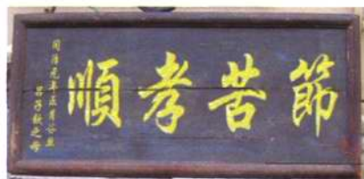
悬挂在楼下院大门上的匾额