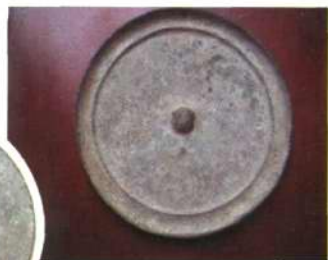
1976年在学校砖厂做砖时出土的汉代铜镜