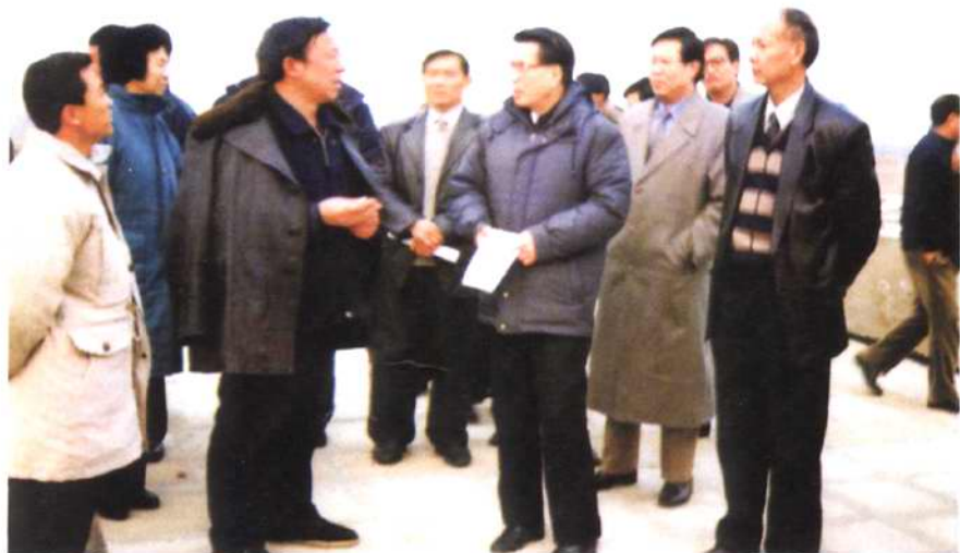
2008年元月8日，国家水利部副部长张春元（右三）、在孟州市委书记李俊彦（前排右一）、市长徐兰（右二）、市移民局局长魏三元（右四）、村支书吕明钦（右五）的陪同下，到寺上村调研移民安置工作。