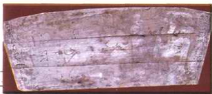
后阙吕氏祠堂的“顺德完贞”匾额