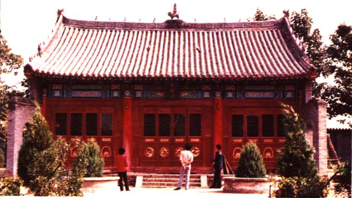
函谷关大初宫——老子著经处