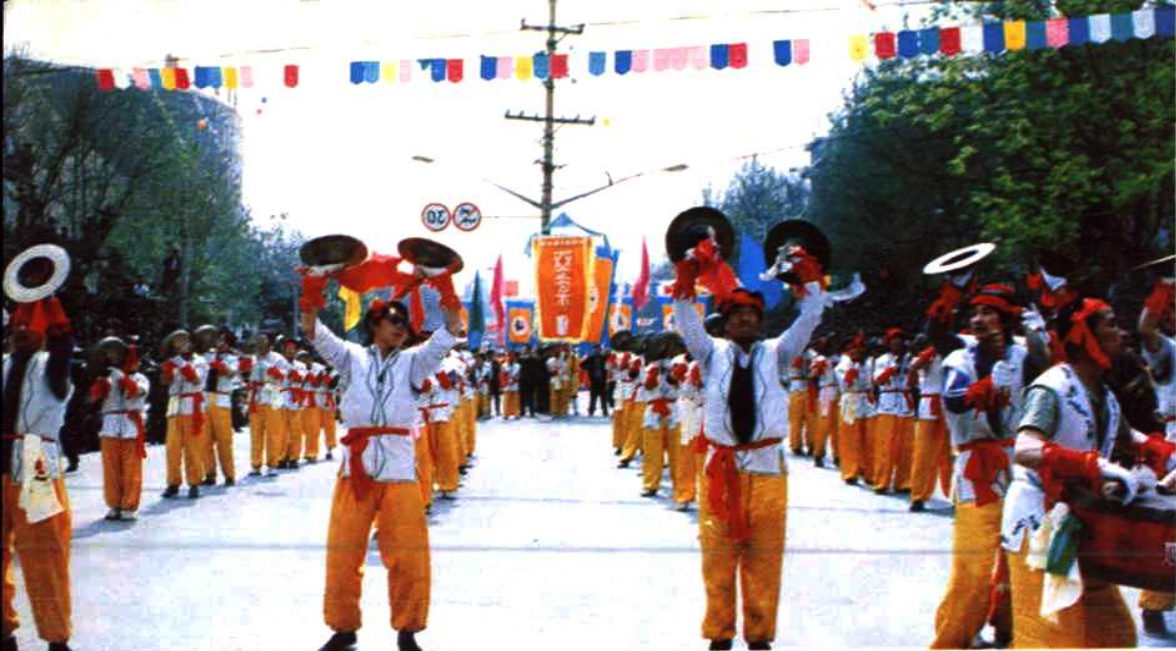
亚武锣鼓队，狂欢显神风