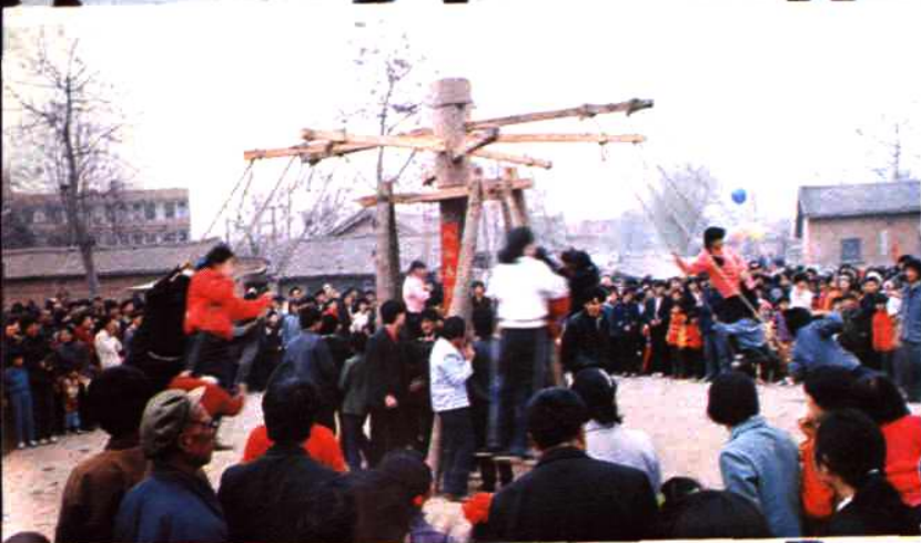
涧东八挂鞦，男女争荡游