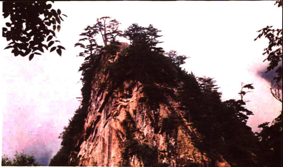
省级风景名胜区亚武山