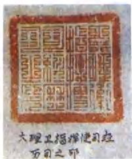
大理卫指挥使司印 万目之印