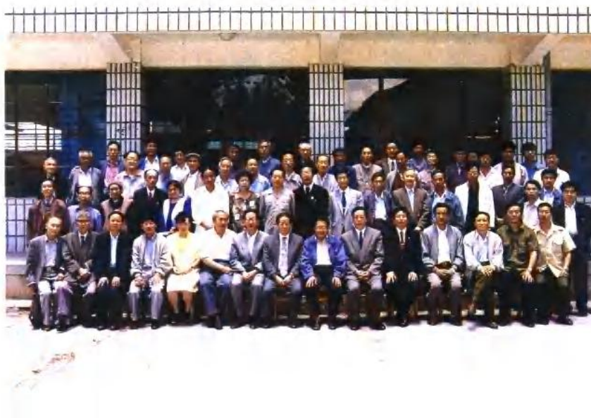
上、凤仪镇党政领导 机关 中、凤仪镇党政领导 班子 下、参加《风仪志》 审定稿会议的领 导、顾问、编委 及全体工作同志 合影