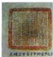
大理卫指挥使司印