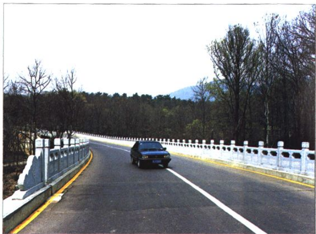
中山陵园的陵园路