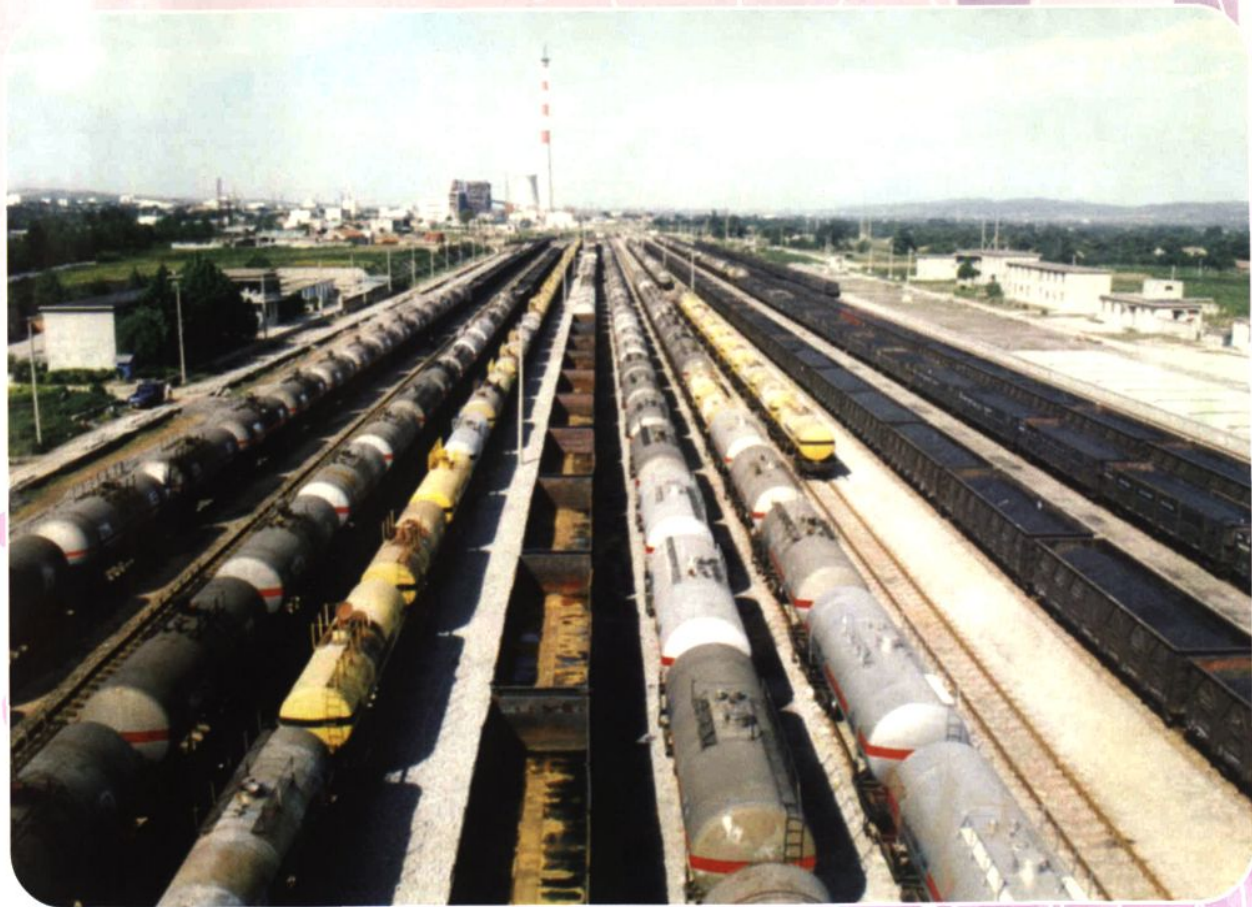
铁路运输编组交接站