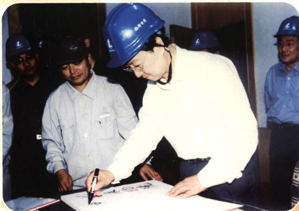
2002年9月26日，时任中国石化集团公司总经理、2008年3月任工业和信息化部部长李毅中到厂视察并题词