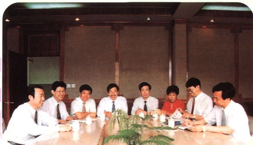
领导集体成员 (1994年10月至 1997年12月)