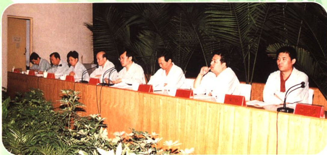
领导集体成员 (2001年12月至2002年11月)