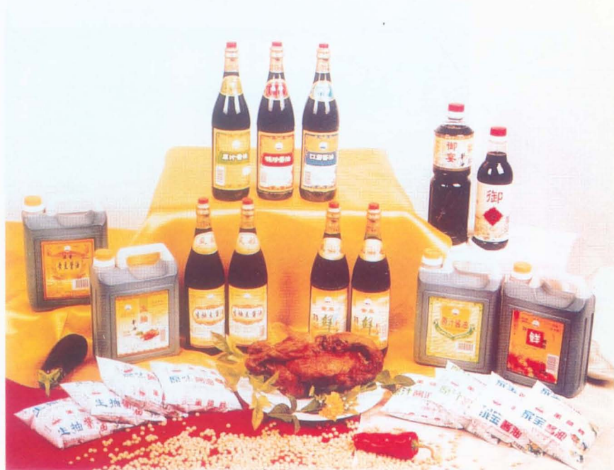
风船牌酱油类产品