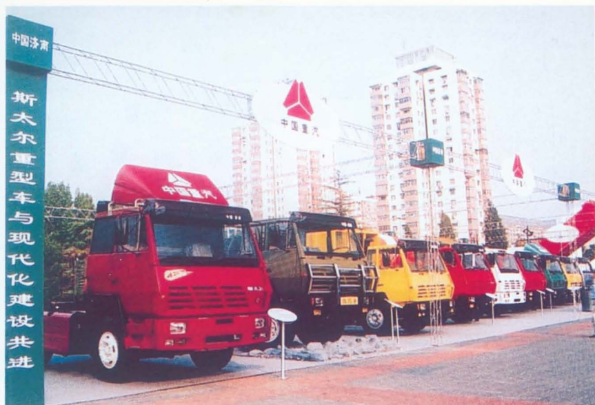
斯太尔重型汽车与现代化建设共进