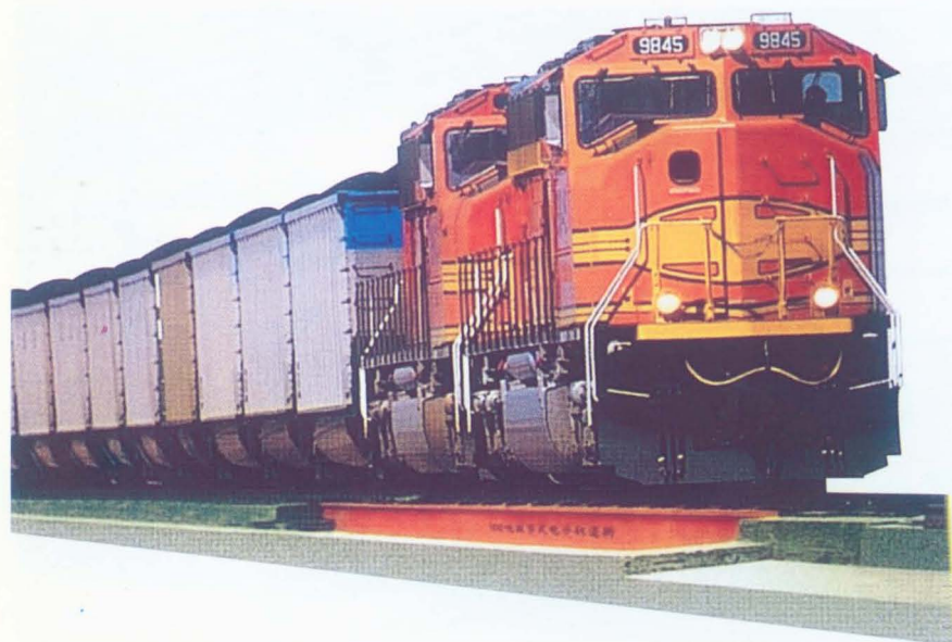
济南金钟牌数字式电子轨道衡