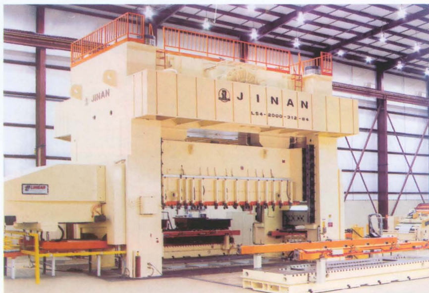
济南机床二厂自营出口美国的2000吨大型多工位机械压力机