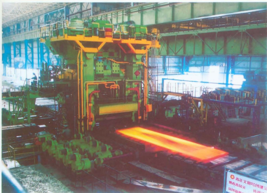
济钢中厚板厂的精轧机