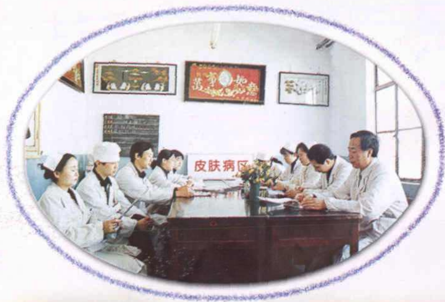
皮肤病医院医护人员 正在业务学习