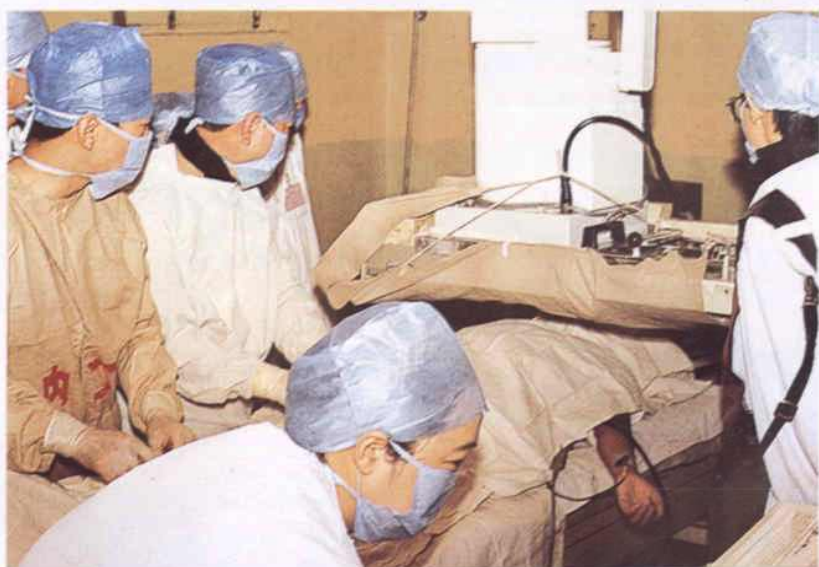
心内科 1993 年开展射频消融术治疗快速心律失常，走在了全国地市级医院的前列