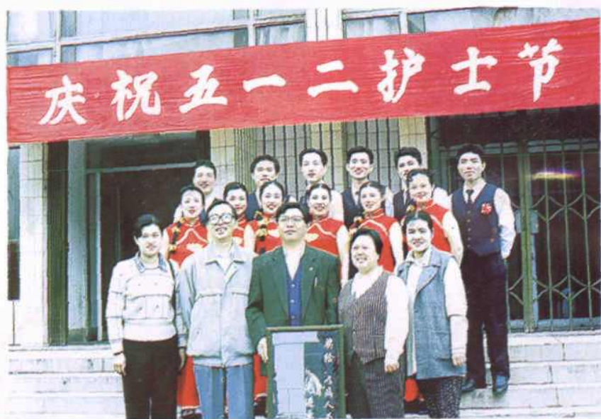
参加开封市庆祝“5.12” 护士节文艺汇演