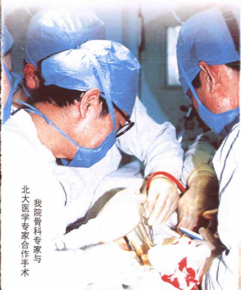
北大医学专家合作手术