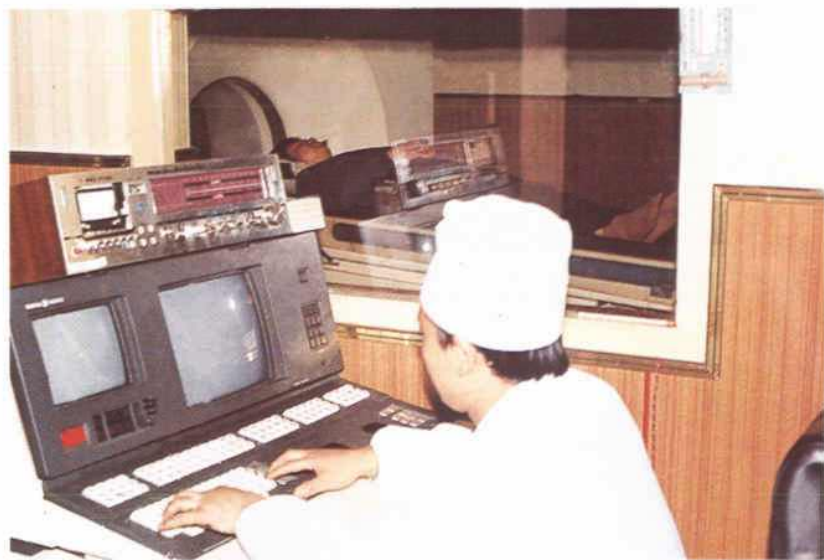
美国产 GECF--QUICK9800 型全身 CT 扫描机