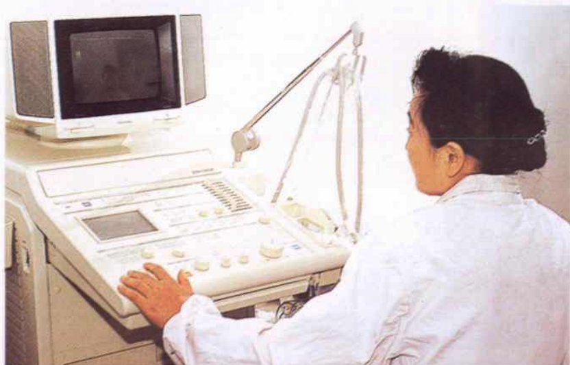
日本产 SSH—东芝 140A 型全身彩色超声诊断仪