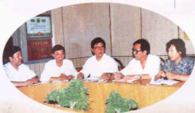
现任领导班子正在研究工作