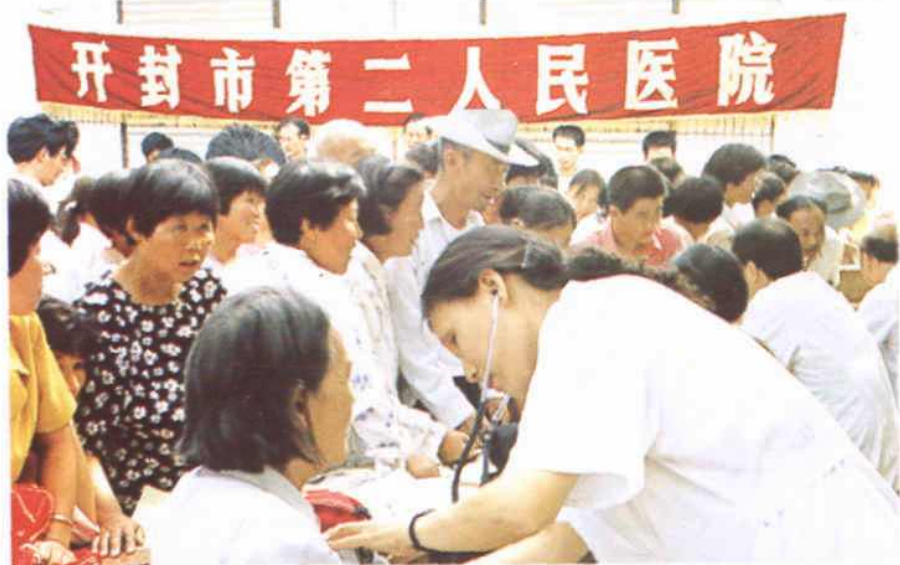
我院专家医疗队下乡义诊