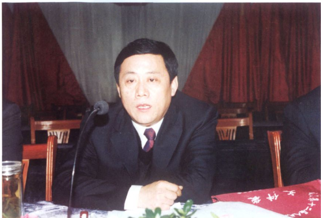
▲ 威县县委书记孔祥友在县人大代会上讲话