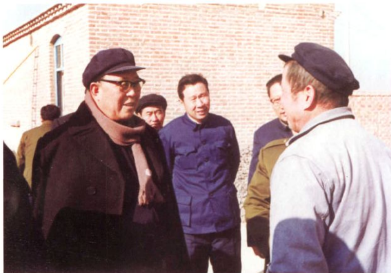
◀ 1987年12月16日，河北省第六届人大常委会主任孙国治（左一）来威县视察乡镇企业。

▶ 河北省第九届人大常委会常务副主任李炳良（左一）来威县调研。图为省领导听取县人大常委会关于“四八”法律法规贯彻落实情况汇报。