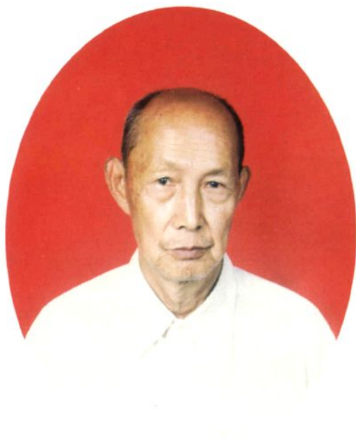
◀ 威县第六届人大常委会主任刘润生同志