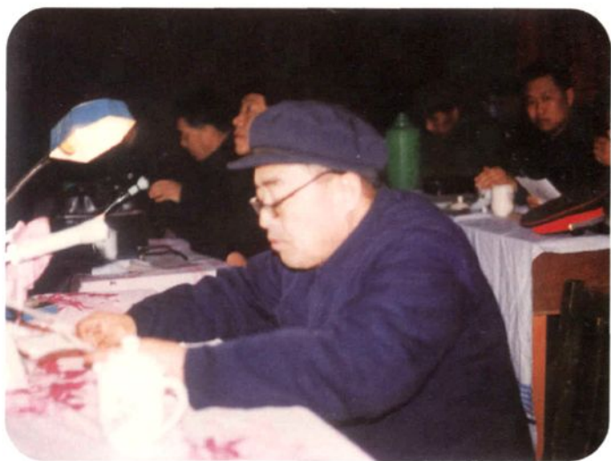
▶ 威县第七届人大常委会主任宋书仲在县人代会上作报告