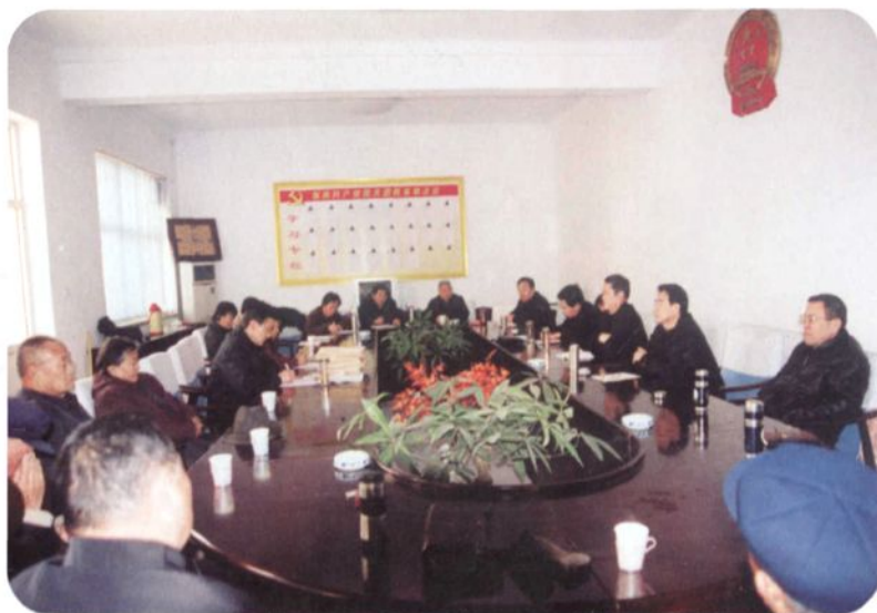
◀ 威县人大常委会召开县人大离退休干部座谈会，征求他们对《县人大志》送审稿的意见