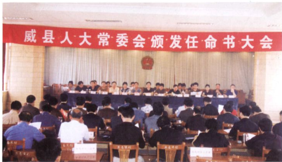
◀ 威县第十二届人大常委会召开颁发任命大会，为县政府新一届的组成人员颁发任命书。