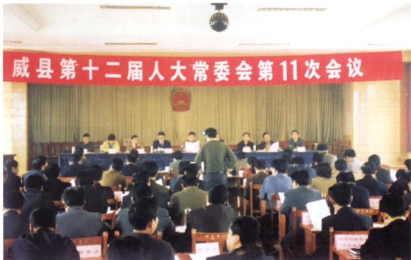
▶ 威县第十二届人大常委会召开第十一次会议，对县农业局、水务局、畜牧局三位局长进行述职评议。图为述职评议大会会场。