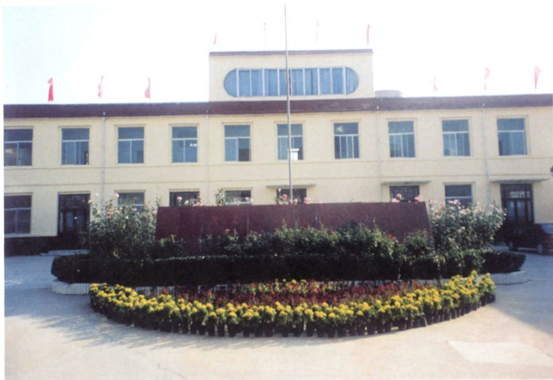
▲ 威县人民代表大会常务委员会办公大楼