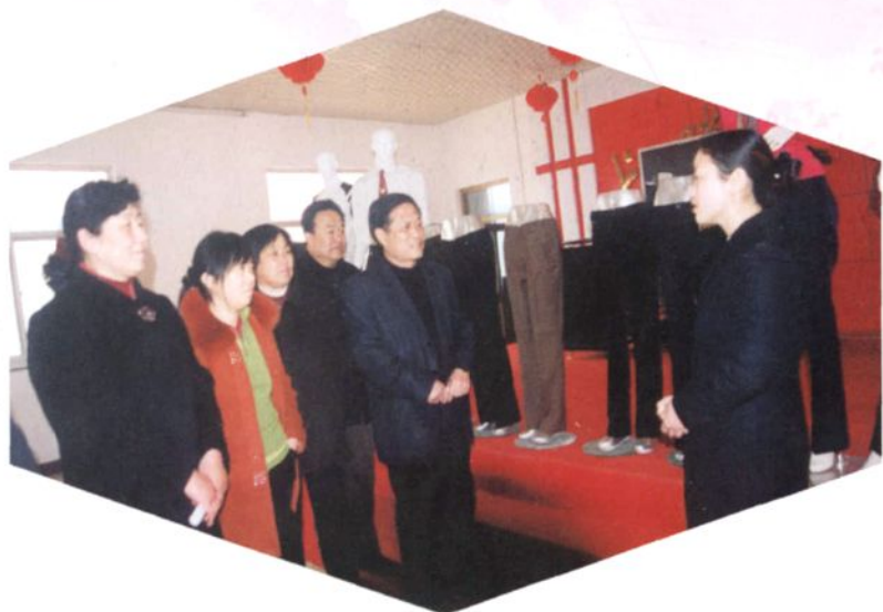
▶ 威县第十二届人大常委会组织常委会组成人员深入龙腾制衣有限公司进行视察