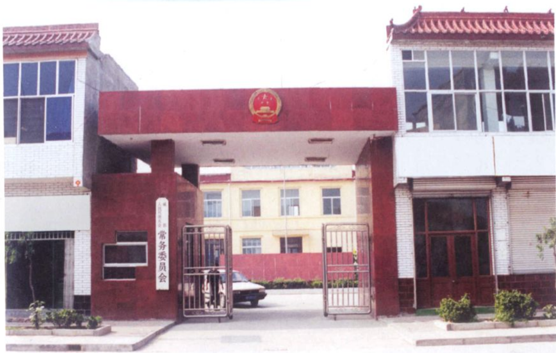
▲ 威县人民代表大会常务委员会机关外景