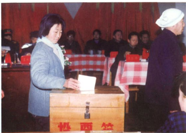
▶ 人大代表投票选举地方国家机关工作人员