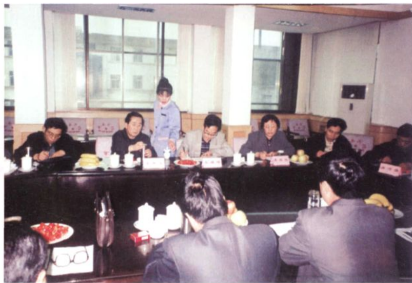
◀ 邢台市人大常委会主任齐耀增（左三）来威县调研。图为市领导听取县人大常委会工作情况汇报。