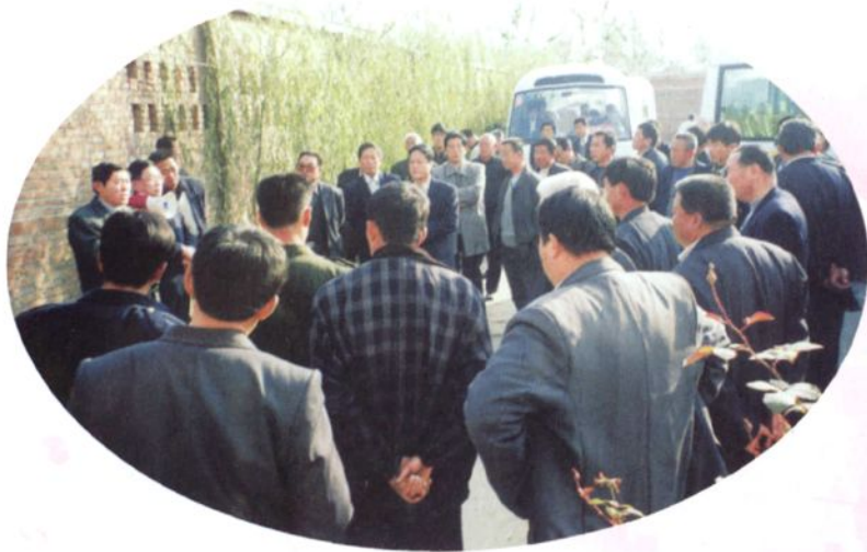
◀ 威县人大常委会组织百余名县乡人大代表参观邯郸市馆陶县、魏县畜禽养殖业和市场建设情况。图为人大代表在听取馆陶县畜禽养殖情况介绍。