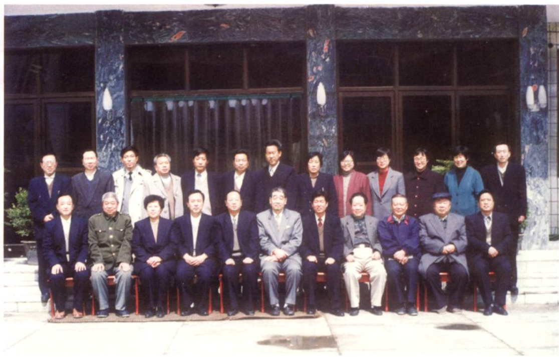
▲ 1998年3月31日，邢台市人大常委会主任贾长锁（前排左五）带领市人大常委会各位副主任来威县调研。图为市人大领导同志与威县县委、人大、政府领导同志合影。