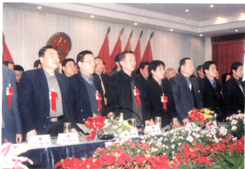
◀ 威县第十一届人民代表大会第一次会议主席团成员