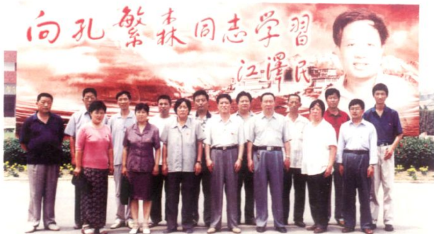
◀ 威县第十一届人大常委会组成人员赴聊城参观孔繁森纪念馆合影