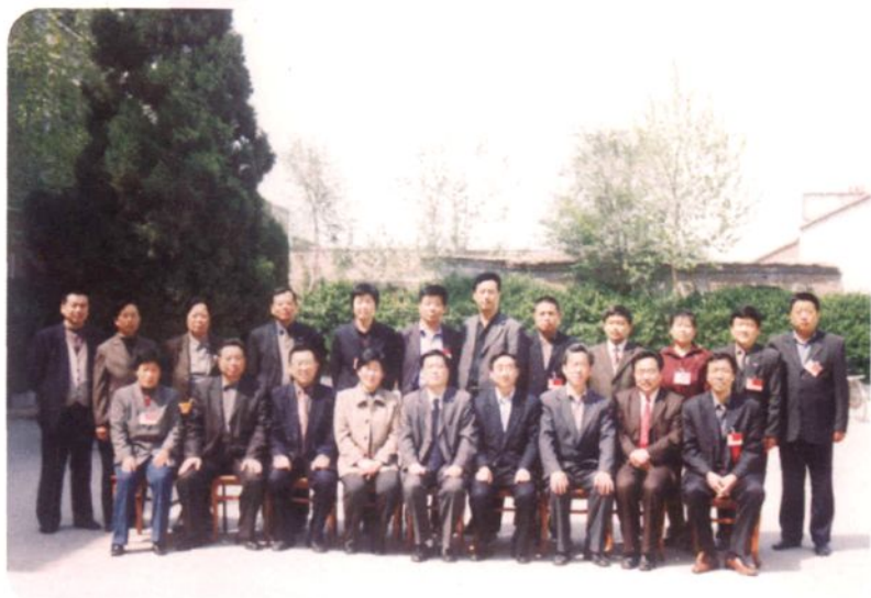
▶ 威县第十二届人民代表大会常务委员会全体组成人员合影