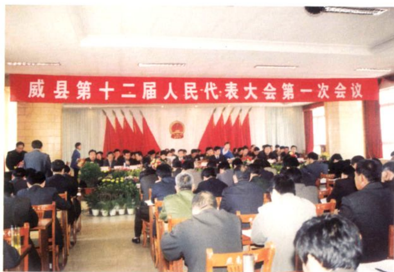
▶ 威县第十二届人民代表大会第一次会议会场