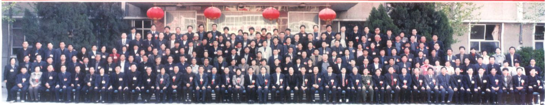
▲ 威县第十二届人民代表大会代表