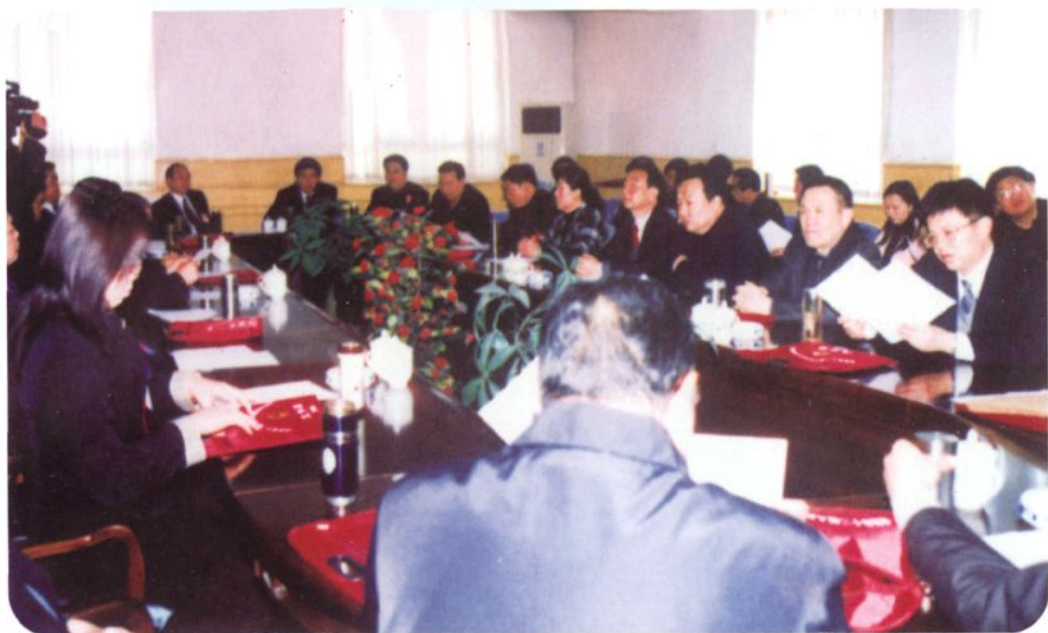
▲ 威县人民代表大会主席团举行会议