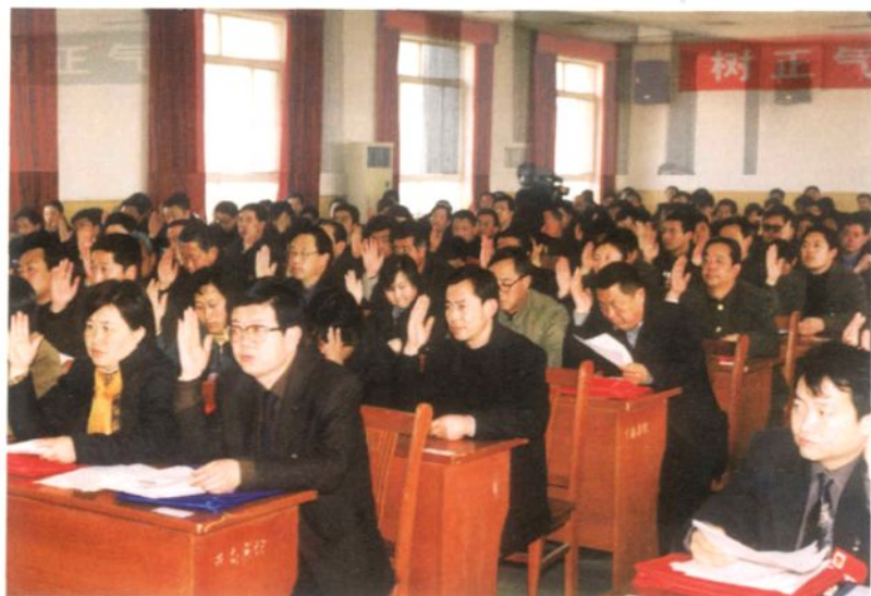
▶ 人大代表表决通过大会决议