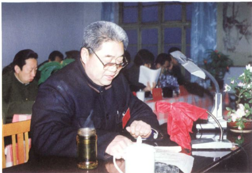
◀ 威县第九届、第十届人大常委会主任姜长岭在县人大会上作报告