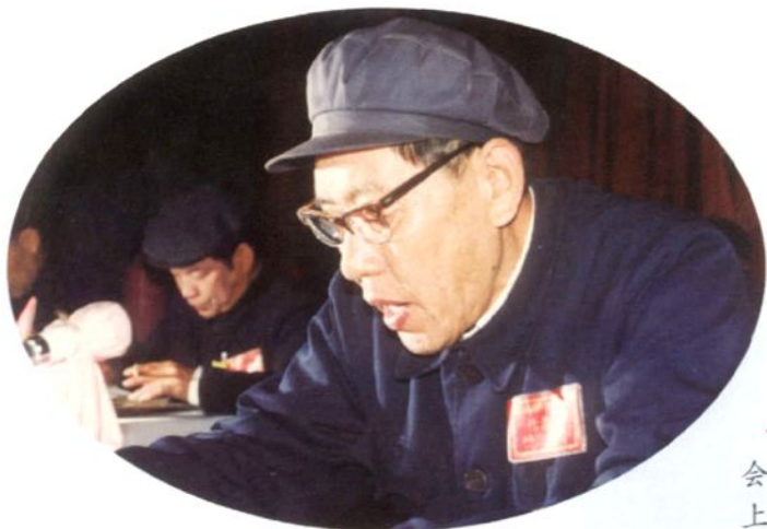
◀ 威县第八届人大常委会主任孙宝林在县人代会上作报告