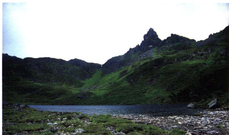
碧罗雪山上的黑龙潭