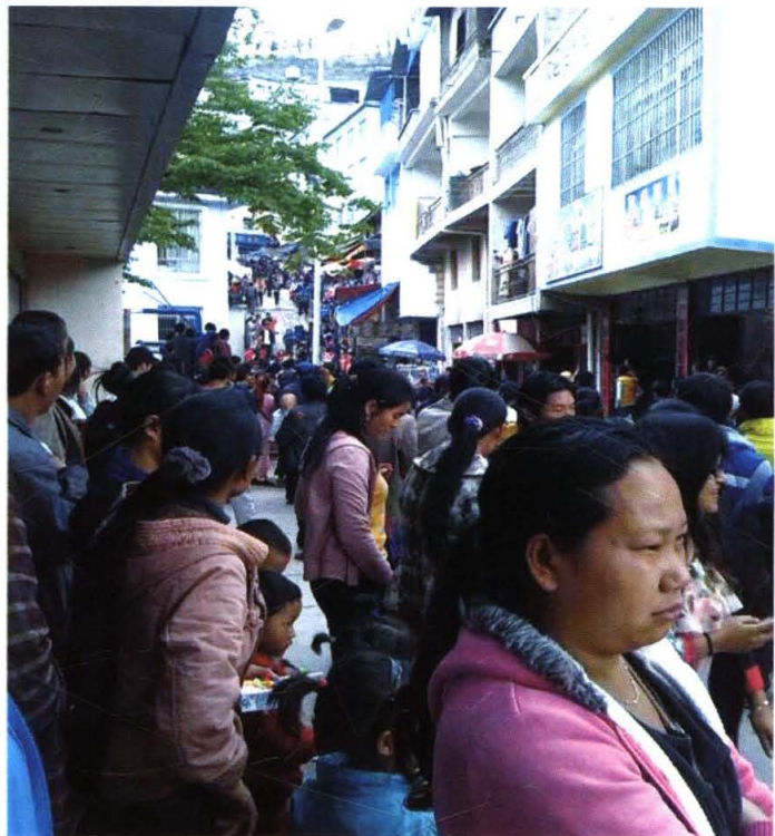
繁华的营盘街（杨胖贤 摄）