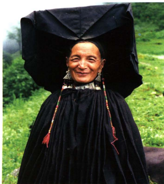
彝族老人