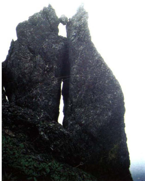
碧罗雪山上的豹子岩