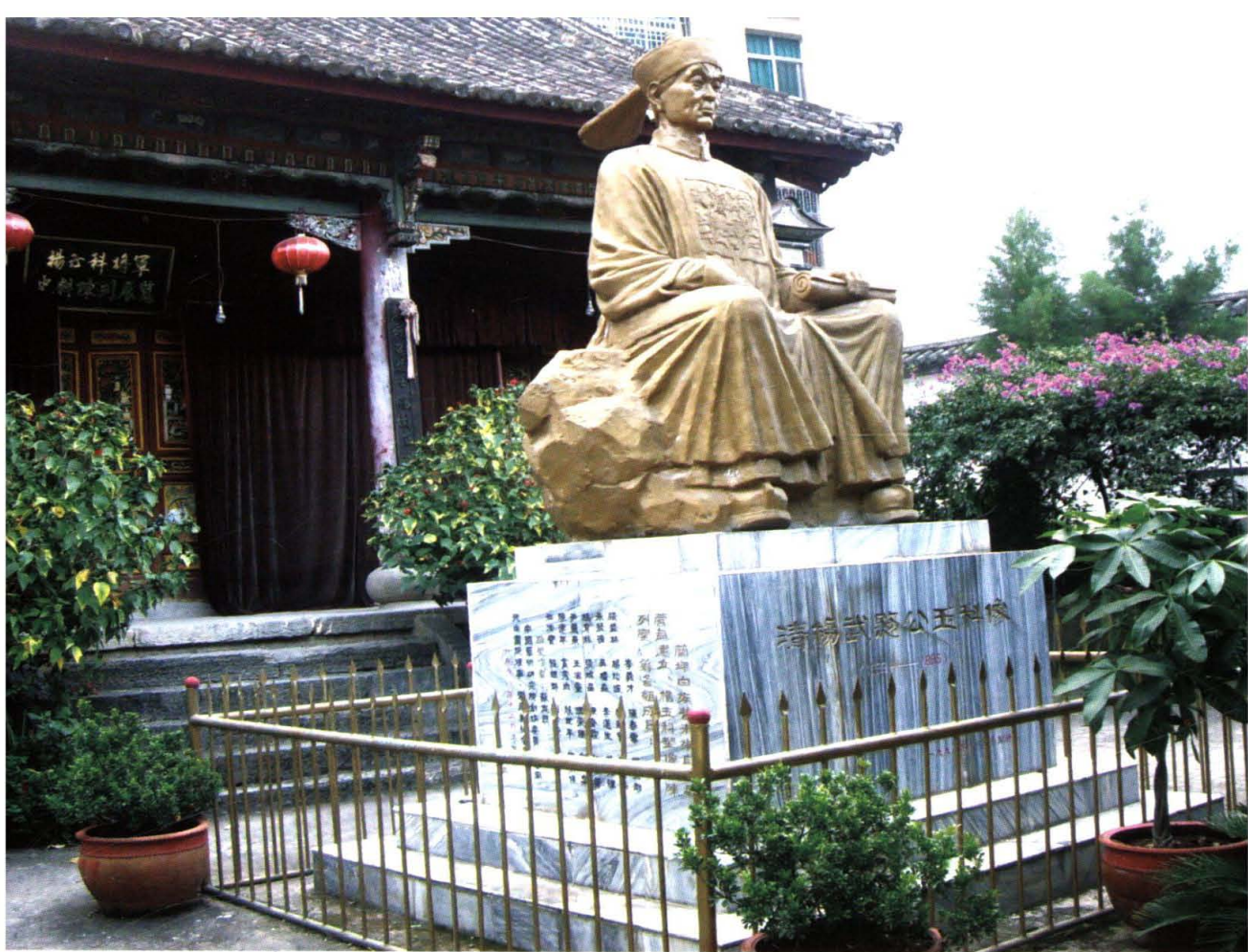
白族高级将领杨玉科将军塑像