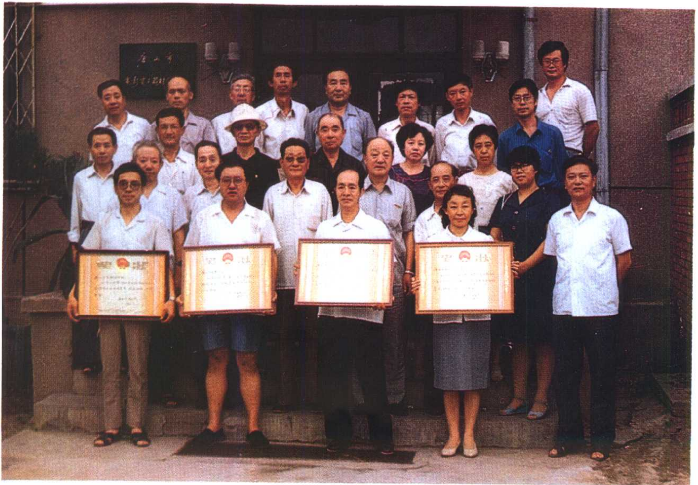
唐山市文化局修志工作表彰会议全体合影