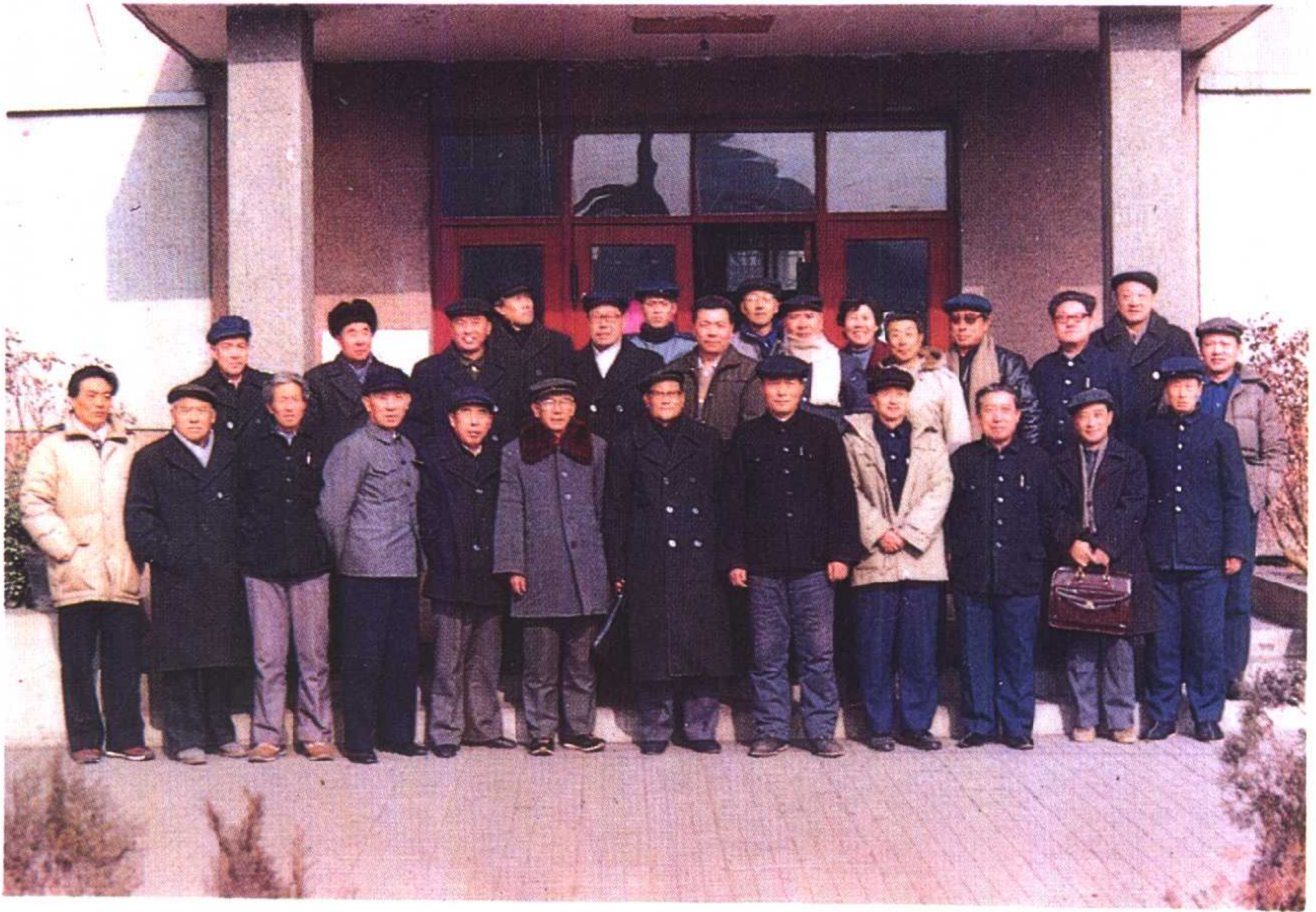
《唐山市文化艺术工作大事记》座谈会与会人员全体合影