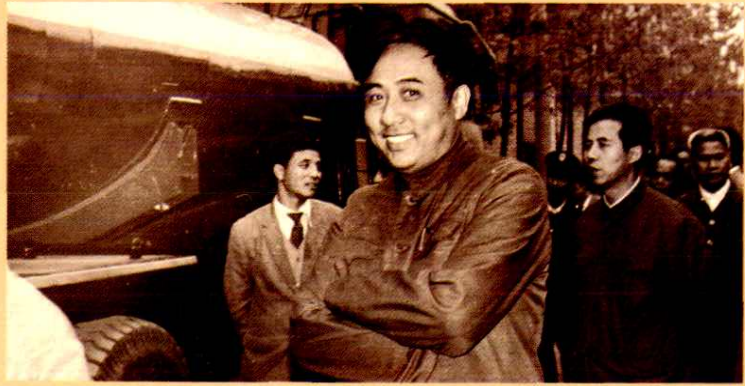
▶ 1985年11 月19日，四川 省副省长马麟 (中)来厂视察