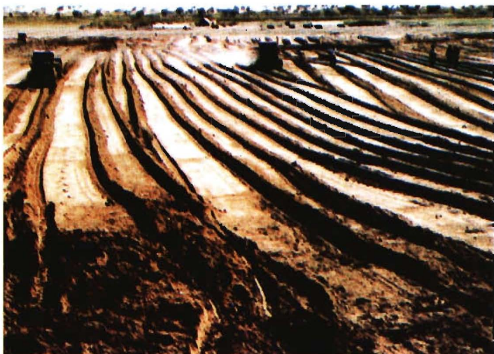
1958年,农二师三十一团进入塔里木河下游垦荒