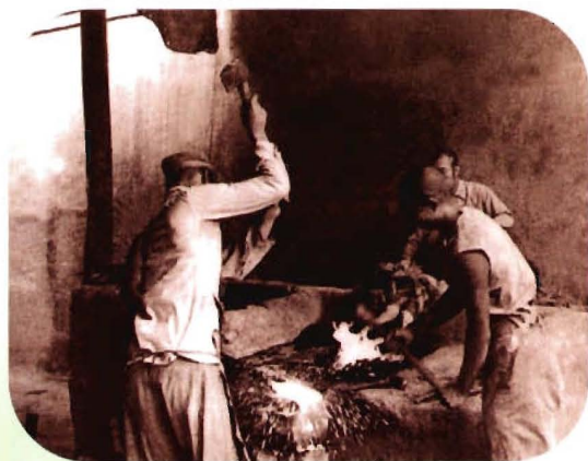
1950年,进疆部队组成突击小组开展劳动竞赛