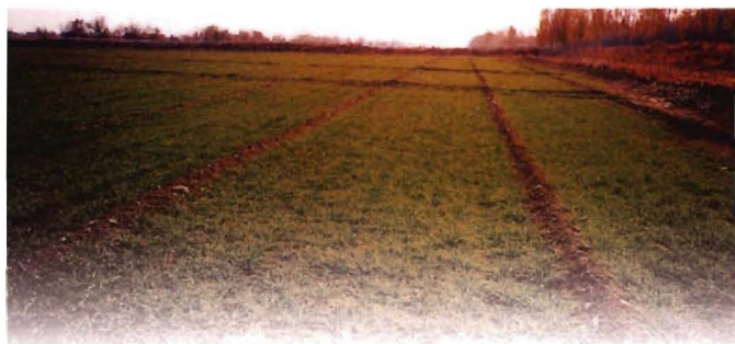
1956年，兵团推广密植作物小畦灌