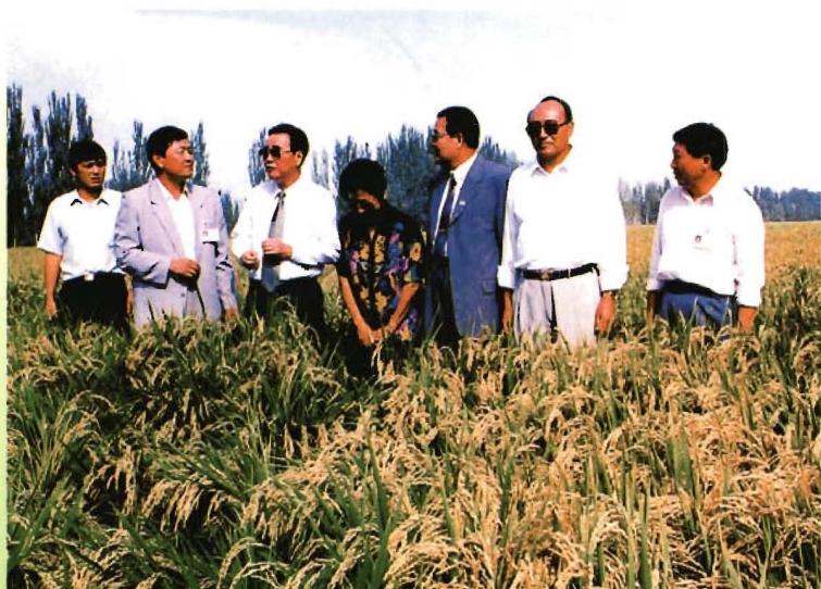
1996年9月,李鹏总理(左三)视察农二师农业生产情况(右三为时任兵团司令员金云辉)