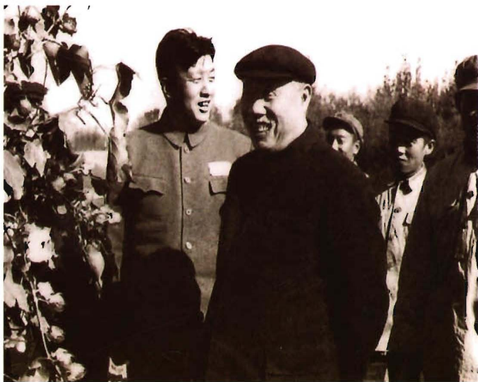
1955年9月25日,中共中央政治局委员董必武(左二)在兵团副政治委员张仲瀚(左一)陪同下视察农八师石河子垦区