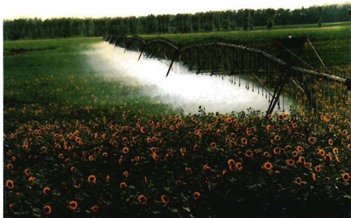
1977年，兵团从美国引进大型移动式低压喷头喷灌机