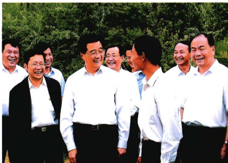
2006年9月,中共中央总书记、国家主席、中央军委主席胡锦涛(前左二)视察农十四师(右一为自治区党委书记王乐泉、左二为兵团政委聂卫国、右二为兵团司令员华士飞)