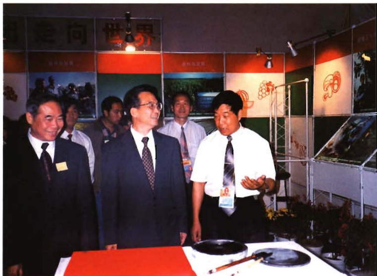
1999年9月,温家宝副总理(中)到中国国际农业博览会兵团展厅参观(右一为时任兵团农业局党组书记秦山鼎)