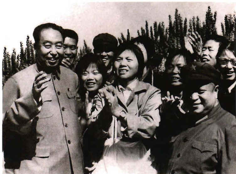
1978年9月，华国锋主席(左一)视察农八师一四三团