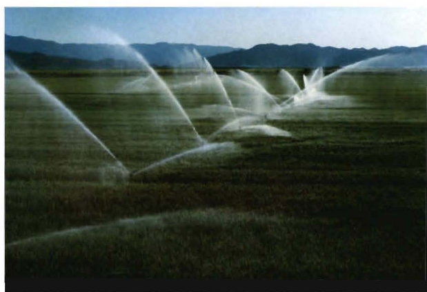
1980年，兵团农九师进行半固定式管道喷灌试验