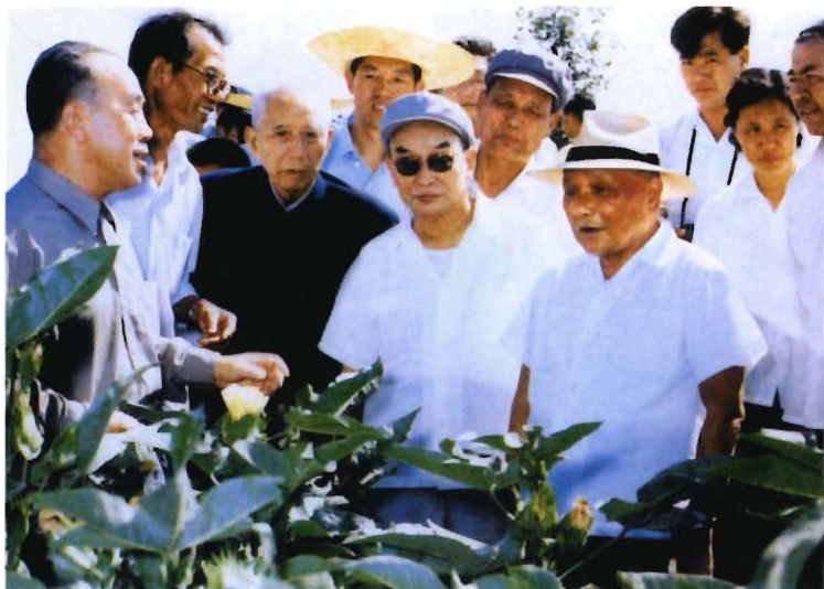
1981年8月,中央军委主席邓小平(前右一)视察农八师石河子垦区棉花生产情况