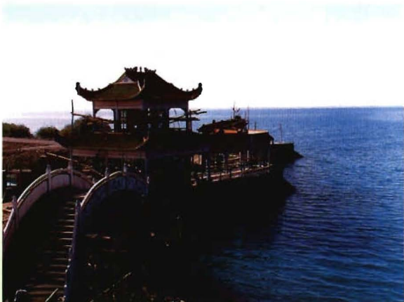
至2005年，兵团共有水库114座，库容31.5亿立方米。图为经1983年第二次扩建竣工的小海子水库，库容5亿立方米