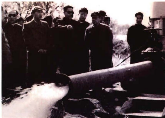
1965年，贺龙副总理视察农六师大口径自流井