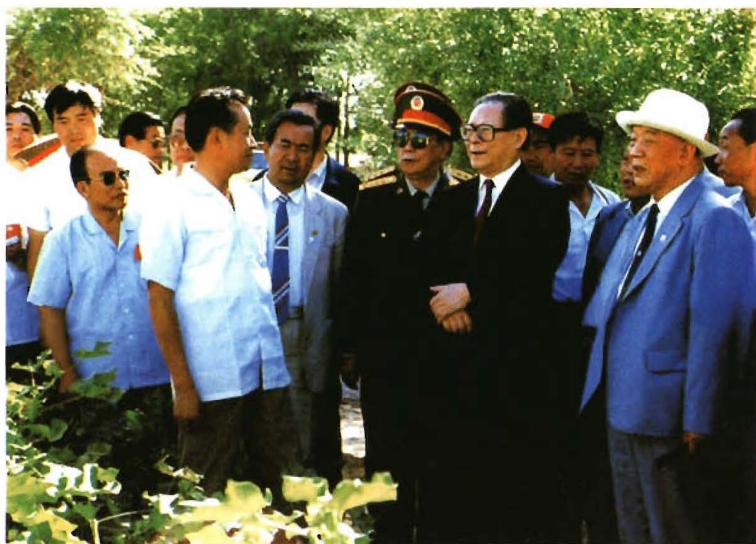
1990年8月,中共中央总书记江泽民(前右二)视察农八师农业生产情况