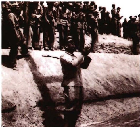
1951年5月15日，二军六师在库尔勒修建的十八团渠竣工，举行放水典礼，新疆军区代司令员王震跳进水渠中鼓掌庆贺