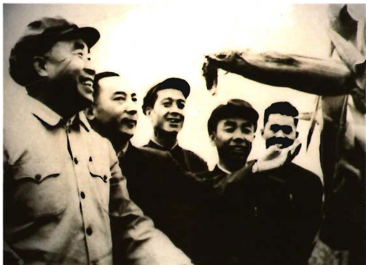
1960年3月,农垦部部长王震(前左二)与农一师塔里木垦区开荒工地职工亲切交谈