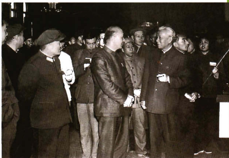
1965年10月，刘少奇主席(前右一)在新疆视察期间观看新疆军区生产建设兵团成就展