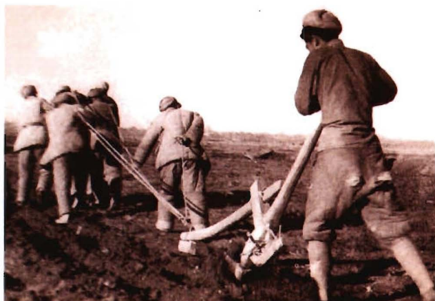
1950年初春,二军教导团在疏勒县草湖荒野上开荒造田