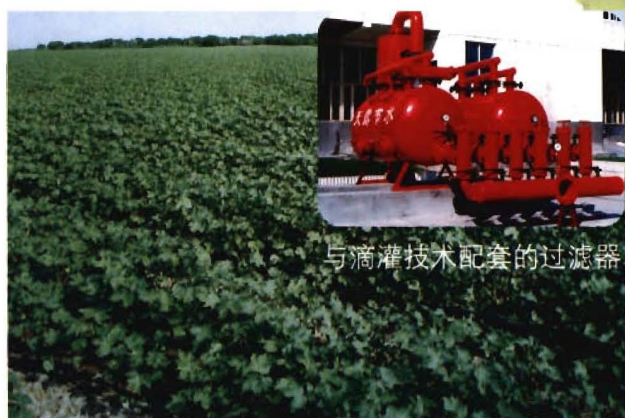
与滴灌技术配套的过滤器