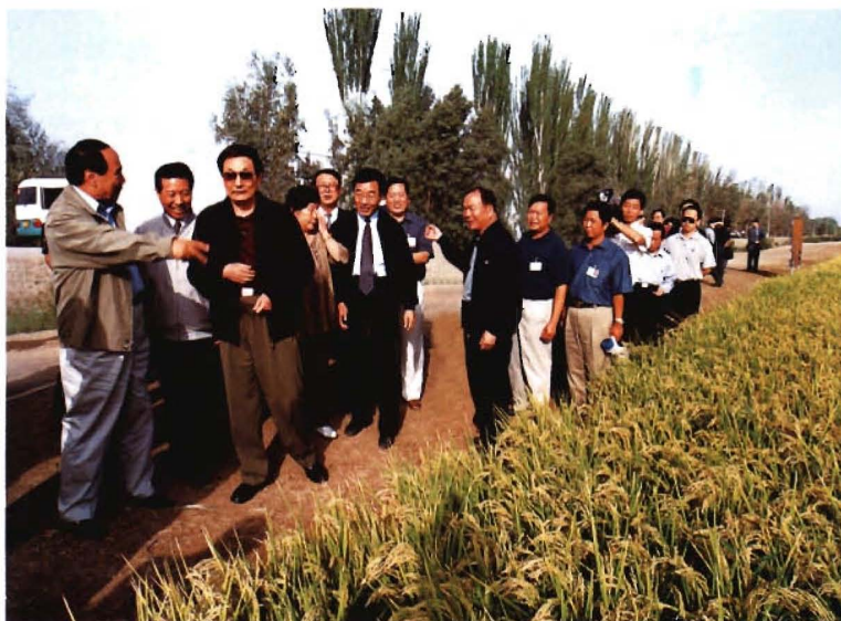
2000年9月,朱镕基总理(左三)视察农一师水稻种植情况(左八为自治区党委书记王乐泉、左二为时任兵团政委陈德敏、左六为时任兵团司令员张庆黎)