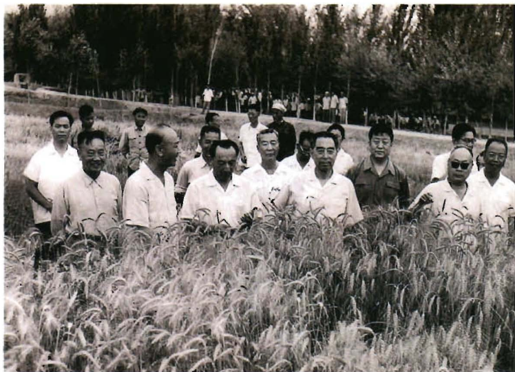
1965年7月，周恩来总理(前右二)、陈毅副总理(前右一)视察农八师石河子垦区