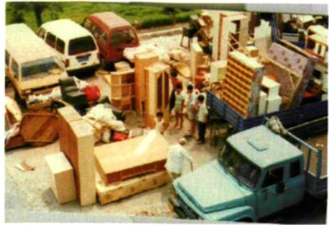
荆江分洪区群众为荆江分洪作准备。图为转移现场。