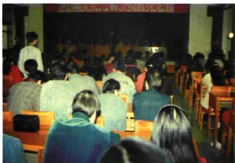
1996年10月，财政局组织“弘扬公安精神，树立财政形象”演讲会。