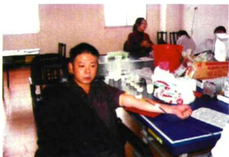
财政干部积极参加义务献血活动。