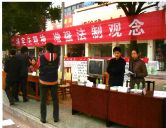
图为财政局干部 在街头开展财政法 律法规宣传活动。