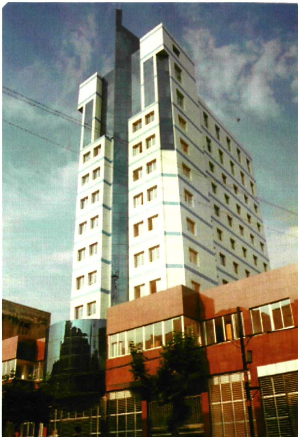
财政局办公大楼坐落在斗湖堤镇五九路10号。大楼建于1999年5月，建筑面积5000平方米。