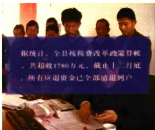
2003年,全县按税费改革后的政策算账，将超收的1780万元税费资金全部退给农户。图为退款现场。