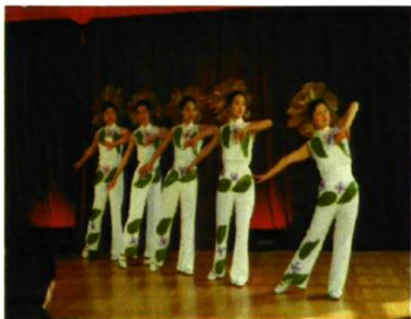
图为财政干部开展的业余文娱活动场景。