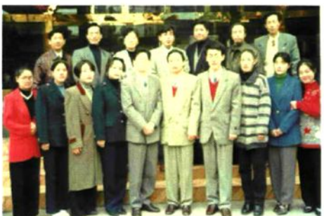
演讲会评选出十位优秀选手。图为优秀选手与县政府及财政局领导合影。