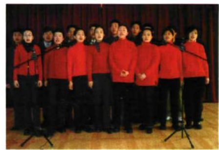
财政局共青团员在迎新春文艺联欢会上合唱。