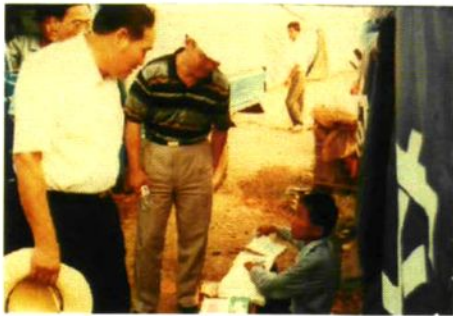
1998年，公安县遭受百年不遇的特大洪涝灾害。图为国家农垦局领导来本县视察灾情。