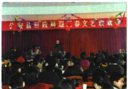
2001年12月，财政局迎新春文艺联欢会在财政办公大楼大会议室举行。