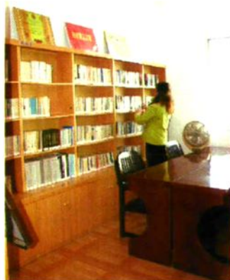
财政局工会图书室