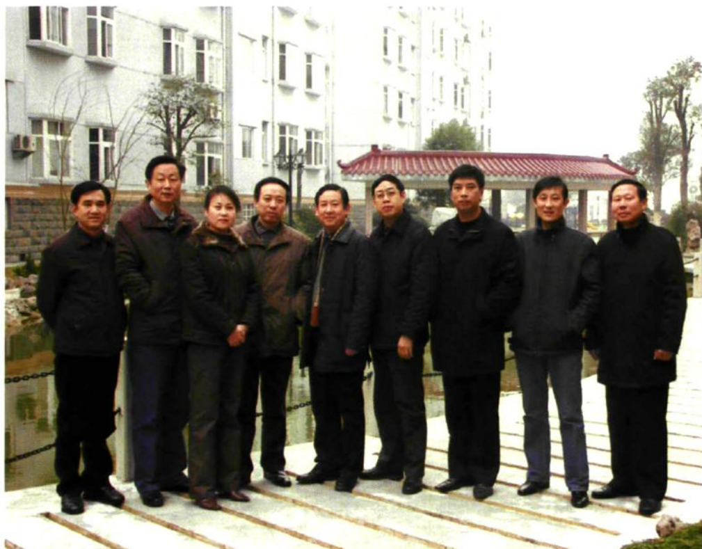
2005年底,财政局全体党委成员合影。