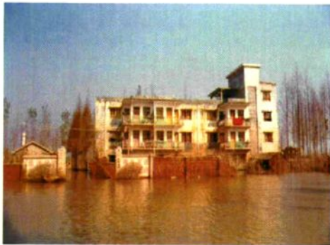
被洪水淹没的孟家溪镇财政管理所。