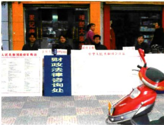
图为 财政局干 部在街头 开展财政 法律法规 咨询活动。