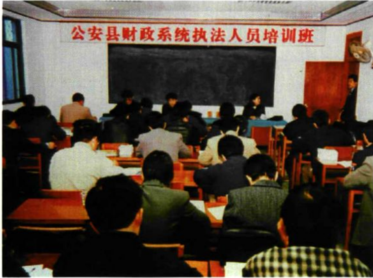
2001年10月，为提高财政执法人员的执法水平，财政局组织了财政系统执法培训班。图为参训人员在认真听老师讲课。