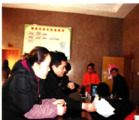
2004年2月，公安县国库集中收付中心成立。图为县国库集中收付中心服务大厅工作场景。