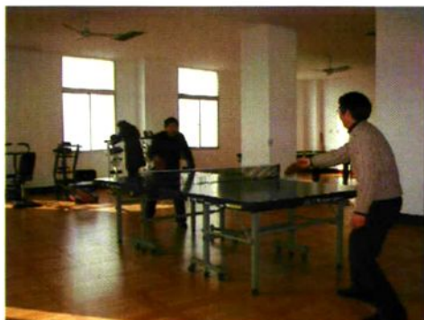
财政干部在财政局职工活动室开展业余体育活动。