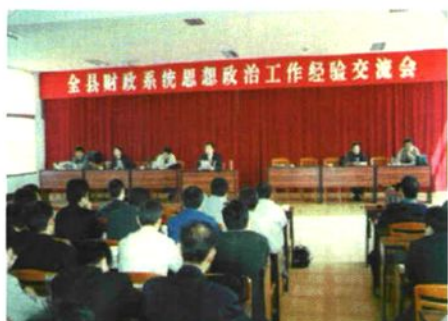
2001年10月，财政局召开财政系统思想政治工作经验交流会。