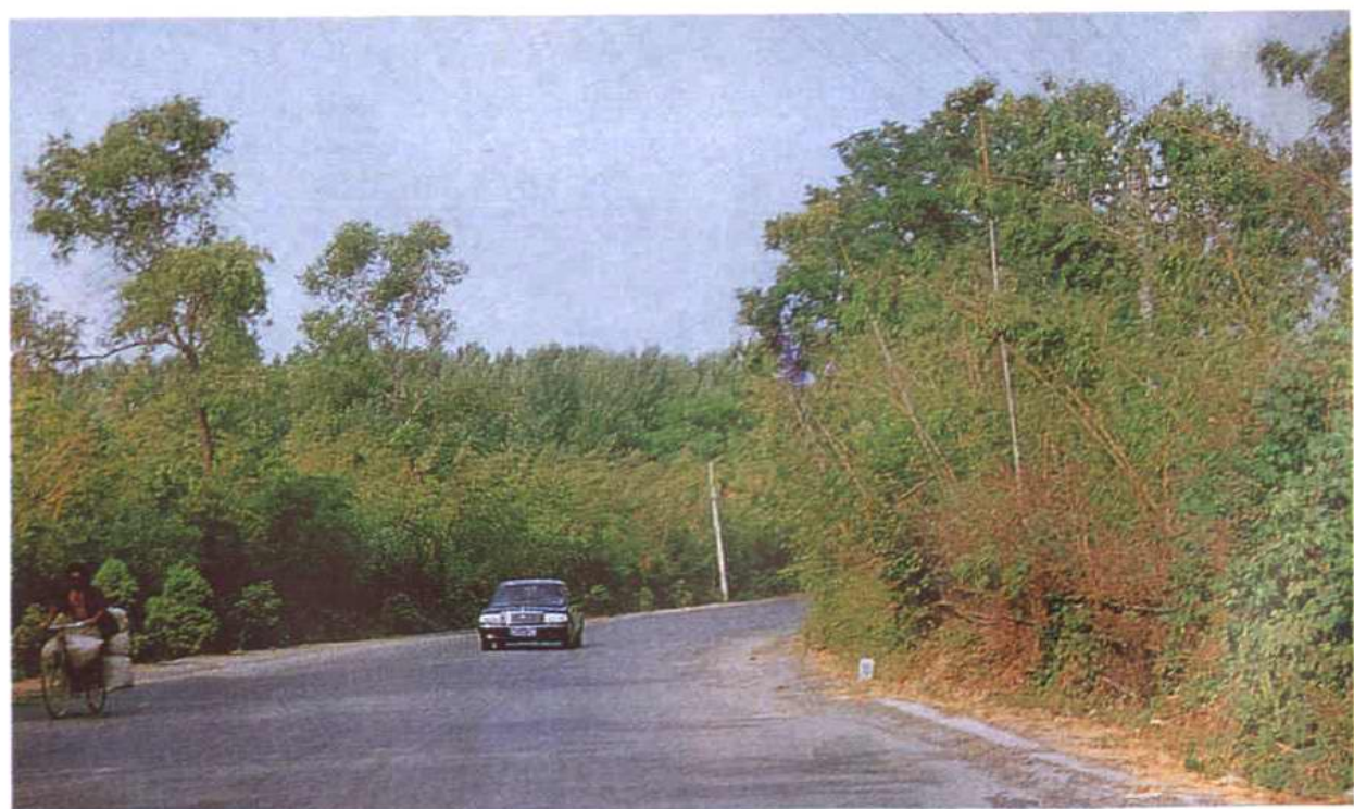
穿越竹林的新济公路