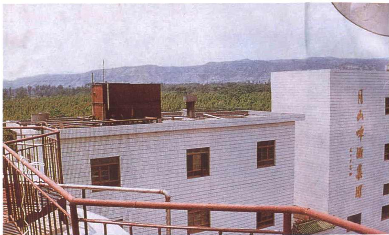
竹林深处的月山啤酒集团公司