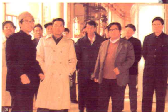
省长吴官正视察巧克力食品厂