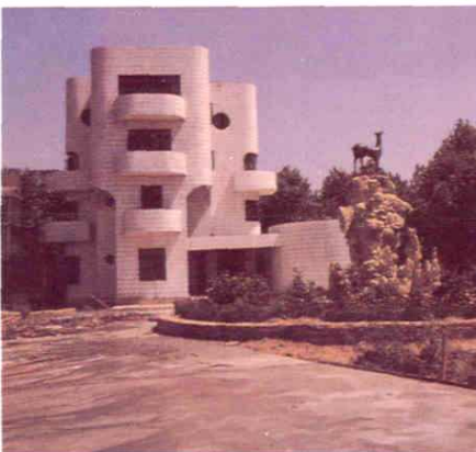
江西省先进企业红星乳品厂