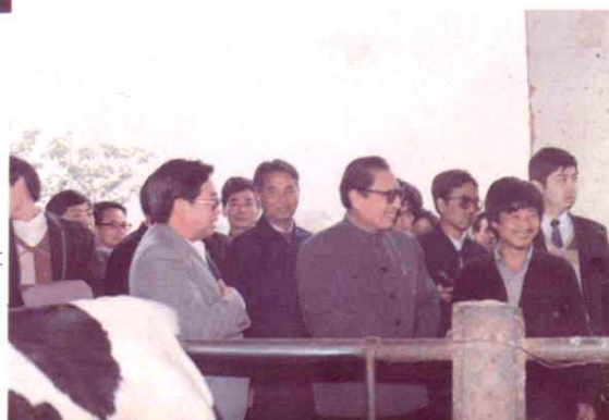
1990年3月19日中共中央一政治局常委乔石同志来红星视察，并同养牛专业户亲切交谈。