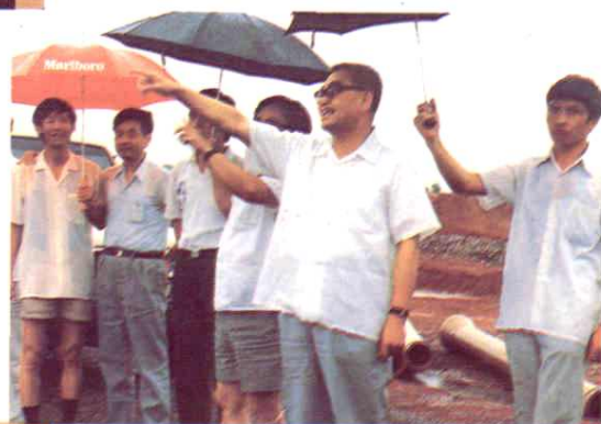
省委书记毛致用视察红壤开发项目