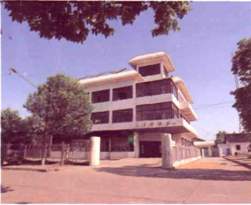
国家二级企业红星机械厂