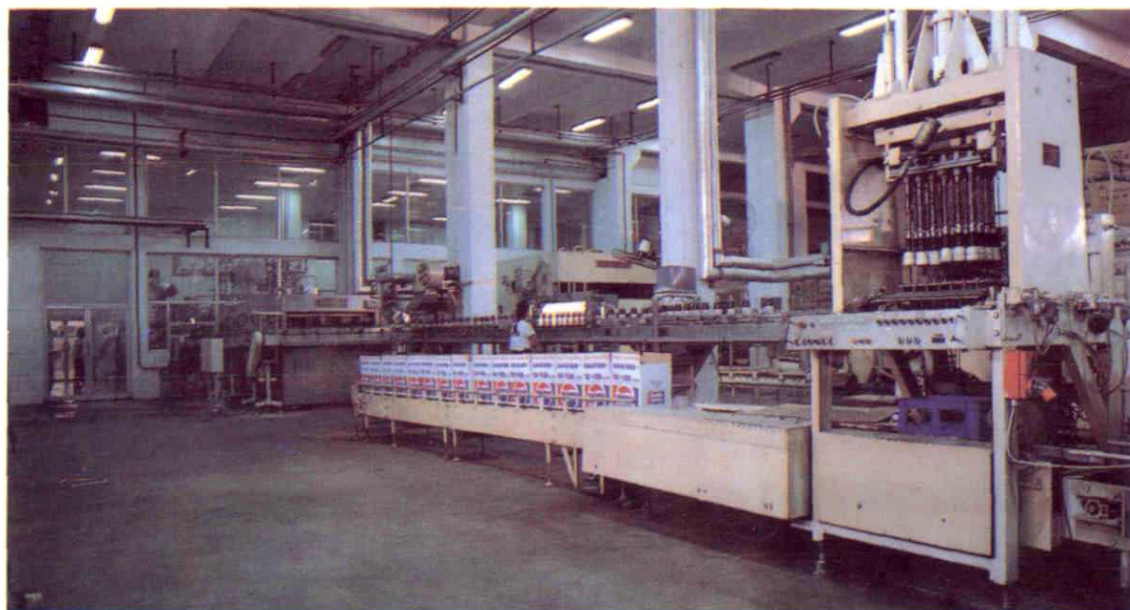
中美合作南昌百事可乐饮料有限公司