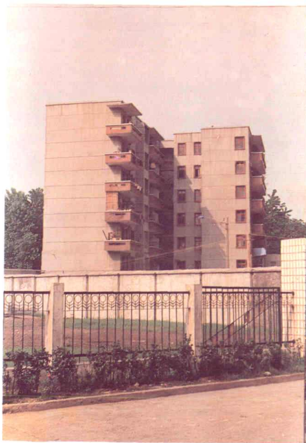
红星驻南昌办事处