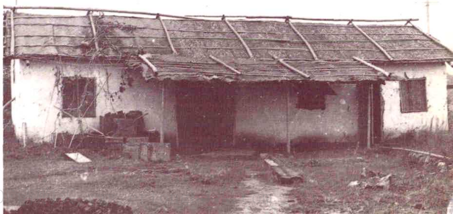
红星建设初期创业者们的宿舍