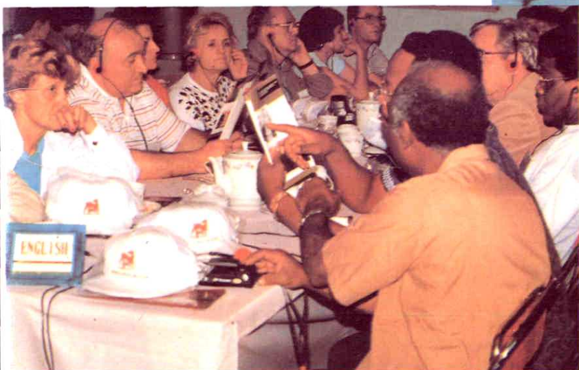
1988年6月66国驻华大使参观红星