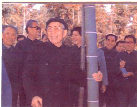
1985年12月5日王震同志第四次来红星在他亲手栽种的竹林里摄影留念。