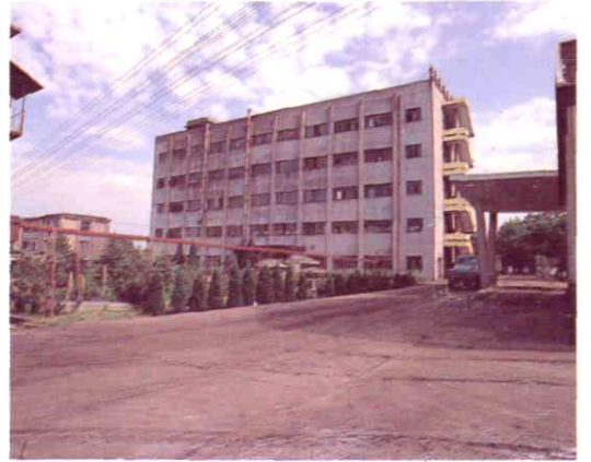
江西省先进企业红星葡萄糖厂