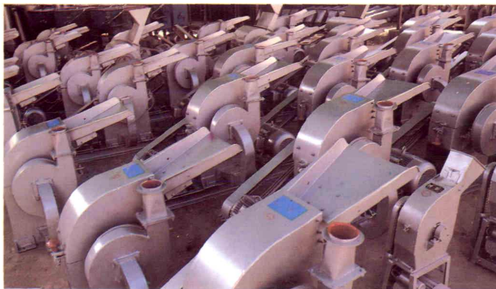
红星牌系列饲料粉碎机