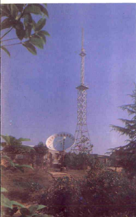
红星电视台卫星地面接收站