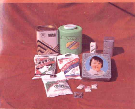
红苟牌葡萄糖等药品系列产品