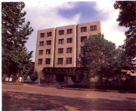
中国农业银行抚州地区支行红星办事处