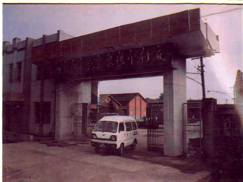
红星包装装璜印刷厂