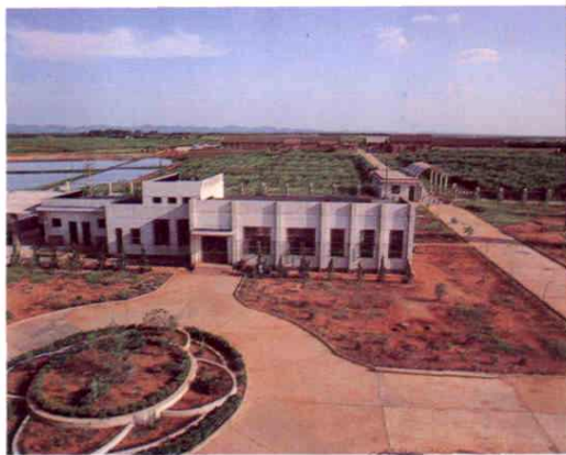
红星牧业公司万头工厂化种猪场