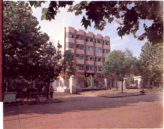
中国银行抚州地区支行红星办事处