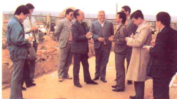
国家农业部部长何康莅临红星同养牛专业户交谈