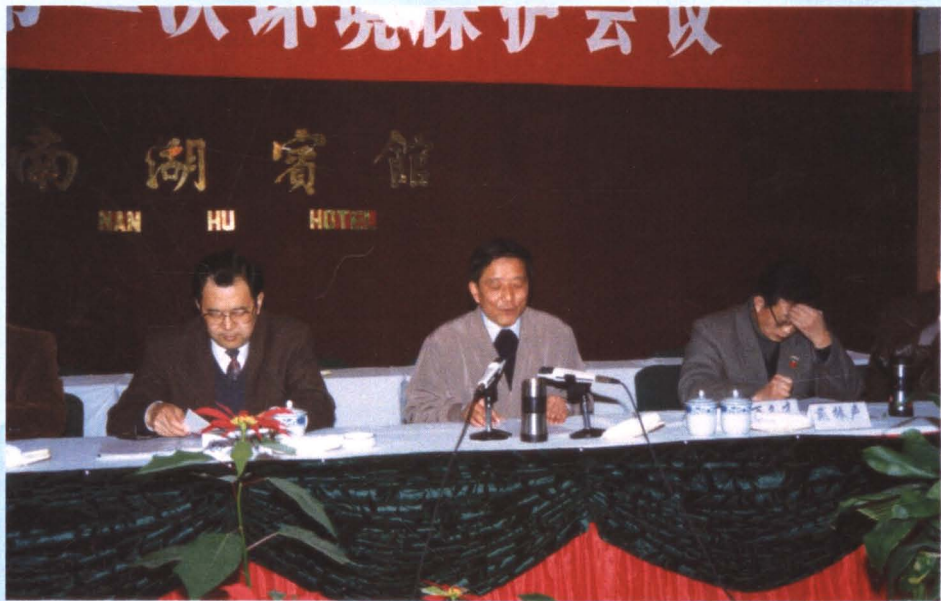
宜昌市委书记孙志刚等领导出席环境保护会议