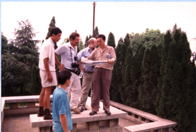
世界银行官员考察我市生态环境质量。