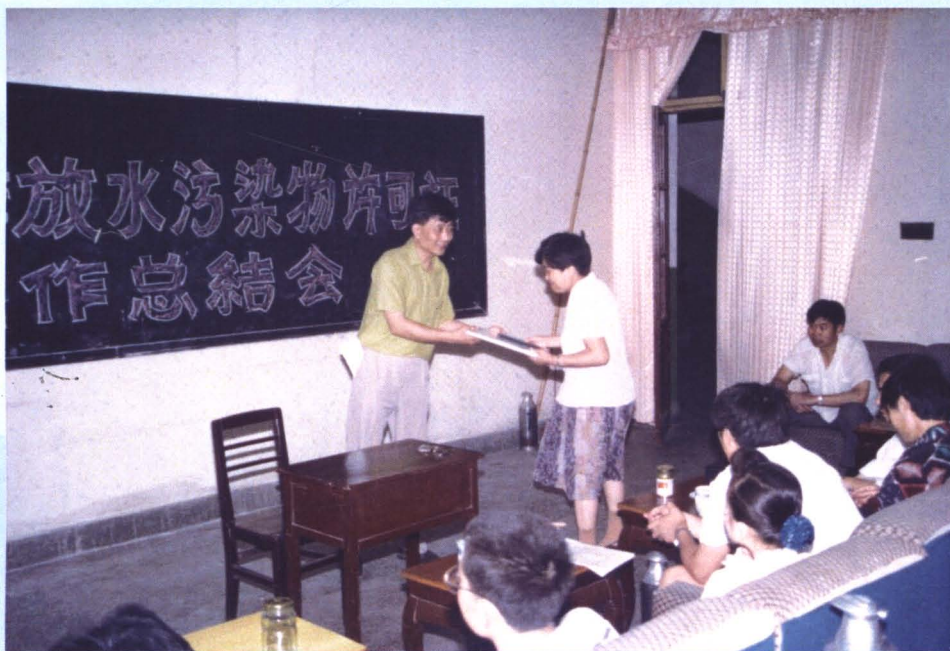
市环保局局长孙维全为市属企业颁发排放污染物许可证（1995年）