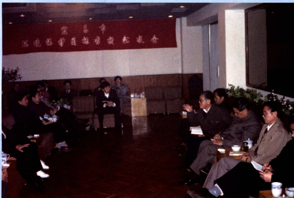
省环保局环保目标考核检查团在三峡宾馆 听取宜昌市环保工作汇报（1993年）