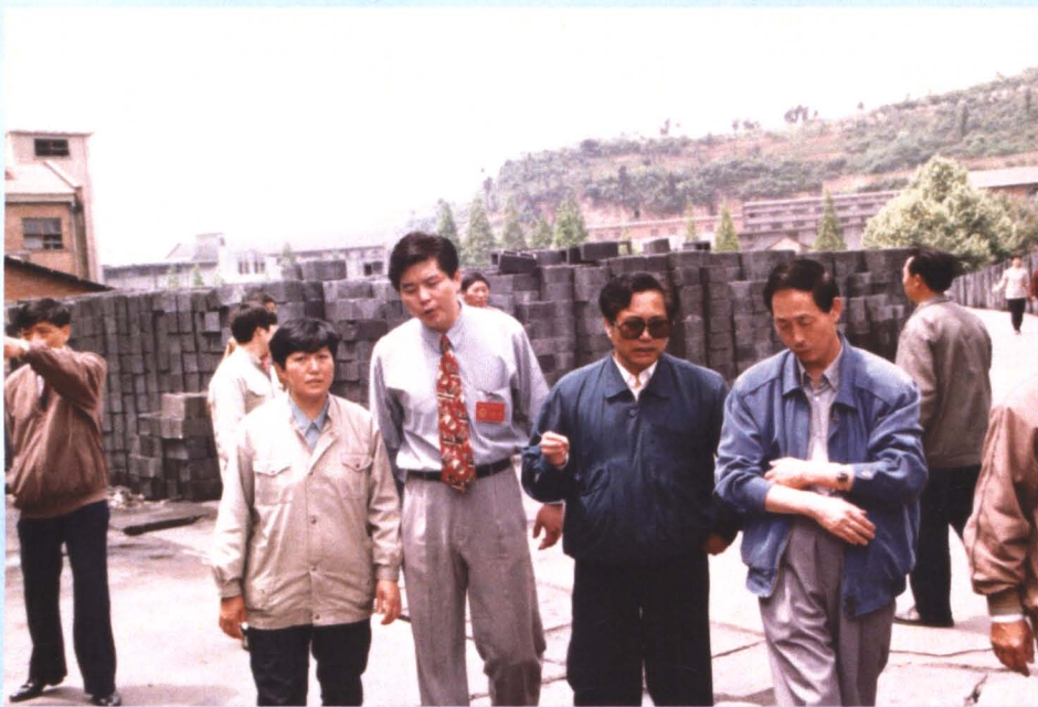
省市环保部门检查企业固体废渣综合利用情况。