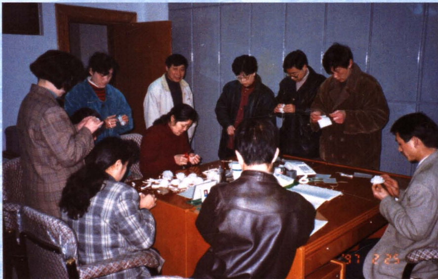
市环保系统沉痛悼念老一辈革命家邓小平同志逝世（1997年）