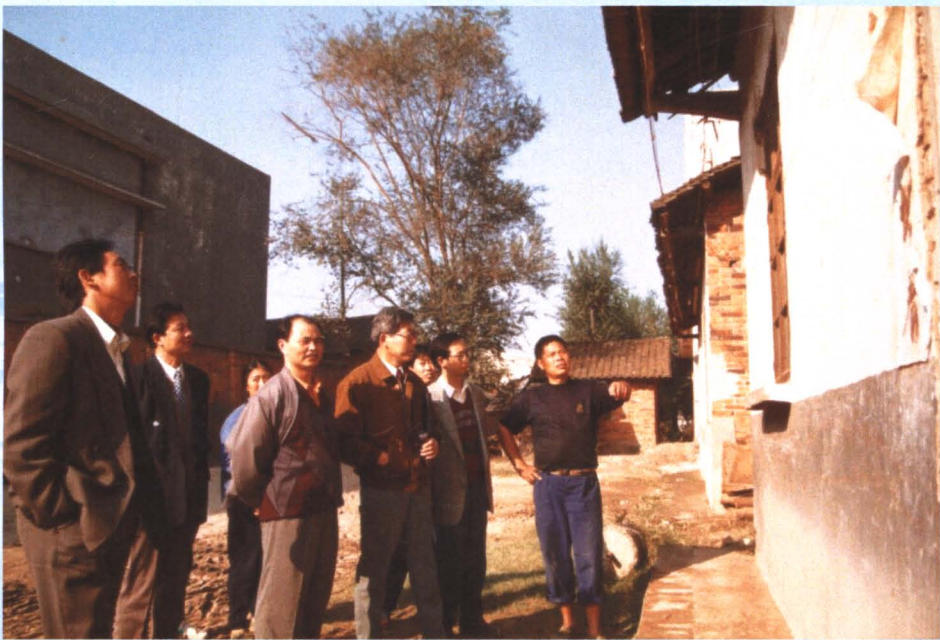
市环保局工作人员深入当阳调查居民环境投诉，处理环境纠纷。