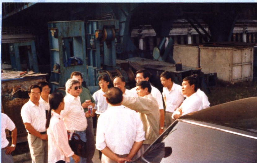
世界银行官员考察我市利用世界银行贷款企业环保项目。