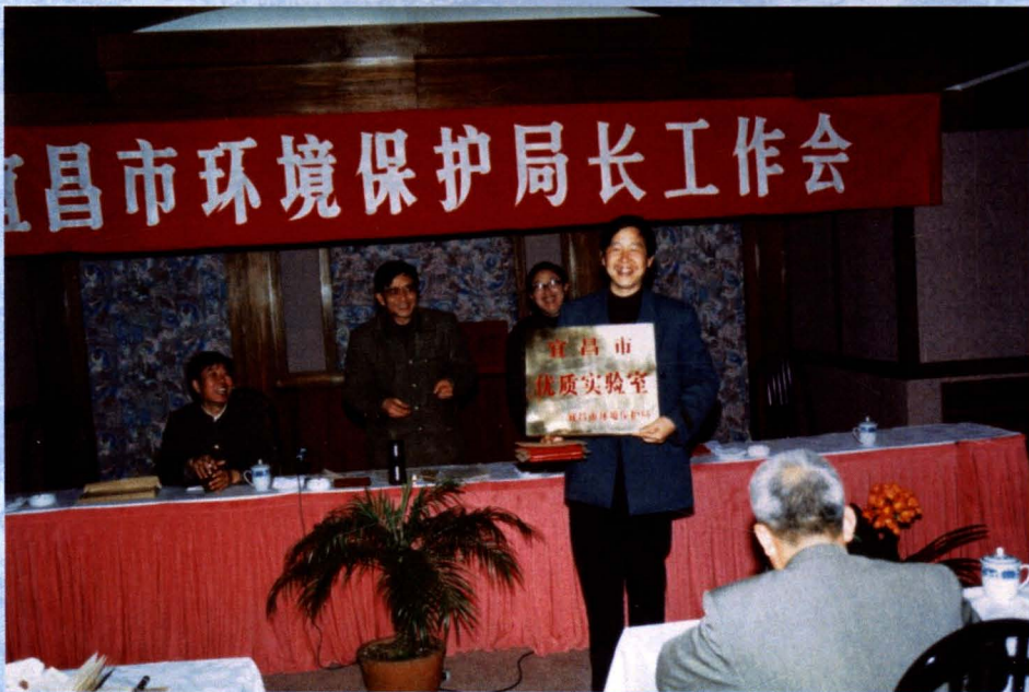
市环保局领导为优质实验室授牌