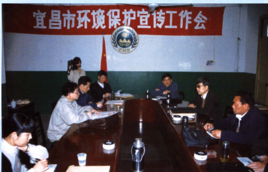
全市环保宣传工作会议，部署全年环保宣传工作。