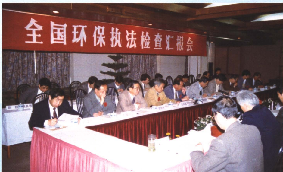
全国环保执行检查团在三峡宾馆听取宜昌市政府汇报执行《国务院关于加强环境保护若干问题的决定》的情况。