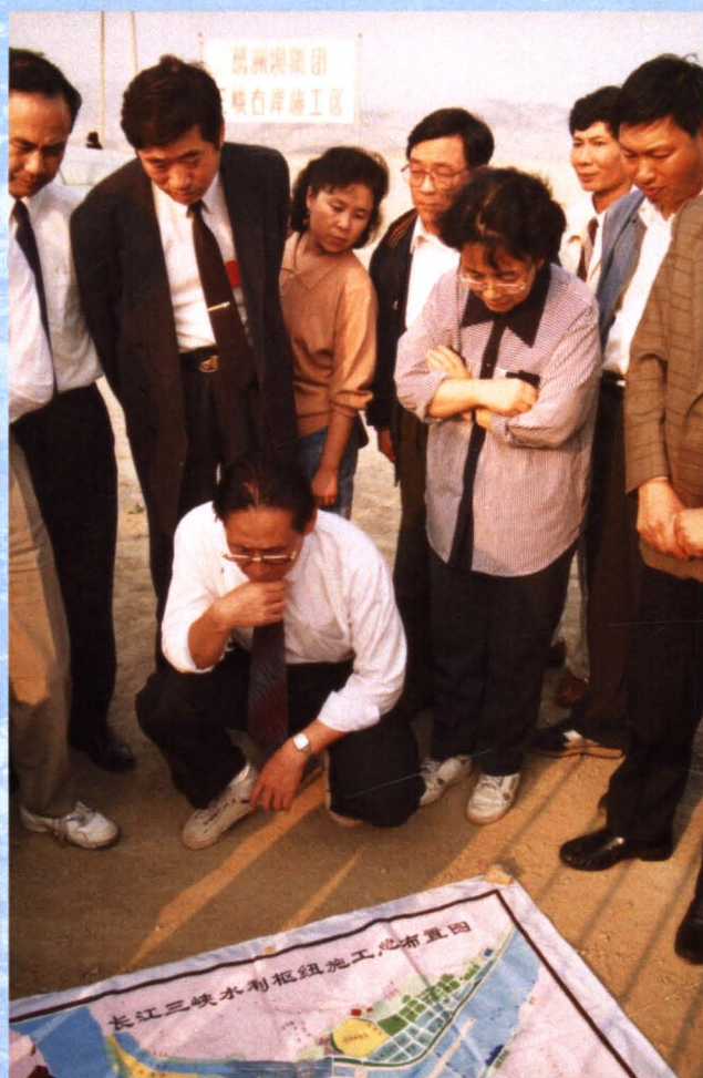
国家广电部副局长刘习良、国务院参事邓引引率国家环保执法检查团视察三峡工程环保工作