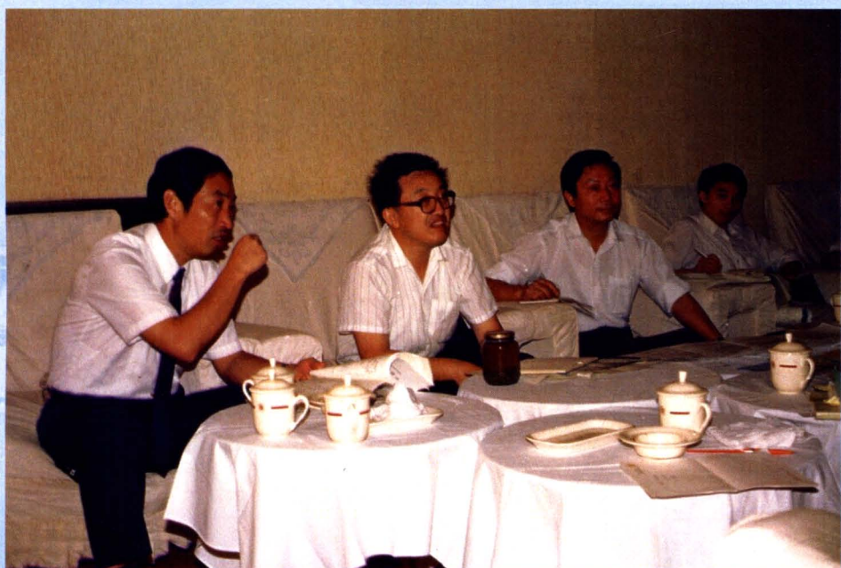
市政府副市长萧道根（左一）与有关部门 负责人及专家讨论研究全市环保规划。