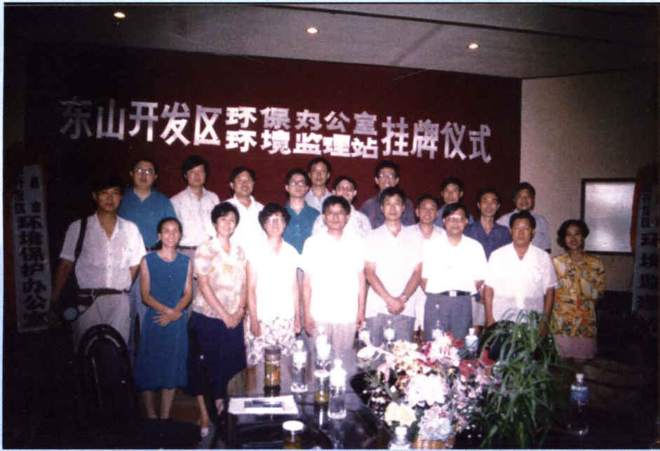
东山开发区（宜昌开发区前身）环保办公室环境监理站挂牌成立（1994年）。