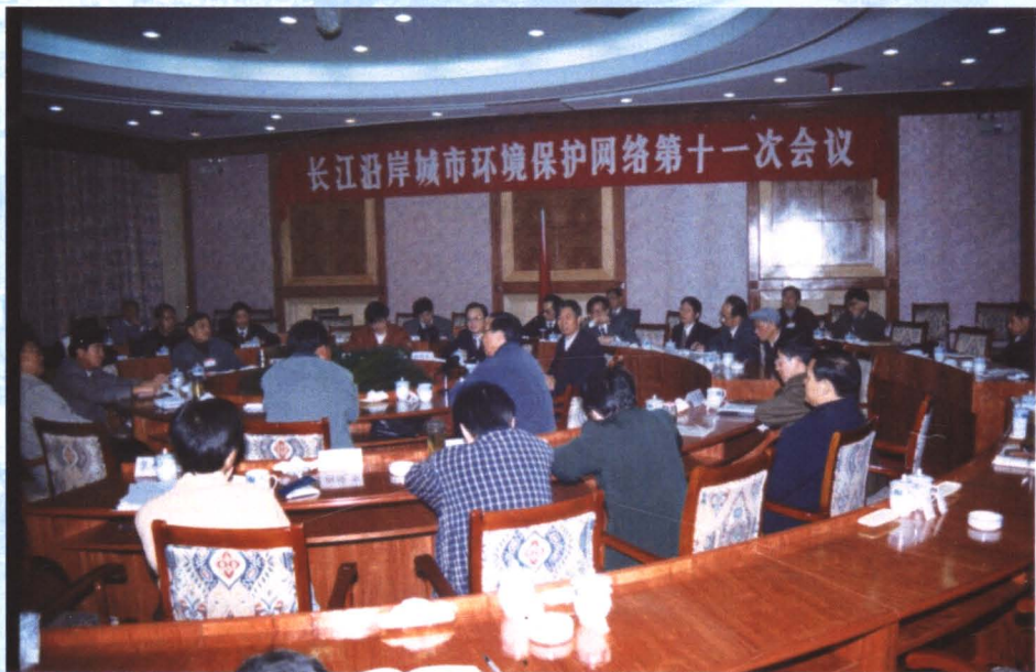
长江沿岸城市环保网络会议在我市召开