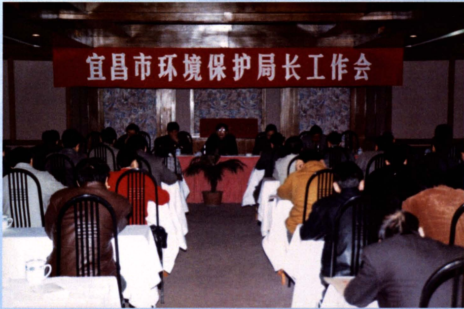
一年一度环保局长工作会，部署全年环保工作