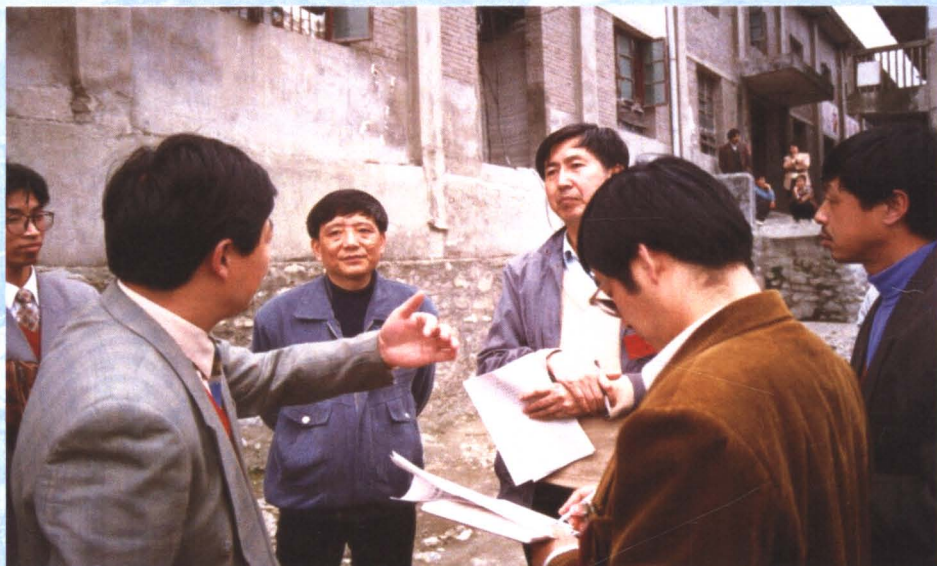
国家环保执法检查团在茅坪河流域检查造纸企业污染整治情况（1997年）