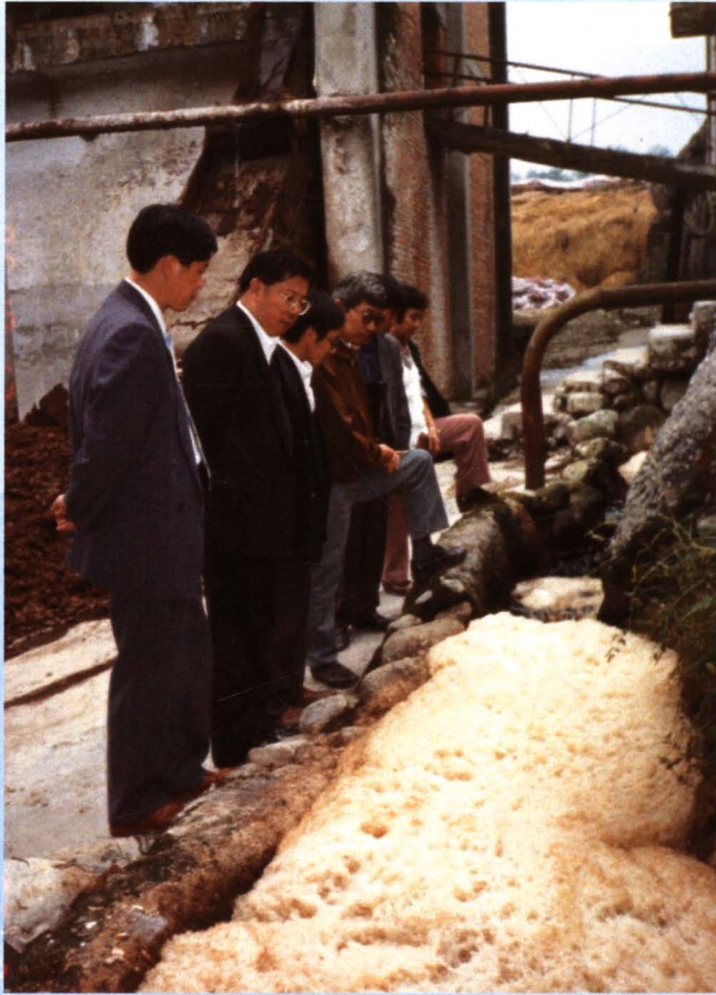
环保执法人员严查造纸企业违法排污行为。