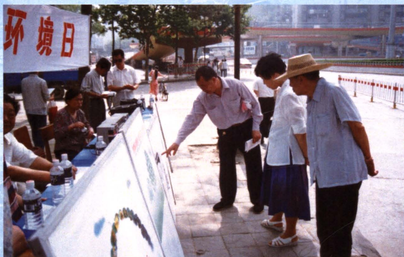
“六·五”世界环境日，环保工作者在街头向市民宣传环保。