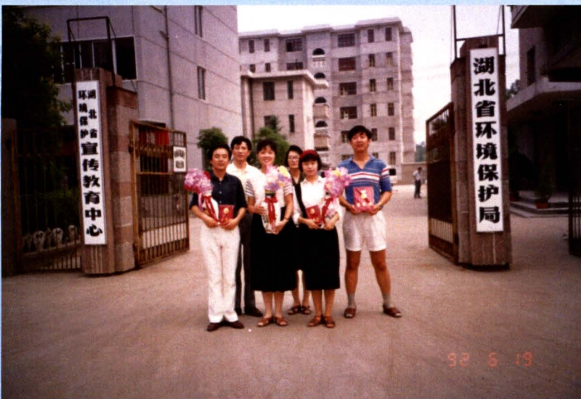
我市参加全省环境保护演讲比赛，荣获组织奖（1992年）