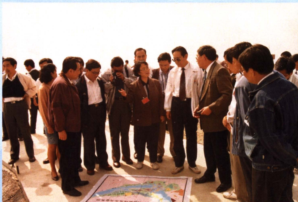
国家广电部副局长刘习良、国务院参事邓引引率国家环保执法检查团视察三峡工程环保工作