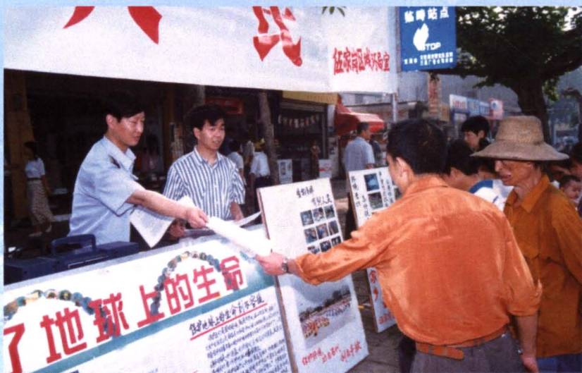
“六·五”世界环境日，环保局工作者走上街头宣传环保。