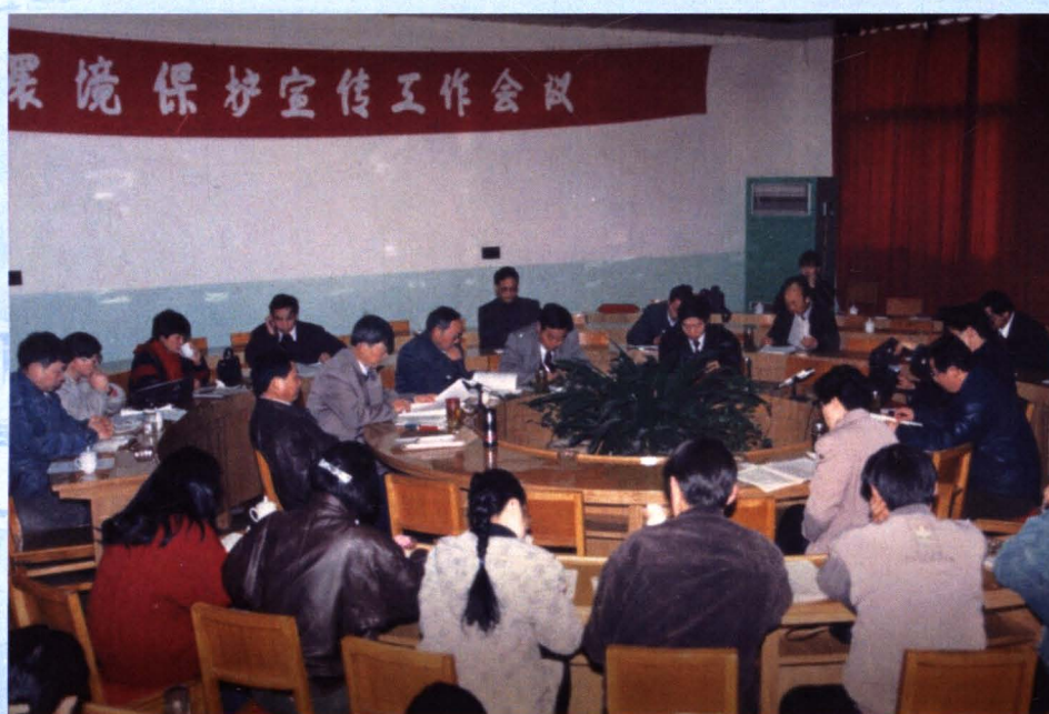
全市环保宣传工作会议，部署全市环保宣传工作