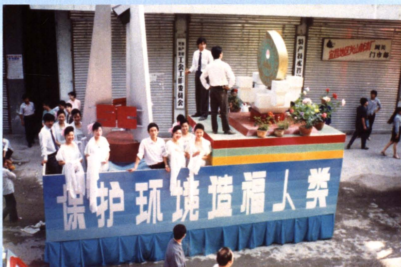
“六·五”世界环境日宣传彩车