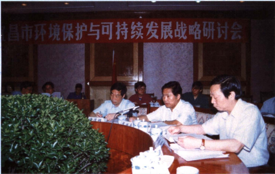
市政府及有关部门研讨可持续发展战略。